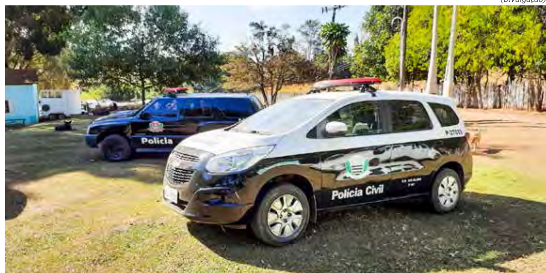
A Polícia Civil resgatou em julho de 2021 sete pessoas em regime de trabalho escravo em um sítio de Rio Claro

Um trabalho conjunto realizado pelo Ministério Público do Estado de São Paulo, Polícia Civil, Centro de Referência em Saúde do Trabalhador, Vigilância Sanitária e Ministério Público do Trabalho, provocado por denúncias