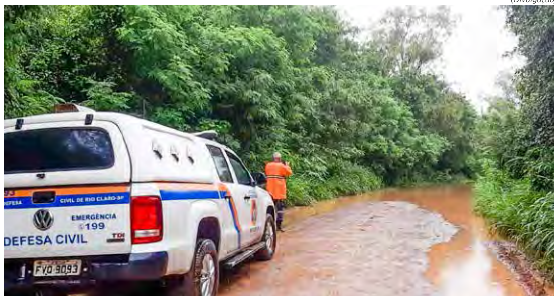
A Estrada Velha de Brotas em Rio Claro ficou interditada devido ao transbordamento do Rio Corumbataí

Em caso de emergências a Defesa Civil deve ser acionada pelo telefone 199 ou o Corpo de Bombeiros, pelo 193