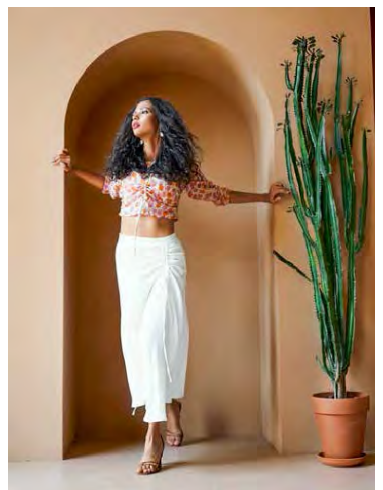
Áreas externas ou terraços, ficam perfeitos com paredes terracota, muitas plantas e móveis modernos