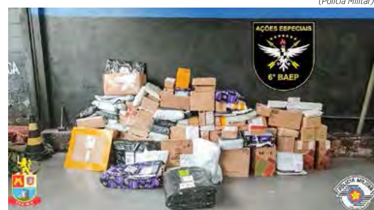
Foram encontradas 105 encomendas dos Correios, além de duas motocicletas e duas placas produtos de roubo

Quanto à vítima, os criminosos disseram que haviam