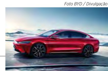
BYD HAN EV