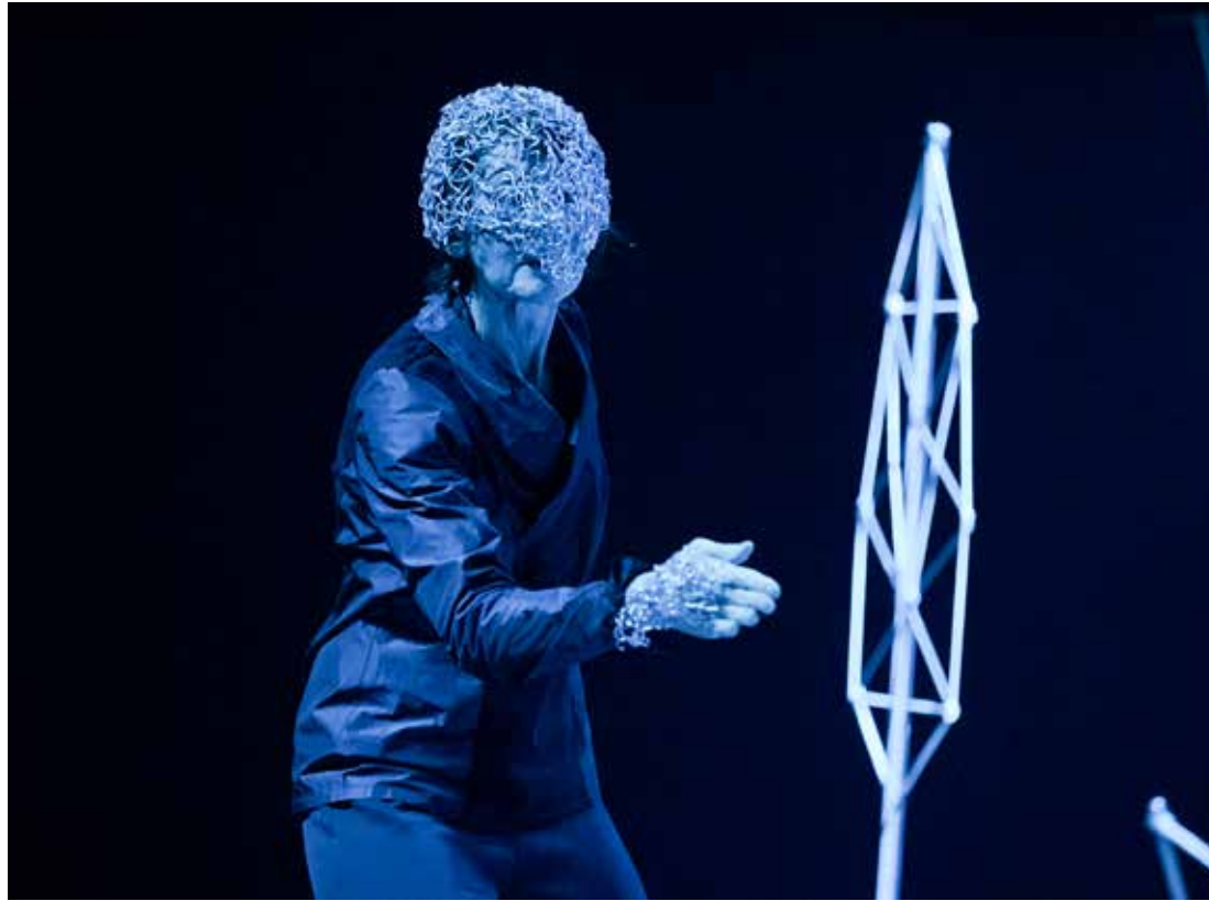
Cena da peça "Na Anatomia Oca dos Pássaros"