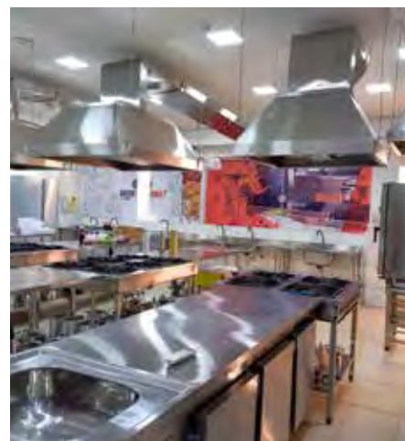
Laboratórios preparados e de última geração para os cursos de Gastronomia