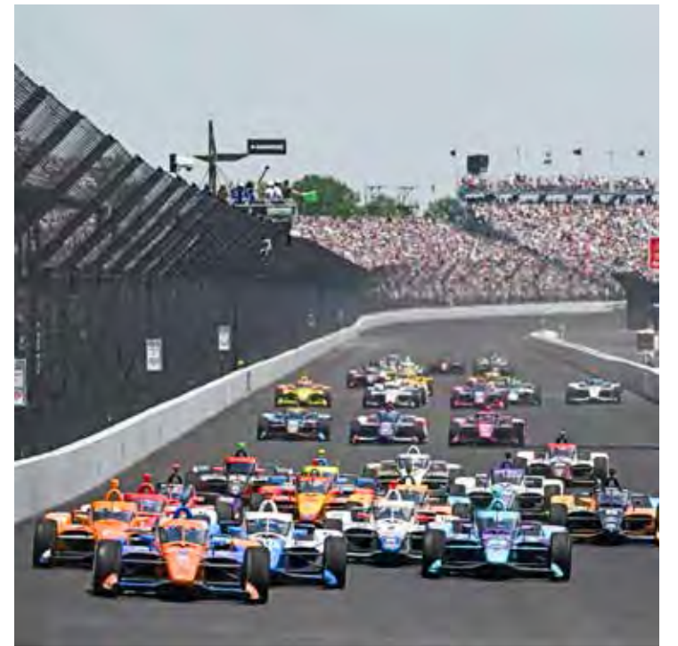
Detroit recebe Fórmula Indy neste domingo