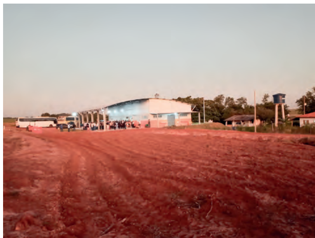
Fazenda da Unifatecie, atende curso de agronomia e outros