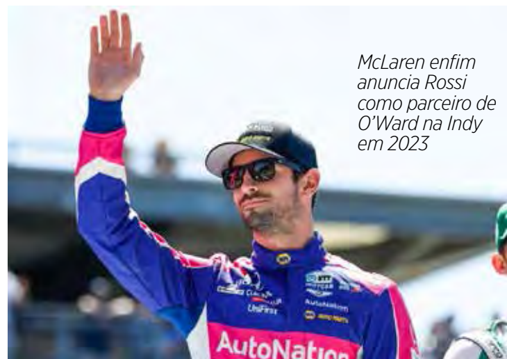
McLaren enfim anuncia Rossi como parceiro de O'Ward na Indy em 2023