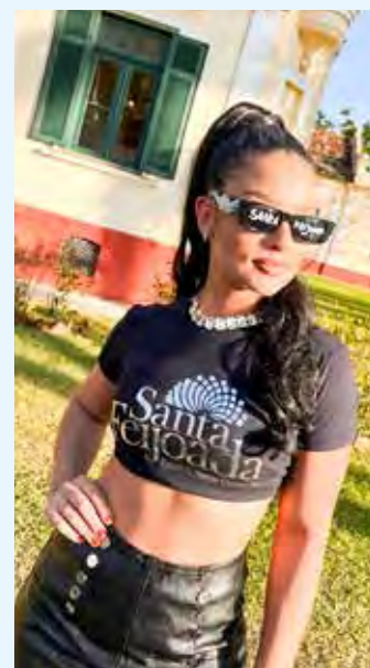
Camiseta oficial foi lançada e está diferenciada

A grande expectativa era para saber sobre a camiseta comemorativa que foi lançada nesta semana. Nesta edição, os organizadores decidiram inovar e surpreender. Chega com cara nova. “Sempre tem essa expectativa para saber a cor da camiseta que, em todas as outras edições foi cru, com uma estampa colorida. Lançamos o filme oficial, apresentando a camiseta nova que é preta e prata. Mudamos por ser edição comemorativa e optamos por fazer diferente. A repercussão está muito boa, público está adorando”, comemoram os organizadores.