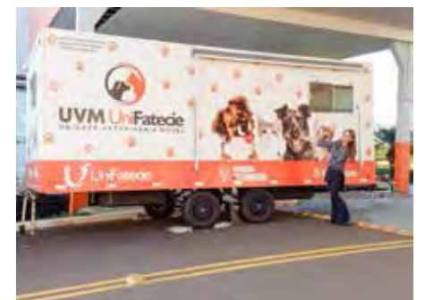
Curso EAD de Medicina Veterinária