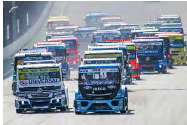
Em clima de festa, Copa Truck é atração no Autódromo Internacional Ayrton Senna