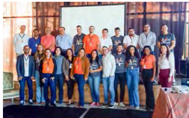
Líderes dos setores à frente do EAD