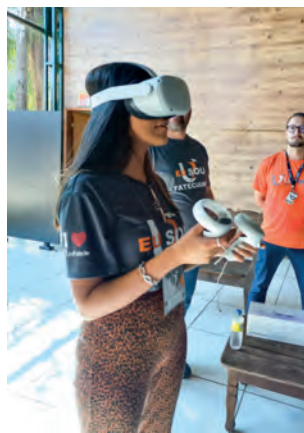
Óculos de realidade virtual, tecnologia disponível