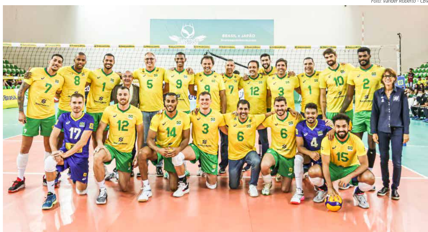
Seleção de 1992 e 2022

O uniforme da seleção brasileira fez menção ao campeão olímpico de 1992, que conquistaram à época, na Olimpíada de Barcelona, a primeira medalha