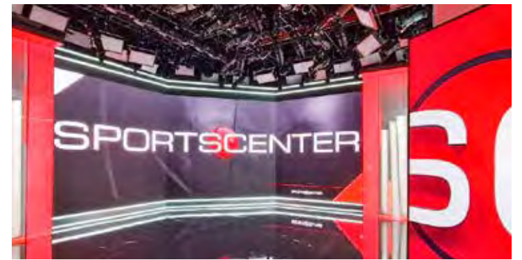
Cenário do "SportsCenter" na ESPN