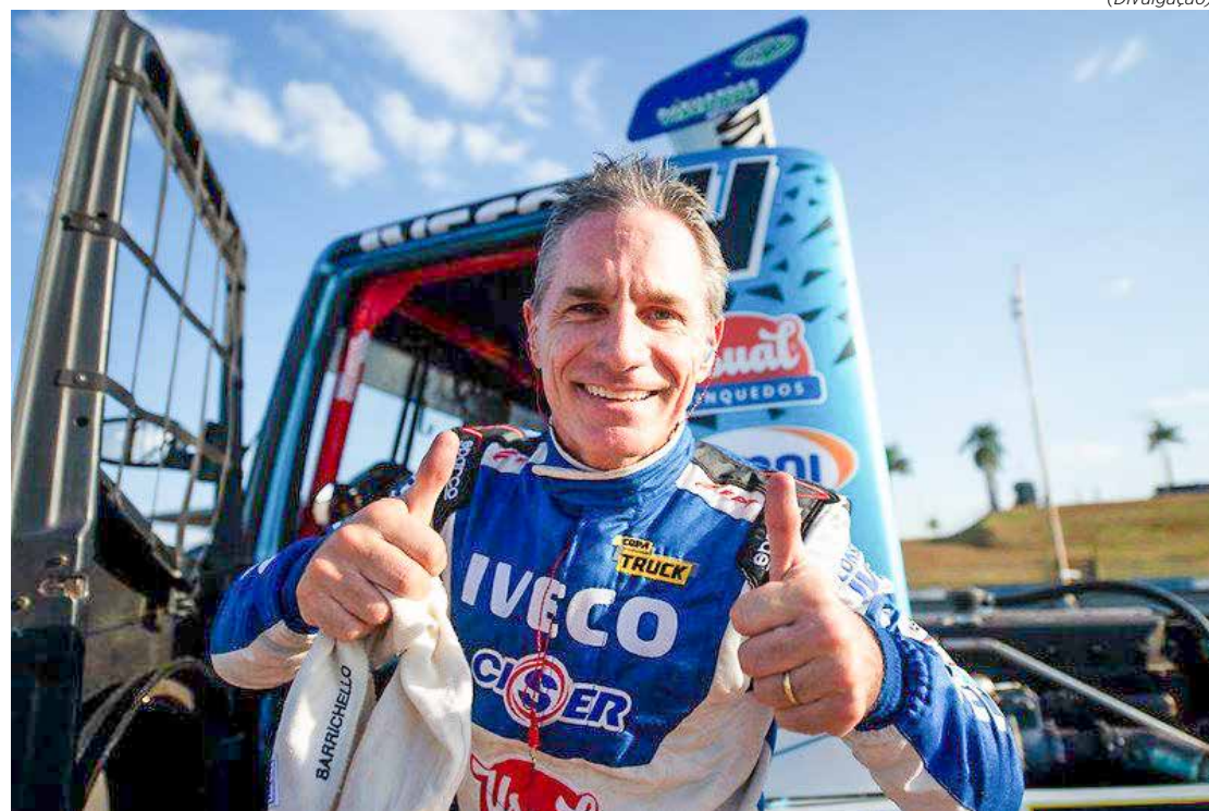
Felipe Giaffone liderou corrida 1 da Copa Truck de ponta a ponta em Goiânia

A próxima etapa da Copa Truck está marcada para os dias 9 e 10 de julho, em Londrina (PR).