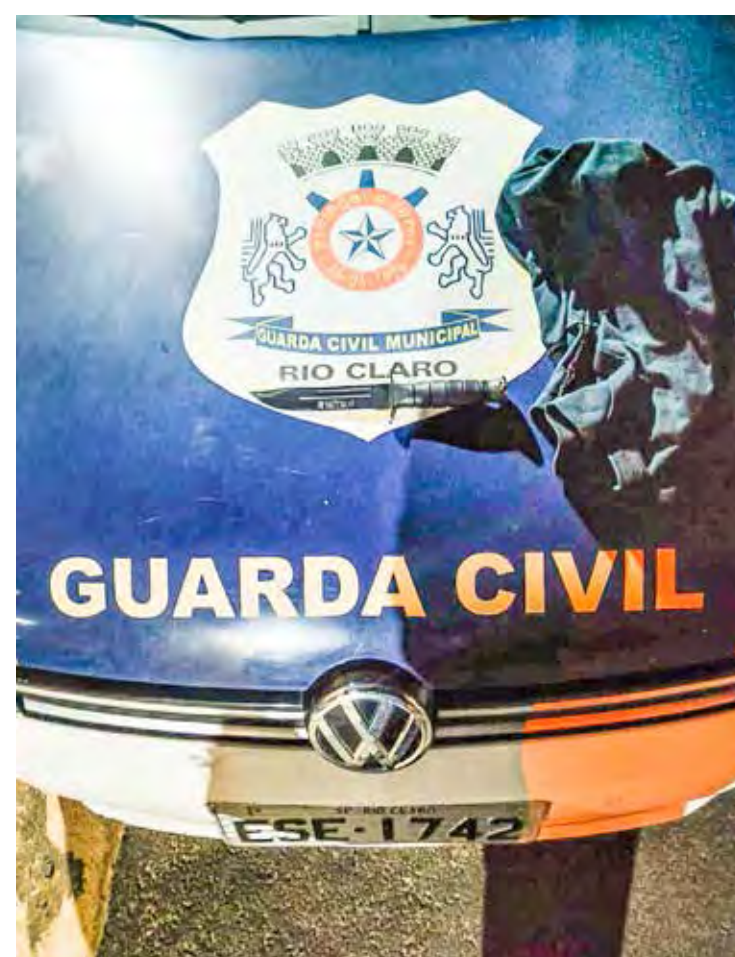
Equipe de perícia apreendeu uma faca na residência do autor

A vítima da lesão corporal foi orientada quanto ao prazo de seis meses para o oferecimento de representação criminal em face do investigado na Delegacia de Polícia da área do fato.