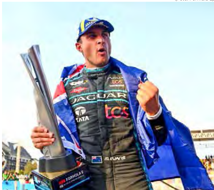
Mitch Evans venceu na primeira visita da Fórmula E à Indonésia