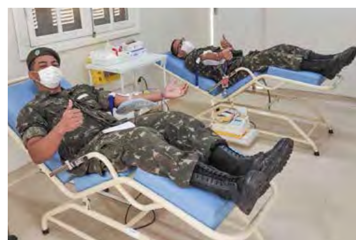
ar. "Nossos agradecimentos especiais ao Tiro De Guerra de Rio Claro pela colaboração expressiva na abertura da Campanha, Polícia Rodoviária de Rio Claro, 10° BAEP de Piracicaba e aos policiais militares do 37° BPM/I, destacou o comando do 37° BPM/I.

A abertura da campanha contou com profissionais que contribuíram com o gesto de do-