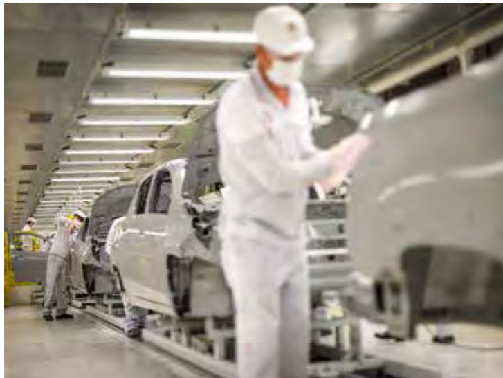
Fabrica Fiat Nova Strada