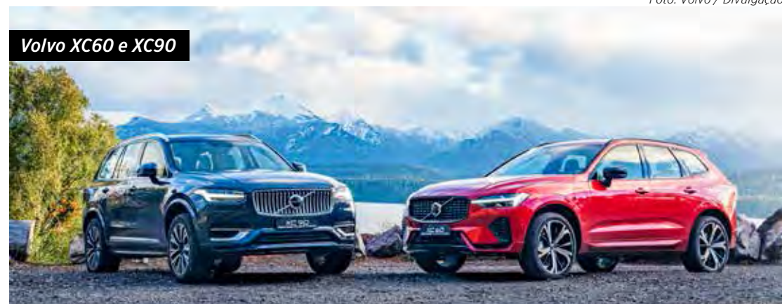
Volvo XC60 e XC90