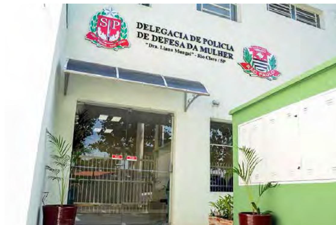
Rio Claro conta com a Delegacia de Defesa da Mulher para atendimento das ocorrências. Denúncias também podem ser feitas através do 180

Em Rio Claro, por exemplo, entre janeiro e abril de 2021 foram 20 casos de estupros, em 2020, no mesmo período foram 13, os dados de 2019 apresentam registro de 15 estupros entre janeiro e abril daquele ano. O que representa aumento no mu-