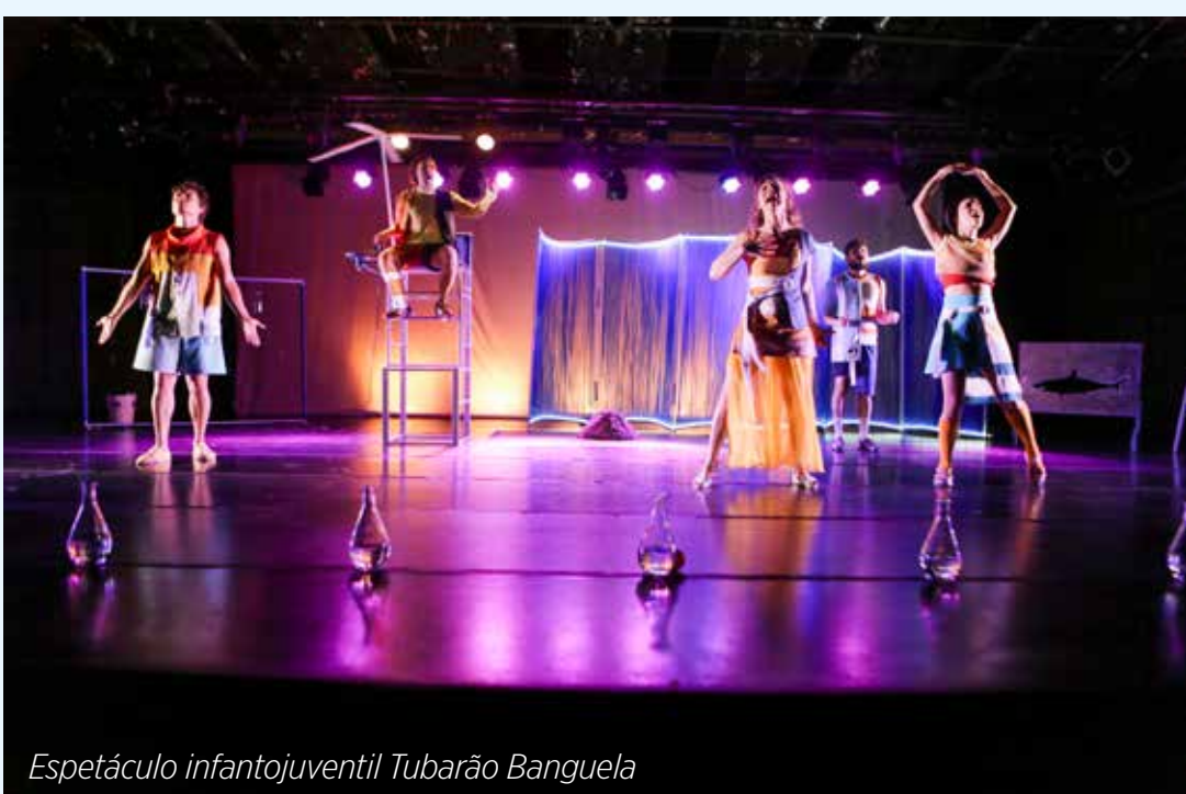
Espectáculo infantojuvenil Tubarão Banguela

O público pode reservar os ingressos com antecedência de forma gratuita pelo site do Meu Sesi - meusesi.sesisp.org.br , para mais informações contatar a equipe da secretaria única pelo telefone: 3522-5663.