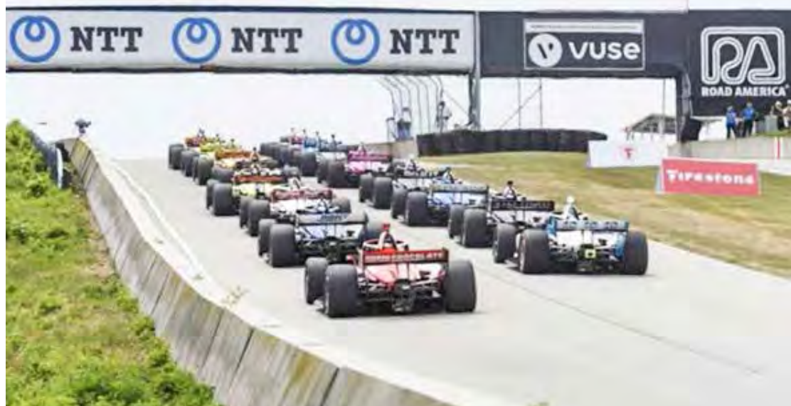
Indy realiza, sem descanso, a oitava etapa da temporada

Sem descanso e após a sensacional etapa nas ruas de Detroit (na despedida da categoria do circuito de Belle Isle), a Indy desembarca em Road America para a sua 8ª etapa em Elkhart Lake - Wisconsin.