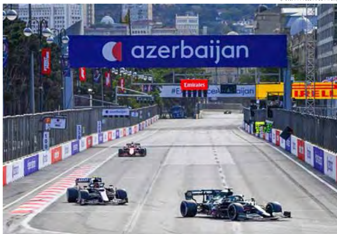
Principal categoria do automobilismo mundial desembarca em Baku para a oitava etapa da temporada