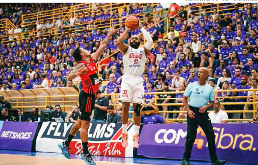
Franca é campeã do NBB