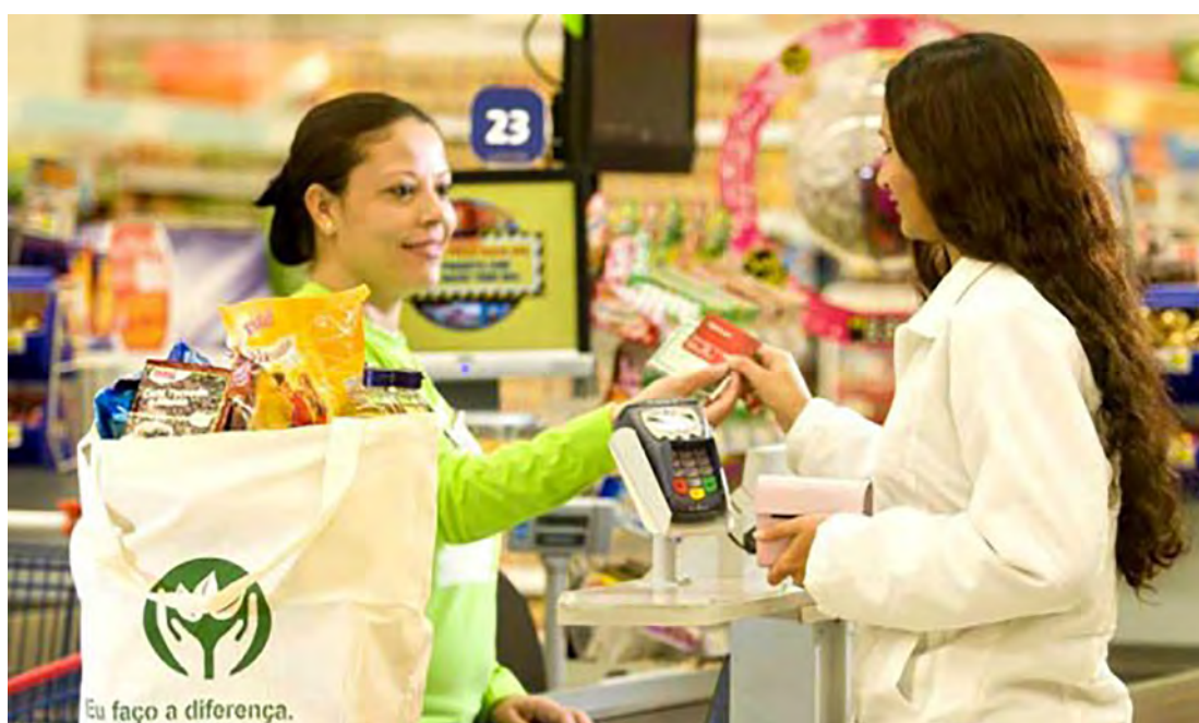
Utilização de Ecobags em Supermercados.

Como exemplo de práticas sustentáveis podemos citar uma região com muitas árvores, onde é utilizada as madeiras fazendo o corte seletivo e replantando outras árvores em reposição aquelas que foram cortadas. Um exemplo de práticas não sustentáveis é cortar as árvores sem qualquer cuidado,