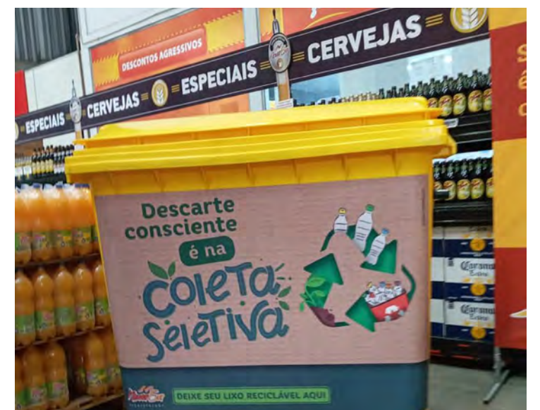
Coleta Seletiva em supermercados.

Os supermercados que promoverem ações sustentáveis com certeza irão promover a imagem de seu negócio e serão exemplos de que em todos os lugares pode-se promover ações para um mundo mais sustentável.