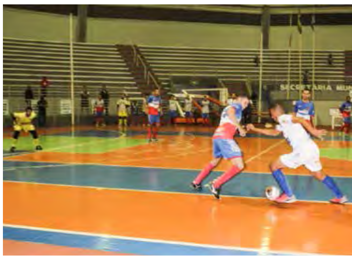
Lance do jogo Rio Claro 7x1 Porto Ferreira