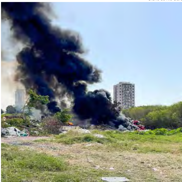
Diário do Rio Claro

Um novo incêndio foi registrado, no começo da tarde dessa quarta-feira (15), em um lugar já bem conhecido por este tipo de ocorrência, na antiga Cerâmica Wenzel. Uma enorme fumaça escura foi vista em diversos pontos da cidade. Equipes do Corpo de Bombeiros atuaram no local para conter as chamas que se alastraram. Página 5