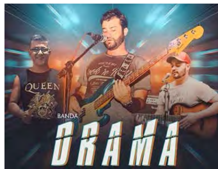
Banda Drama no Vila do Chopp

MADALENA MUSIC – No sábado (18), a partir das 23h tem