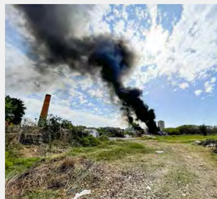
Mais uma vez o incêndio no local chamou a atenção em diversos pontos da cidade

O grande incêndio que consumiu tudo que funcionava no local ocorreu no dia 21 de abril deste ano. Na época, equipes do Corpo de Bombeiros trabalharam por horas para conter o fogo. Além de profissionais da Defesa Civil, Samu, Guarda Civil Municipal e Polícia Militar que atuaram no local. Os barracões que funcionavam no local foram destruídos e os trabalhadores ficaram sem condições de continuar com o trabalho. A área precisou ser interditada.