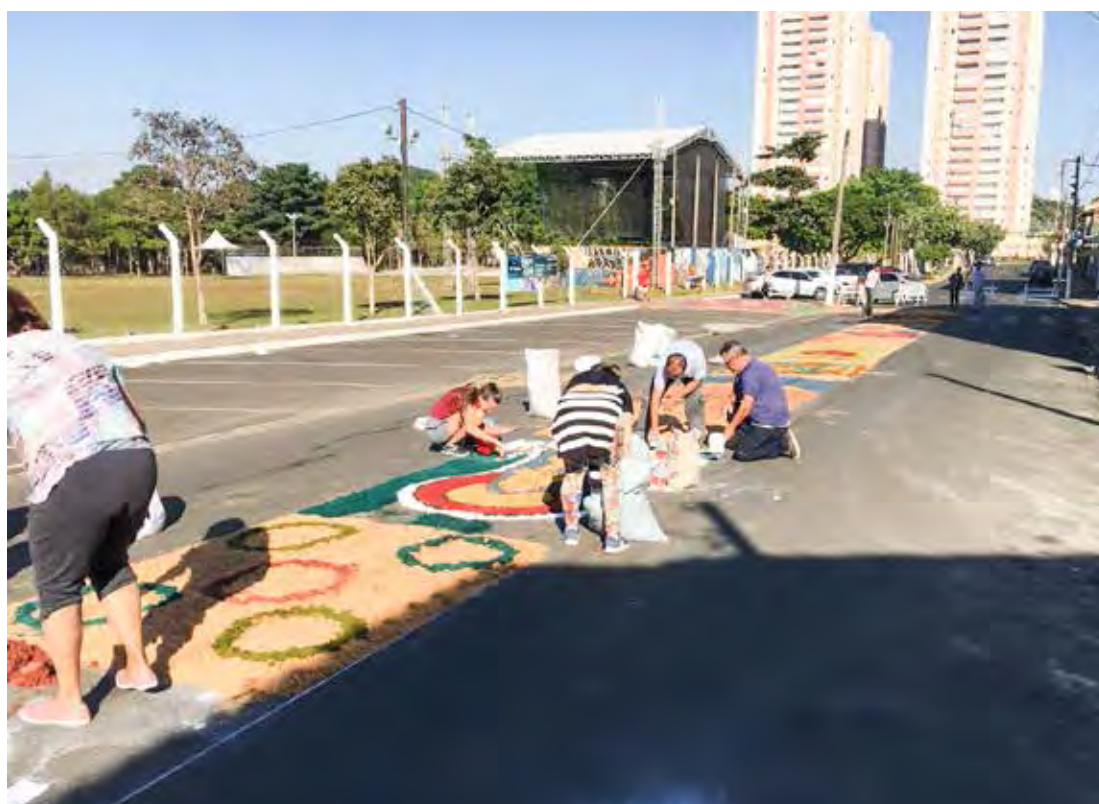
A confecção do tradicional tapete reúne mais de 300 pessoas durante a manhã desta quinta-feira (16). Missa e procissão serão realizadas a partir das 16 horas

Nesse dia, os fiéis manifestam a presença da Eucaristia pelas ruas de cidades do Brasil inteiro e em outros diversos países. “Recordando, fazendo a memória real e presente no que escreveu, Lucas em seu Evangelho (cf. Lc. 9,11-17), sobre a ação de Jesus que depois de ter falado do Reino de Deus às multidões e curado os que sofriam, multiplicando os cinco pães e os dois peixes para não despedir com fome tanta gente. Nessa perspectiva eucarística, o saciar uma multidão faminta pode também lembrar aos cristãos, a ordem de Jesus: “Fazei isto em memória de mim”. A preocupação com a fome que atormenta grande parte do mundo e o interesse