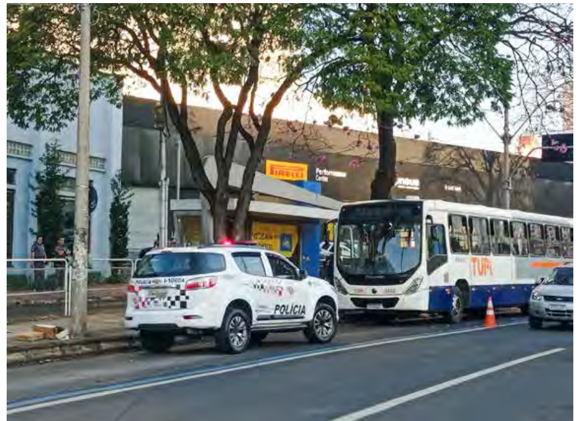
Diário do Rio Claro

Incentivar a prática de exercícios físicos e hábitos saudáveis que resultem em bem-estar e melhorias na qualidade de vida dos participantes. É com esse objetivo que o passeio ciclístico Pedala Tour realiza sua primeira edição em Rio Claro no domingo (28). As inscrições - são limitadas a 1,5 mil participantes - podem ser feitas até a próxima quarta-feira (22). Página 4