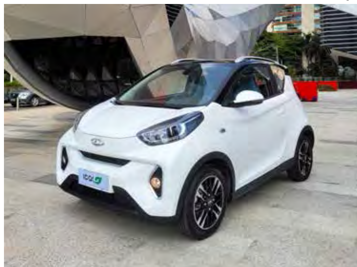
Caoa Chery iCar

No interior há multimídia de 10,25", regulagem elétrica nos bancos dianteiros, volante multifuncional, duas entradas USB e carregamento de celular sem fio.