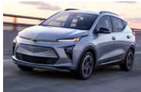
Chevrolet Bolt EUV