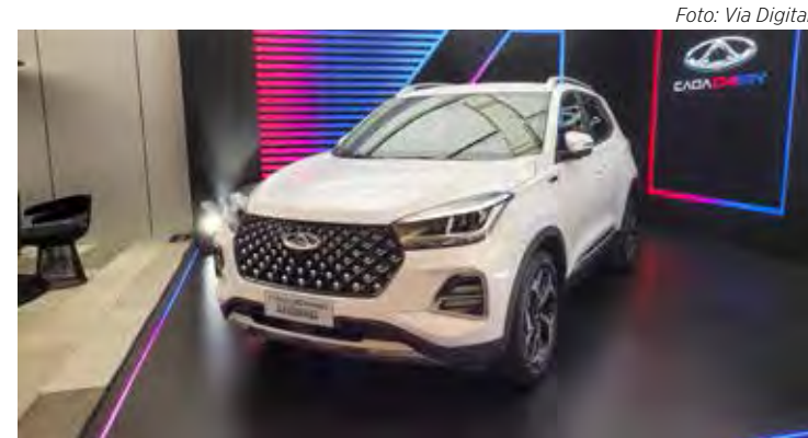
Caoa Chery Tiggo 5x Pro Hybrid

O Caoa Chery Tiggo 8 Pro Plug-in Hybrid chega em agosto por R$ 269.990.