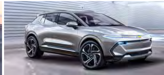
Chevrolet Equinox EV