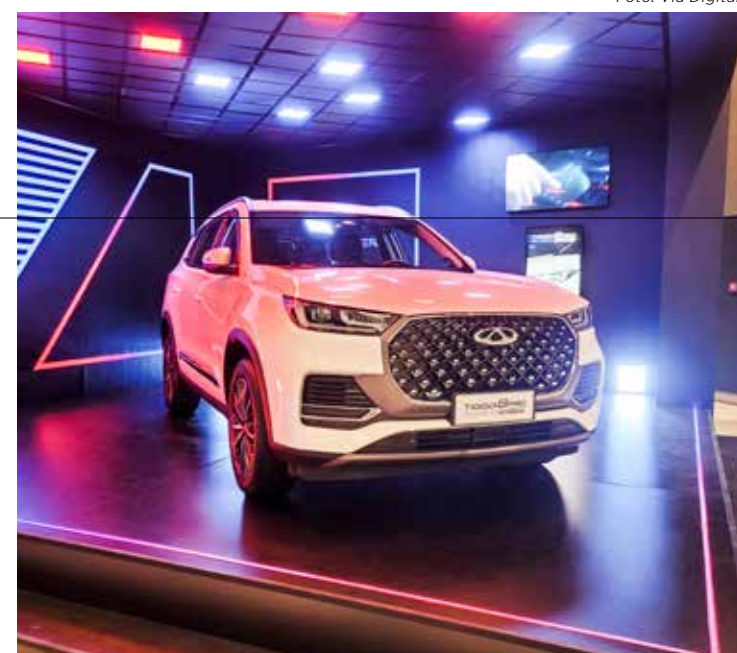
Caoa Chery Tiggo 8 Pro Plug In Hybrid

*Preços de lançamento