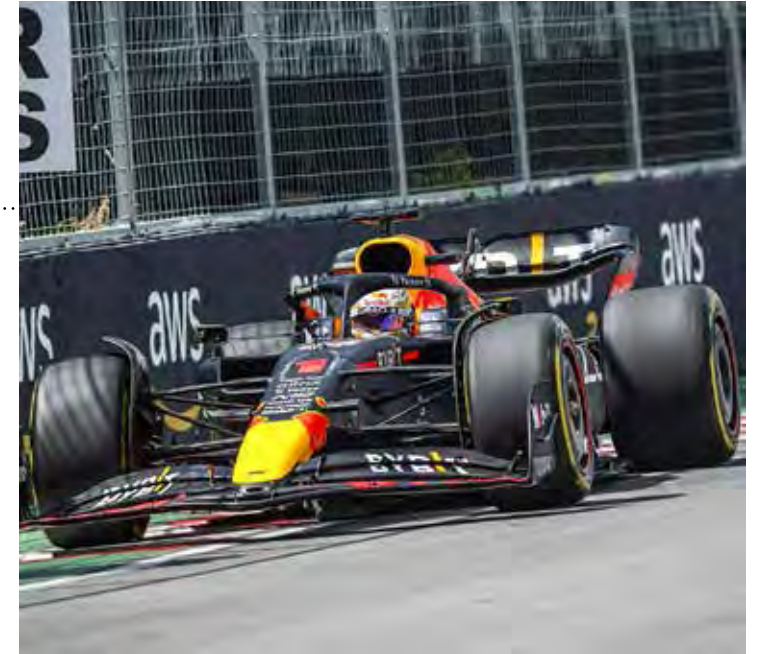
Band renovou direitos da Fórmula 1 até 2025