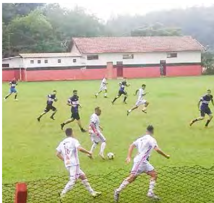
AA Boa Vista

É esperado um grande público para assistir à partida