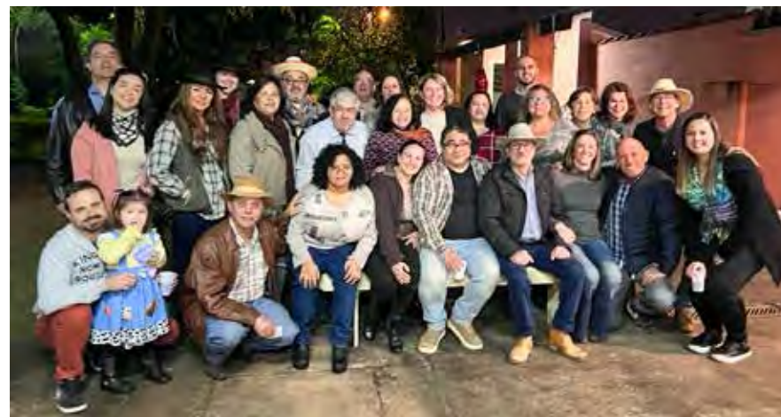
Reunidos para uma foto oficial para linda lembrança