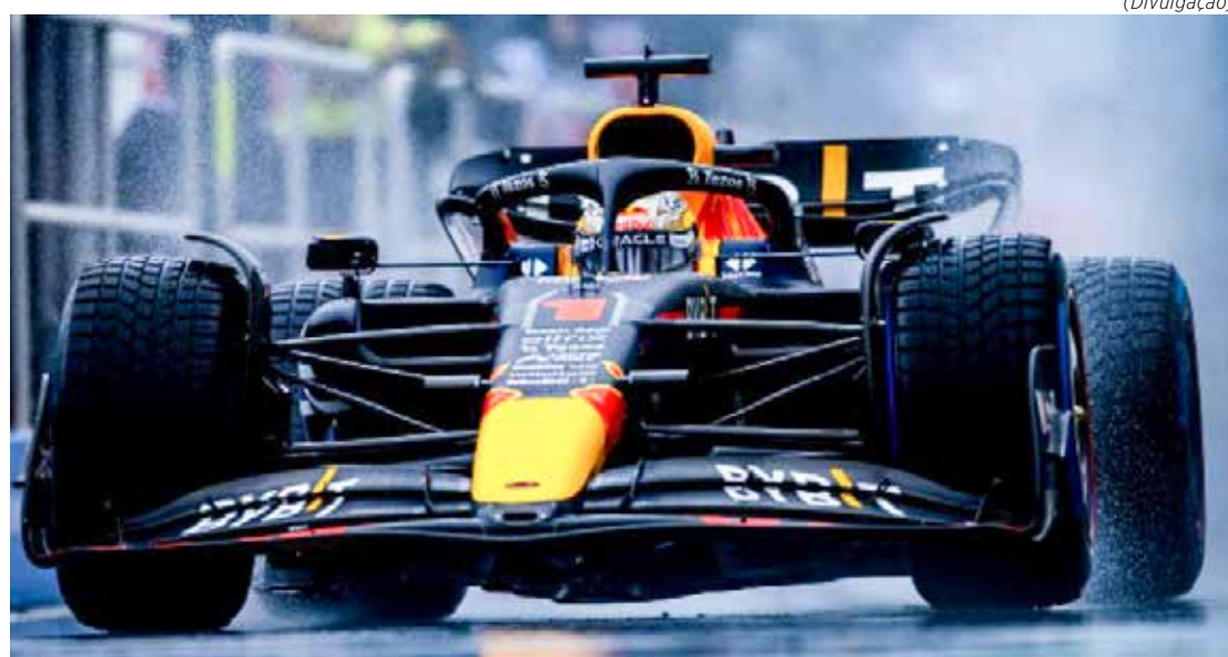
Chefe da Red Bull diz que equipe não planeja mais atualizações até a pausa de verão, fazendo apenas a troca de componentes cuja vida útil chegaram ao fim