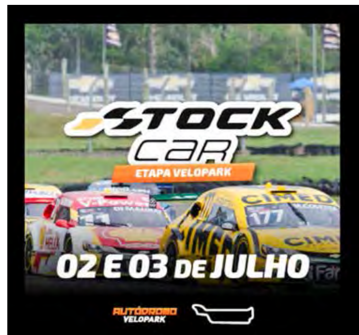
Berço da principal categoria do Brasil, estado concentra maior número de pistas que já receberam provas da competição

O público gaúcho assistirá no sábado a 90ª corrida da história da Stock Car no Rio Grande do Sul. Chamada de GP RS90, a prova corresponderá à Corrida 1 da quinta etapa da temporada. O estado é também o que reúne mais autódromos que receberam provas da categoria: foram 35 corridas em Tarumã - palco da primeira corrida da história da categoria, em 22 de abril de 1979 -, 23 em Santa Cruz do Sul, 18 no Velopark e 13 em Guaporé.