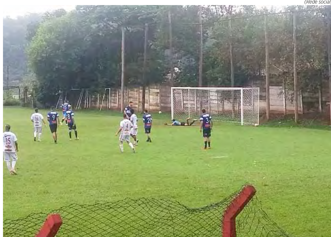
A.A. Boa Vista

Santa Maria 10 x 0 Bellmare Santana 1 x 3 Novo Wenzel Unidos 2 x 1 São Paulinho Paulistão 1 x 4 Minativa