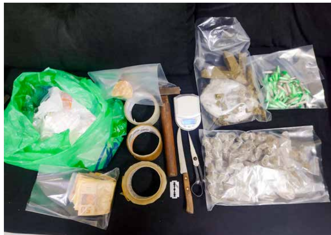
Equipes apreenderam drogas e dinheiro

Equipes do 10º BAEP, na posse de informações de que pela Avenida 54A do bairro Vila Alemã ocorria a venda de drogas, na tarde de sábado (25), foram até o local e surpreenderam o traficante saindo de um imóvel com kits de drogas nas mãos, ao ser abordado ele dispensou as drogas e tentou se evadir para dentro do casa, de imediato foi detido no interior da garagem. O indivíduo confessou que era o responsável pelo tráfico no bairro e o restante das drogas estava sobre o guarda roupa de seu quarto. O indivíduo recebeu voz de prisão e foi conduzido ao plantão policial, onde permaneceu preso à disposição da justiça.