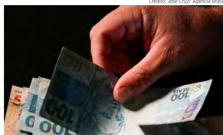
O texto prevê salário mínimo de R$ 1.294 para 2023 e um déficit primário de R$ 65,91 bilhões para as contas públicas

"De acordo com o disposto na Lei nº 9.637, de 15 de maio de 1998, deveria ser utilizado o contrato de gestão como instrumento para formar parceria entre o Poder Público e a organização social".