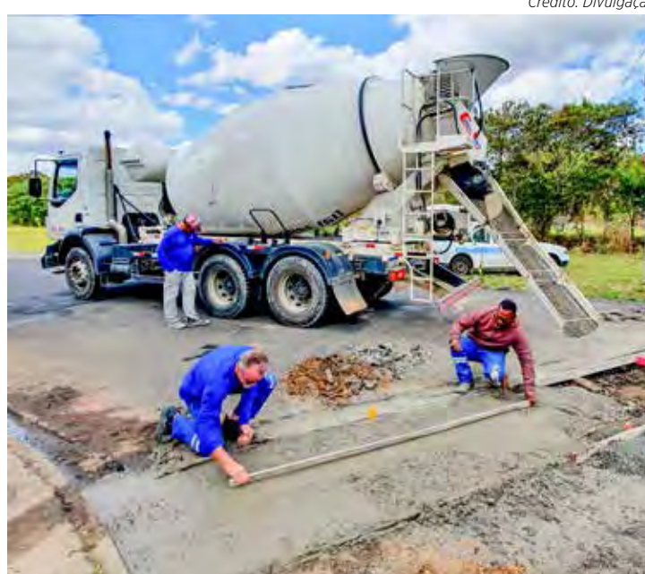
Construção de valeta na Rua 21, esquina com a Avenida 18, no Jardim São Paulo

Para melhorar as condições no trânsito de Rio Claro, a prefeitura também tem realizado a ampliação da sinalização e providenciado o fechamento de buracos em vias públicas, com a operação tapa-buracos e serviços de recapeamento.