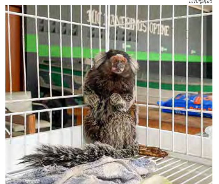
O sagui foi encaminhando para um CRAS (Centro de Reabilitação de Animais Silvestres) em Engenheiro Coelho