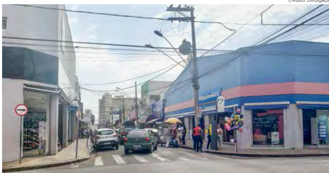
Vista da Rua 3 no Centro de Rio Claro. Lojas de rua abrem até as 22 horas nesta sexta

Apesar de essa não ser a melhor data de vendas para o varejo, há expectativas de cres-