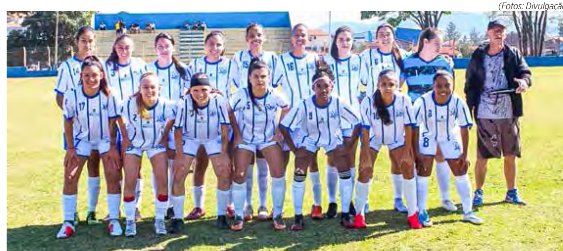
Futebol feminino de Rio Claro nos Jogos Regionais 2022

Nesta sexta-feira (12), a Secretaria de Esportes do Estado de São Paulo, promove sorteio para definir as próximas etapas dos Jogos Regionais 2022.