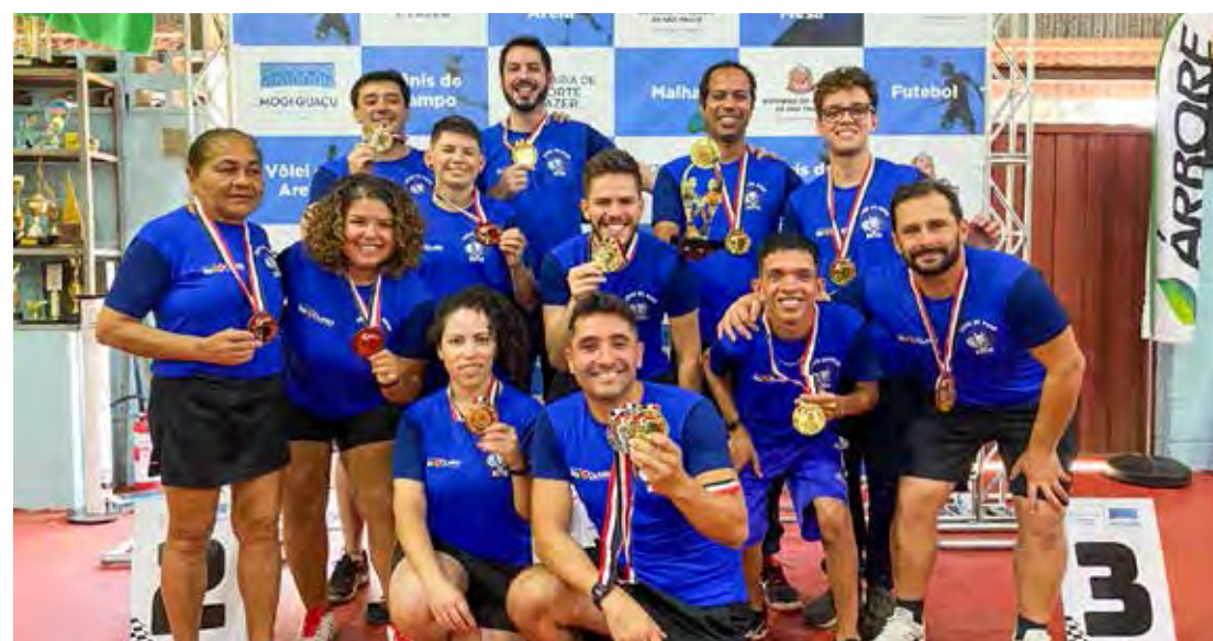
Tênis de Mesa de Rio Claro - Jogos Regionais 2022