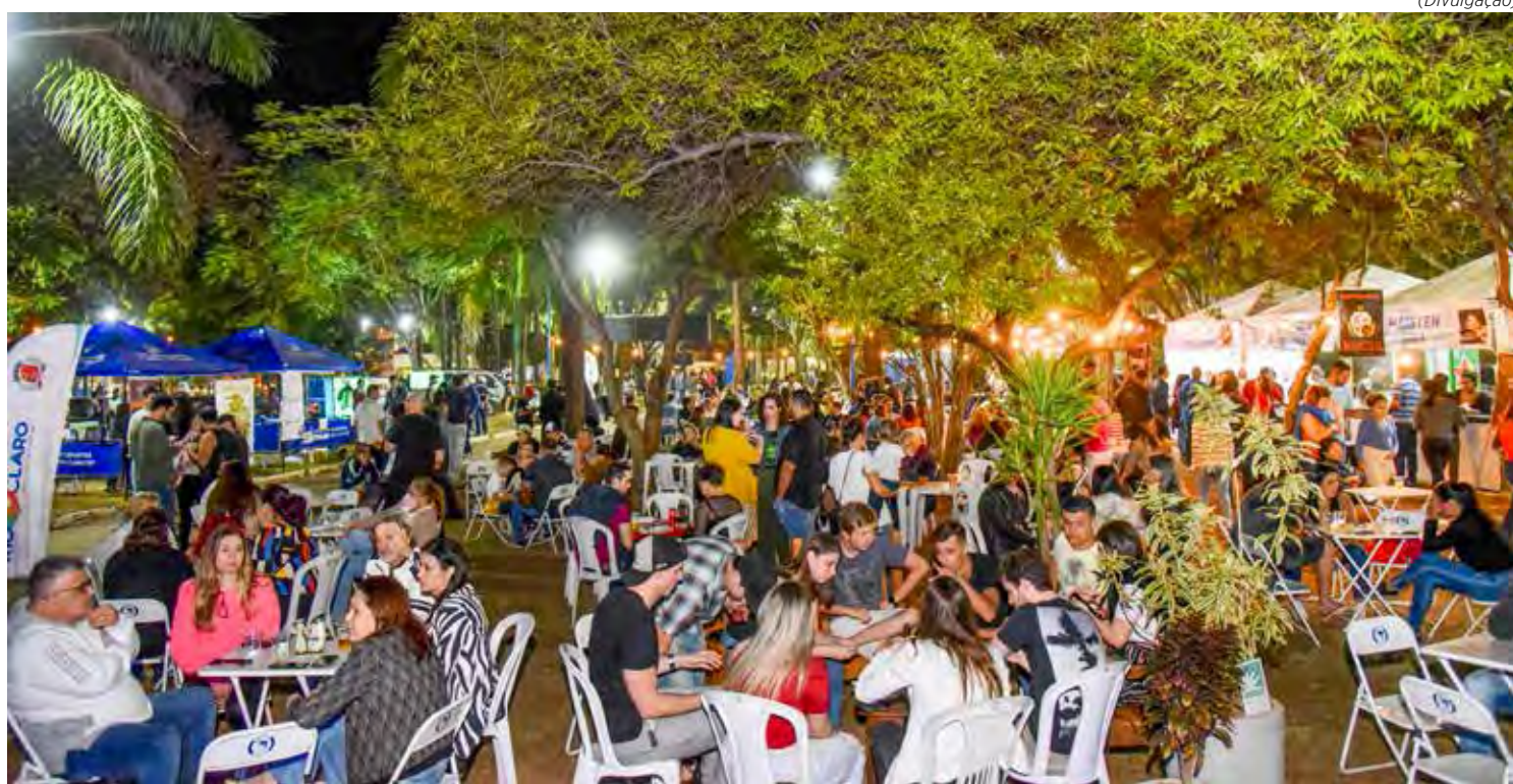
Os estabelecimentos têm se mobilizado para atrair o público. Recentemente o município sediou o 1º Festival Gastronômico e reuniu mais de 25 mil participantes em quatro dias de festa