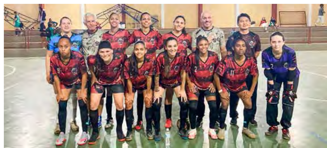
Futsal feminino rioclarense nos Regionais 2022