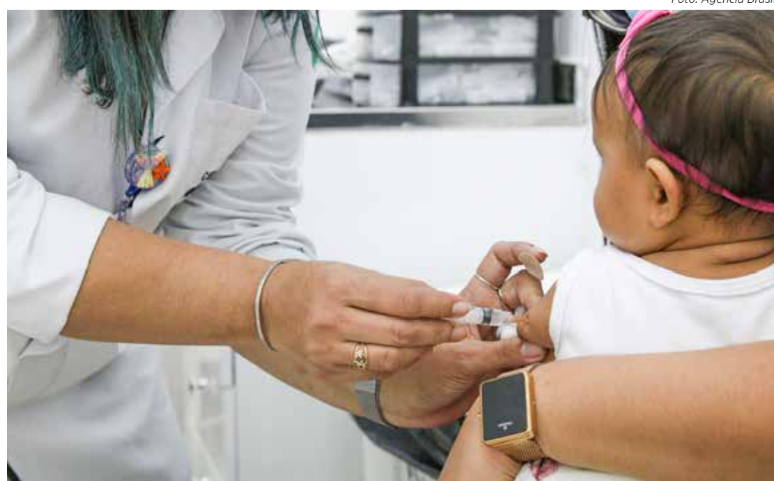
Criança recebe vacina contra a Covid-19 em unidade de saúde

Apenas as doses da Pfizer infantil, para crianças de 5 a