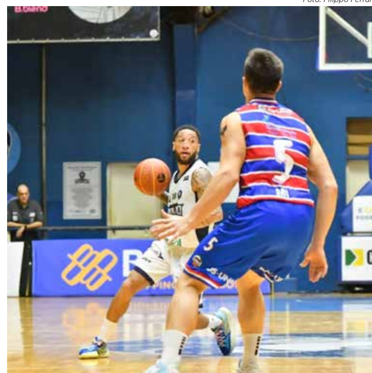
Rio Claro Basquete não superou o Basquete Cearense