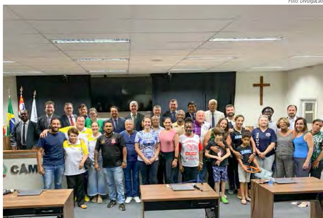
Representantes da Uesca participaram da sessão da Câmara