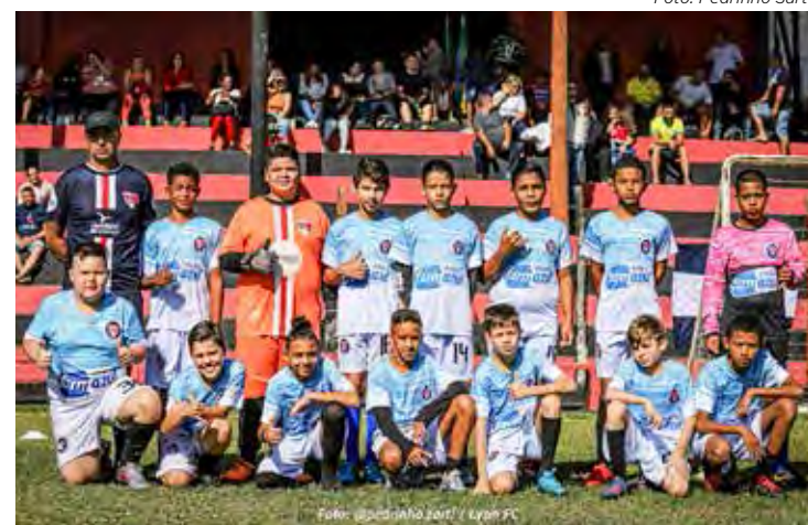
Lion FC: Vice Campeão Sub-11