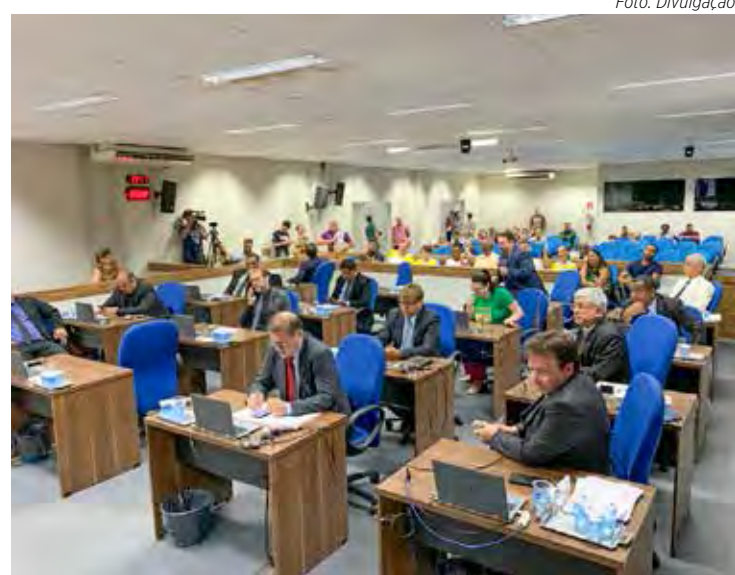
Vereadores no plenário da Câmara na sessão desta quarta-feira (16)