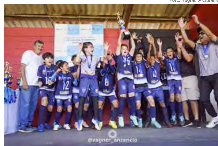
JJ Sports: Campeão Sub-11.