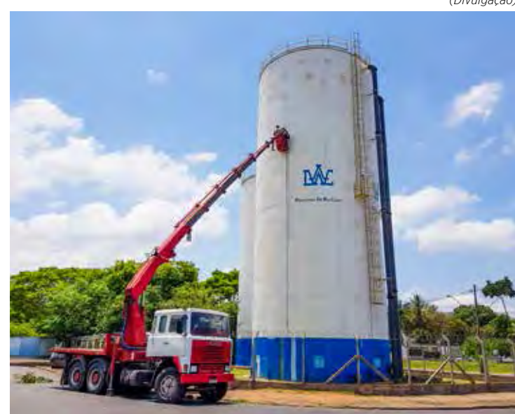
Reservatório do Mãe Preta está recebendo melhorias

Com estrutura de chapa metálica soldada, o reservatório está localizado na Avenida 80-A com a Avenida 1-MP, próximo da Escola Municipal “Monteiro Lobato”, e tem capacidade para 1,5 milhão de litros de água.