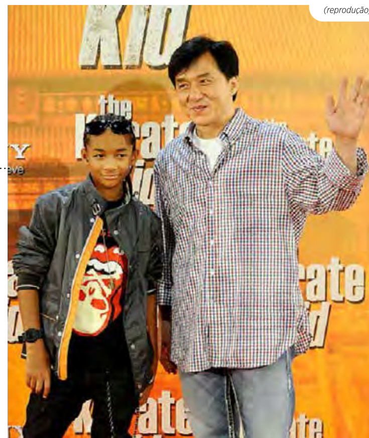
Jaden Smith e Jackie Chan são os protagonistas de "Karatê Kid"

Pessoal da PRH-9, produtora da Band, responsável pelo Vera Cruz, procurou a coluna para informar que a conta de locação dos estúdios está fechando perfeitamente. Além de contratos com empresas de fora, só para a realização do "MasterChef" e o que seria pago em outro lugar, já torna o negócio compensador. Então está ótimo.