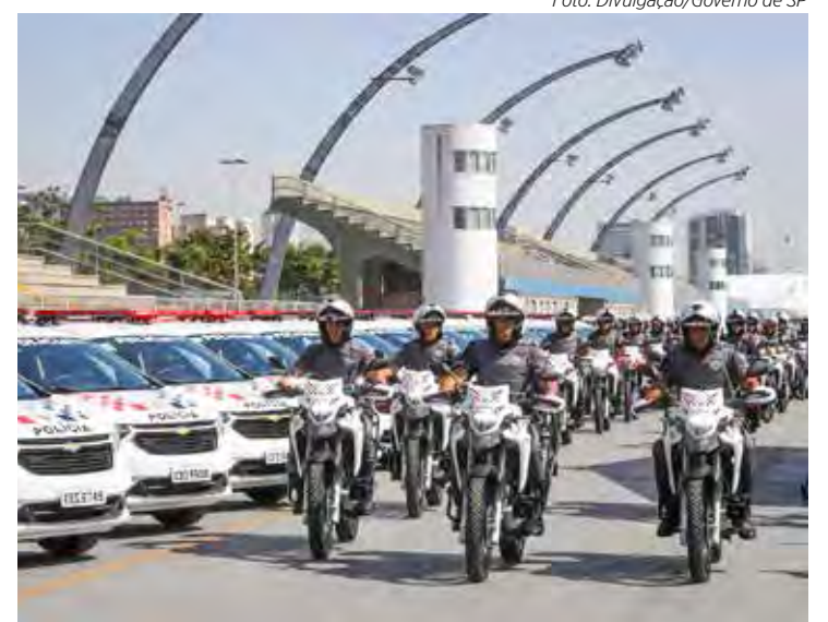
A Polícia Militar empregará cerca de 1.500 policiais na segurança do Réveillon e corrida de São Silvestre

No Réveillon da Paulista a previsão é que os shows comecem às 17h deste sábado (31) com a apresentação da cantora Fafá de Belém. E terminem às 02h de domingo (1º) com a apresentação da escola de samba Mancha Verde, a campeã do carnaval 2022 de São Paulo. A segurança do local contará com um efetivo de 629 policiais