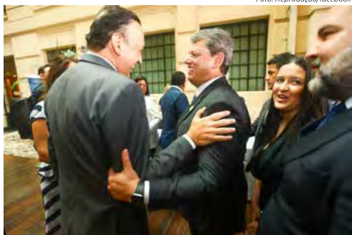
Tarcísio e Ramuth serão os 64º governador e vice de SP.