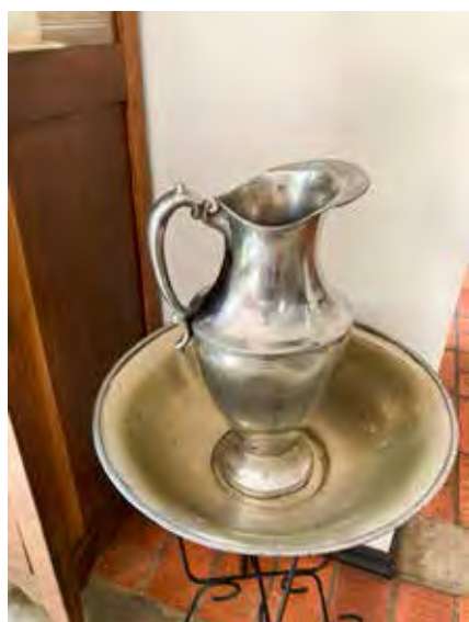
Jarro com bacia onde meu pai e tios tomavam banho quando bebês

“É uma delícia ter essas peças. Minha mãe nasceu em 1925, época desse fogãozinho. É bem antigo. Essas peças da família são muito bacanas. Literalmente é uma volta ao passado. E ao bom passado da minha família”, disse.