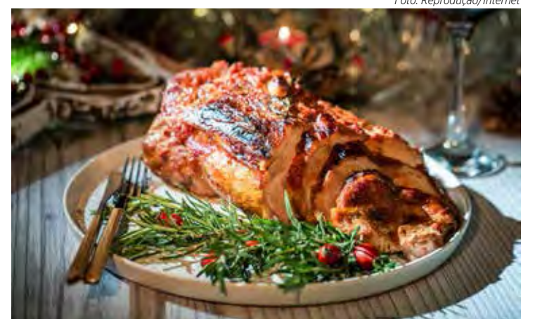
O porco fuça para a frente por isso é visto como um animal de prosperidade