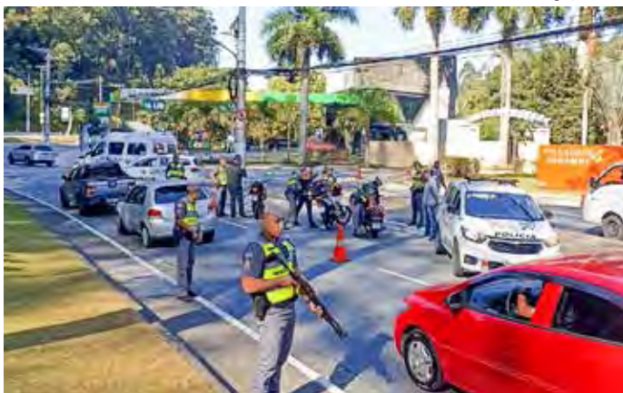
A redução dos indicadores criminais é resultado da Operação Sufoço