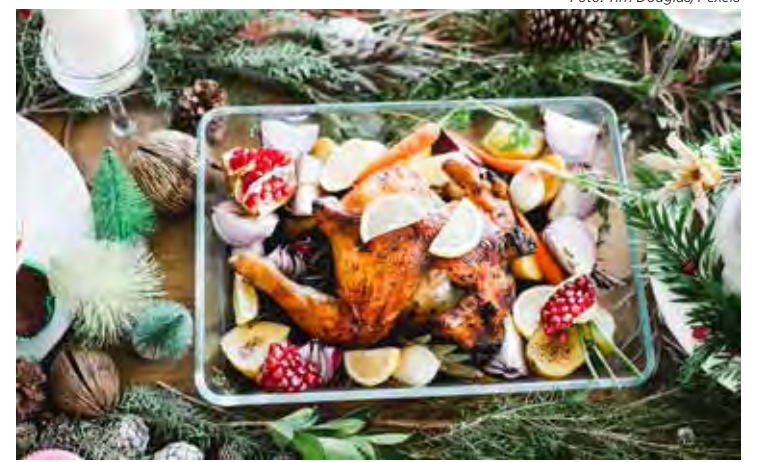
As aves devem ser evitadas porque piscam para trás o que significa retrocesso

Ciente dos alimentos ideais para a ceia, agora é só preparar uma mesa farta e convidar os amigos e familiares, afinal, quanto mais farta a mesa estiver, maior a prosperidade e fartura para o ano seguinte. Feliz 2023!