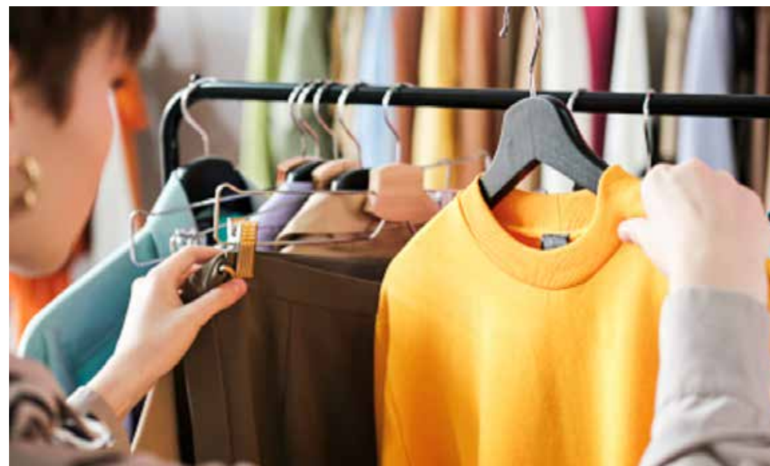
O amarelo também tem grande procura para o Ano Novo

Mas a superstição das cores vai além das roupas. O mercado tem à disposição dos mais supersticiosos acessórios, calçados, maquiagem e uma gama de outros produtos com as cores tradicionais do Réveillon. Ou seja, quem quiser pode se vestir da “cabeça aos pés” numa tentativa de atrair muita sorte e prosperidade para 2023.