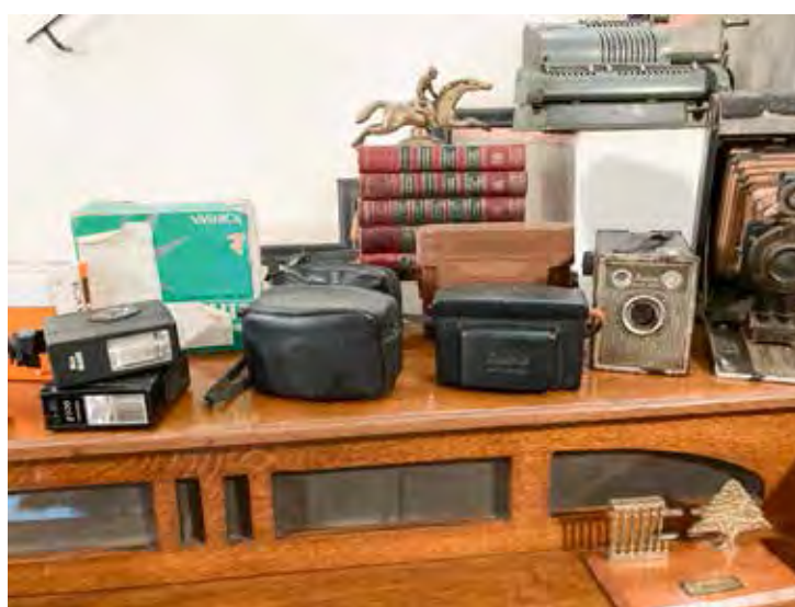
Pequena coleção de máquinas fotográficas

No finalzinho dos anos 30, Nico Padula, um simpático e competente alfaiate, teve uma