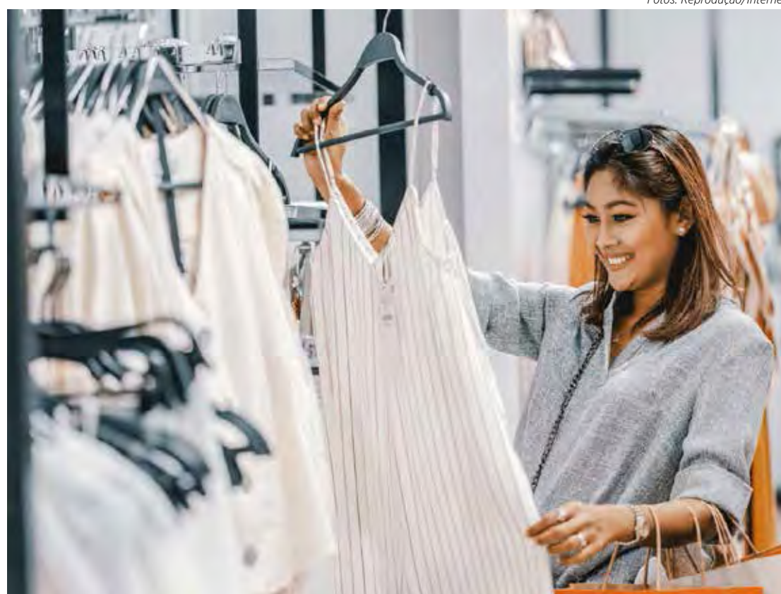
O branco ainda tem a preferência da maioria dos consumidores

Tradicionalmente, o branco é a cor mais usada na festa de Réveillon porque simboliza a