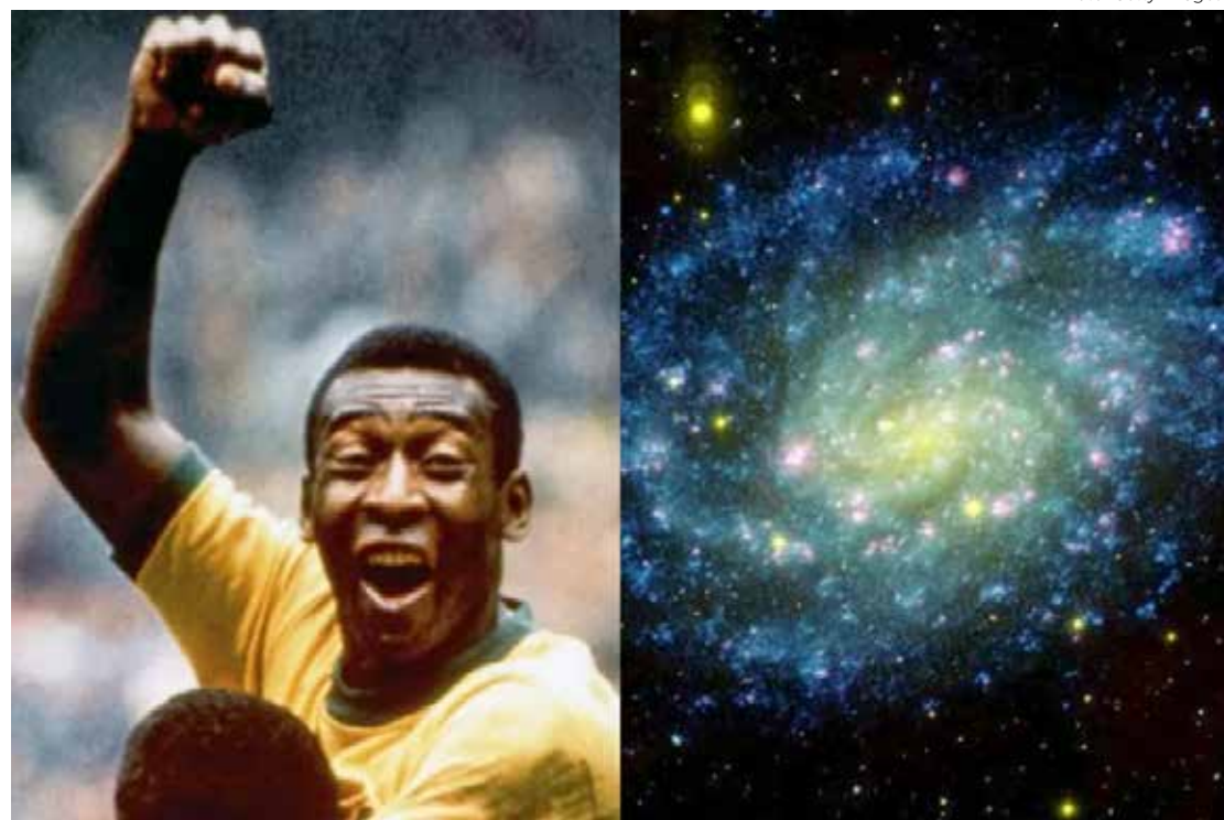
Pelé comemora seu gol na final contra a Itália na Copa de 1970 - Nasa homenageia o Rei.