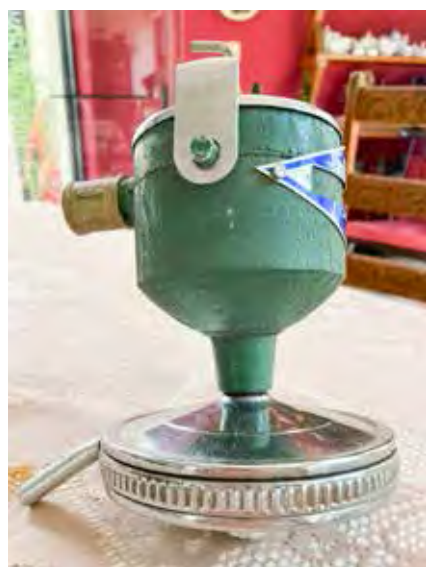
Um dos primeiros modelos de chuveiro elétrico do Brasil