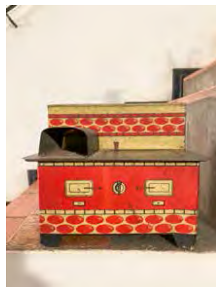
Fogão de Lata - primeiro brinquedo de minha mãe. Tem mais de 95 anos