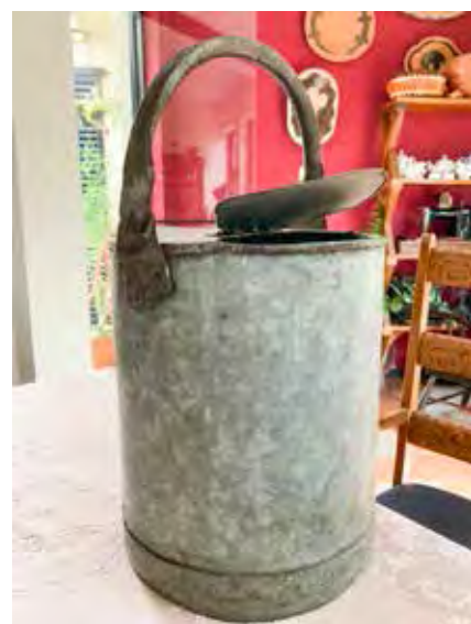
Balde onde os agueiros distribuíam água potável