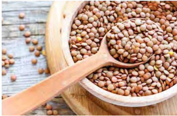
A lentilha é usada para garantir fartura e prosperidade

Trata-se de um hábito comum em muitos países, para garantir fartura e prosperidade. A origem desta superstição é italiana e foi trazida ao Brasil pelos imigrantes. Na Itália, existe até um ditado popular que diz: “Lentilha no Ano-Novo,