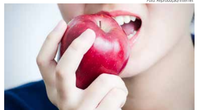
Morder uma maçã bem vermelha à meia-noite simboliza sucesso e longevidade