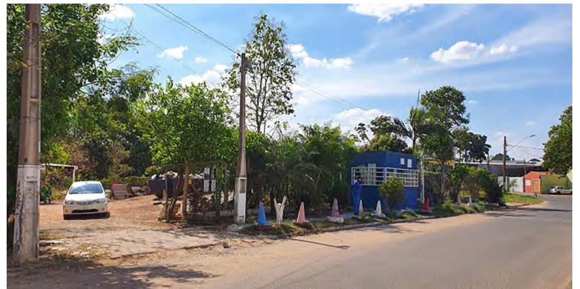
Os ecopontos atendem, excepcionalmente, das 8 horas ao meio dia hoje.

Neste sábado e domingo, as feiras livres deverão ser realizadas normalmente. Hoje, a partir das 7 horas no bairro São Benedito (na Rua 9 com a Avenida 13) e no domingo no Cervezão (na Avenida M-25 com Rua M-17).