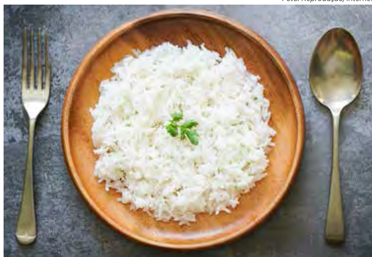
O consumo de arroz pode simbolizar riqueza, abundância e fertilidade

Lentilhas: Crença herdada de italianos, as lentilhas são sinal de boa sorte e muita riqueza. Os supersticiosos afirmam que 01 colher de sopa é suficiente para assegurar um ano inteiro de muita fartura;