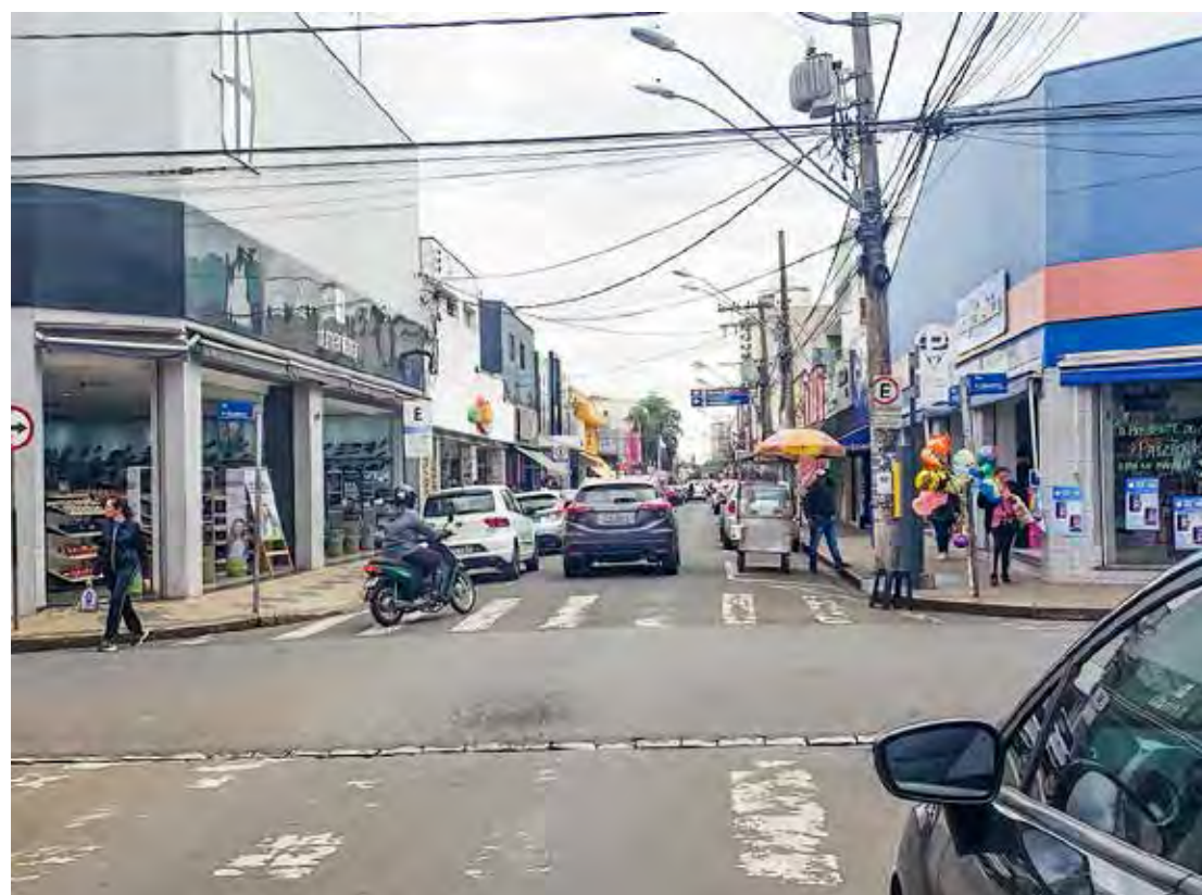
Lojas de rua funcionam até as 15 horas neste sábado (31), véspera de Ano Novo

bém fecham no domingo (1º e reabrem na segunda-feira (2), das 13 às 22 horas. O horário de funcionamento volta ao normal a partir de terça-feira (3), das 10 às 22 horas.