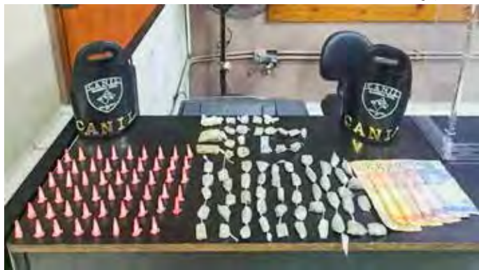
Menor de 15 anos foi apreendido por tráfico de drogas