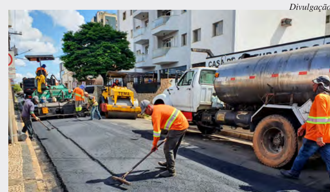
Serviços de recapeamento foram realizados nesta terça

A suavização de valetas é outro serviço que, por meio do programa Rio Claro em Ação, ganhou força e vem acabando com antigo problema de valetas profundas em esquinas movimentadas, a partir de indicação da Secretaria de Mobilidade Urbana e Sistema Viário, pasta que também intensificou a ampliação e renovação da sinalização de trânsito em todas as regiões.