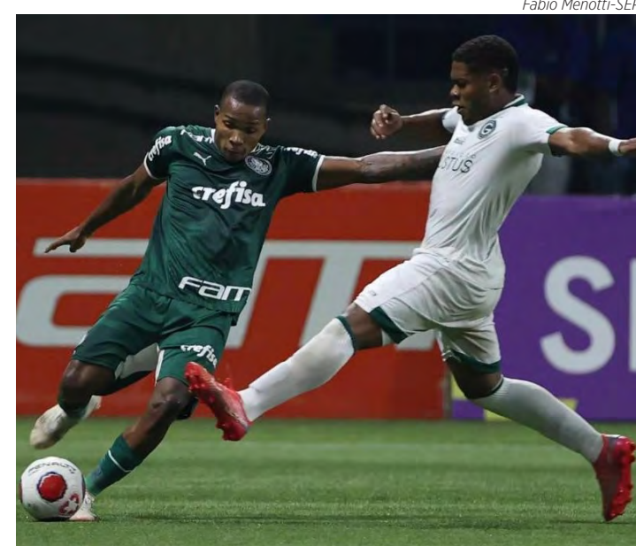
Palmeiras tenta o bi da Copinha