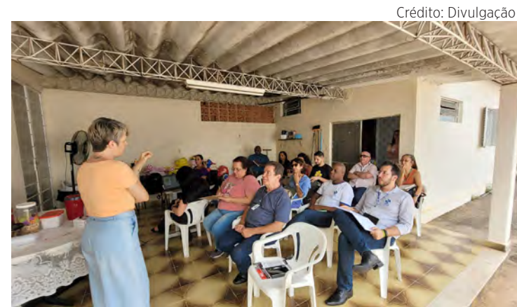
Pré-conferência realizada no Conselho Tutelar de Rio Claro.

Mais informações podem ser obtidas com o Conselho Municipal de Saúde, que fica na Avenida 2, 238, Centro. O telefone para contato é o (19) 98455-1553 e o e-mail é conselho@saude-rioclaro.org.br.