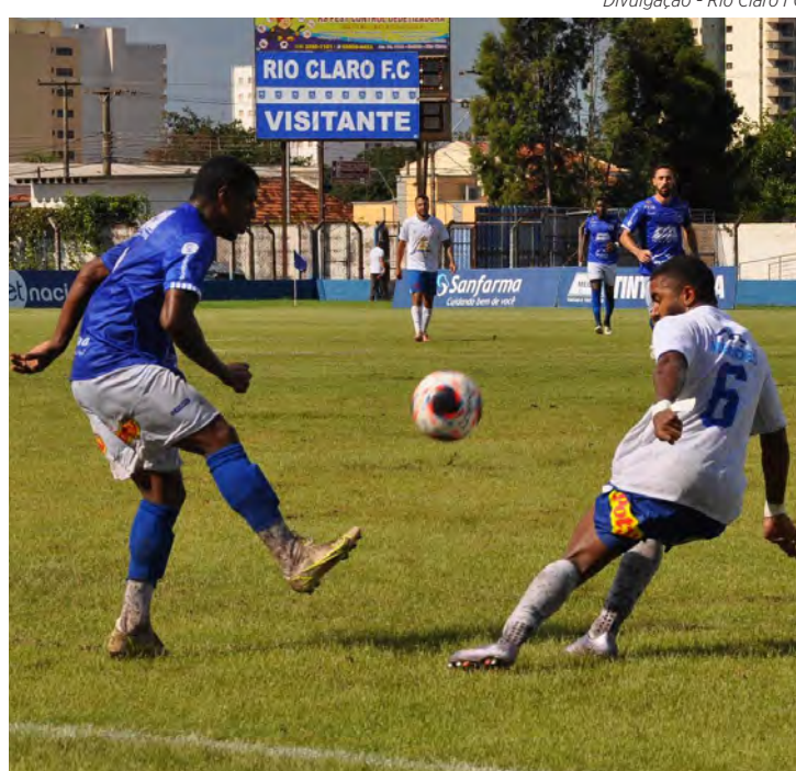
Rio Claro FC tenta primeira vitória na Série diante do Taubaté

O Rio Claro FC estreou com derrota para o Juventus, fora de casa, por 1x0, mesmo placar sofrido no Schmidtão para a Portuguesa Santista pela segunda rodada. E no último sábado (21), o Azulão somou seu primeiro ponto no campeonato ao empatar com o Oeste, em Barueri, sem abertura de placar. Com isso, o Rio Claro FC ocupa a 13ª colocação na Série A2, com 1 ponto ganho.