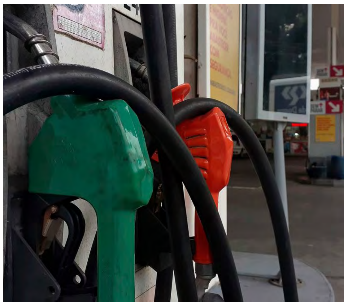
A empresa diz que o aumento “acompanha a evolução dos preços de referência”

Segundo o IBGE, todos os nove grupos de produtos e serviços pesquisados tiveram alta em janeiro. O grupo saúde e cuidados pessoais acelerou de dezembro (0,40%) para janeiro (1,10%), influenciado principalmente pela alta nos preços dos itens de higiene pessoal (1,88%), que em dezembro haviam subido 0,04%. Perfume (4,24%) e produtos para pele (3,85%) tiveram as altas mais expressivas.