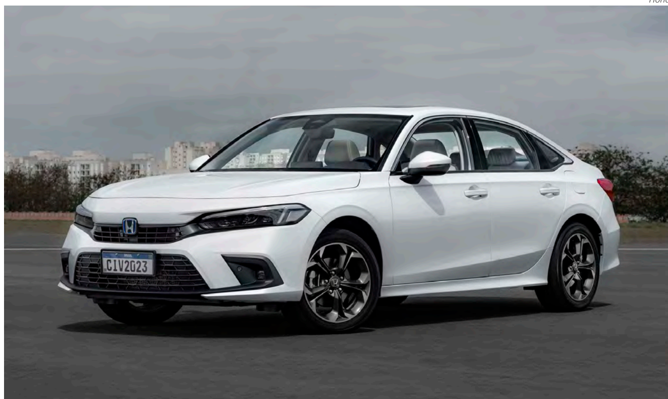
Começando pelo visual, o Civic ficou mais sóbrio

segurança foi melhorado, e se baseia em imagens captadas por câmera de longo alcance e de visão grande angular, operada por um microprocessador de imagem de alta capacidade. Ou seja, algo que um motorista teria