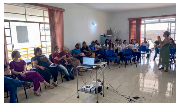
Participantes da pré-conferência no Ceresit.