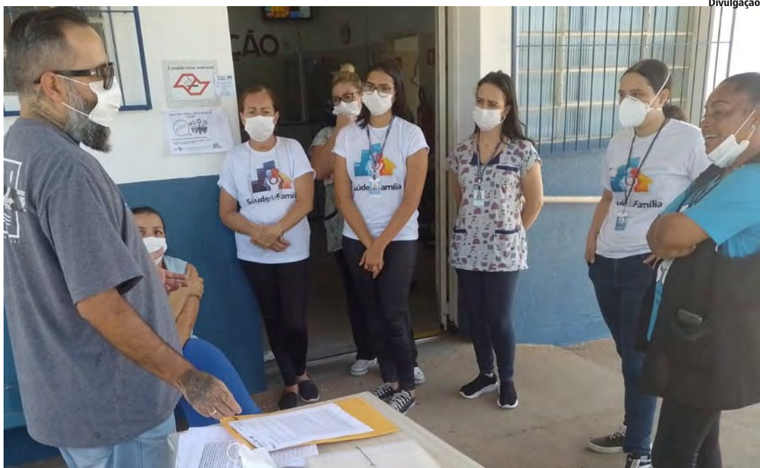
Reunião entre representantes do Sindmuni e agentes comunitários de saúde

O sindicato realiza uma primeira chamada às 17 horas e, não havendo quórum, a assembleia acontece meia hora depois com qualquer quantidade de servidores presentes. Além da pauta de reivindicações da campanha salarial pretende obter autorização dos servidores municipais para que a diretoria do sindicato possa firmar acordo coletivo de tra-