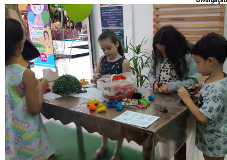
Crianças participam da oficina Eco Arte no Shopping Rio Claro

Todas as atividades infantis programadas para as férias de janeiro do Shopping Rio Claro são gratuitas e acontecem em lojas em frente ao deque.