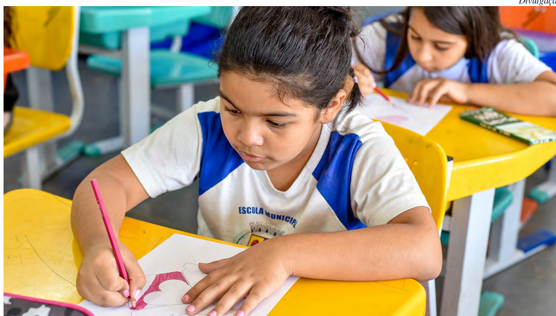
Alunos voltam às aulas em 6 de fevereiro nas escolas municipais de Rio Claro

“O recesso escolar dos estudantes acontece integralmente em julho, do dia 3 ao 23. O calendário também prevê reuniões de planejamento, nos dias 1 e 2 de fevereiro, e re-