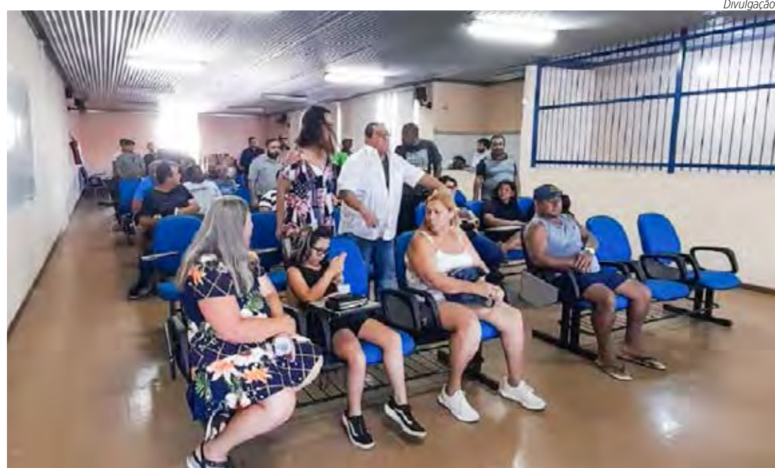
Acordo da campanha salarial foi aprovada pelos servidores em assembleia realizada no dia 27 de janeiro

O pagamento do aumento será dividido em duas parcelas: 5,79% em março e 2,21% em setembro, segundo informado pelo Sindmuni (Sindicato dos Trabalhadores do Serviço Público Municipal). O índice de reajuste salarial é o mesmo conquistado na campanha do ano passado: 8%. Em 2022, o cartão alimentação teve aumento de 22,44%, e subiu de R$ 490,00 para R$ 600,00.