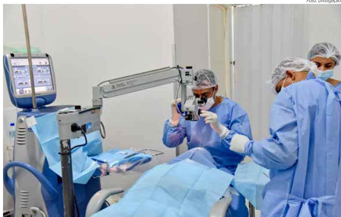
Rio Claro totaliza 671 cirurgias oftalmológicas realizadas em dois mutirões

A primeira etapa desse segundo mutirão foi em novembro, quando 203 pacientes fizeram a cirurgia. No primeiro mutirão, em agosto e setembro, foram realizadas 294 cirurgias de catarata e pterígio.