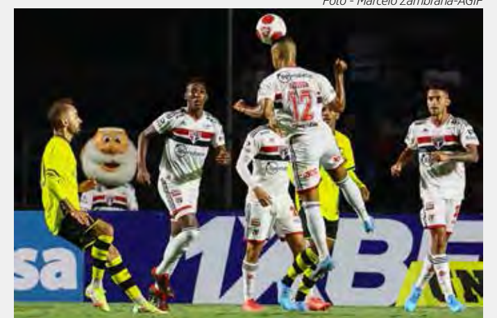
Tricolor enfrenta São Bernardo FC, pelo Paulistão

Finalmente, às 18h30, é a vez do Tricolor Paulista, líder do grupo B com 20 pontos ganhos, enfrentar o São Bernardo FC, a grande surpresa do campeonato e a sensação entre as equipes do interior, na partida marcada para o estádio Morumbi em São Paulo.