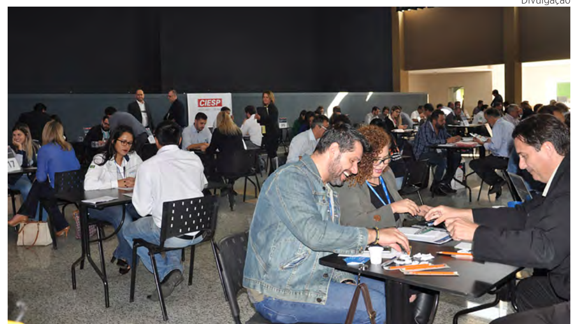
Rodada de Negócios do Ciesp realizada em 2019 em Rio Claro.

Até o dia 13 de março, as inscrições terão desconto. Associados ao Ciesp pagam metade do valor. Faça sua inscrição: http://rodadas.ciesp.com.br/DetailRodada.aspx?rd=195