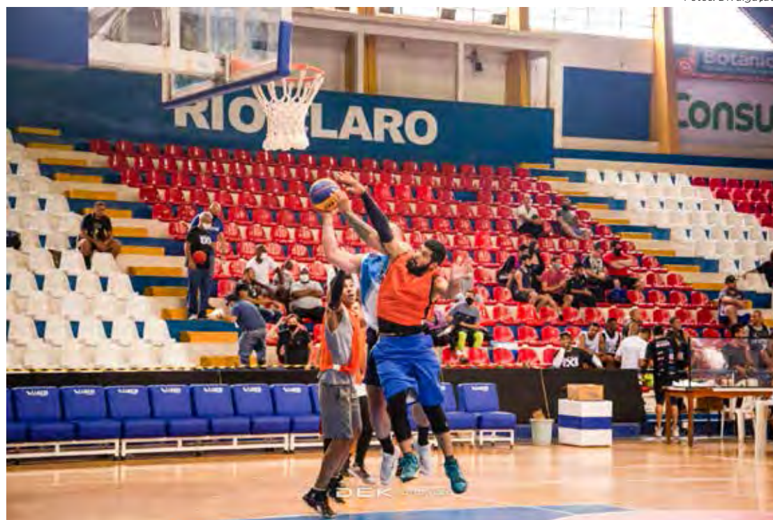
Trinta e seis equipes vão participar da competição de basquete 3x3 neste domingo

"São vários parceiros envolvidos. Através da união de esforços nós podemos revitalizar essa modalidade de esporte, que agora é olímpica, em nossa cidade, além de incentivar a prática esportiva, bem como a solidariedade", destaca o vereador que agradece a todas as pessoas e empresas que apoiam o projeto.