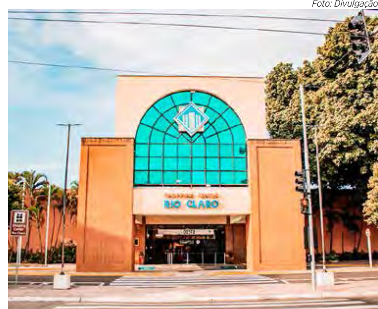
Fachada do Shopping Rio Claro na Vila Paulista.