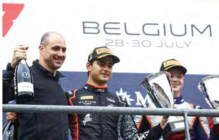
Brasileiro venceu pela primeira vez na temporada

Já a NASCAR Brasil inicia a Corrida 2 neste domingo às 9:20, e pode ser acompanhada pelo YouTube.