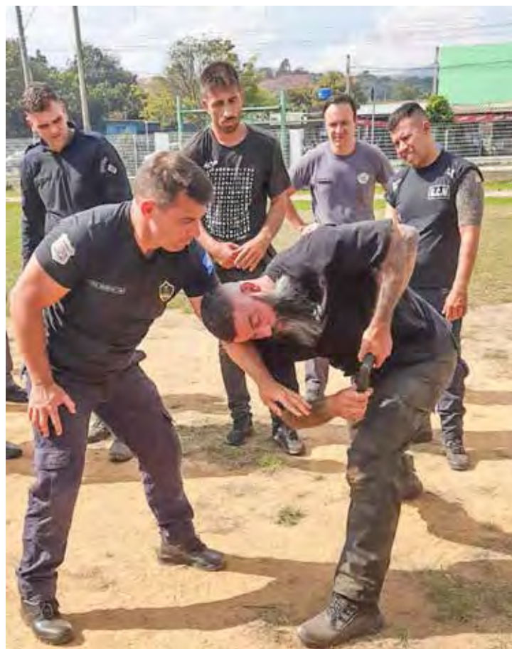
Após a aula teórica, os participantes realizaram o treinamento prático