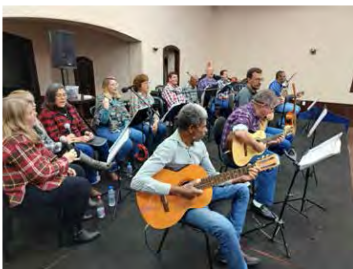
Uma banda fez a alegria musical, Raízes da Terra, aplaudida a noite toda