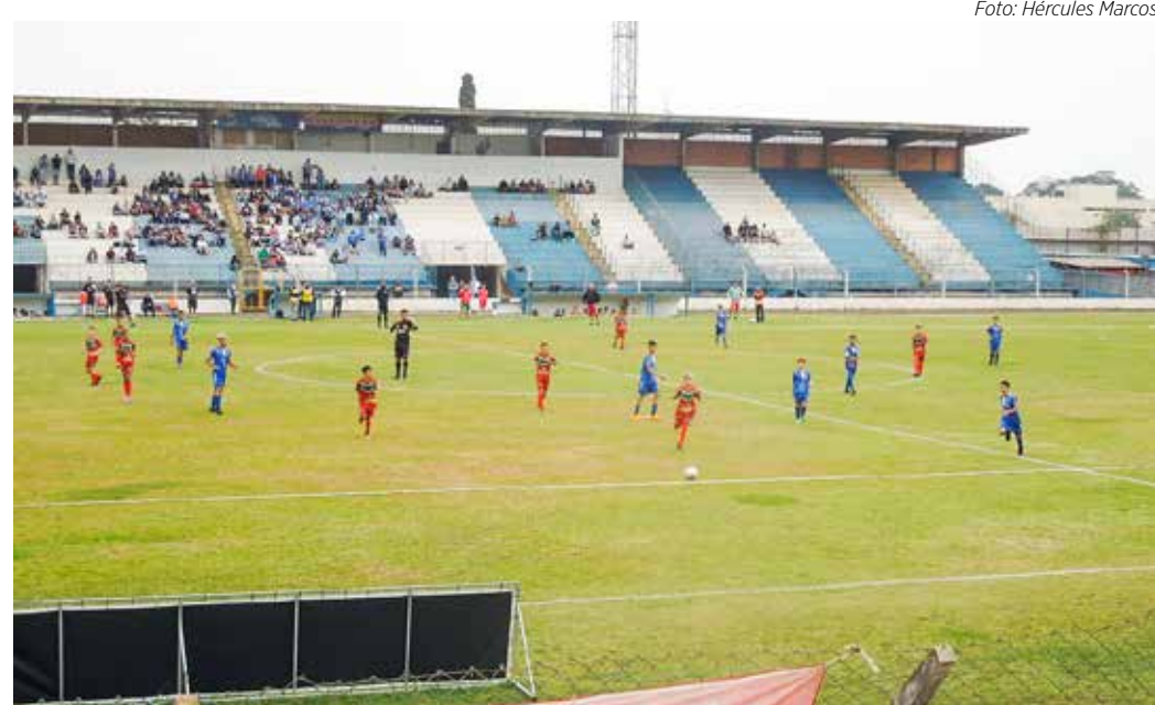
Rio Claro e Velo Clube se enfrentam no Paulista Sub-11 e Sub-13

A primeira categoria a entrar em campo será a Sub-11, às 9h00 e, na sequência, joga a categoria Sub-13, às 10h30. A competição é promovida pela Federação Paulista de Futebol. Não há cobrança de ingresso. E espera-se a presença dos familiares, parentes, amigos e vizinhos, dos jogadores, além, naturalmente dos torcedores de ambas as agremiações para prestigiar aos jogos da garotada que, com muita alegria vivem o orgulho e a emoção de vestirem as camisas dos clubes mais tradicionais e importantes de nossa cidade.