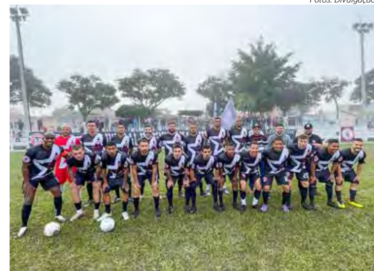
Família CVZ FC, líder invicto do Grupo B