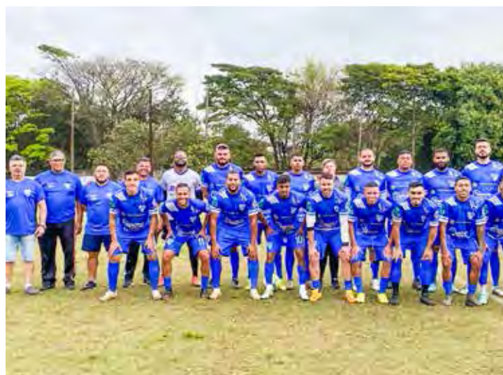
Juventude FC, líder invicto do Grupo A

Distrital do Paulistão: 8h00: EC Paulistão x EC Vasco da Gama