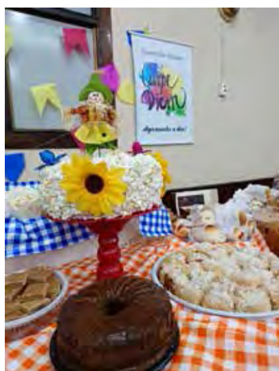
Aqui começa a brincadeira...

tribui com estrutura e apoio, com os músicos da Raízes da Terra, e a colaboração de cada integrante, que faz cada momento ser marcado por alegria e amizades. A festa Junina vai ficar na lembrança, até que nova oportunidade se faça presente... e que não vai demorar pois onde tem uma equipe unida, tem futuro.