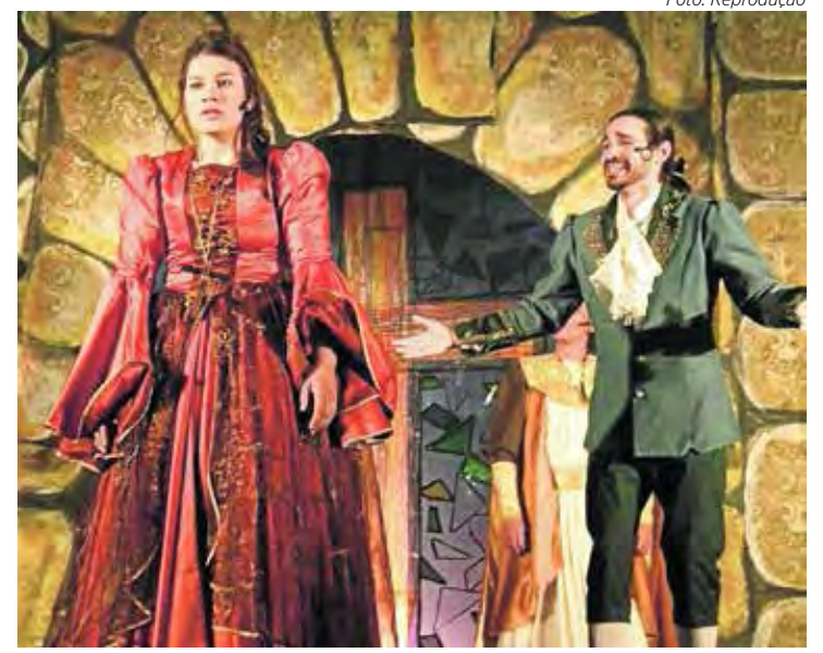
Cena da peça "Um Amor de Renúncia" que estará em cartaz neste domingo (30) no Centro Cultural.

Renúncia conta a história de Alcione que se depara com a perspectiva de renunciar à própria felicidade em favor das necessidades daqueles que a cercam, exigindo de sua parte, atos de heroísmo e lealdade no período de decadência moral, vivido pela França, durante o reinado de Luis XIV. Alcione se depara então, com um grande amor do passado, que dela exigirá devotamento e abnegação no esforço de ajudá-lo nas provas, expiações e reparações que este amor terá de enfrentar. O livro Renúncia tem 535 páginas e continua sendo editado pela FEB, com grande aceitação pelo público leitor.