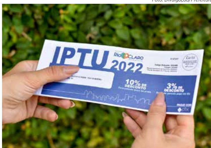
Dívidas com IPTU e outros tributos inscritos na dívida ativa até 2022 podem ser parceladas com descontos

O prazo de adesão ao Refis, que inicialmente venceria em 19 de maio, foi prorrogado por duas vezes. Primeiro para 30 de junho