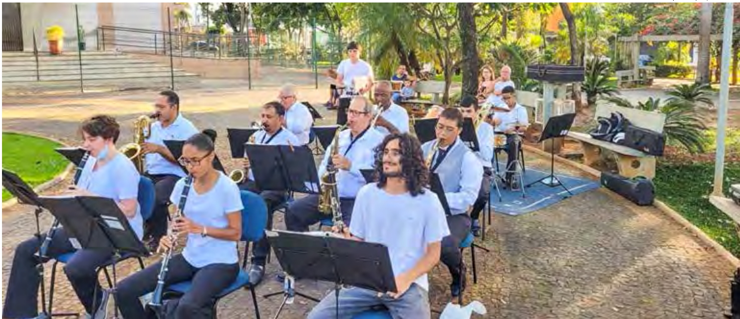
O concerto gratuito conta com participação de 20 músicos e regência do Maestro Baco

O projeto "Quatro e Meia" é realizado pela prefeitura de Rio Claro, por meio da Secretaria Municipal de Cultura.