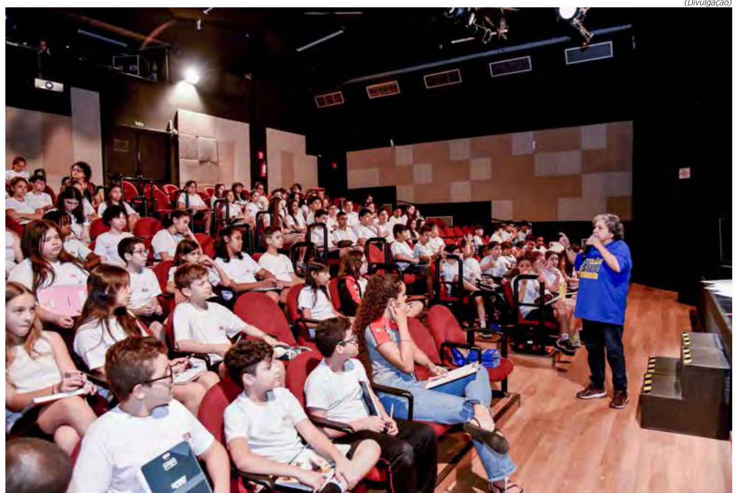
Estudantes assistiram palestra sobre trânsito