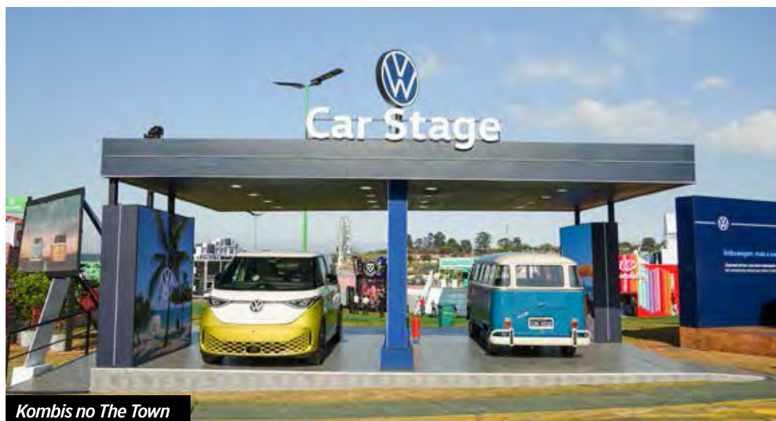
Kombis no The Town