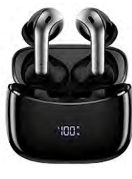
Headphones sem fio - ear buds