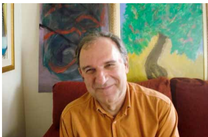
Osmar Santos dedica-se à pintura abstrata

Dono de bordões marcantes da radiofonia esportiva brasileira como: "Pimba na gorduchinha", "É fogo no boné do guarda" e "Chiruriruli-chirurirulá" e "E queeeee goooolllll", entre outros, até hoje lembrados