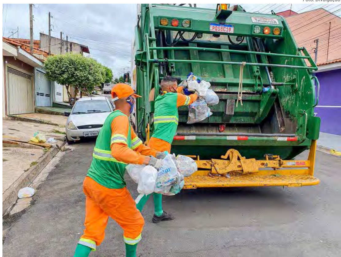
A coleta de lixo será normal no feriado desta quinta-feira (7), Dia da Independência.

A feira livre da Vila Martins não será realizada na sexta-feira (8). As demais feiras livres serão normais, sábado no São Benedito, às 7 horas, e domingo no Cervezão, também às 7 horas.