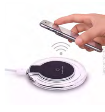
Carregador por indução