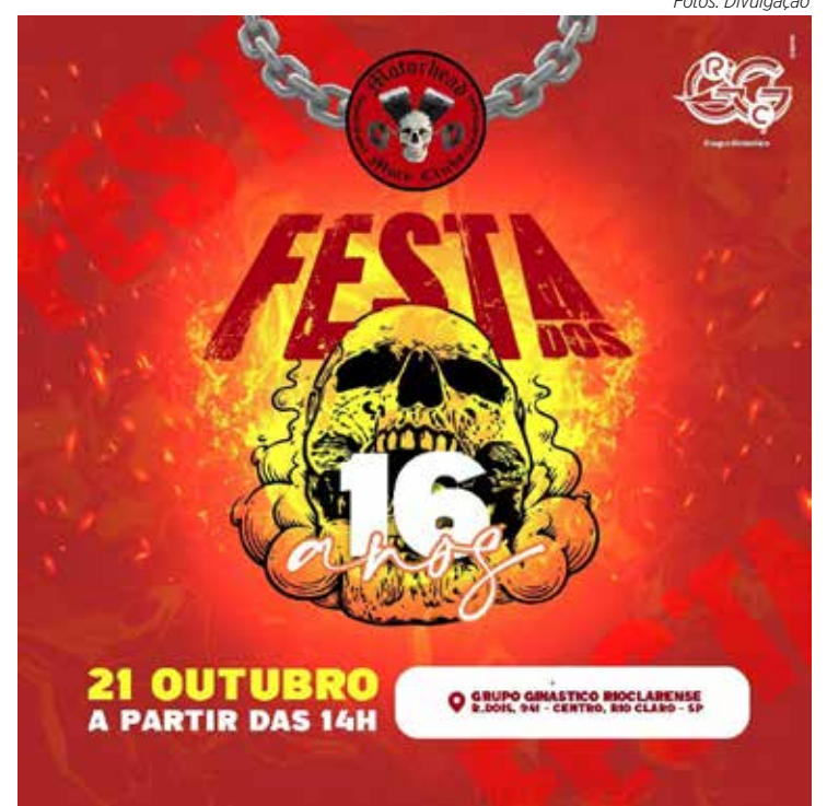
Moto Clube está divulgando o evento nas redes sociais

O Motorhead Moto Clube fica na Avenida 8, esquina com rua 15B, bairro Bela Vista. Mais informações pelo e-mail motorheadmg@yahoo.com.br.