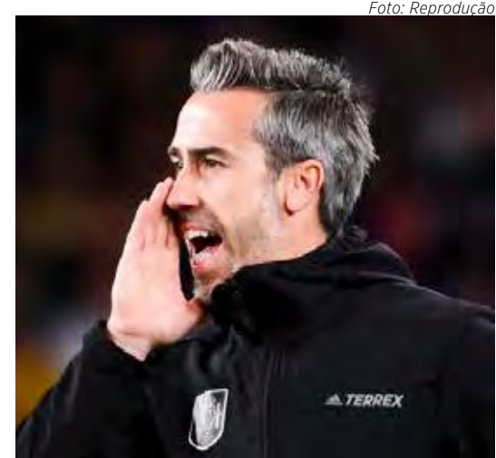
Técnico campeão do mundo, Jorge Vilda, foi demitido

O presidente da federação espanhola Luis Rubiales está suspenso pela FIFA, devido ao beijo forçado que dera na jogadora Jenni Hermoso, durante a cerimônia de premiação pela conquista da Copa do Mundo Feminina. Atualmente, a entidade é presidida por Pedro Rocha, a quem coube a decisão de demitir Jorge Vilda.