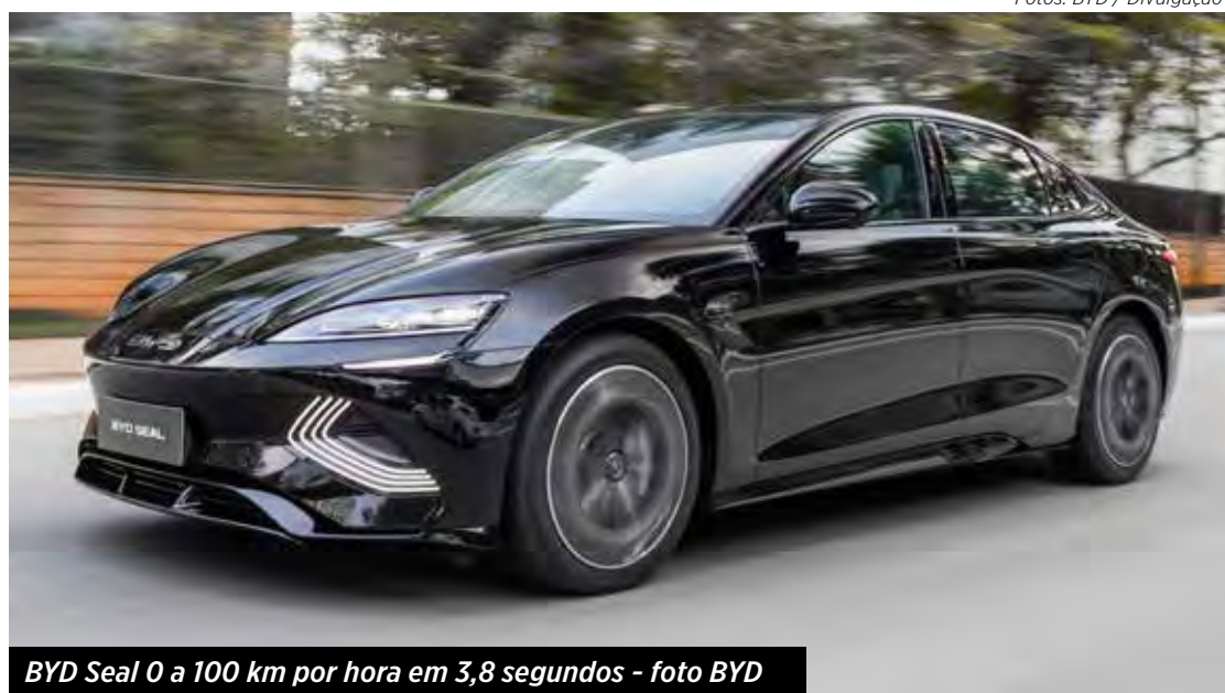
BYD Seal 0 a 100 km por hora em 3,8 segundos