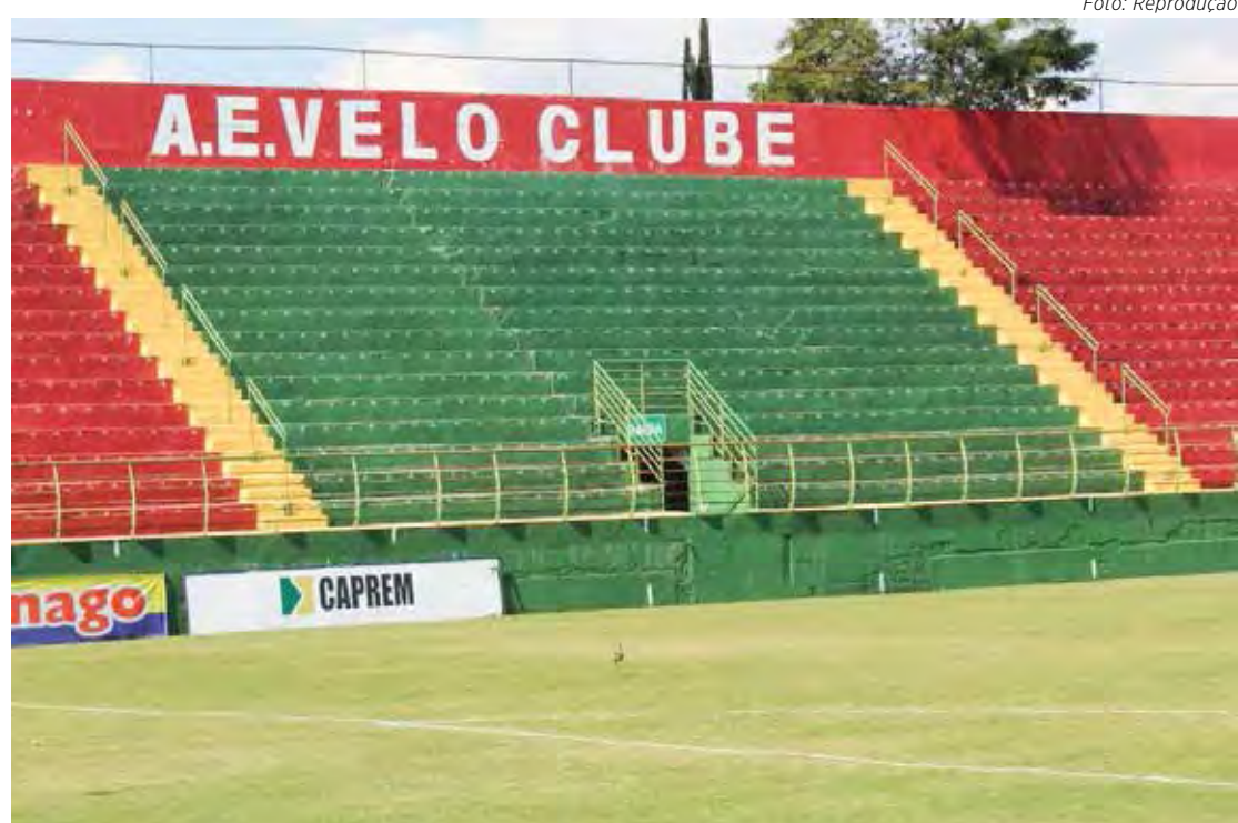
Benitão sofre furto de fiação elétrica

A exposição das pinturas de Osmar Santos acontecerá no Instituto Gustavo Rosa, no bairro Jardim Paulista, em São Paulo, no período de 21 a 30 de setembro.