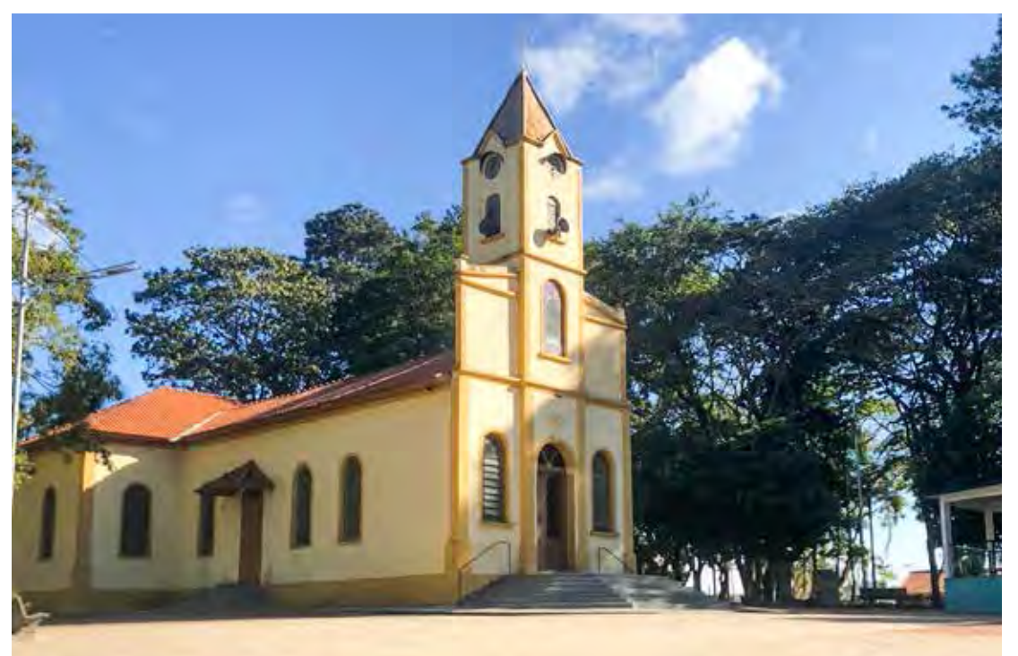
Exposição fotográfica será realizada hoje a partir das horas na praça central de Corumbataí

Através das fotografias exibidas, histórias são contadas sem