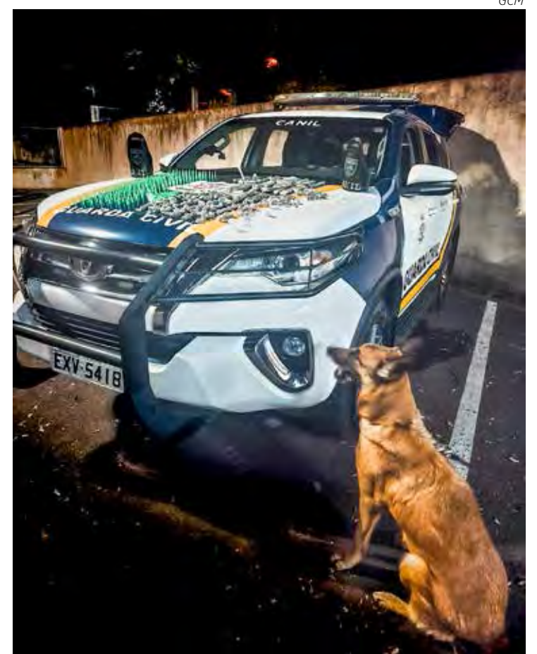
Cadela farejadora Madona, junto do resultado de seu trabalho com os GCMs: as drogas localizadas

Diante da atitude dos suspeitos e desconfiando de que poderiam estar praticando tráfico de entorpecentes, com o auxílio de Madona, a equipe realizou buscas no terreno e localizou 181 porções de aparentando ser maconha e 210 tubetes contendo substância análoga a cocaína, que foram apresentadas no Plantão Policial para o registro da ocorrência e consequentemente apreensão.