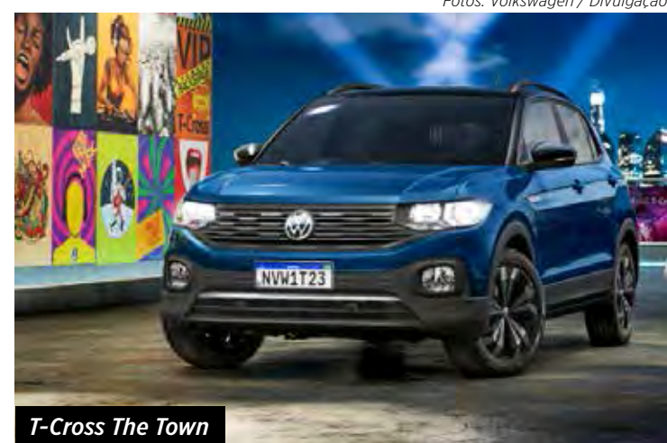
T-Cross The Town