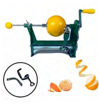
Descascador de laranjas