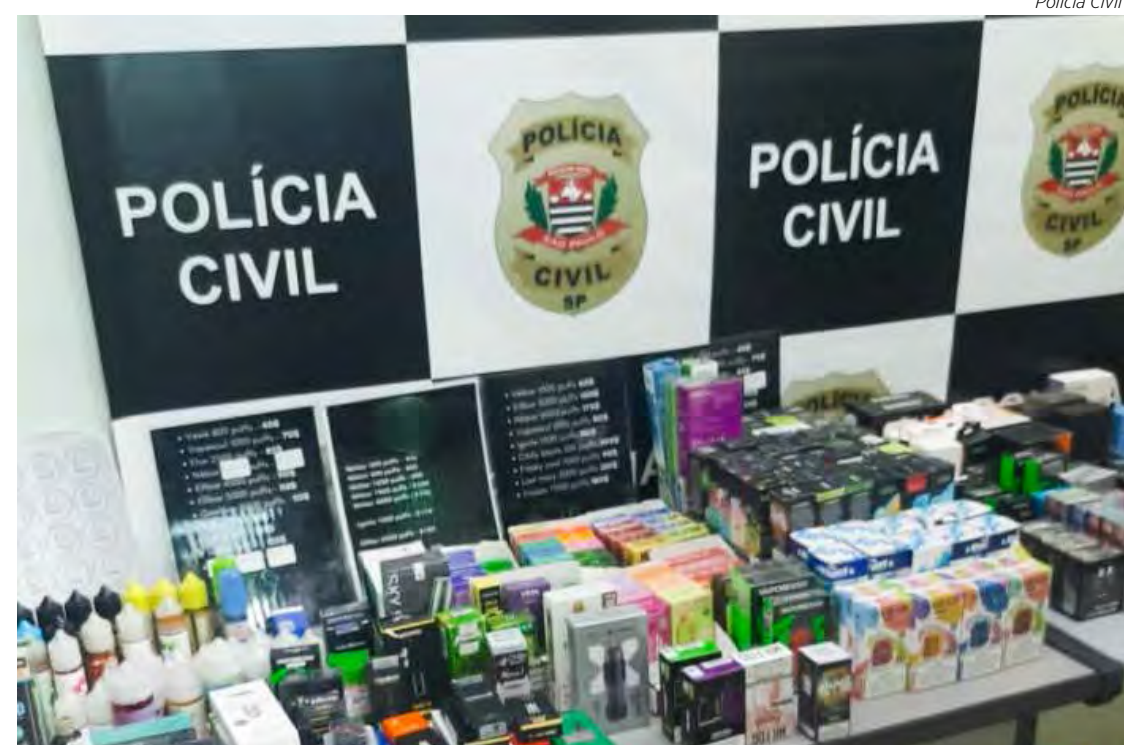
Dispositivos têm venda proibida pela ANVISA no Brasil

Ao chegarem ao local identificado como sendo onde os produtos eram armazenados, os agentes constataram que o comércio era feito