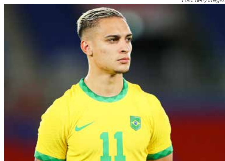
Anthony está fora da seleção

O fato repercutiu negativamente na imagem do jogador e a CBF achou por bem cortá-lo da seleção brasileira que jogará na próxima sexta-feira (8), no estádio Mangueirão, em Belém-PA, contra a Bolívia, às 21h45, em seu