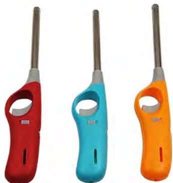
Acendedor elétrico de fogão