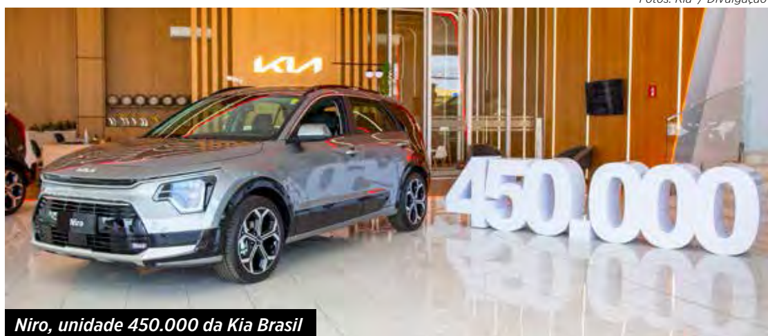
Niro, unidade 450.000 da Kia Brasil

O sucesso foi imediato com o utilitário Besta, rival da consagrada Kombi, e o jipe Sportage. "A trajetória de 30 anos da Kia Brasil pode ser traduzida por resiliência", disse José Luiz Gandini, presidente da empresa. "Passamos por momentos de altos e de baixos do setor de importação, ora com medidas go-