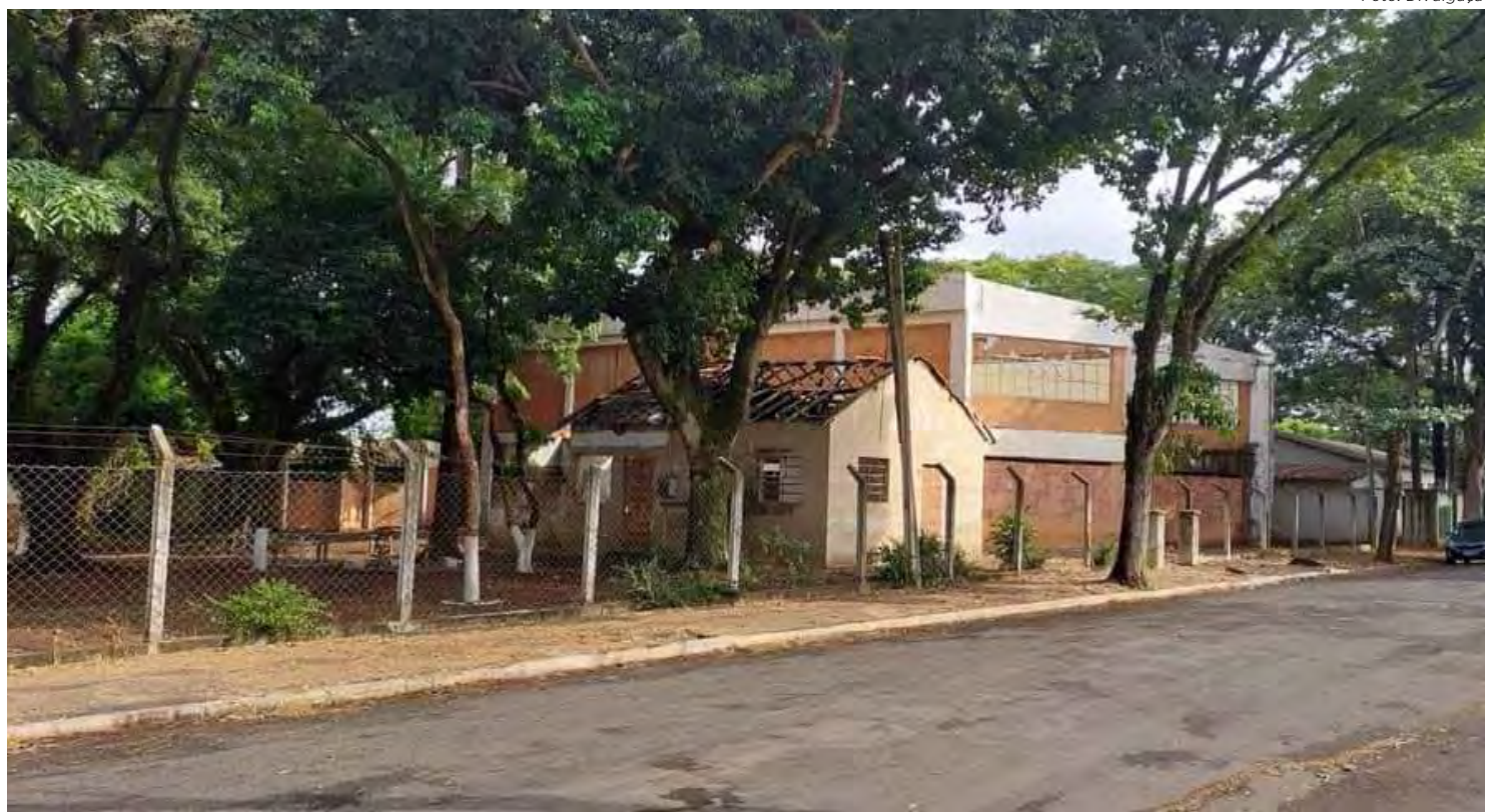
Campus do IFSP de Rio Claro será implantado em prédio localizado na Rua 11 no bairro Santana

De acordo com o edital, "as despesas para atender a licitação estão programadas em