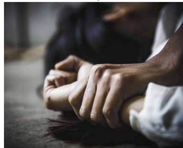
Um dos filhos do casal foi ferido tentando defender a mãe

Vizinhos relataram à Polícia que o homem também teria tentado incendiar o apartamento, abrindo o registro de gás. A tragédia só não foi maior ainda