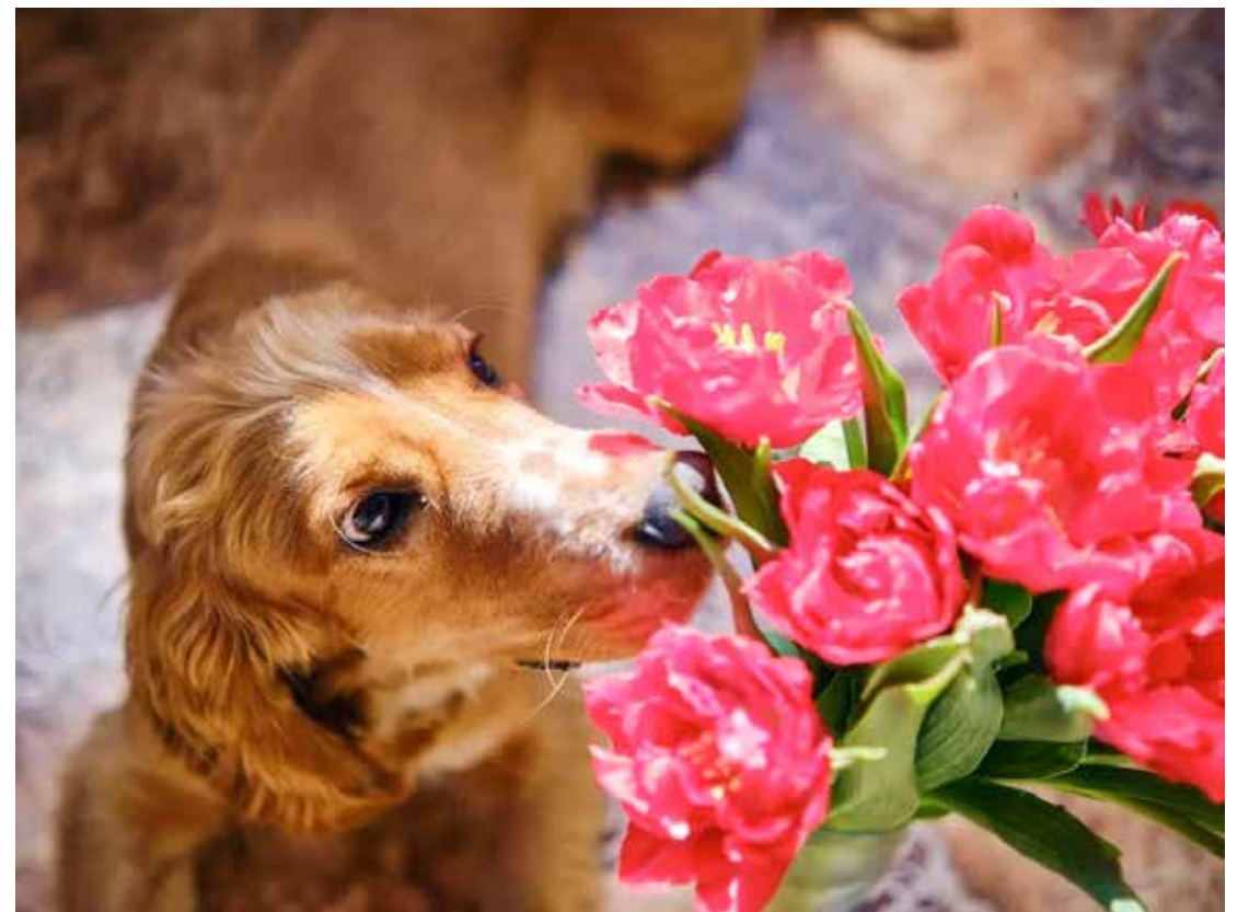
Alergias também podem ser causadas pelo pólen, ocasionando espirros e o desenvolvimento de rinites