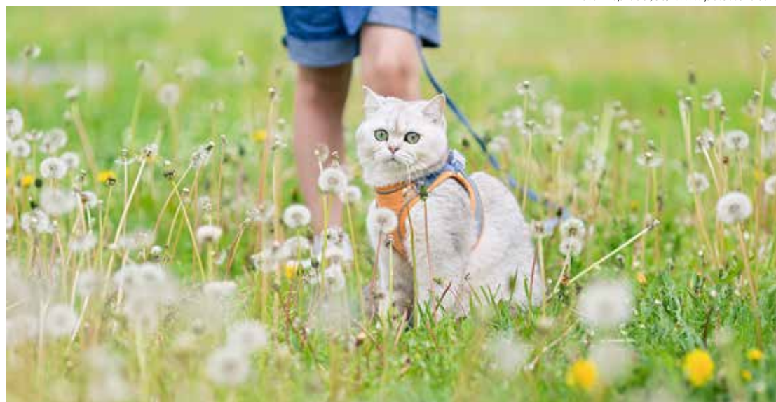
Os tutores precisam ter cuidados durante os passeios para evitar alergias

A primavera é considerada a estação mais confortável para os pets