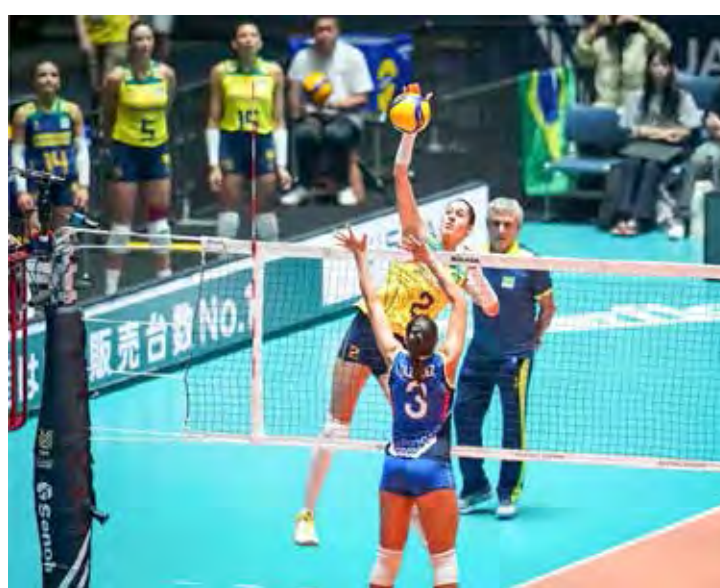
Vitória do Brasil no Pré-Olímpico de Vôlei

O Pré-Olímpico de Vôlei Feminino é disputado por 24 equipes divididas em três grupos com 8 equipes cada. As duas melhores de cada grupo garantem vaga para a Olimpíada de Paris 2024. O Brasil está no grupo B, com jogos disputados em Tóquio, e, divide o favoritismo da competição ao lado das anfitriãs japonesas e da seleção turca.