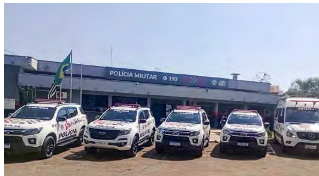
Viaturas mobilizadas pela corporação para fazer frente à demanda da operação