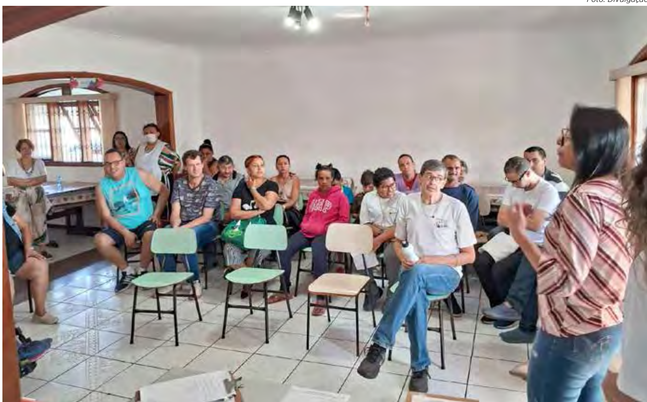
Cerca de 260 pessoas participaram das pré-conferências.

A palestra magna da conferência será de Célia Leão, que atua na luta pelos direitos das pessoas com deficiência. Célia ficou paraplégica aos 19 anos de idade, em decorrência de um acidente de automóvel. Casada e mãe de três filhos, atuou por sete mandatos na Assembleia Legislativa de São Paulo. Foi secretária de Estado dos Direitos da Pessoa com Deficiência, de 2018 a abril de 2022. E secretária de Desenvolvimento Social, de outubro de 2022 a dezembro. Hoje atua como consultora do Sebrae.