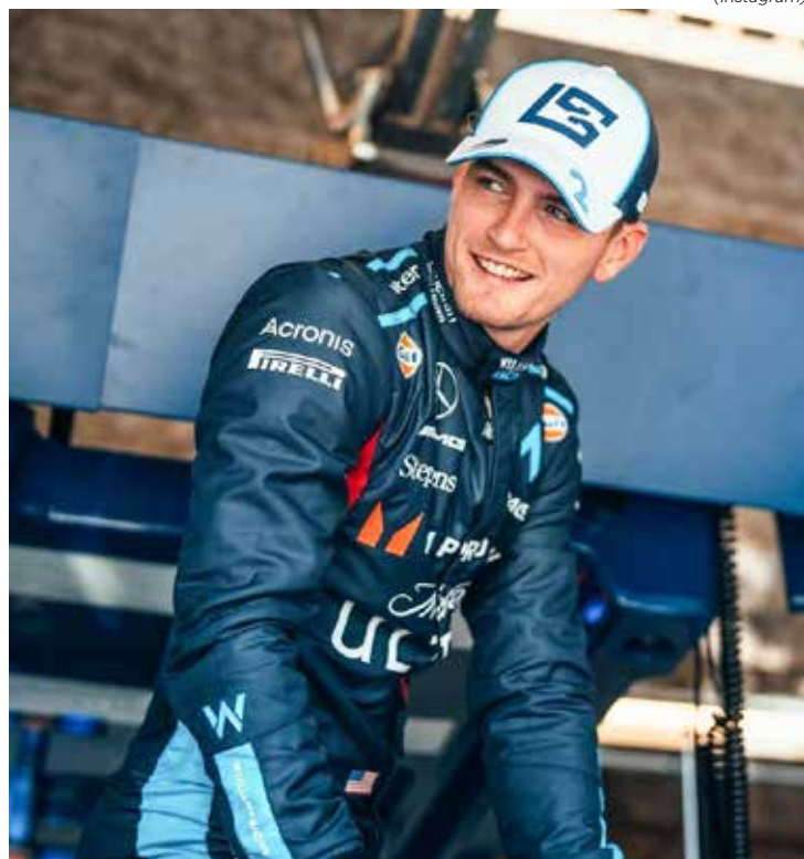
Norte-americano cruza a linha de chegada em P12, mas herdou duas posições