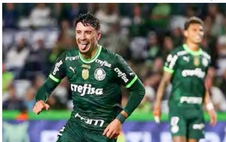
Piquez comemora gol contra o Coritiba

Jogando na Neo Química Arena, o Timão livrou-se no sufoco de derrota para o vice lanterna América, com empate de 1x1, conquistado já nos acréscimos da segunda etapa,