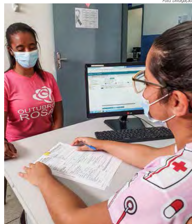
Unidades de saúde realizam atividades alusivas ao Outubro Rosa

A atividade está inserida na campanha Outubro Rosa, que destaca a importância do diagnóstico precoce do câncer de mama e câncer de colo de útero. O Corujão Rosa também conta com participação das secretarias municipais de Compras, Desenvolvimento Econômico, Mobilidade Urbana e Segurança. O evento tem apoio de As Patroas, Círculo Rioclarense de Orquidófilos, Instituto Tatu Bola, Vovó Carmela e Zenilda Podologia.