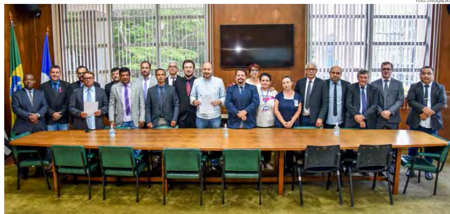
Vereadores e representantes da categoria participaram do ato de assinatura