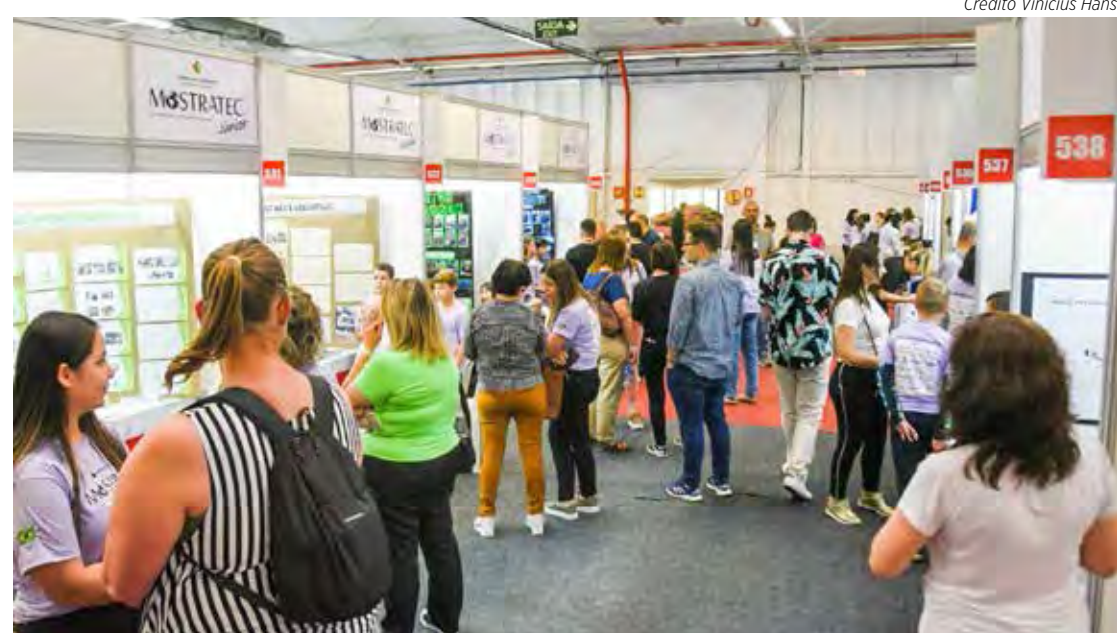
Estudantes de Rio Claro e outras cidades participam da Mostratec em Novo Hamburgo

Do estado de São Paulo são 30 trabalhos, sendo 18 de São Paulo, um de Rio Claro, um de Registro, dois de Campinas, quatro de Jundiá, dois de Monte Mor, um de Suzano e um de Presidente Pru-