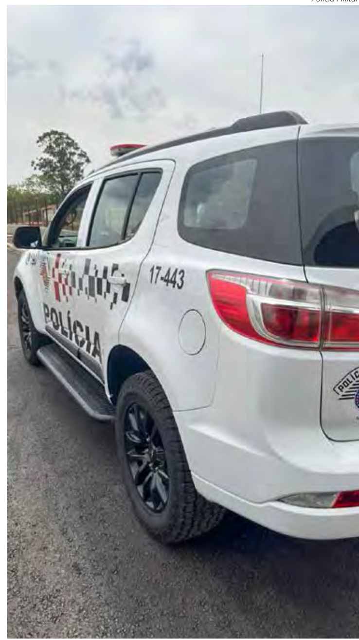
Policiais receberam denúncia do furto em andamento, via 190

Ele foi levado ao Plantão Policial onde ficou à disposição da Justiça.