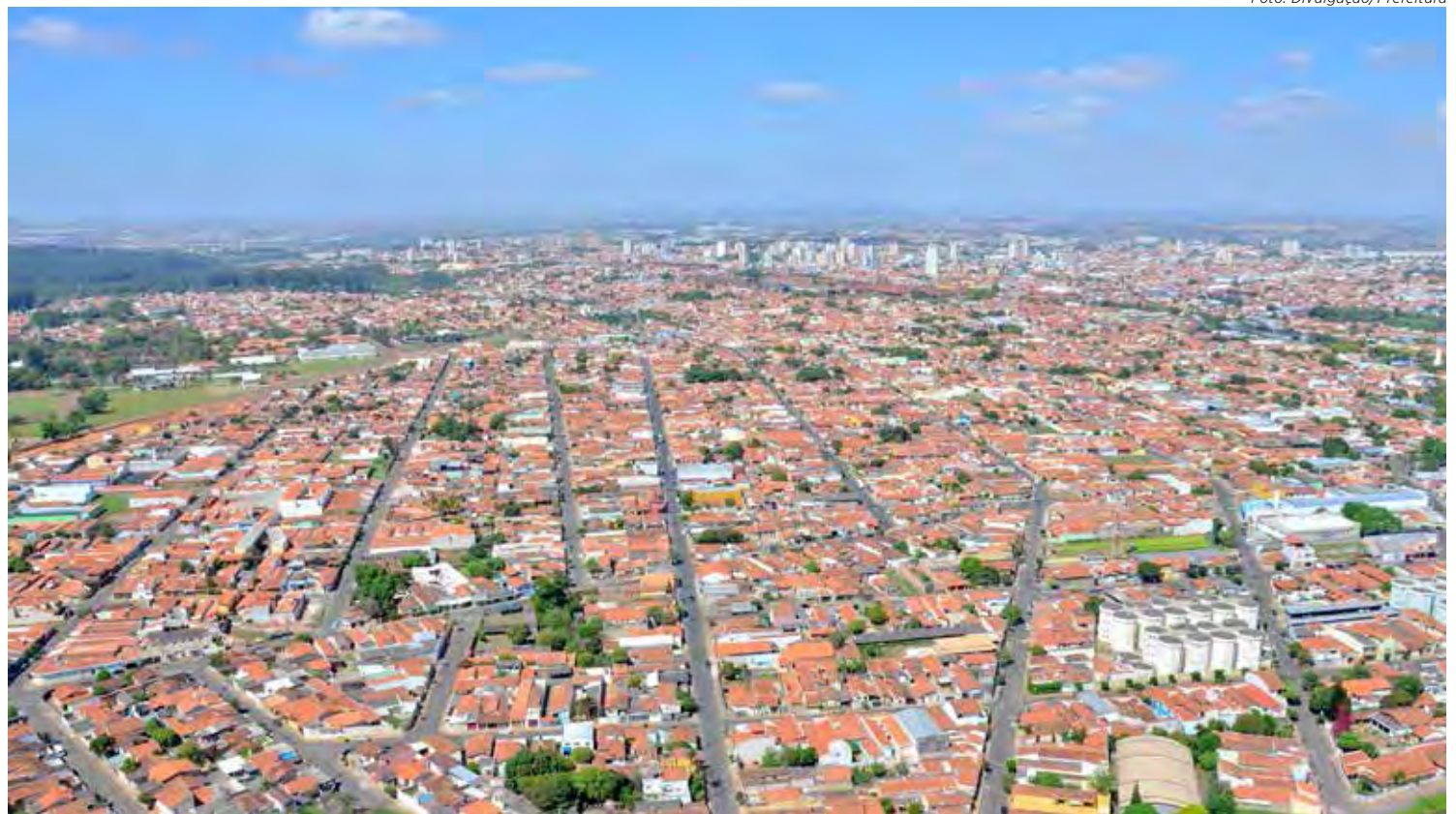
Vista aérea de Rio Claro que começou a receber o pagamento do IPTU 2024

Quando os carnês forem distribuídos pelos Correios e os contribuintes optarem pelo