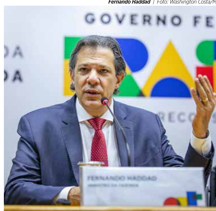
Fernando Haddad

Por fim, desejamos a todos um 2024 repleto de saúde, paz, felicidade e prosperidade, e que Deus continue nos iluminando. Feliz Ano Novo.