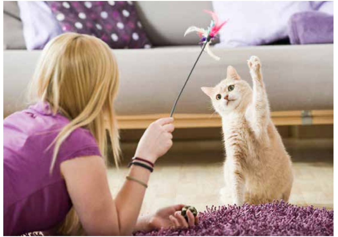
O serviço inclui muitas brincadeiras, gasto de energia, carinho e atenção