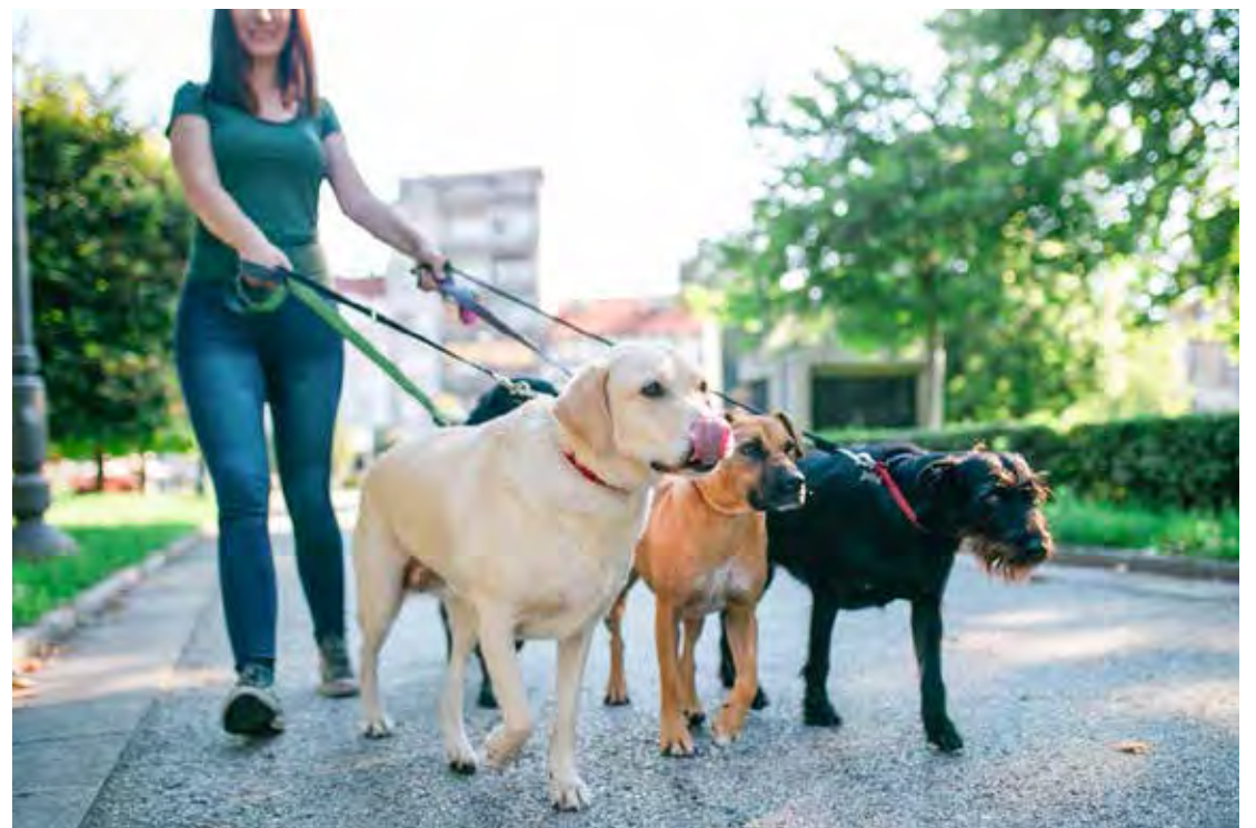
Passeios com os pets estão incluídos no serviço de pet sitter