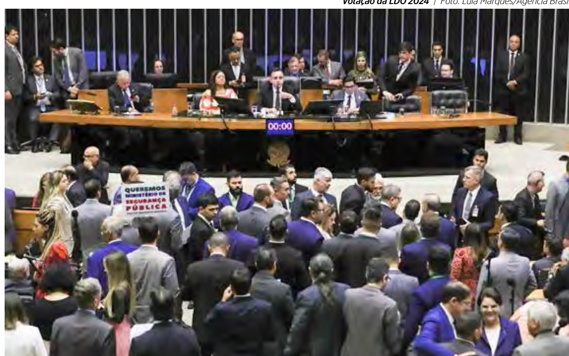
Votação da LDO 2024

O mês de outubro ainda está longe, mas a movimentação que envolve as eleições municipais deste ano já é grande no cenário político. É hora de definir alianças e apoios. De olho nas eleições, parlamentares querem derrubar veto do presidente Lula ao calendário de liberação de emendas previsto na LDO 2024. O dispositivo vetado por Lula prevê que as emendas impositivas, aquelas que o governo é obrigado a pagar, sejam empenhadas até o dia 30 de junho, ou seja, às vésperas das eleições. Além disso, se o governo não conseguir pagar até essa data, as emendas somente liberadas em novembro após as eleições. Daí o impasse. Os congressistas querem que o pagamento comece já em fevereiro com o objetivo de inflar o orçamento das prefeituras antes da campanha eleitoral. Como as emendas geralmente são "moedas de troca", as negociações entre Executivo e Parlamento devem se intensificar