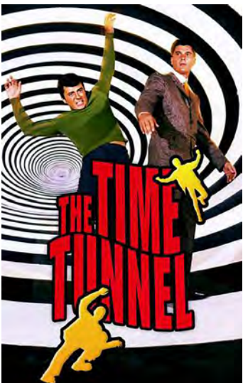
SÉRIE TÚNEL DO TEMPO

Beleza então.....!!! Hoje acordei bastante “saudosista”, mas no bom sentido. Relembrando algumas “coisas” geek que nos “idos” ainda não eram consideradas como tal, pois essa cultura emergiu muito de-