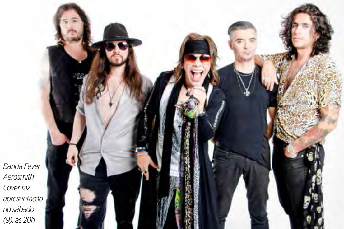
Banda Fever Aerosmith Cover faz apresentação no sábado (9), às 20h