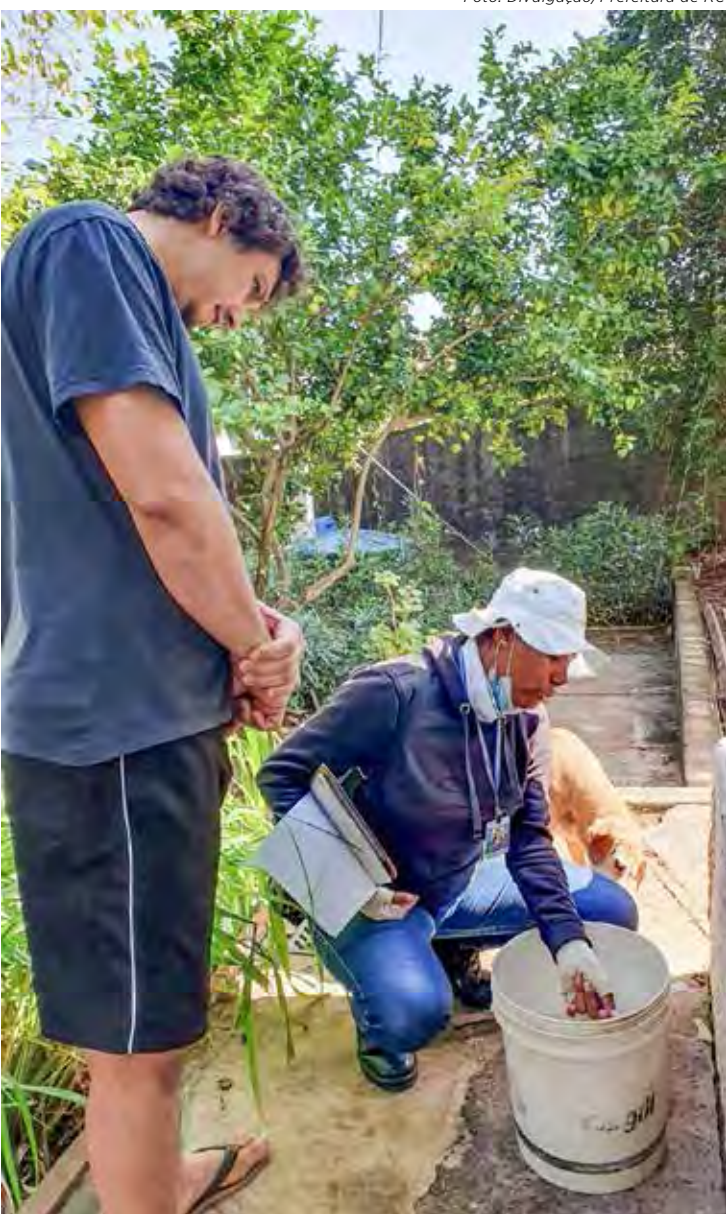
Eliminar os possíveis criadouros do mosquito é ação essencial de combate à dengue