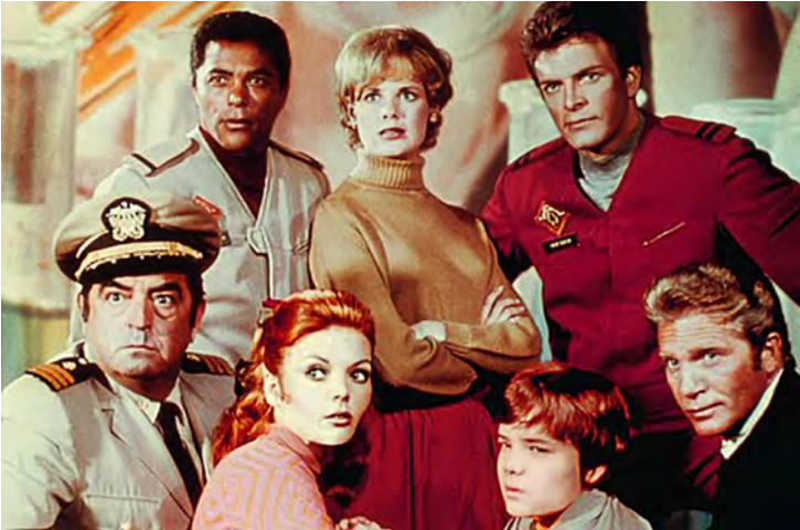
ELENCO TERRA DOS GIGANTES

governo gigante, foi através dessa narrativa que as críticas ao autoritarismo se tornaram mais marcantes na obra de Allen, aliás, IRWIN ALLEN, criador das inesquecíveis séries: Viagem ao fundo do mar (1964-1968), Lost In Spa-