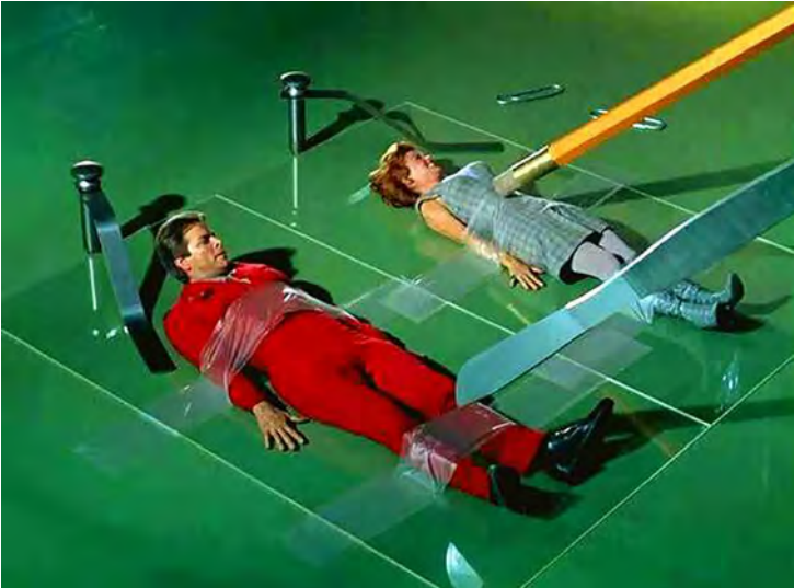
CENA DE TERRA DOS GIGANTES

Apesar desse contexto fantasiosos, a série abordava um tema político, referente a muitos países na época (1969 em diante). No mundo habitado pelos gigantes, imperava