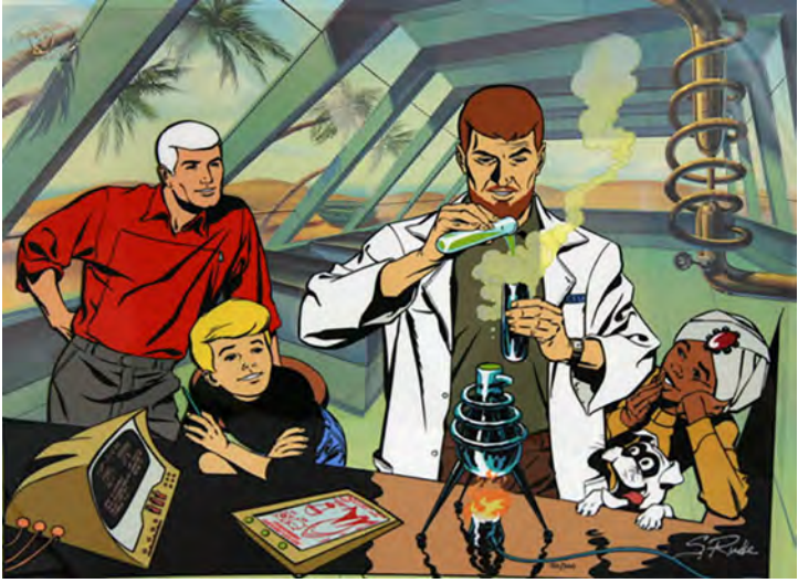
SÉRIE DESENHO – JONNY QUEST

16 e 17 março – CONEXÃO GEEK FEST – São Paulo- @conexaogeekfest