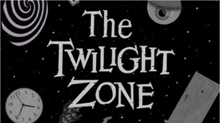
SÉRIE TWILIGHT ZONE

Em tempo: a música de abertura de Jonny Quest, é