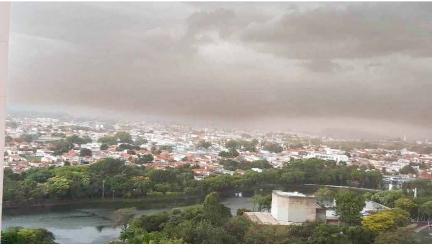
Nos últimos cinco anos o mês de fevereiro mais chuvoso aconteceu em 2020, com 315 milímetros, bem acima da média

Atendência é de que Rio Claro registre ainda alguns dias abafados com boas chances de chuvas nos períodos da tarde e noite.