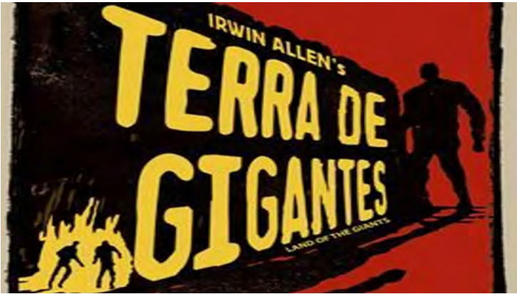
ABERTURA DA SÉRIE TERRA DOS GIGANTES

um regime autoritário, reminiscente das várias ditaduras presentes ao redor do globo na década de 60. Embora o seriado não deixasse explícito o viés ideológico do