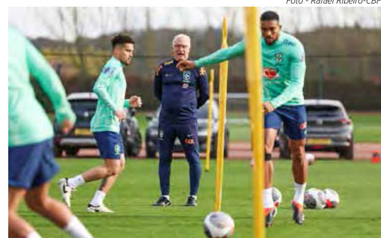
Técnico Dorival Jr. comanda primeiro treinamento à frente da seleção