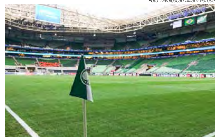
Palmeiras volta a jogar em sua casa

Santos x Red Bull Bragantino – Neo Química Arena, em São Paulo.