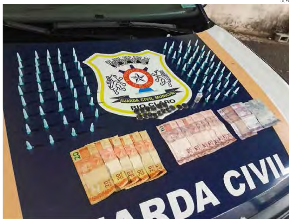
Objetos ilegais da ocorrência foram apreendidos

Em busca feita pelo local foi encontrada a quantia de R$ 64,00