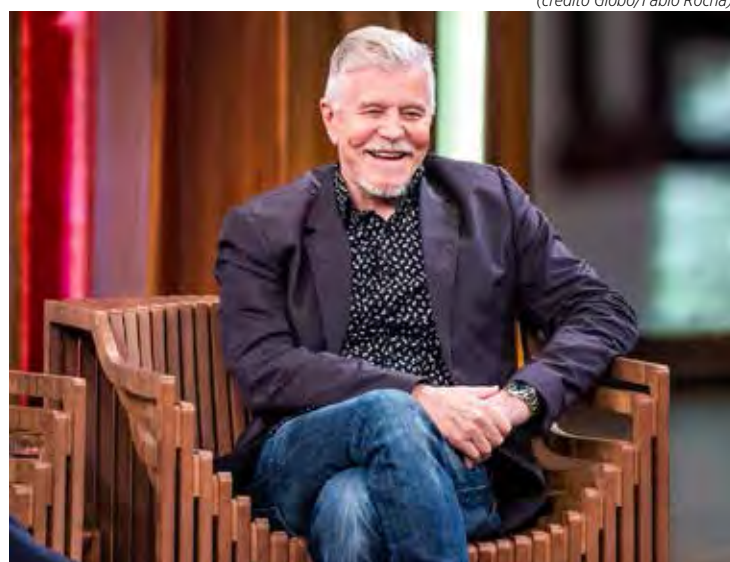
Miguel Falabella, ex-apresentador do Vídeo Show