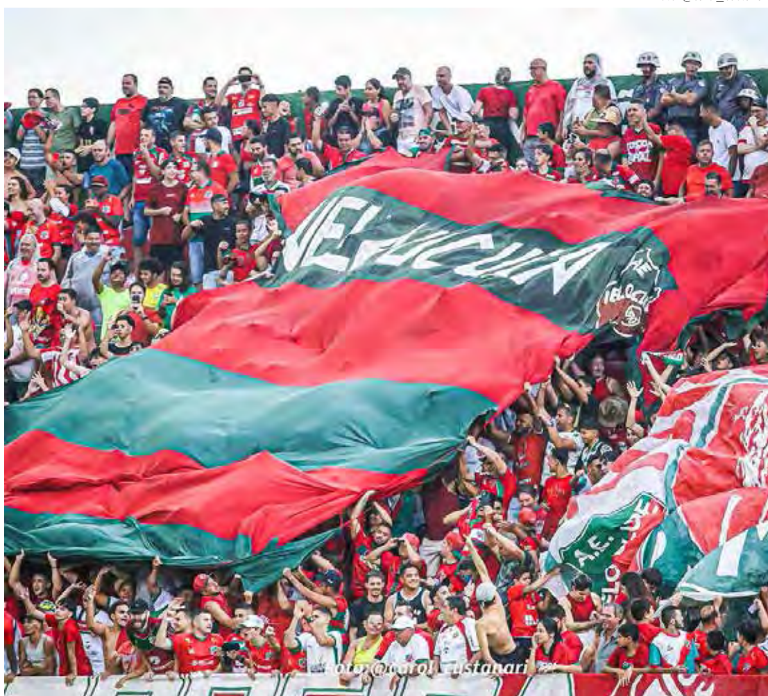
Torcida velista promete lotar o Benitão, no próximo sábado (23)