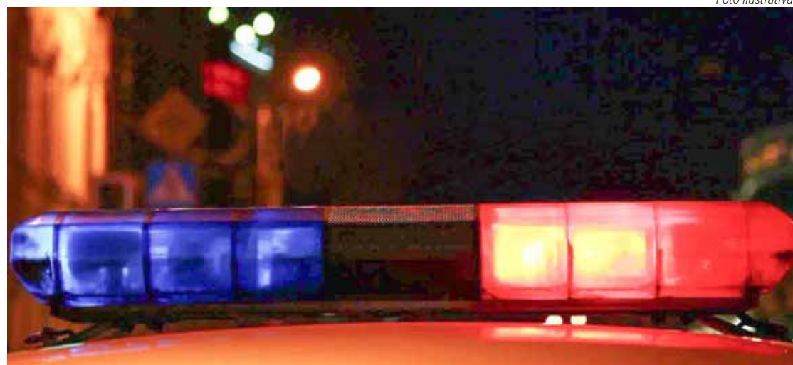
Um deles tentou fugir, mas acabou sendo alcançado e capturado

Equipe de Força Tática durante saturação pelo bairro Jardim Guanabara abordou um indivíduo e após pesquisa via COPOM, foi constatado que havia um Mandado de Prisão em seu desfavor, pelo crime de resistência e desobediência. Diante dos fatos, foi conduzi-