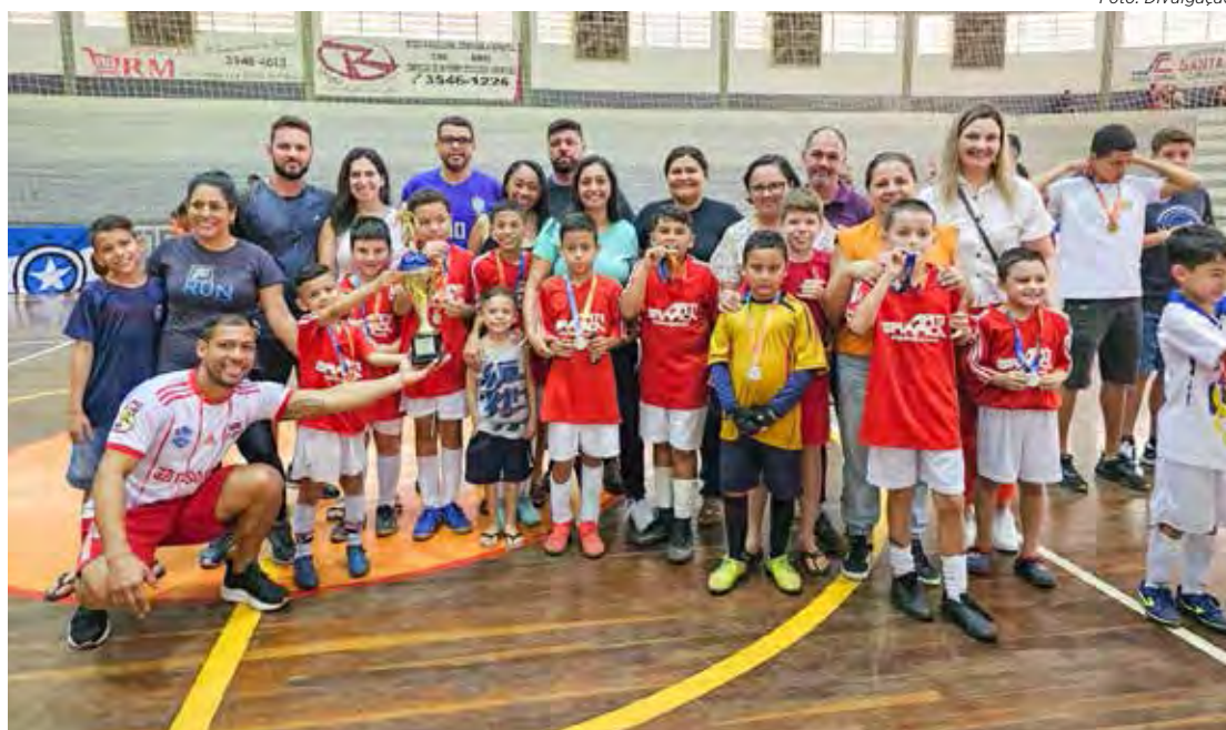
Festa da garotada do Futsal de Cordeirópolis