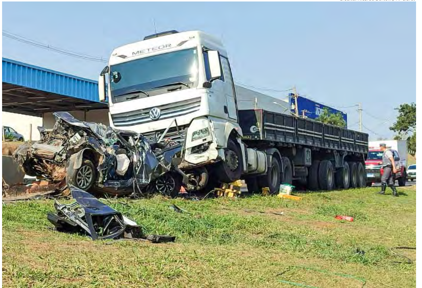
Um homem morreu em um engavetamento na tarde de ontem na Rodovia Washington Luís (SP-310) em Santa Gertrudes. O carro foi prensado pelo caminhão e ficou totalmente destruído. O motorista ficou preso nas ferragens. Página 6