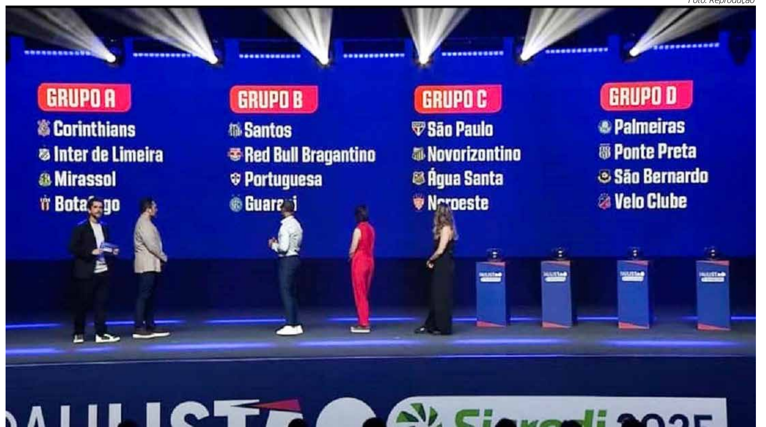
Sorteio definiu grupos do Paulistão 2025

A Federação Paulista de Futebol deve definir nos próximos dias, a tabela de jogos do campeonato, que terá 12 rodadas na primeira fase, classifica-