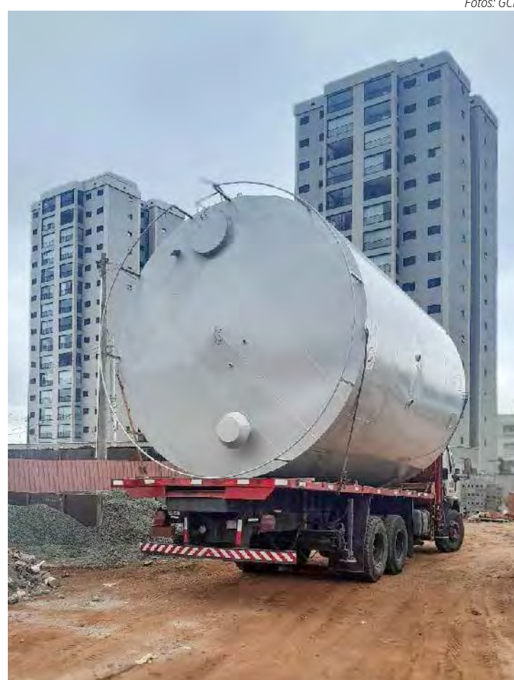
A Guarda Civil Municipal registrou um Boletim de Ocorrência

da caixa d'água ultrapassou o limite permitido, resultando em danos aos cabos e estruturas da fiação em várias ruas. Ao serem questionados, os responsáveis pelo transporte informaram que possuíam apenas autorização para o tráfego na rodovia, mas não dentro do município. Esse descumprimento da regulamen-