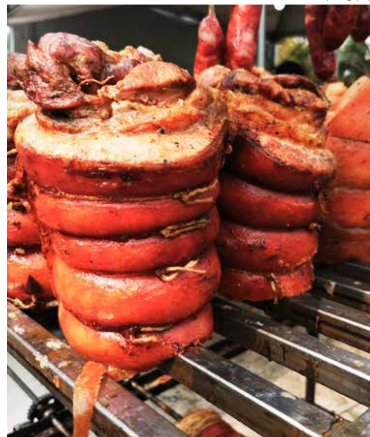
Haverá também torresmo, churrasco, espetinhos, e muitas outras delícias gastronômicas

A Festa Nordestina de Rio Claro é uma realização da MK Produções e Eventos, com apoio cultural da prefeitura de Rio Claro. O evento visa promover a integração cultural e proporcionar momentos de lazer e diversão para a comunidade local e visitantes.