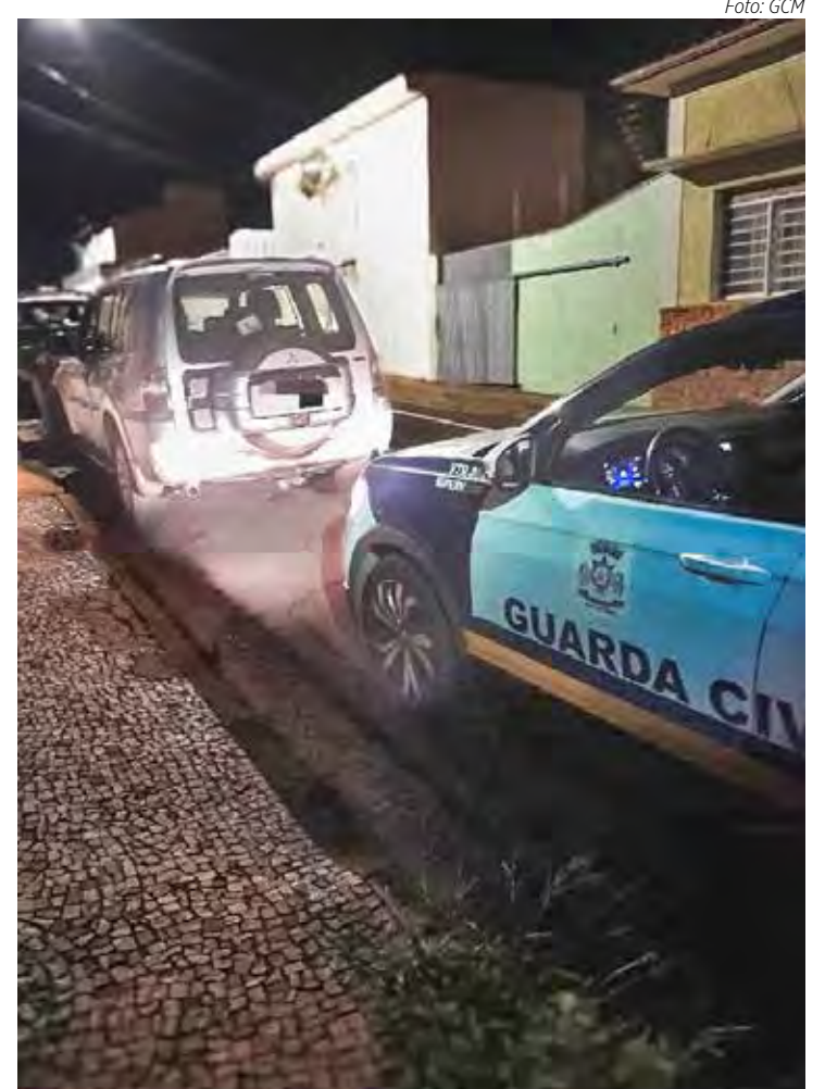
O proprietário foi imediatamente notificado

Após a localização, o veículo foi encaminhado ao Plantão Policial para o registro do Boletim de Ocorrência, com a classificação de "Localização/Apreensão/Entrega de Veículo." Finalizados os trâmites legais, a Pajero foi devolvida ao proprietário, encerrando o caso sem maiores complicações.