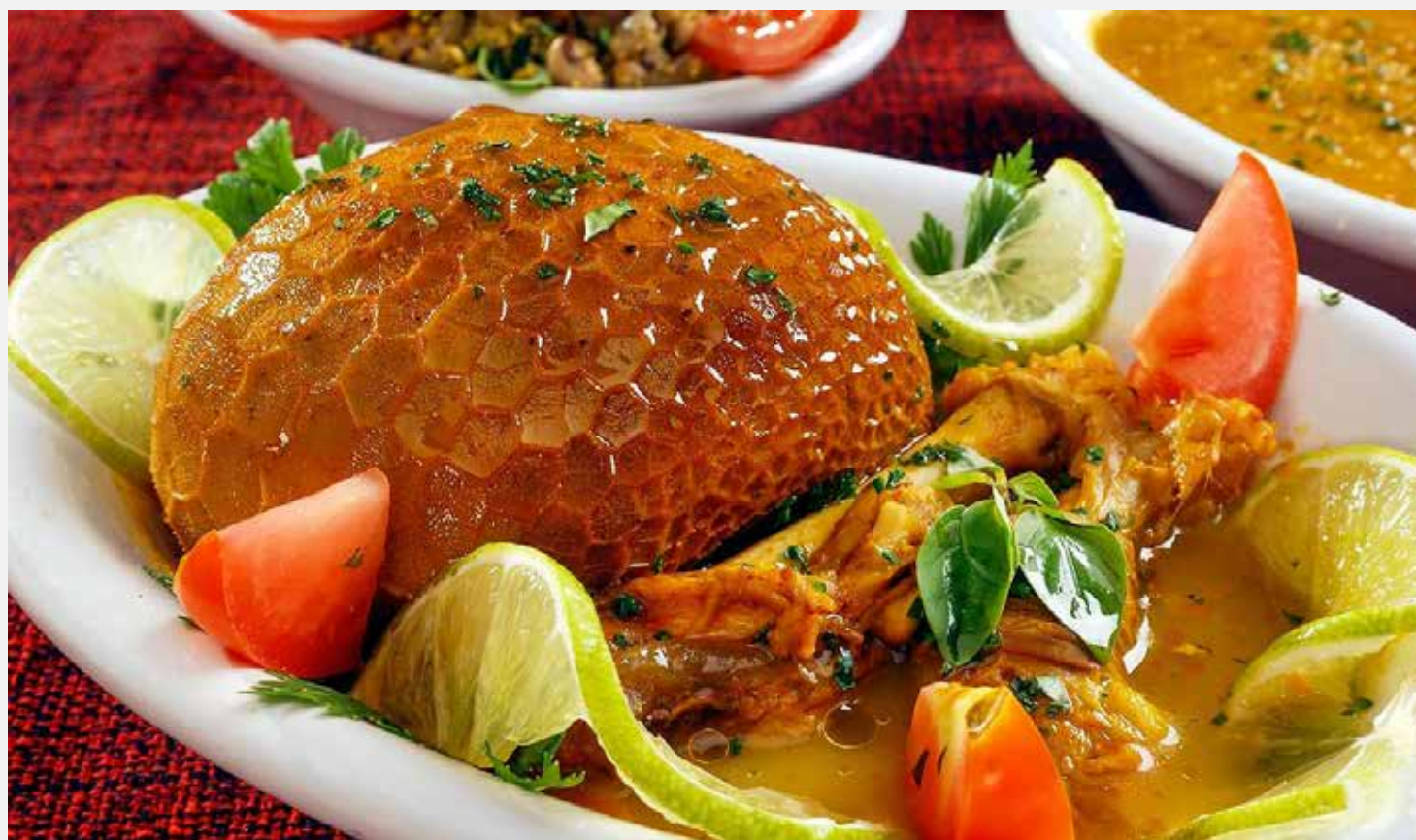
A gastronomia nordestina será um dos grandes destaques do evento

Horários: quinta-feira, 14/11: 18h às 23h / sexta-feira (feriado), 15/11: 12h às 23h / Sábado, 16/11: 12h às 23h / Domingo, 17/11: 12h às 22h