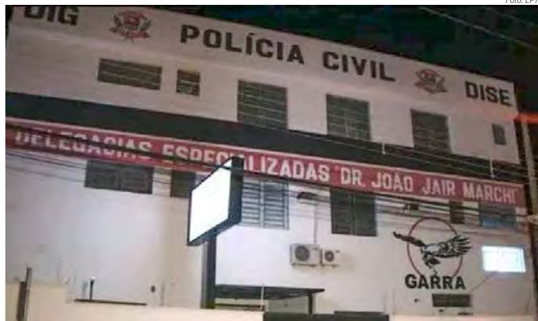
O crime foi denunciado pela empresa e passou a ser investigado pela delegacia especializada

De acordo com a corporação, as empresas que compraram os produtos diretamente da ex-funcionária podem ser processadas por receptação