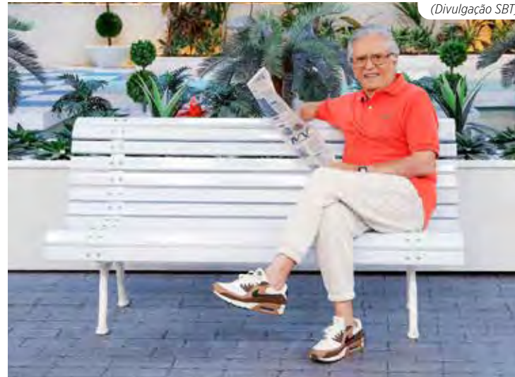
Carlos Alberto de Nóbrega

O “Provoca”, do Marcelo Tas, da próxima terça-feira, às 22h na TV Cultura, será especial. Tas vai