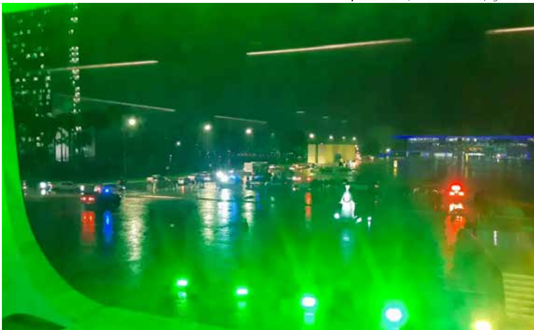
Explosão no STF

Deputados. Segundo ela, a a escala 6x1 é desumana. A parlamentar tem se engajado nas redes sociais para pressionar os deputados a assinarem o requerimento de apoio à PEC, que precisa de 171 assinaturas para ser apresentada oficialmente. Até o momento, Érica conseguiu metade dos apoiantes necessários. Será que vai dar?