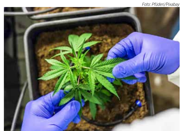
STJ libera o cultivo de cannabis (maconha) exclusivamente para fins medicinais

A liberação da cannabis para fins medicinais foi decidida a partir de um recurso de uma empresa de biotecnologia que buscava garantir a exploração industrial no Brasil. Apesar de a importação ser autorizada pela Anvisa, os insumos se tornam caros no mercado nacional.