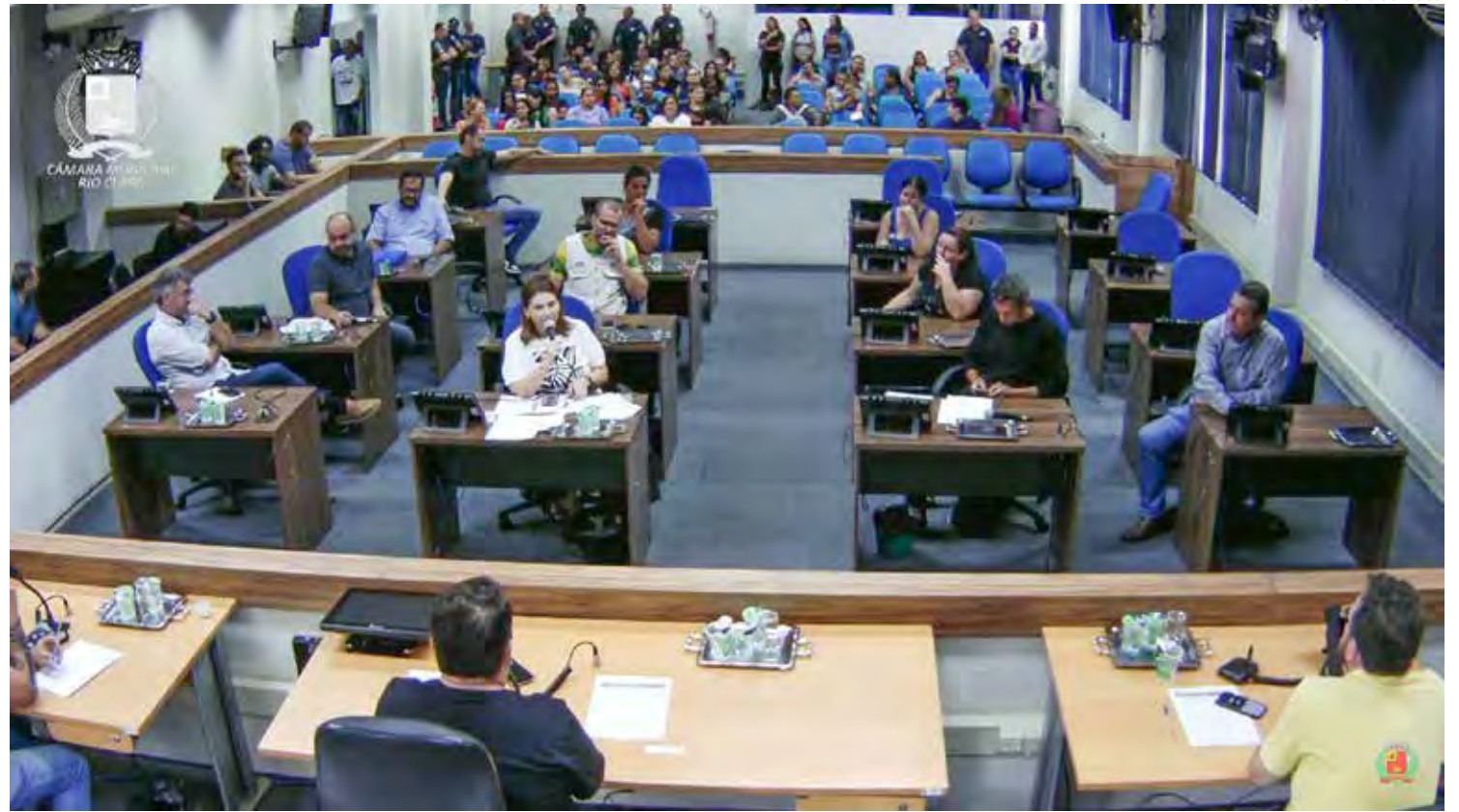
Reunião foi realizada na tarde desta quarta-feira (13) no plenário da Câmara Municipal

O representante iniciou a reunião alegando que a empresa não tinha recebido o repasse da prefeitura. O secretário de Finanças apresentou recibo de pagamento realizado nesta quarta-feira (13) no valor de R$ 776.409,02, referente à nota fiscal de outubro. Diante disso, os vereadores cobraram da empresa uma data para efetuar o pagamento.