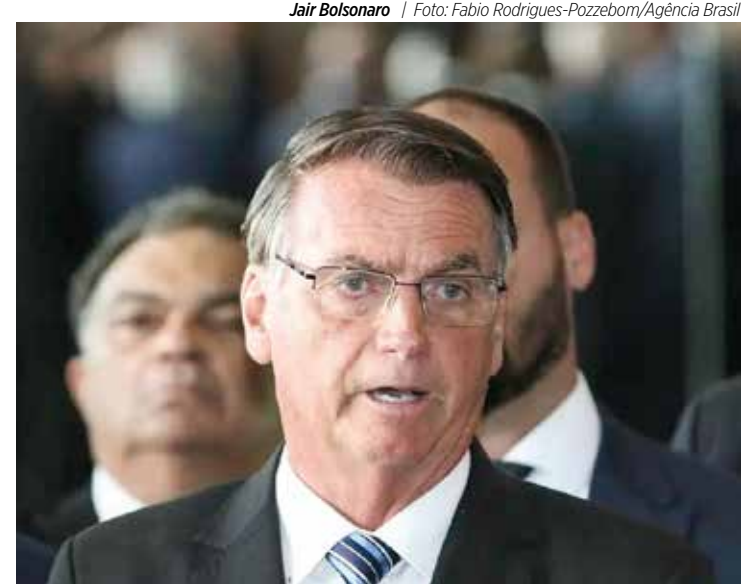
Jair Bolsonaro

• Inelegível até 2023, o ex-presidente Jair Bolsonaro (PL) ainda não jogou a toalha e tem esperanças de ser candidato a presidente da República em 2026. Em entrevista nesta quarta-feira (22), ele disse que as eleições de 2026