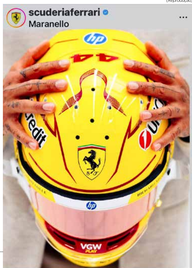
Capacete amarelo foi revelado inicialmente nas redes sociais

Em 2007, quando estreou pela McLaren, o britânico utilizou um casco amarelo que remetia ao design utilizado pelo ídolo Ayrton Senna. O layout se manteve quase inalterado até 2013, quando se mudou para a Mercedes.