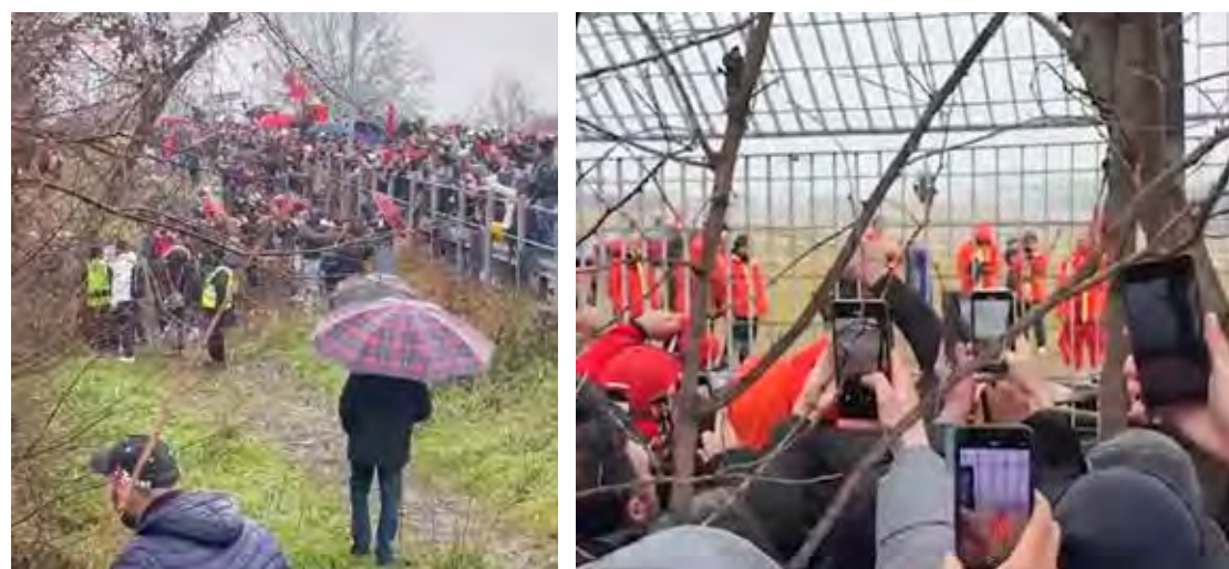
A aguardada estreia na Ferrari foi acompanhada por milhares de fãs