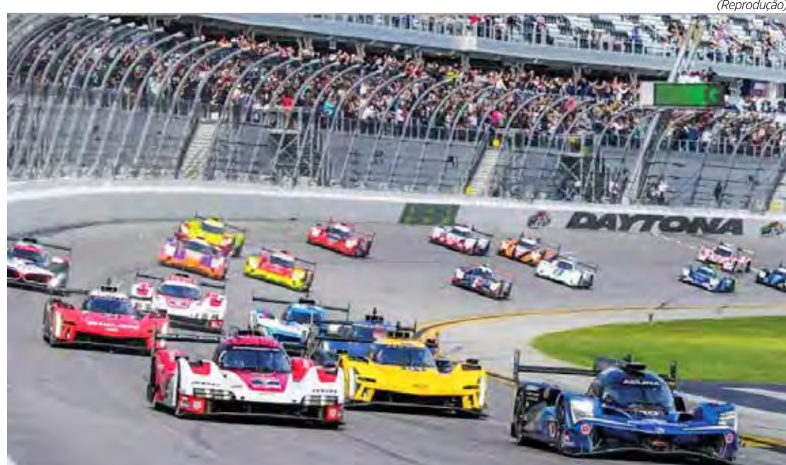
Com oito brasileiros, IMSA SportsCar abre temporada com as 24H de Daytona

Ao todo são 61 carros inscritos e mais de 200 pilotos na pista do Daytona International Speedway, circuito oval localizado em Daytona Beach, no estado americano da Flórida.