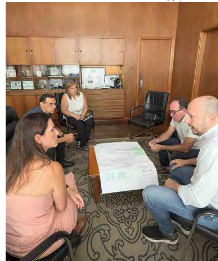
Reunião aconteceu ontem no gabinete do prefeito Gustavo