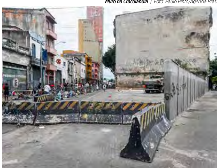
Muro na Cracolândia

• Apesar de polêmica, essa não foi a primeira vez que os Estados Unidos deixaram a OMS sob o comando de Trump. Em 2020, em plena pandemia de Covid-19, se retirou formalmente da organização pela primeira vez, deixando de repassar dinheiro à entidade. No entanto, a medida foi revertida pelo seu sucessor Joe Biden. Agora, nova saída. A OMS lamentou a decisão de Trump e disse que espera que ele volte atrás, o que parece improvável. A saída dos