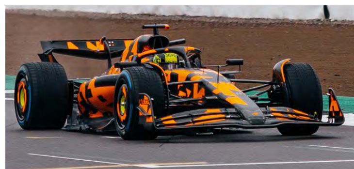
McLaren MCL39 2025 carro certo, cores incertas