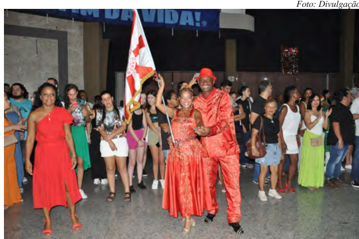
A escola Grasifs abre as apresentações a partir das 20h

de muita diversão. O público poderá assistir apresentação das quatro escolas de samba de Rio Claro: Grasifs (20h),