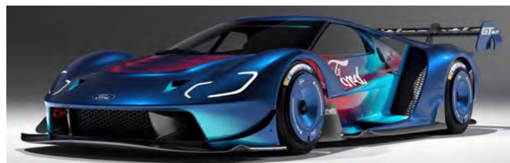
A Ford confirmou, só não divulgou o desenho oficial