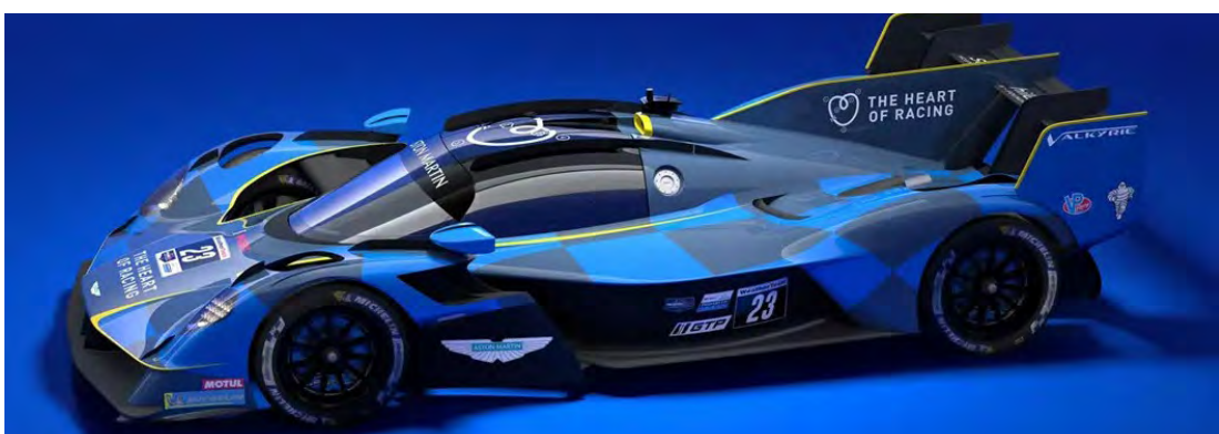
Aston Martin Valkyrie Azul #23 na IMSA

Podemos nos considerar privilegiados, todos nós.