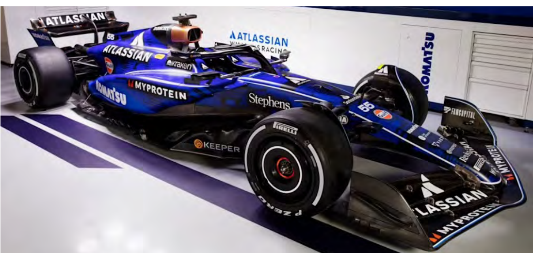
Genesis (Hyundai) para IMSA e WEC