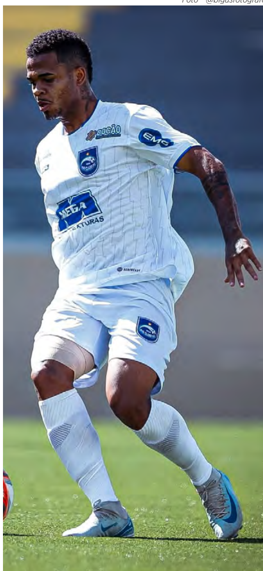
Rio Claro FC joga esta tarde no Schmidtão pela Série A2.

Mesmo fora do G8, o grupo das equipes que se classificam às quartas de finais do Paulistão, as chances matemáticas ainda existem e são consideradas por todos no Rio Claro.