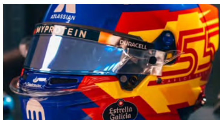
Capacete do Carlos Sainz. Aqui tudo certo