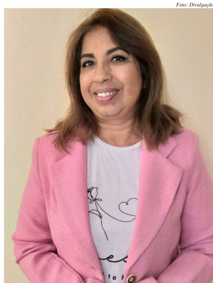
Autora de Rio Claro lança seu primeiro livro solo no próximo dia 15 de fevereiro