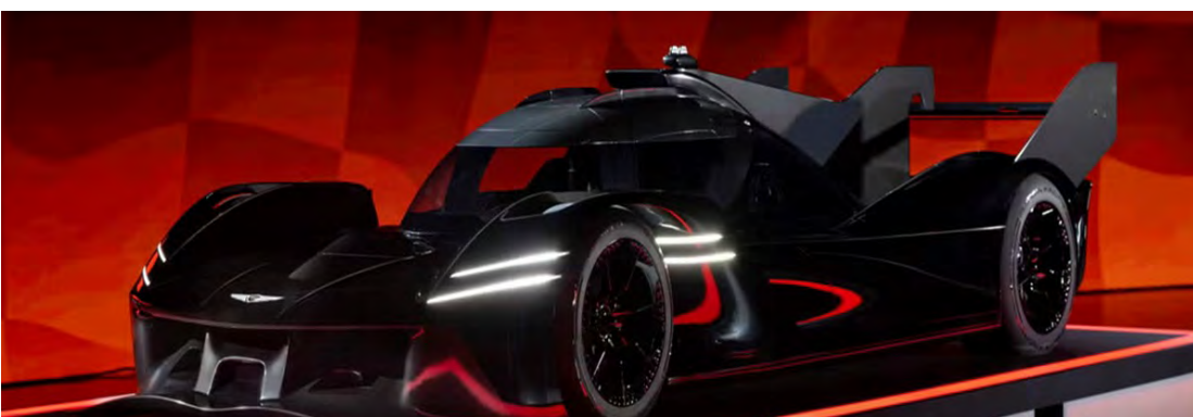
Genesis (Hyundai) para IMSA e WEC