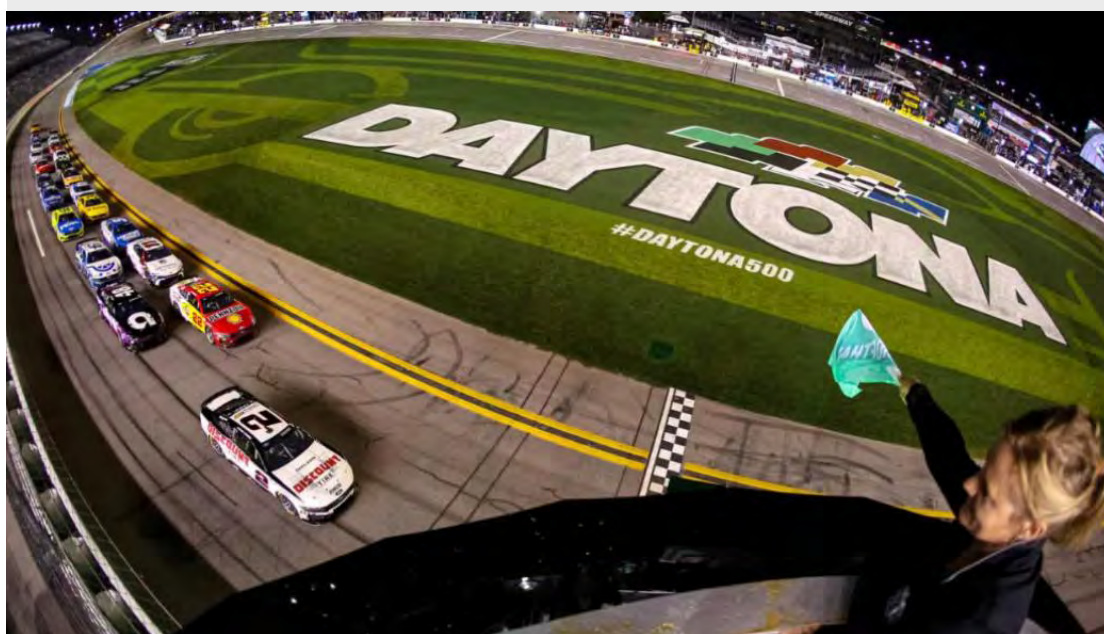
Temporada 2025 da NASCAR Cup Series será aberta com a lendária Daytona 500 (Reprodução)

A largada é neste domingo, 16 de fevereiro, às 16h30 (horário de Brasília), com transmissão pelo canal da NASCAR no YouTube.