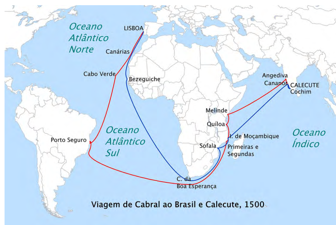
Viagem de Cabral ao Brasil e Calicute, 1500.

Referências: FRANÇA, Jean Marcel Carvalho. A Relação do Piloto Anônimo. São Paulo: Cultura Acadêmica, 2020 (e-book). Disponível em: https://www.culturaacademica.com.br/catalogo/a-relacao-do-piloto-anonimo/ . Acesso em: 09 fev. 2025. Wikipédia, a enciclopédia livre. Viagem de Cabral ao Brasil e Calicute (Mapa). Disponível em: https://pt.wikipedia.org/wiki/Pedro_%C3%81lvaes_Cabral#/media/Ficheiro:Cabral_voyage_1500_PT.png . Acesso em: 09 fev. 2025.