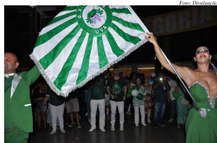
A UVA assume o palco a partir das 23h

Os ingressos custam R$ 30,00 e podem ser adquiridos na secretaria do clube. As portas