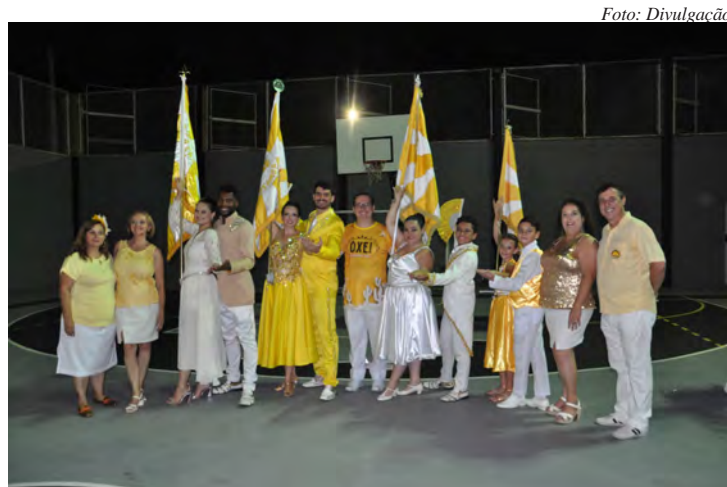
A Casamba vai animar a noite no GG a partir das 22h

Depois das apresentações das escolas de acesso Ritmo Alvinegro e Embaixadores do Samba nesta sexta-feira (14), o Sambas e Bandeiras continua neste sábado com promessa