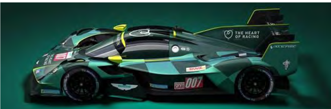
Aston Martin Verde #007 e #009 no WEC