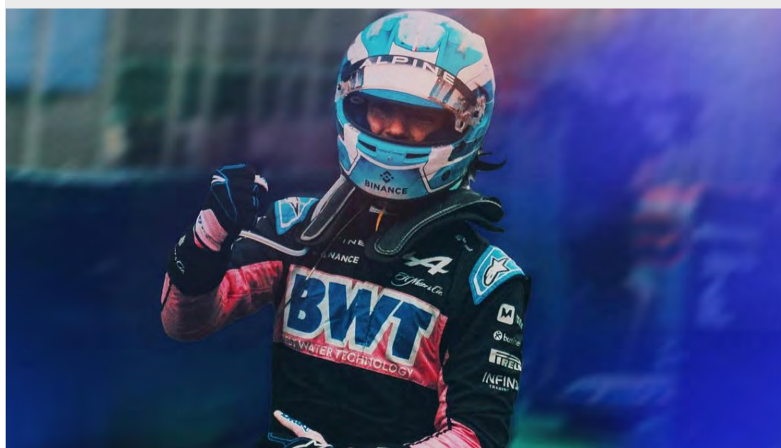
Na Fórmula 1, o piloto já participou de três treinos livres com a equipe

RY terá sua marca estampada no A525 da equipe, que disputará as 24 corridas da temporada 2025. Georgios Frangulis, fundador e CEO da OAKBERRY, destacou a importância estratégica dessa parceria.