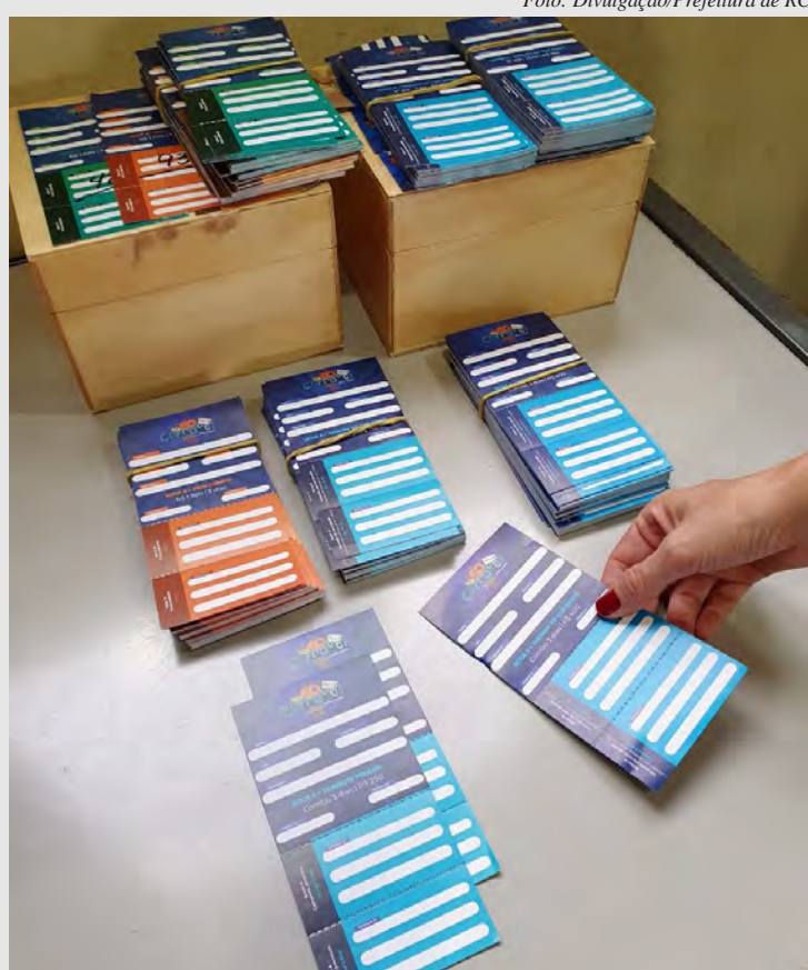
Rio Claro realiza neste sábado (15) plantão de vendas de ingressos para o carnaval

O carnaval de Rio Claro terá desfiles nas noites de sábado, domingo, segunda e terça-feira, no espaço localizado entre a Avenida Brasil e a Rua 3-A, no Jardim América.