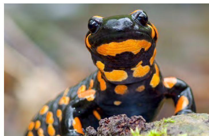
Inspiração na Lagartixa da Mata Atlântica para a McLaren