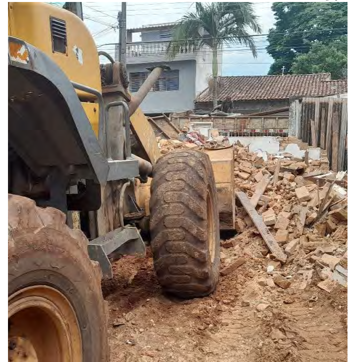
Filhotes de gato resgatados após demolição de imóvel em Rio Claro