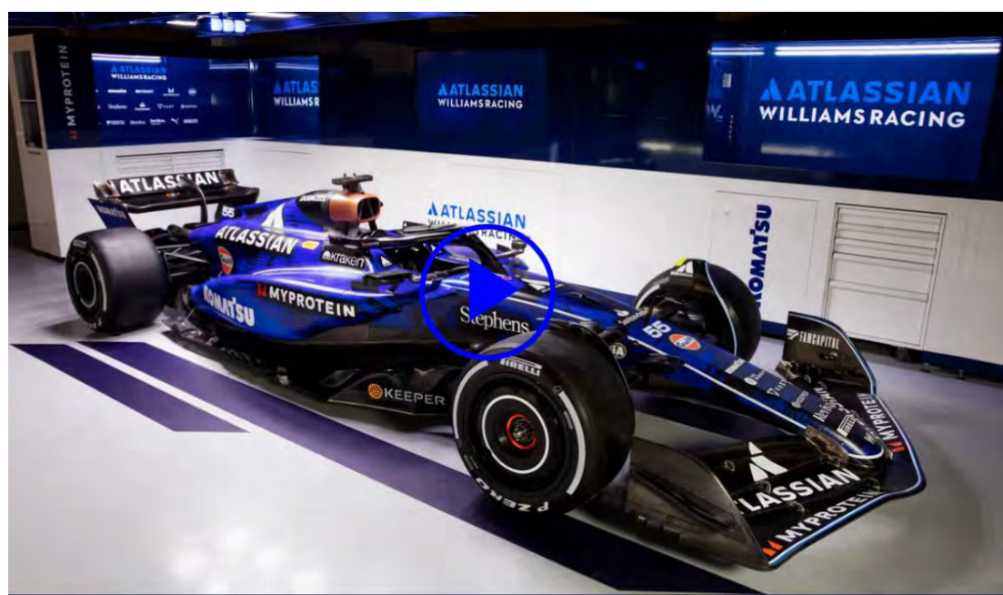
Carlos Sainz estreia na pista com o carro da Williams de 2025

Antes disso, porém, a Haas fará um shake-down de seu novo carro neste domingo, pela Racing Bulls na segunda-feira. No dia 19, a apresentação ficará por conta do novo carro da Ferrari.