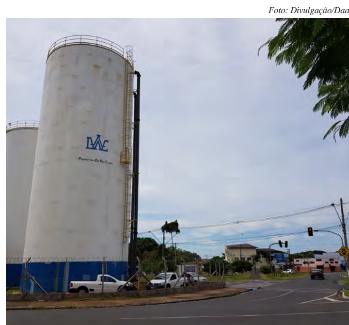
Daae fará manutenção em reservatório de água

De acordo com o Departamento de Engenharia, Obras e Planejamento do Daae, este serviço de limpeza não ocasiona falta d'água porque foram feitas interligações na rede já existente naquele trecho. Após a conclusão da limpeza, o reservatório será reintegrado ao abastecimento daquela região.