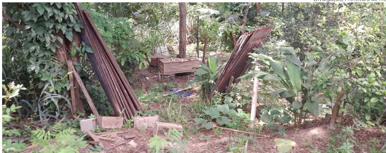
Área degradada com acúmulo de entulho foi identificada próximo ao condomínio Vila do Horto.

Materiais como pisos, telhas e móveis foram encontrados descartados irregularmente; secretaria de meio ambiente fará análise técnica