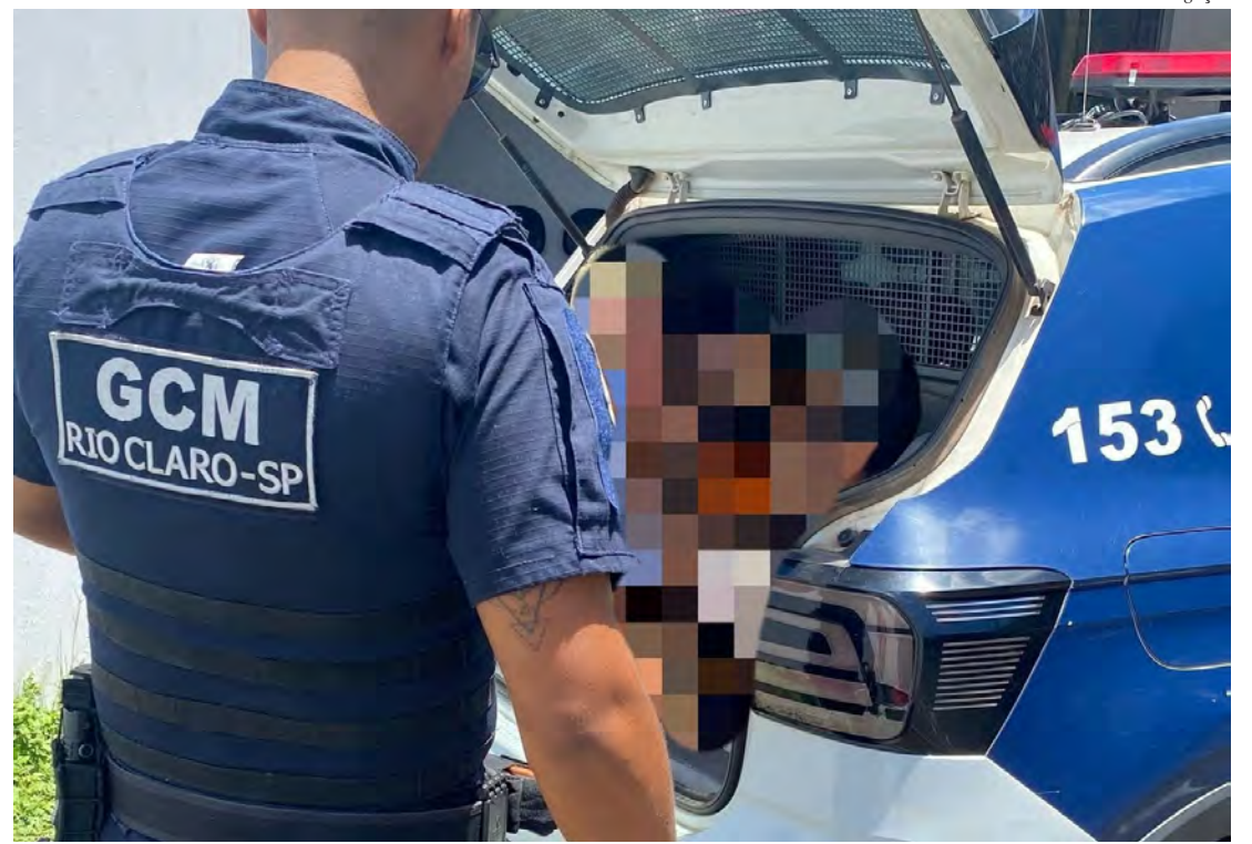
Guarda Civil Municipal prende suspeitos de furto e captura foragido da justiça na Vila Indaiá.

A Guarda Civil reforça a importância de denúncias da população para combater crimes patrimoniais e evitar que locais abandonados sejam alvos frequentes de furtos e invasões.