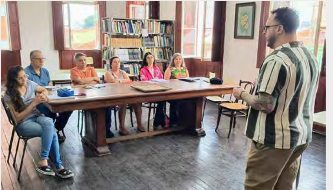
A Alerc-SP realiza atividades sobre literatura no Gabinete de Leitura