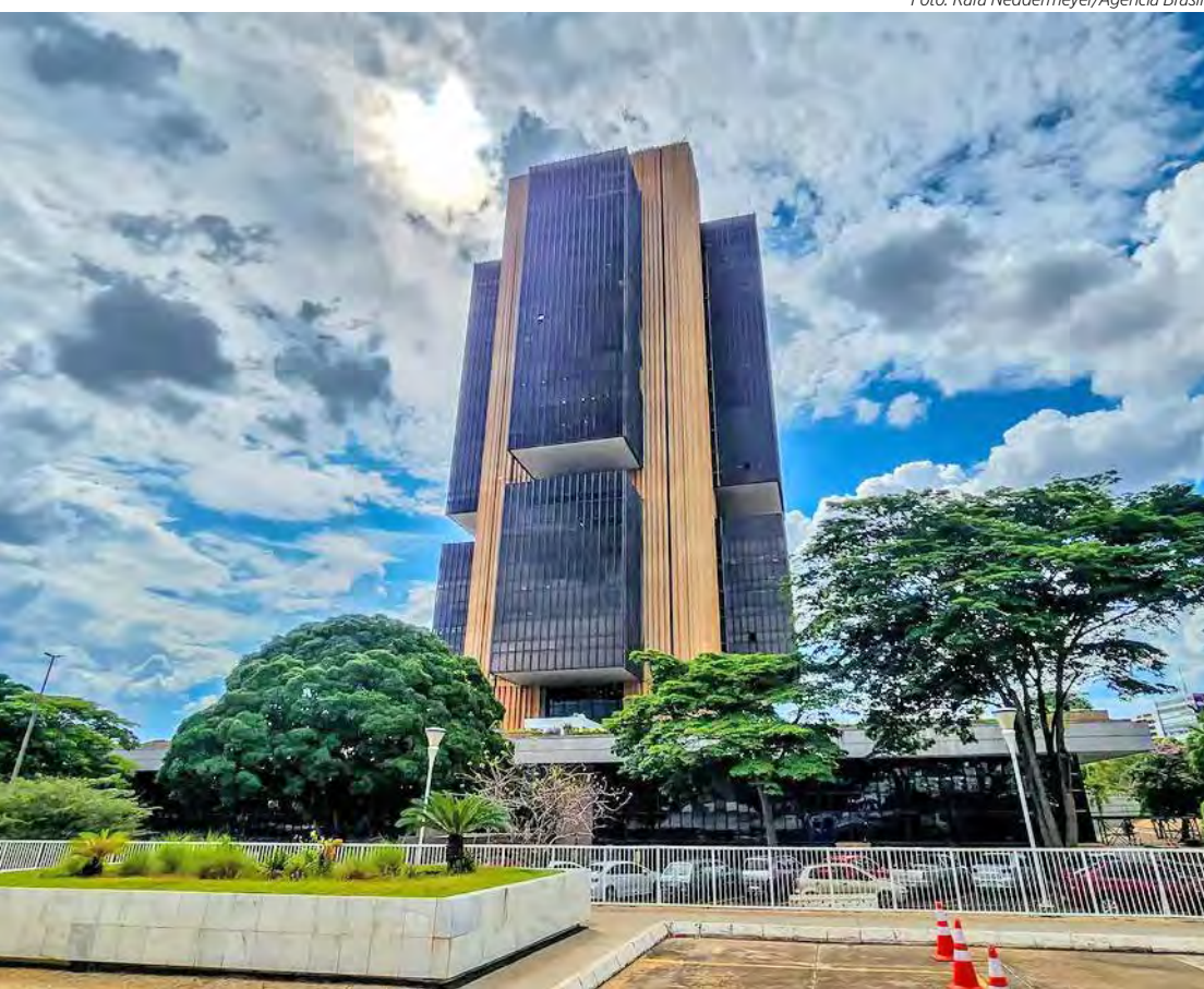
Fachada do prédio do Banco Central localizado em Brasília (DF)

O aumento da taxa Selic ajuda a conter a inflação. Isso porque juros mais altos encarecem o crédito e desestimulam a produção e o consumo. Por outro lado, taxas maiores dificultam o crescimento econômico. No último Relatório de Inflação, o Banco Central reduziu para 1,9%