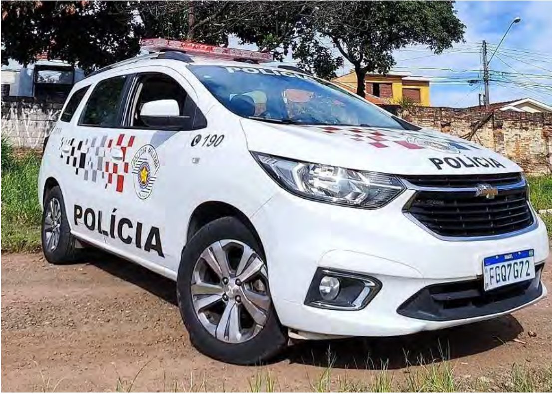
Abordagem ocorreu durante a madrugada no bairro Regina Picelli; homem era procurado pela Justiça e foi encaminhado ao Plantão Policial

Os policiais já tinham informações de que o indivíduo era foragido. Após a abordagem, a identidade foi confirmada e o homem foi conduzido ao Plantão Policial. Ele permaneceu preso e à disposição da Justiça.