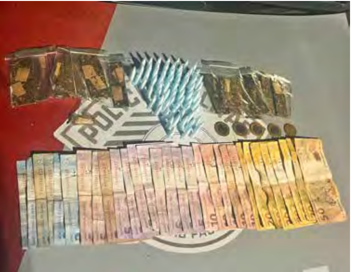
Suspeito foi flagrado em atitude suspeita e tentou fugir, mas acabou preso pela Polícia Militar próximo à Lagoa Seca, em Rio Claro