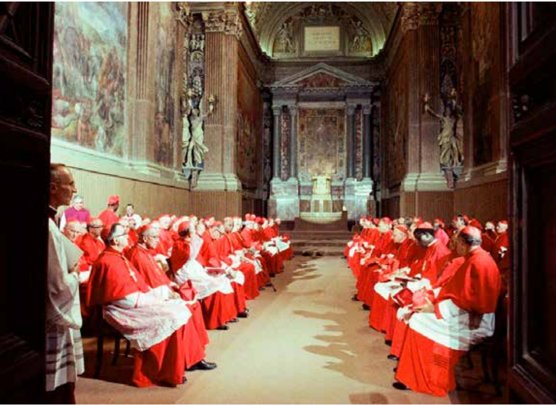
Cardeais do conclave

ontem e a chaminé soltou uma fumaça preta, indicando que os votos dos 133 cardeais não atingiram os dois terços necessários, 89 votos, para escolher um novo pontífice. A votação continuará até que a fumaça branca saia da capela sinalizando a escolha do novo papa, que assumirá o lugar do Papa Francisco que faleceu no último dia 21 de abril. Uma nova votação será realizada hoje, e o procedimento será realizado até o próximo domingo, dia 11. Se o papa não for eleito até lá, a eleição é suspensa para deliberação e depois retomada. Não há prazo determinado para o conclave que irá durar até que um dos candidatos tenha os dois terços dos votos necessários. Esse processo de escolha, por mérito, deveria ser adotado por toda e qualquer eleição.