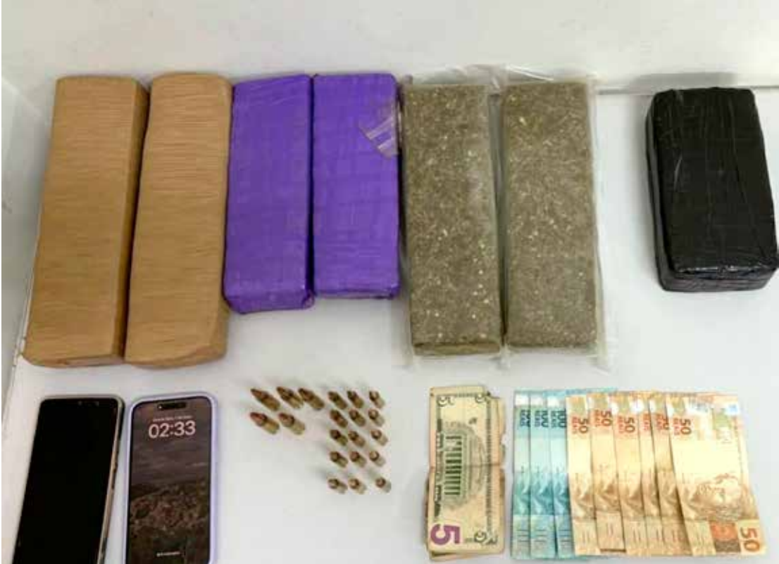
BAEP munições e drogas com procurado por homicídio em Rio Claro

Entre os detidos, um homem procurado por homicídio foi localizado em Rio Claro, onde os policiais também encontraram munições de uso restrito e porções de drogas. Já em Hortolândia e Santa Bárbara d'Oeste, as apreensões envolveram espin-