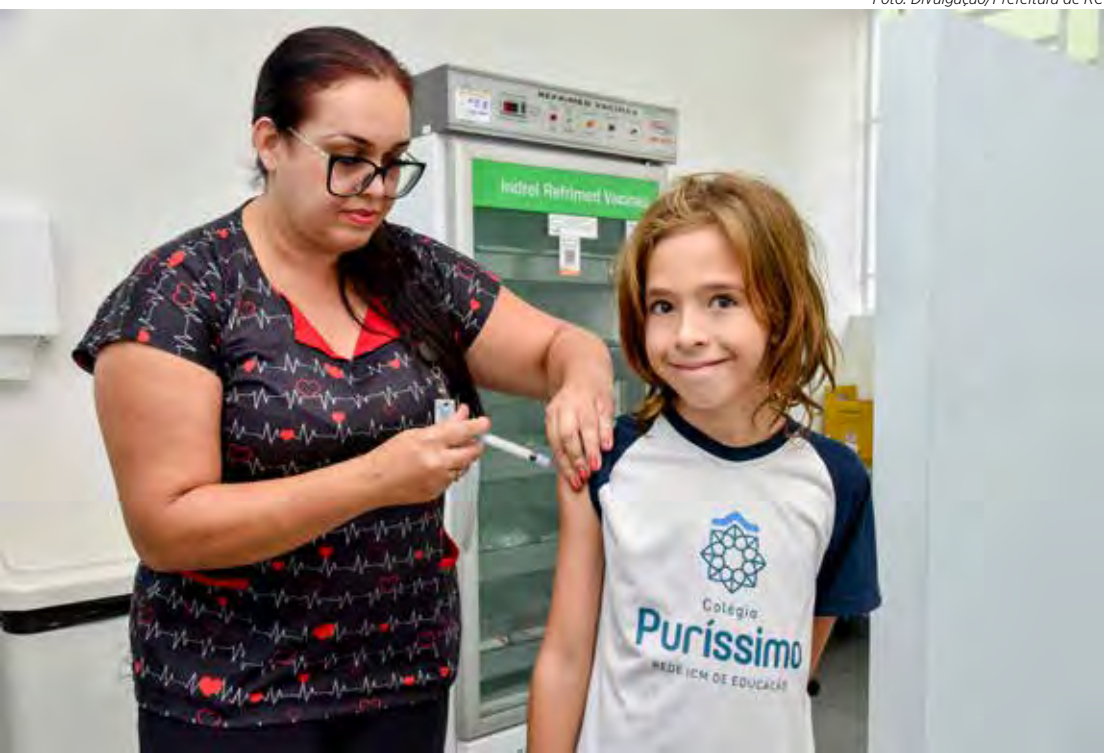
A vacina contra a gripe está disponível para quem pertence aos grupos prioritários

puérperas, povos indígenas, trabalhadores da saúde, pessoas portadoras de deficiência permanente, professores, pessoas com comorbidades, pessoas em situação de rua, profissionais das forças de segurança e salvamento e das forças armadas, caminhoneiros, trabalhadores de transporte coletivo rodoviário de passageiros urbanos e de longo curso, trabalhadores portuários, trabalhadores dos Correios e funcionários do sistema prisional. No caso da vacinação contra a gripe, é preciso apresentar documento de identidade e comprovação de que a pessoa faz parte de um dos grupos prioritários. Para as demais vacinas também é importante a caderneta de vacinação.