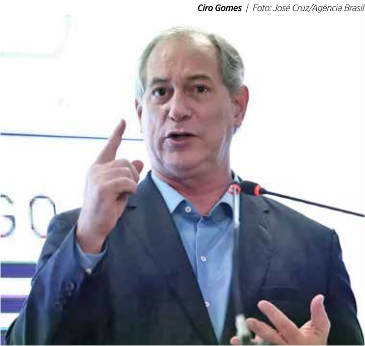
Ciro Gomes