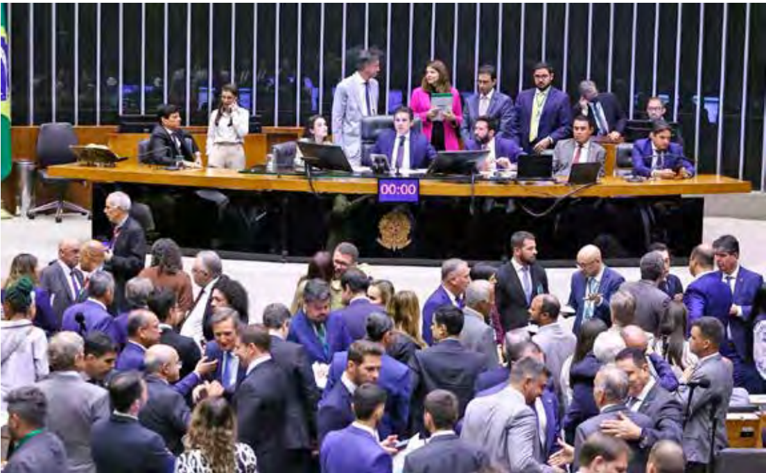
Câmara dos Deputados | Foto: Vinicius Loures/Câmara dos Deputados

E o julgamento dos réus do “núcleo 1” acusados de envolvimento no suposto plano de golpe de Estado avança no Supremo Tribunal Federal (STF). Entre os acusados, está o ex-presidente Jair Bolsonaro (PL) e mais sete réus. O tribunal agendou as audiências para ouvir as testemunhas indicadas pelos réus. Os depoimentos terão início em 19 de maio. E os ministros do STF estão muito trabalhando pela frente, já que o número de testemunhas indicadas pelos réus é grande. Somente Bolsonaro indicou 15 pessoas, entre elas o governador