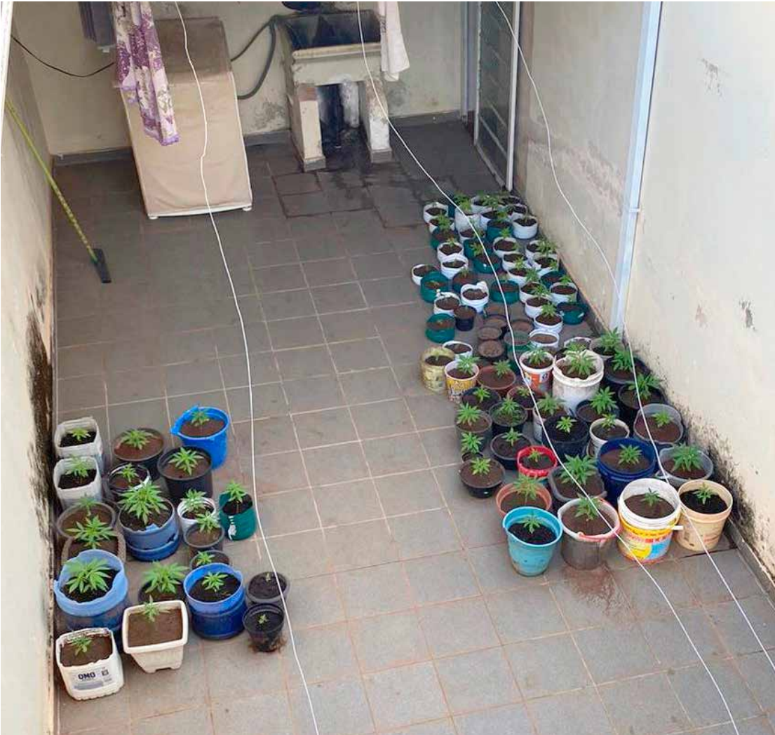
Polícia Civil apreendeu mais de 100 pés de maconha e uma balança de precisão durante flagrante em residência de Rio Claro

Polícia Civil localizou 117 pés de Cannabis em residência durante diligência para cumprir outro mandado de prisão