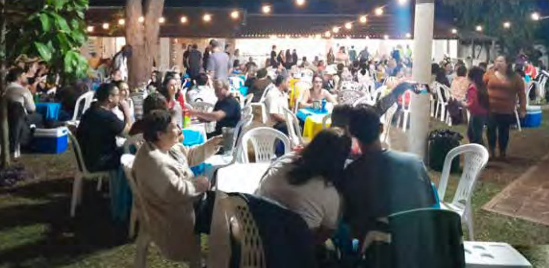
Dezenas de pessoas participaram do jantar festivo em comemoração aos 70 anos do grupo