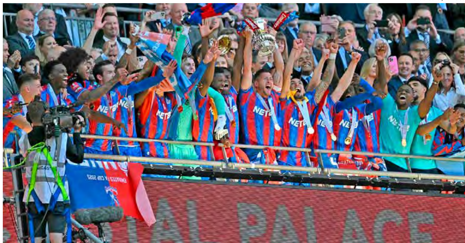
Crystal Palace comemora título da FA Cup sobre o todo poderoso Manchester City