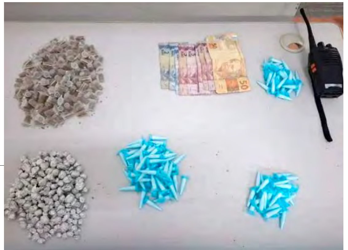
Entorpecentes e rádio comunicador foram apreendidos pelo BAEP com os suspeitos no bairro Bom Retiro

Diante dos fatos, os homens foram encaminhados ao Plantão Policial de Rio Claro, onde a autoridade de plantão ratificou a prisão em flagrante por tráfico de drogas, conforme o artigo 33 da Lei de Drogas (Lei nº 11.343/2006).