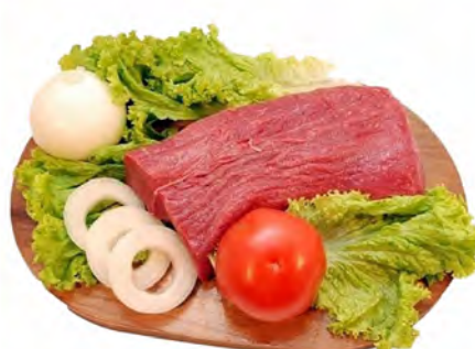
LAGARTO BOVINO - KG