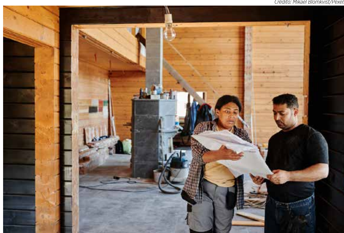
É importante definir um cronograma de obras e comunicar os moradores com antecedência