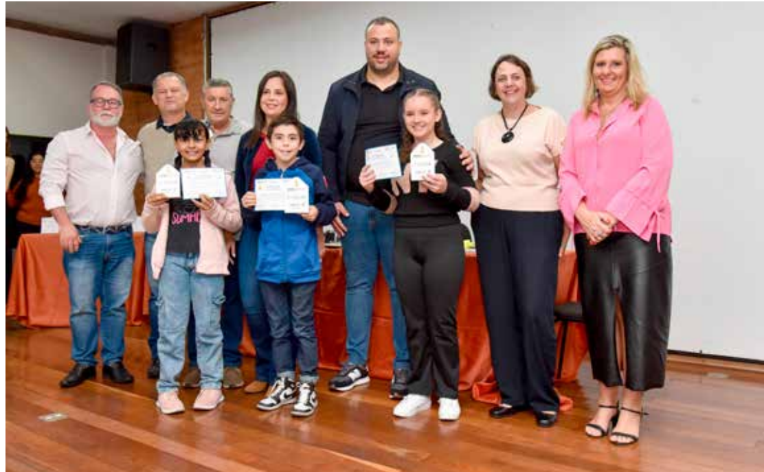
Desenhos foram produzidos por alunos da rede pública municipal de ensino