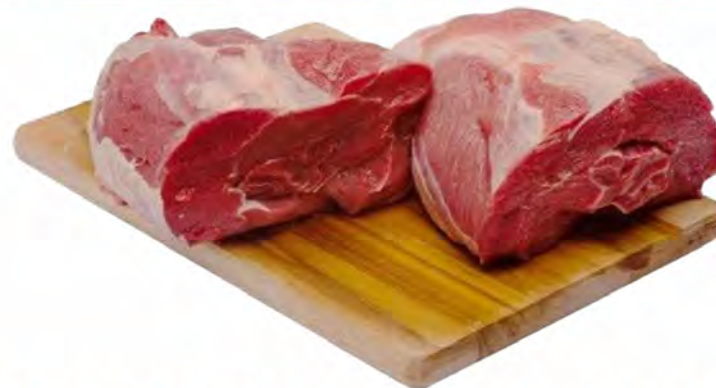
MÚSCULO BOVINO DIANTEIRO SEM OSSO - KG