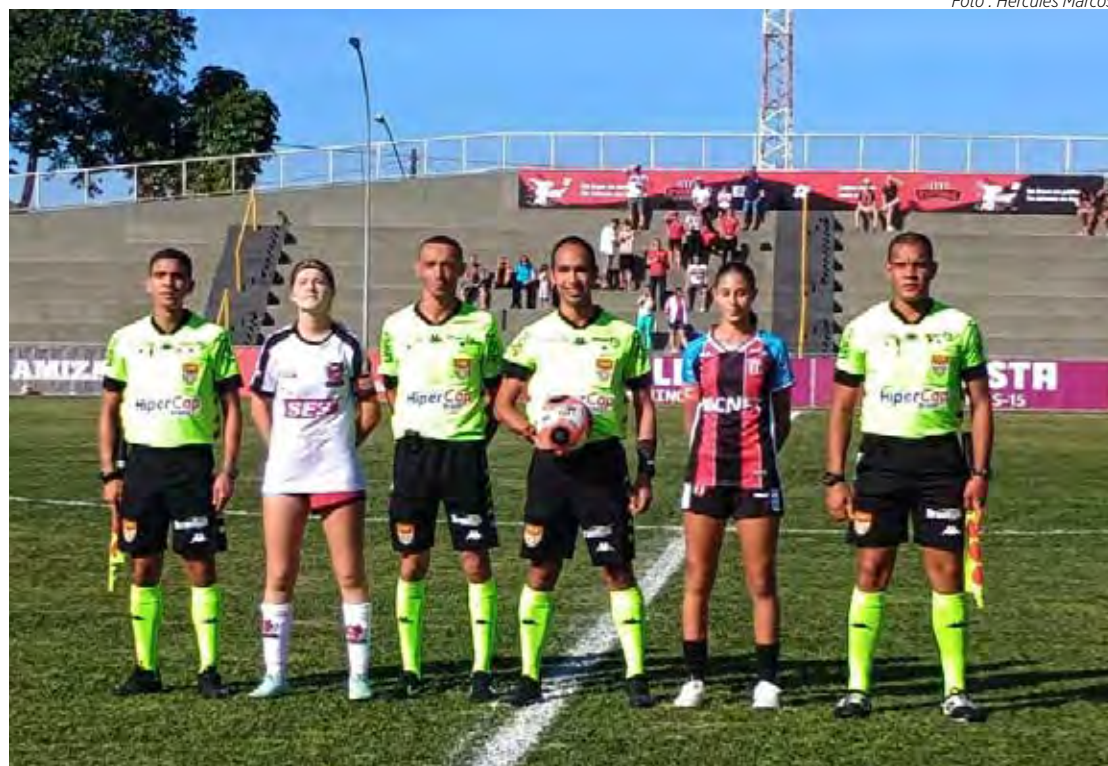
Partida marcou a estreia do futebol feminino do Sesi Rio Claro em competições oficiais