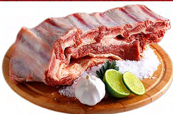
COSTELA BOVINA ESPECIAL - KG