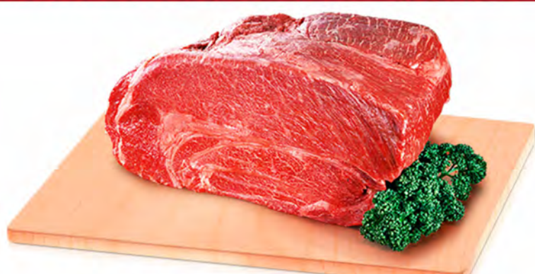
ACEM BOVINO SEM OSSO - KG