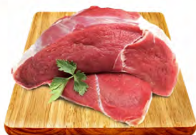
PONTA DE ALCATRA (COXÃO DURO) - KG