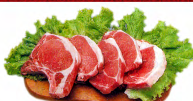
BISTECA SUINA - KG