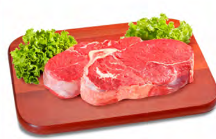
PALETA BOVINA SEM OSSO 1KG