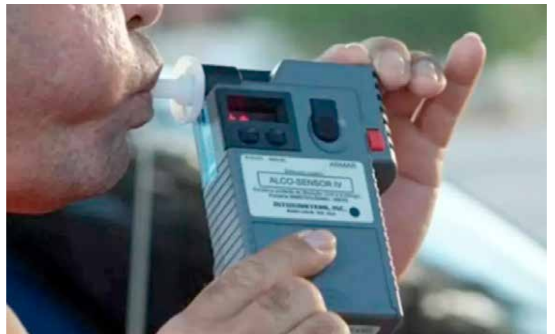
Abordagem ocorreu durante patrulhamento da Polícia Militar em via pública de Rio Claro, na madrugada de segunda-feira (19)

Ele foi conduzido ao plantão policial, onde permaneceu detido e está à disposição da Justiça.