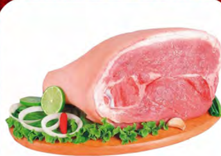
PALETA SUINA (PERNIL DIANTEIRO) SEM OSSO - KG