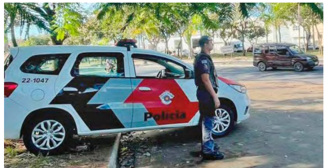
Suspeito foi detido pela Polícia Militar durante patrulhamento no bairro Jardim São Paulo, em Rio Claro

O suspeito, que já possui passagens pela polícia por crimes graves, foi imediatamente conduzido ao plantão policial. Após os procedimentos de praxe, ele permaneceu detido e está à disposição da Justiça.