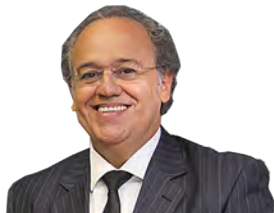
O colaborador é conselheiro do Tribunal de Contas do Estado de São Paulo (TCE-SP)