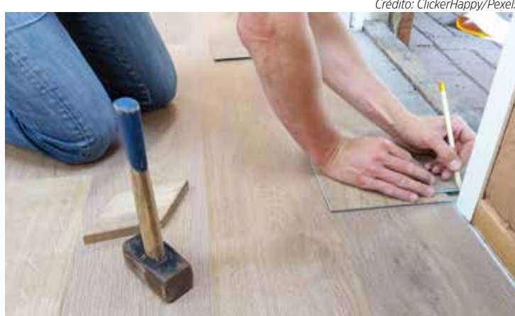
O síndico pode estabelecer um regulamento próprio para reformas

Horários permitidos para obras: a maioria dos condomínios permite reformas de segunda a sexta-feira, em horário comercial, e com restrições aos sábados. Aos domingos e fe-