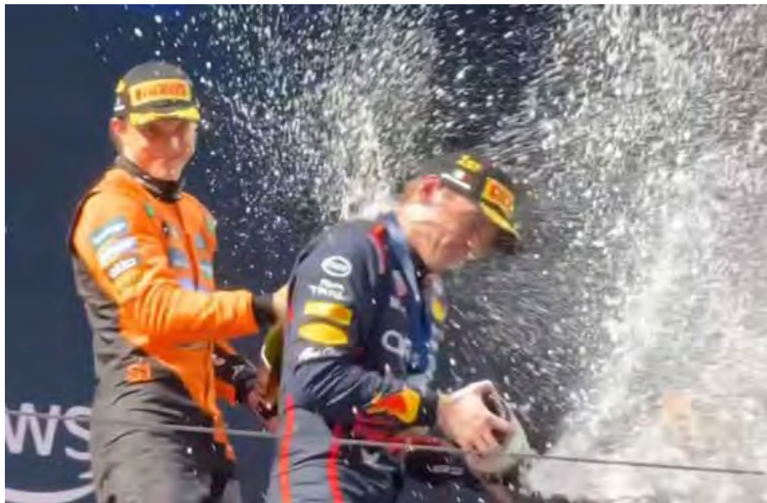
O vencedor do dia, Verstappen, ocupa a terceira posição da tabela com 124 pontos

A próxima rodada da Fórmula E será de mais duas corridas, dessa vez em Xangai, na China, entre os dias 31 de maio e 1º de junho.