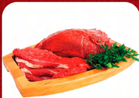
COXÃO MOLE (CORTAMOS EM BIFE) - KG

OFERTAS VALIDAS SOMENTE HOJE 20/05 OU ENQUANTO DURAREM OS ESTOQUES.