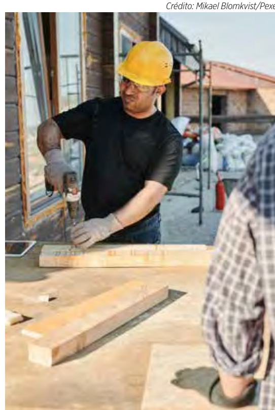
É importante garantir que as empresas contratadas sigam normas técnicas e de segurança