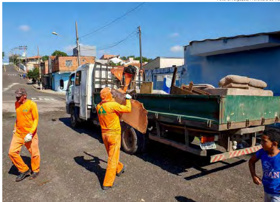
Até agora, 804 toneladas de materiais já foram recolhidas em 10 mutirões