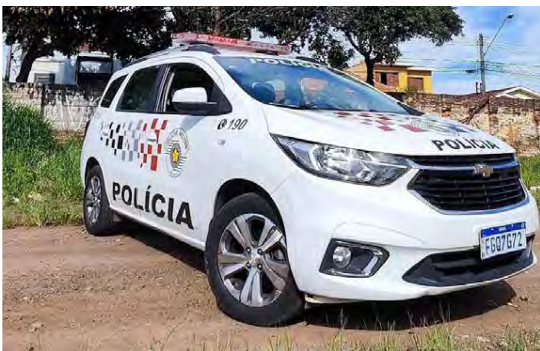
Policiais militares localizaram o suspeito em sua residência, no bairro Vila Paulista, durante patrulhamento

Diante da ordem judicial, o homem foi conduzido ao plantão policial, onde permaneceu preso e à disposição do Poder Judiciário.