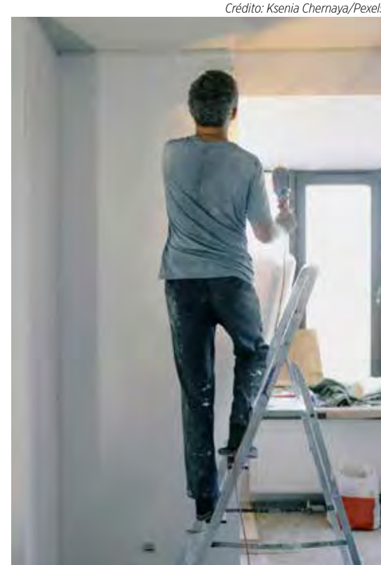
Reformas são, mas devem ser feitas com regras e planejamento