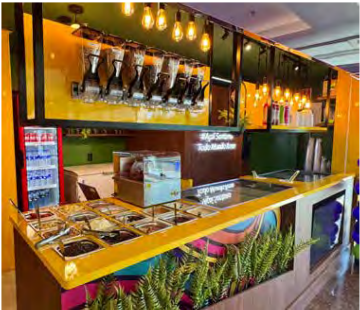
Um dos mais tradicionais pontos de açaí da cidade agora está na praça de alimentação do centro de compras

binhações incríveis e com aquele sabor irresistível. Destaco o projeto arquitetônico da loja,