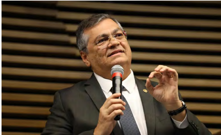
Flávio Dino

Além disso, a os advogados também contestaram a condenação de Carla ao pagamento de R$ 2 milhões em danos coletivos. Agora, é esperar para ver se os argumentos e o recurso serão aceitos pelos ministros. Arrisca um palpite?