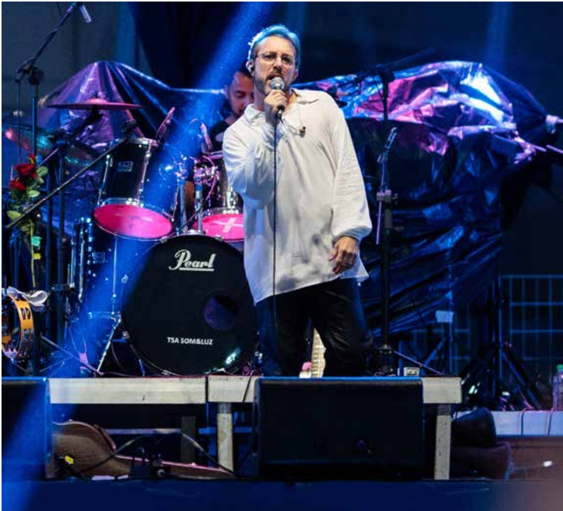
A banda Legião Urbana Cover SP sobe ao palco da praça de alimentação a partir das 19h30