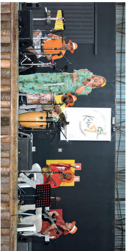
Banda Kalu e os Bambas