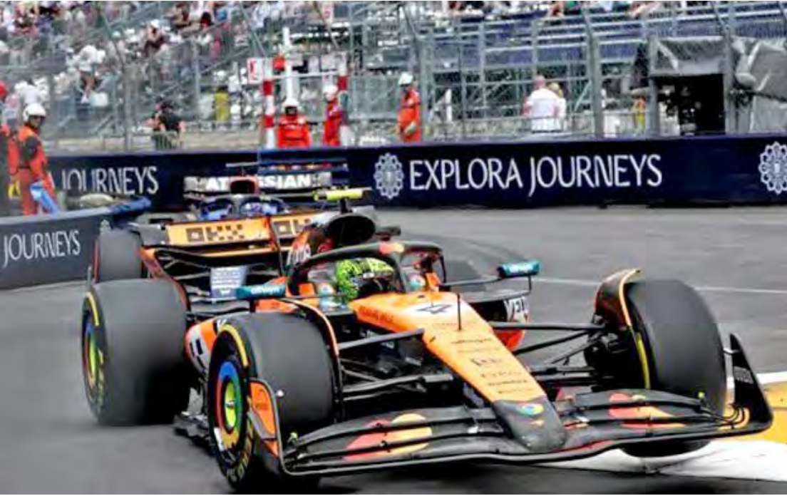
Lando Norris faz a Pole Position no quintal da casa do monegasco Leclerc!