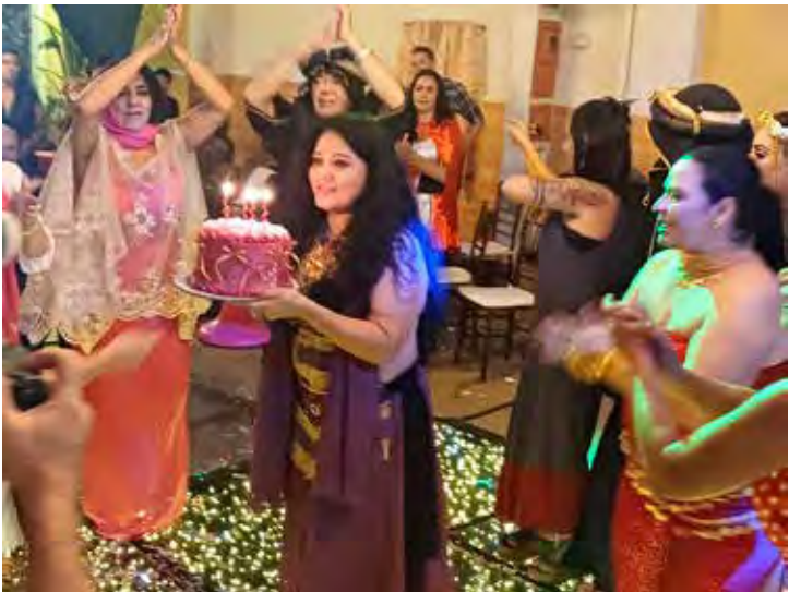
Desfilando com o bolo de aniversário, um dos momentos de alegria intensa