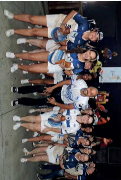
Bateria da Escola de Samba Samuca