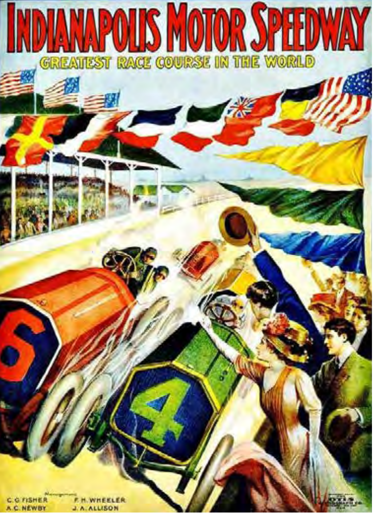
Indy 500 uma festa mundial que escreve a história do automobilismo