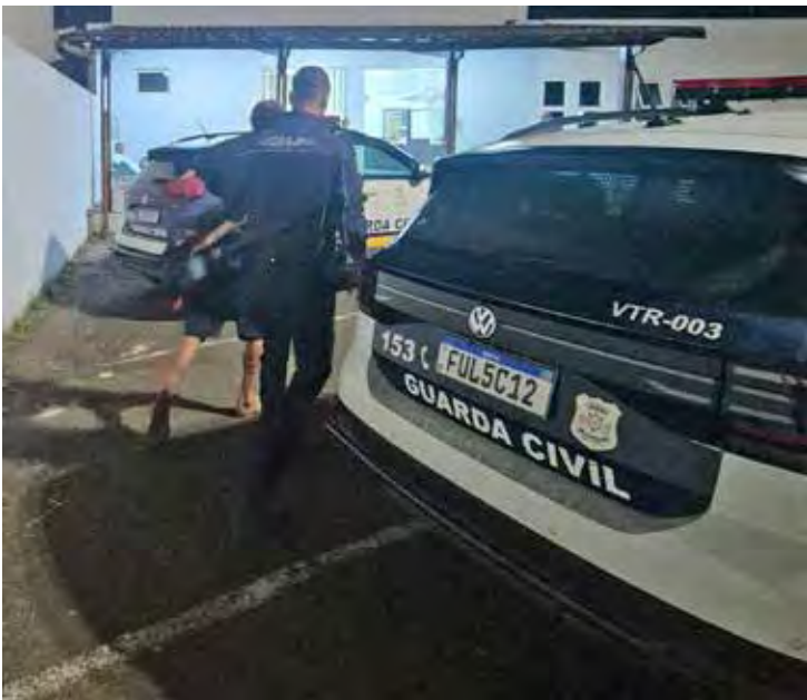
Viatura da Guarda Civil Municipal durante apresentação da ocorrência no Plantão Policial de Rio Claro, na noite desta sexta-feira (23)

Diante dos fatos, ele foi conduzido ao Plantão Policial de Rio Claro, onde foi formalmente autuado e permaneceu à disposição da Justiça. O celular roubado não foi localizado até o momento.