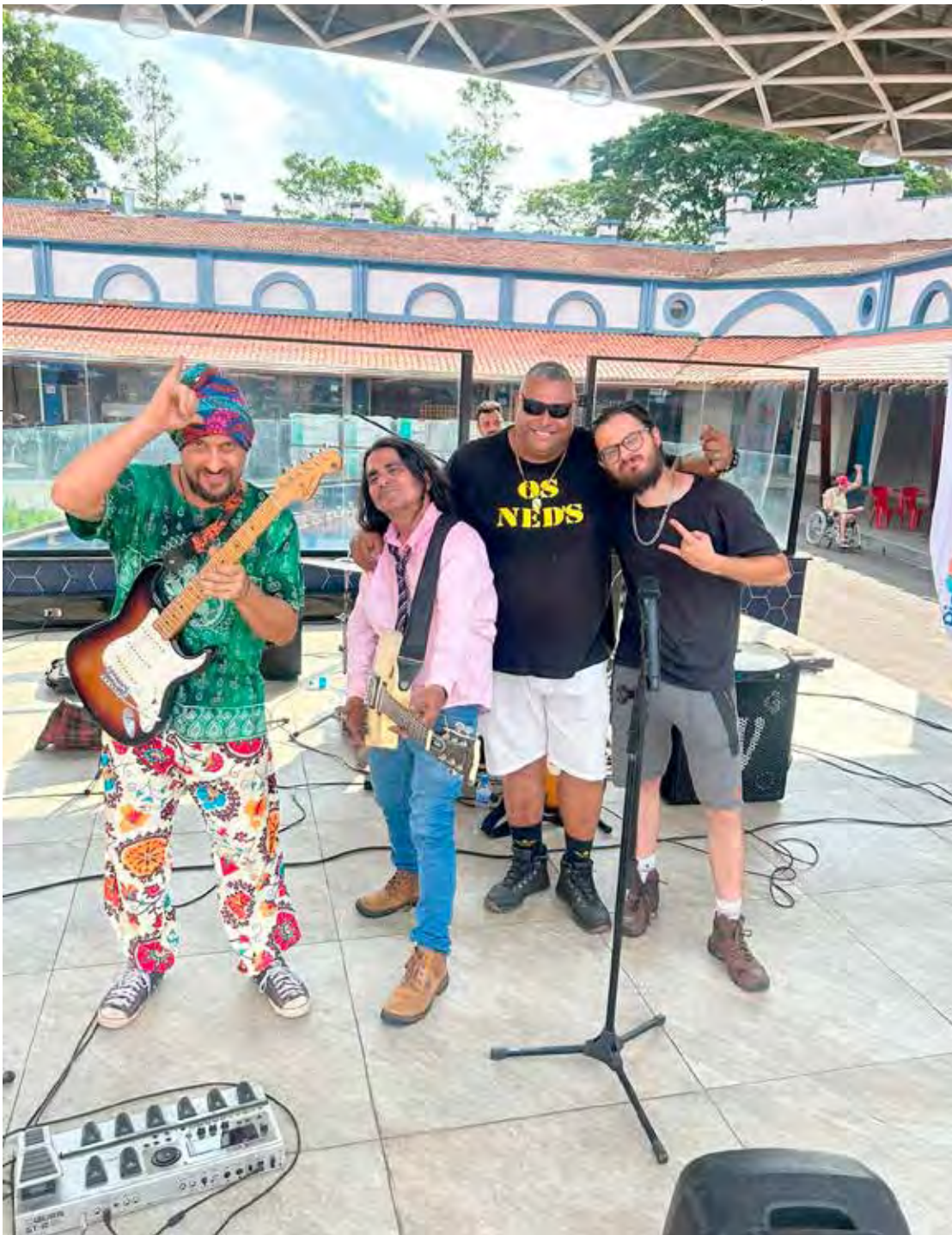
A banda “Ned’s RC” fará show ao vivo na 1ª carreata ‘Corrida Maluca’