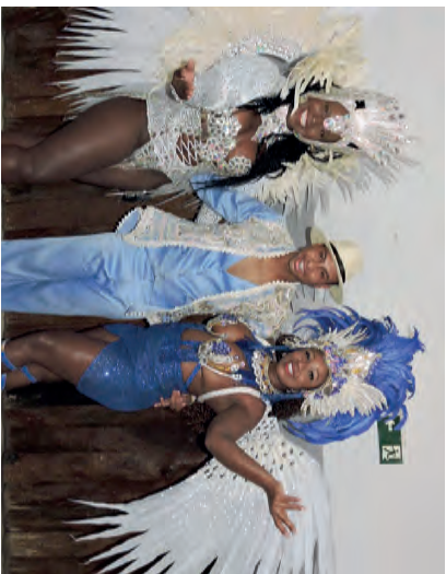
Passistas da Escola de Samba Samuca