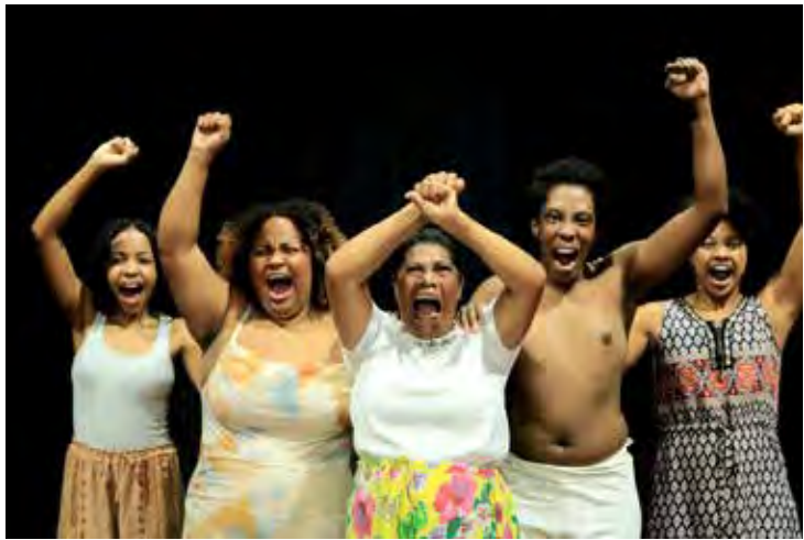
Cia. Uaná de Artes Cênicas apresentará a peça “Me gritaram negra!” no Centro Cultural