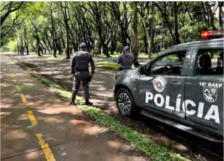
Equipes do BAEP e da GCM de Limeira atuaram no socorro da vítima e no apoio à ocorrência registrada nesta sexta-feira (23)

O Pelotão Ambiental da GCM de Limeira também presta apoio na ocorrência. A Polícia Civil já iniciou as investigações e realiza buscas na tentativa de localizar o autor do crime.