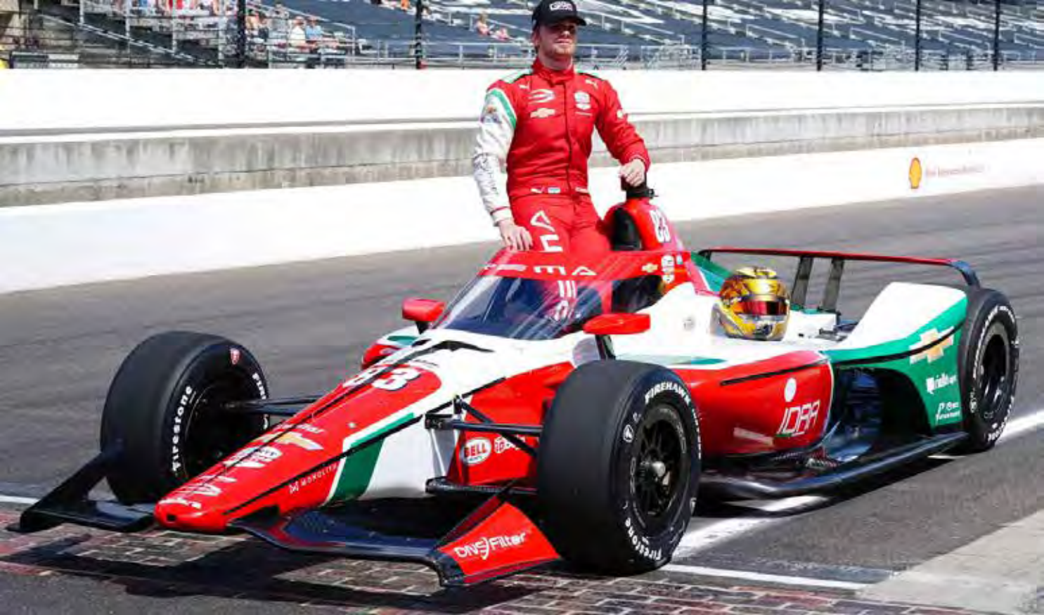
Em 2025 Pole Position da Equipe Italiana Prema e de seu Piloto Israelense-Russo, Robert Shwartzmann