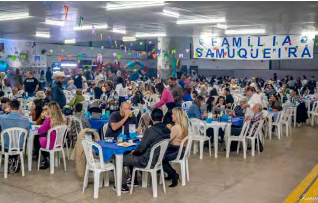
Festa Junina da Samuca costuma reunir grande público