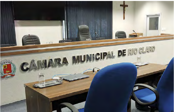
Câmara Municipal

DIÁRIO DO RIO CLARO O ARQUIVO HISTÓRIO DA FAMÍLIA RIOCLARENSE