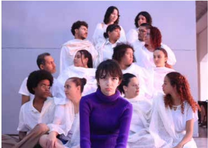
A Cia Tempero d’Alma encenará o espetáculo “Próxima estação...”