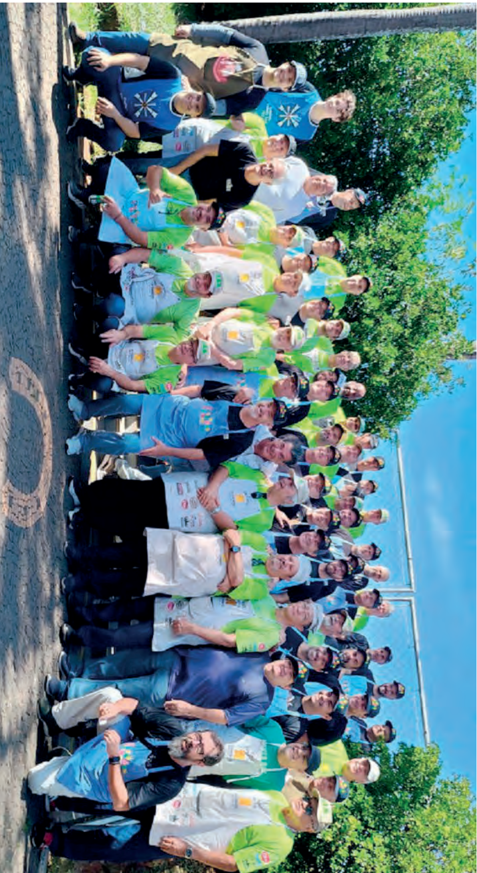
Equipe da Casa das Crianças e Equipe do CAC - Clube de Amigos da Comunidade