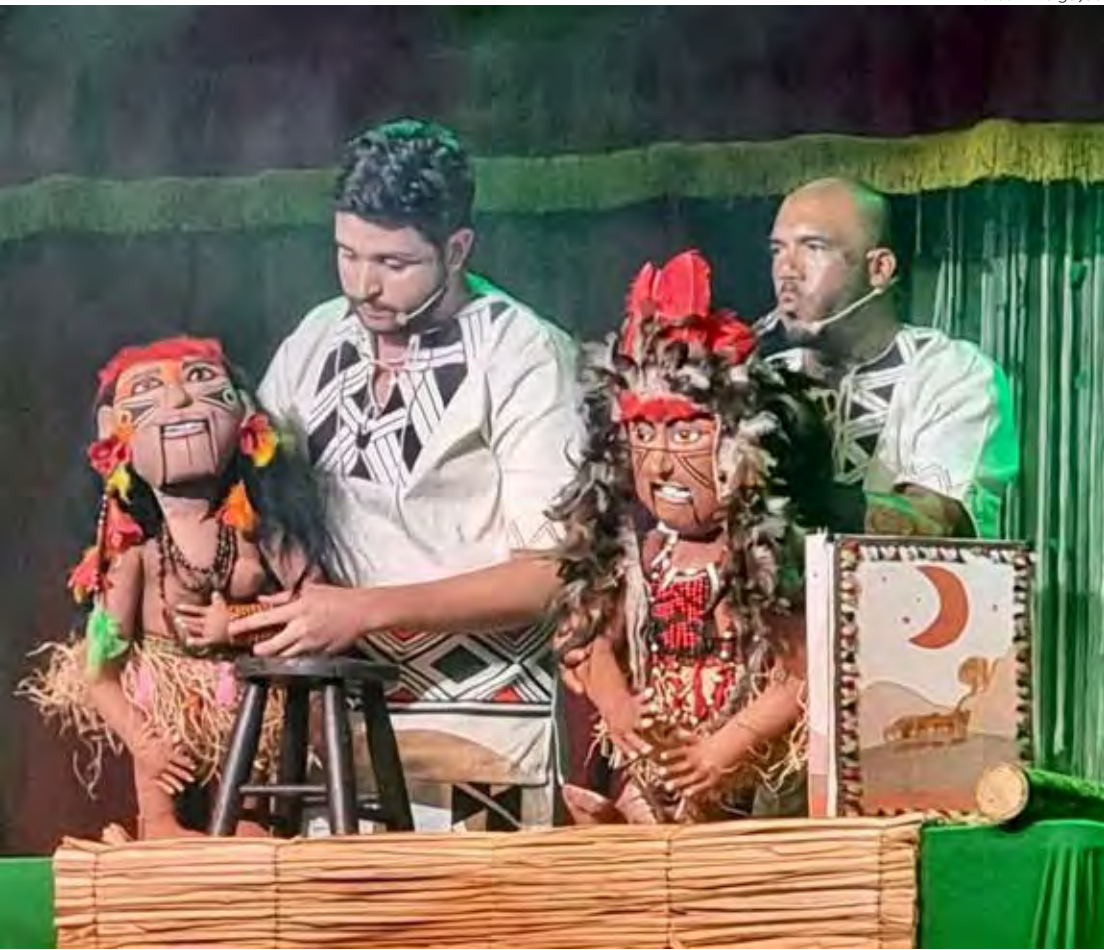
Festival terá espetáculos gratuitos para público de todas as idades

ICRH. Confira a programação: 1º dia - 22 de novembro (sábado) 16h: Boi Viramundo - espetáculo para crianças 17h: atividades recreativas 18h: Resenha de Mamulengo - espetáculo de bonecos 19h: Universo Bisgóio - espetáculo circense 20h: Ariano – O Cavaleiro Sertanejo - espetáculo musical para adultos 2º dia - 23 de novembro (domingo) 16h: As peripécias da princesa esperta que criava um piolho e não queria casar - espetáculo para crianças 17h: atividades recreativas 18h: Aysú – Uma História de Amor - espetáculo de contação de histórias 19h: convidados locais - coletivos artísticos locais 20h: Casa Grande & Senzala – O Manifesto Musical Brasileiro - espetáculo musical para adultos