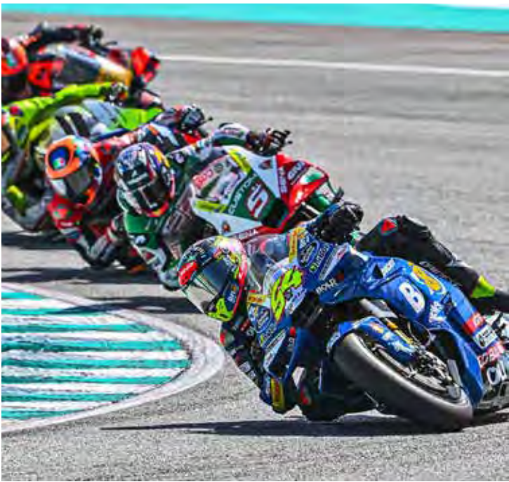
MotoGP está na Espanha para a última etapa, com o campeão já definido

Programação da MotoGP Sábado (15/11) Corrida Sprint - 11h00 Domingo (16/11) Corrida - 10h00 A transmissão pode ser acompanhada pela ESPN 4 e Disney+.