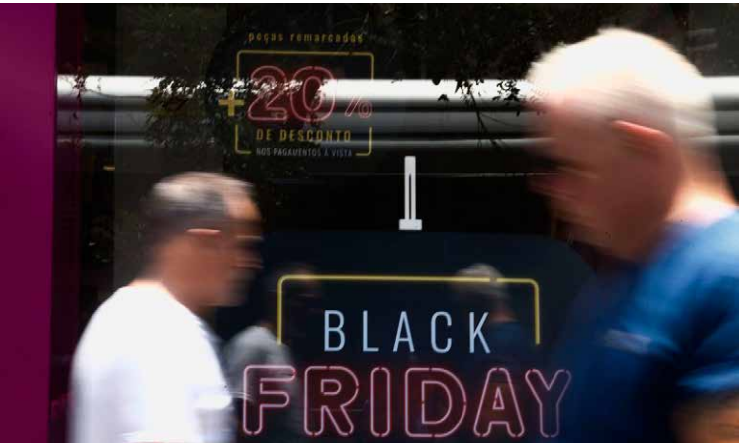
Black Friday está chegando com expectativa de aumento das vendas o comércio