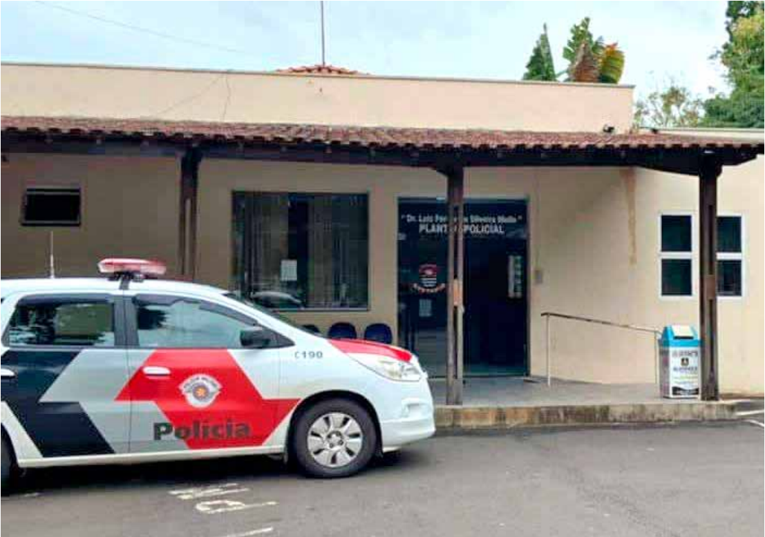
Vítimas relataram agressões brutais e pediram medidas protetivas; caso segue na Justiça

conforme a PM, permaneceu agressivo durante todo o trajeto até a delegacia. Ele ainda tentou atingir um investigador, o que exigiu o uso moderado da força para contê-lo. Na Delegacia, as vítimas confirmaram as agressões e solicitaram medidas protetivas. A Polícia Civil representou pela prisão preventiva do acusado, que permanece à disposição da Justiça enquanto o caso aguarda decisão judicial.