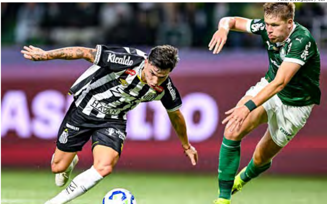
Santos e Palmeiras se enfrentam na Vila Belmiro em clássico decisivo pelo Brasileiro

Mesmo com tantas ausências, o Palmeiras chega para o clássico defendendo a liderança — empatado em pontos com o Flamengo, mas levando vantagem no número de vitórias.