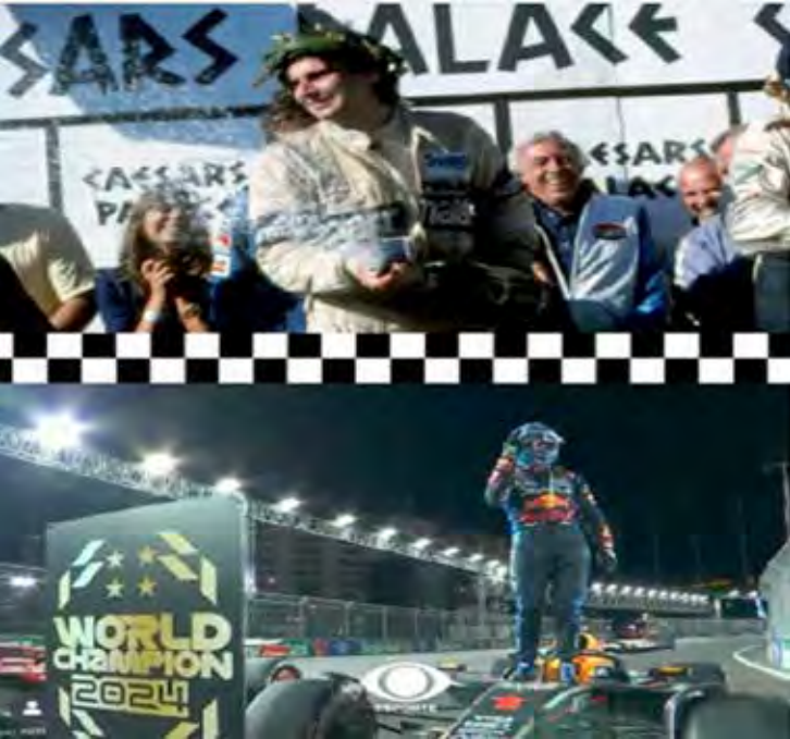
Nelson Piquet (1981) e seu genro Max Verstappen (2025), foram sagrados campeões em Las Vegas no 1º e no último GP F1 de Vegas até hoje

Macau não precisa do flash de Vegas — tem alma. O Guia não é só um circuito; é um rito de passagem. Sobreleva às suas paredes, domine seu ritmo, e você ganhou o direito