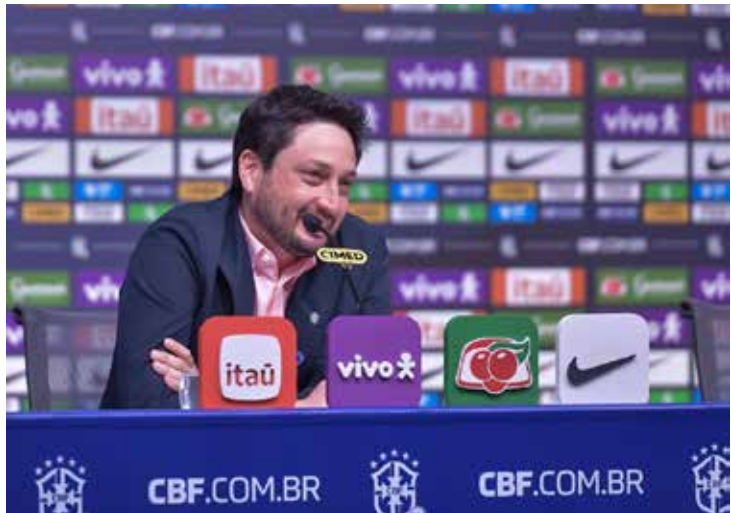
Seleção Brasileira Feminina anuncia convocação com 26 jogadoras para a Data Fifa de novembro

A lista demonstra a intenção de manter um elenco equilibrado entre atletas que vivem boa fase em seus clubes e jogadoras que já integram o projeto da Seleção a longo prazo. A expectativa é que o grupo seja observado nos amistosos que servirão como preparação para os desafios da equipe em 2026.