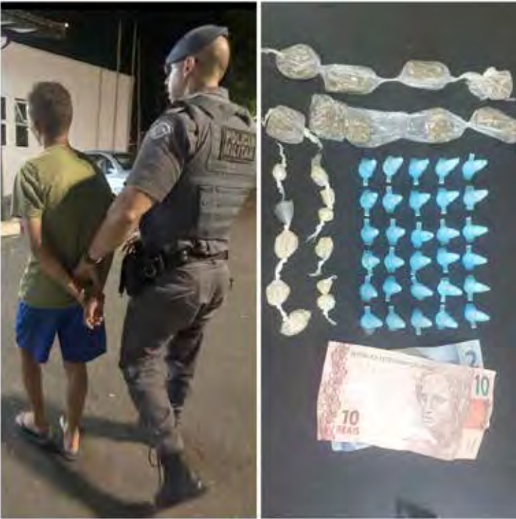
Polícia Militar apreendeu porções de cocaína, maconha e crack com o suspeito no Residencial das Flores

Após os procedimentos de praxe, o suspeito foi levado ao setor carcerário, onde permanece à disposição da Justiça.