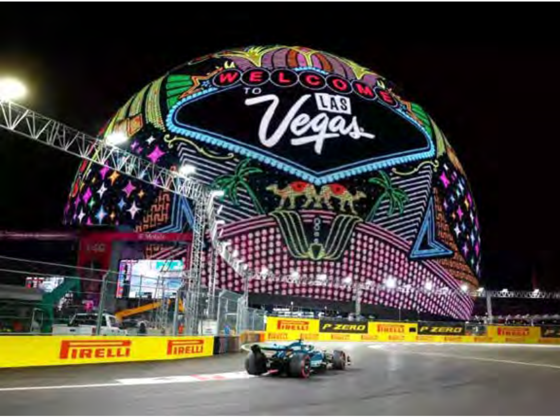
No 5º GP de Vegas a maioria

antigos beijando neon, incenso misturado à fumaça de pneu.