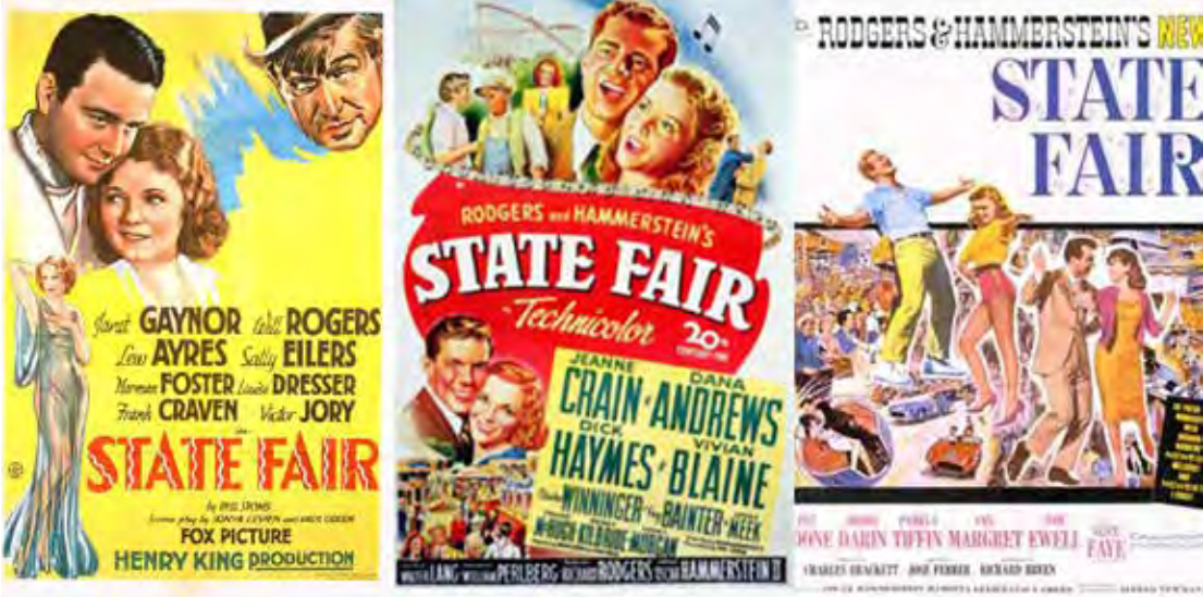
A trilogia de filmes State Fair, vai dos porcos, tortas e romances até chegar às corridas