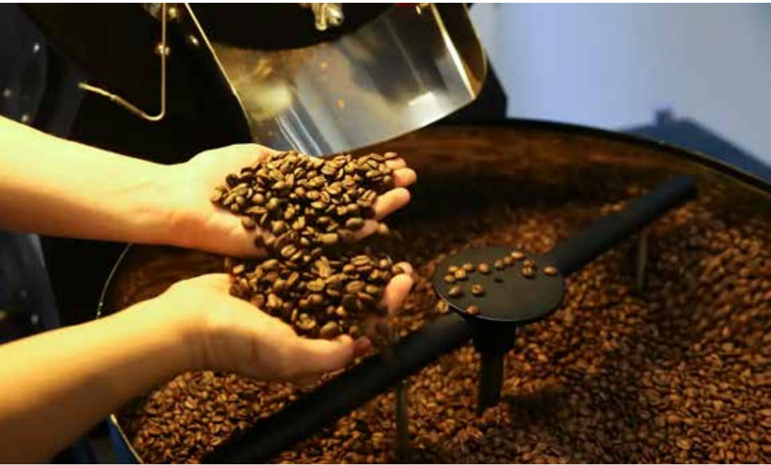
Trump isentou café, laranja, carne bovina e outros produtos do tarifaço

Segundo a Casa Branca, a medida trata das tarifas recíprocas anunciadas por Trump em