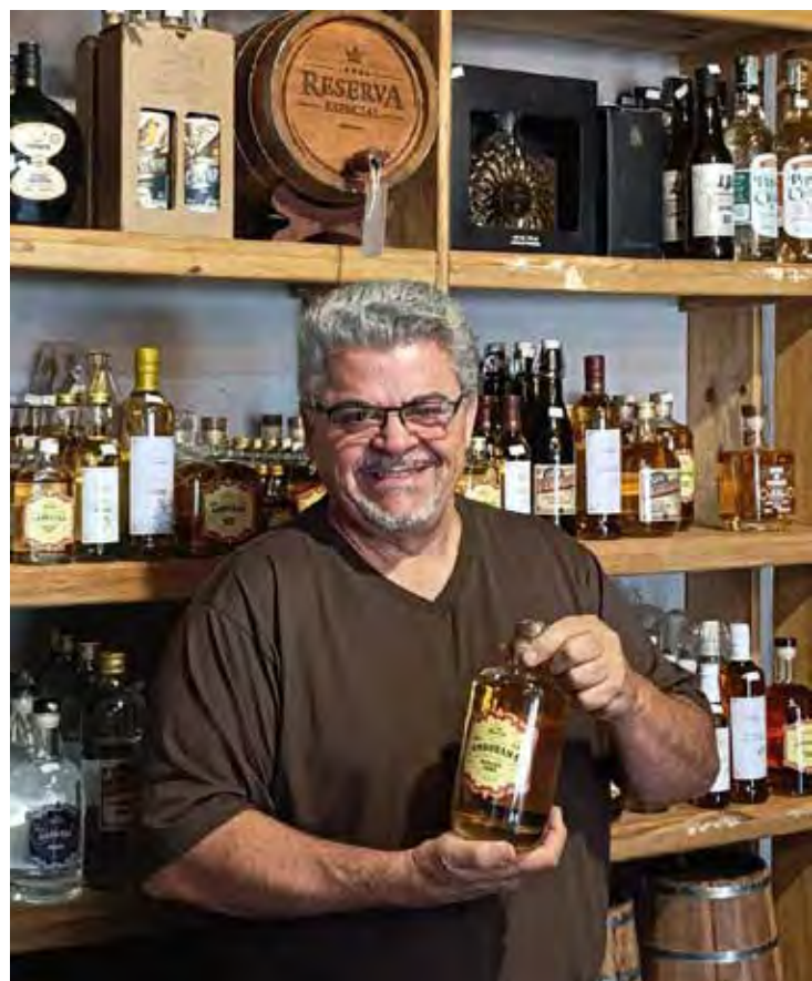
A Casa Ferruccio, do empresário Ferruccio Scotuzzi, se consolidou como um espaço de valorização da cultura gastronômica brasileira