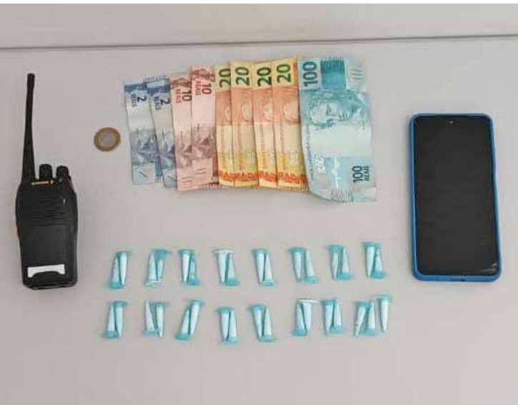
Ação da PM no Jardim Novo Wenzel terminou com prisão em flagrante por tráfico e apreensão de drogas e dinheiro

era algemado, ele ainda tentou fugir novamente, mas foi contido. Diante das evidências, o homem foi preso em flagrante por tráfico de drogas e conduzido ao Plantão Policial, onde permaneceu à disposição da Justiça. Todo o material apreendido também foi apresentado na unidade policial