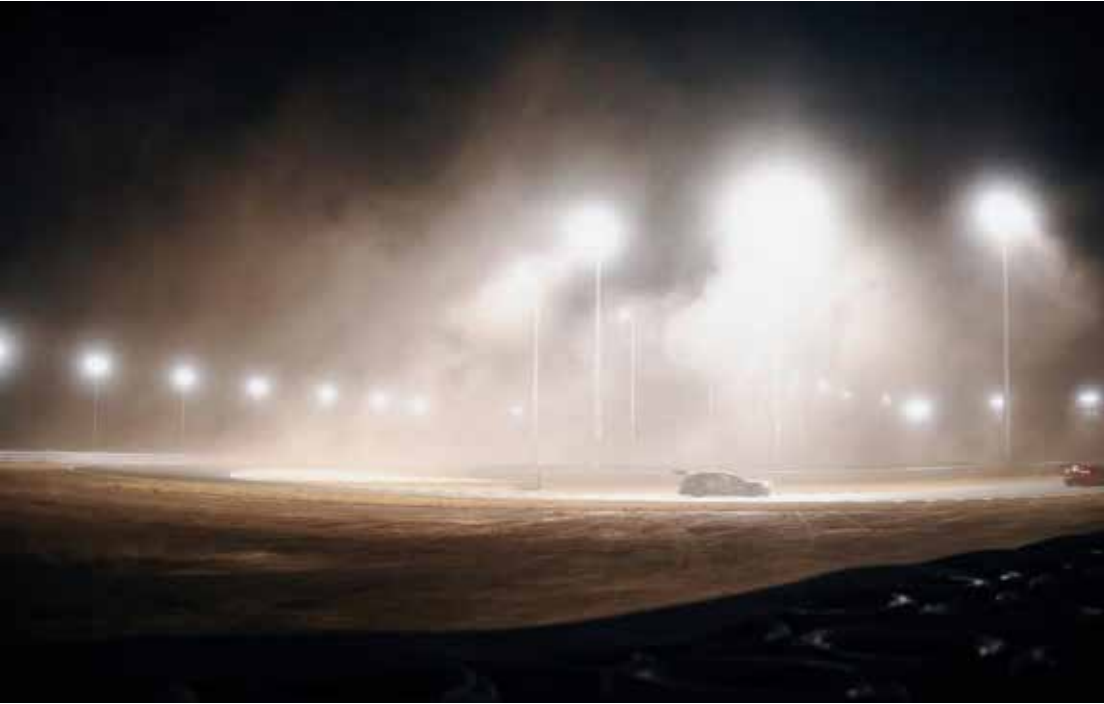
Stock Car realiza corrida principal neste sábado em Cuiabá, com previsão de mais chuva

A Stock Car realiza neste sábado em Cuiabá (MT) a corrida principal da sua primeira etapa noturna da história, e a 10ª da temporada. Uma forte ventania e muita chuva prejudicaram as atividades iniciais da categoria, cuja programação faz parte das festividades de inauguração do Autódromo Internacional de Mato Grosso.