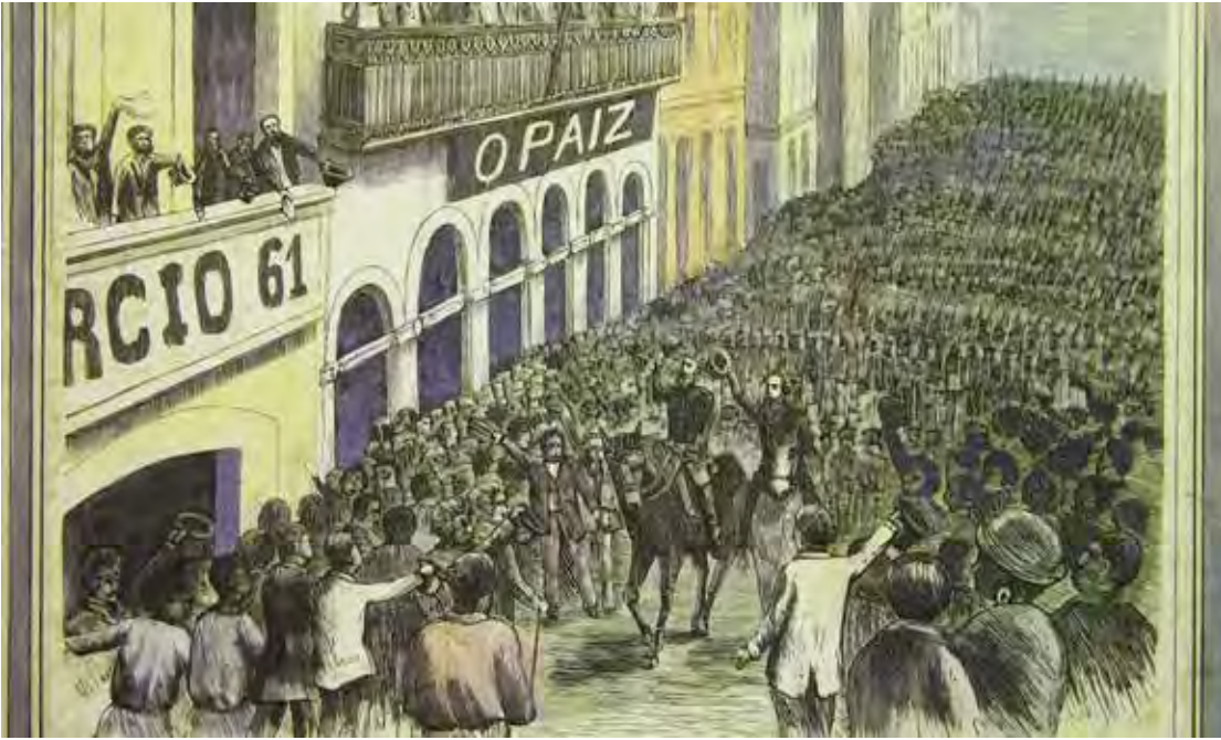
A Proclamação da República ocorreu no dia 15 de novembro de 1889, um ano e meio após a abolição da escravidura