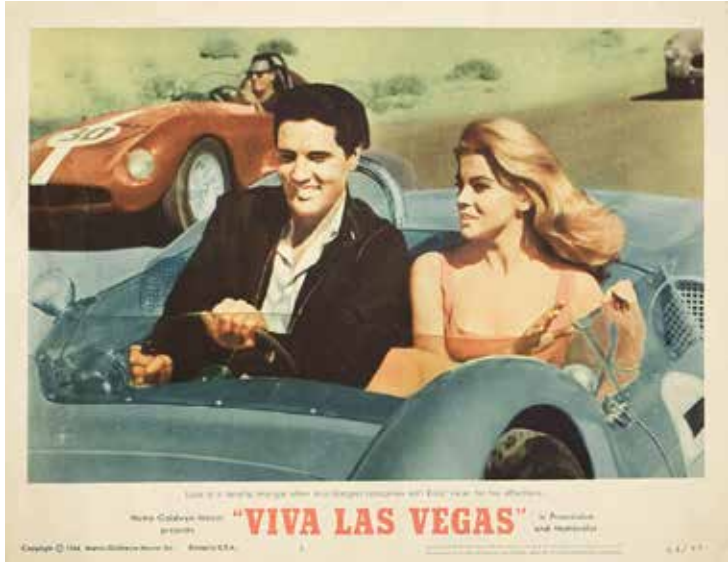
Já o filme Viva Las Vegas, de 1964, colocou as competições na primeira fila

Aninhado no antigo enclave português da China, o Circuito da Guia (6,12 km) rugiu desde 1954, transformando uma vila de pescadores sonolenta em uma procissão reluzente de cassinos e vida noturna que rivaliza com a própria Las Vegas. Macau não imita a Strip; responde com voz própria — muros de pedra