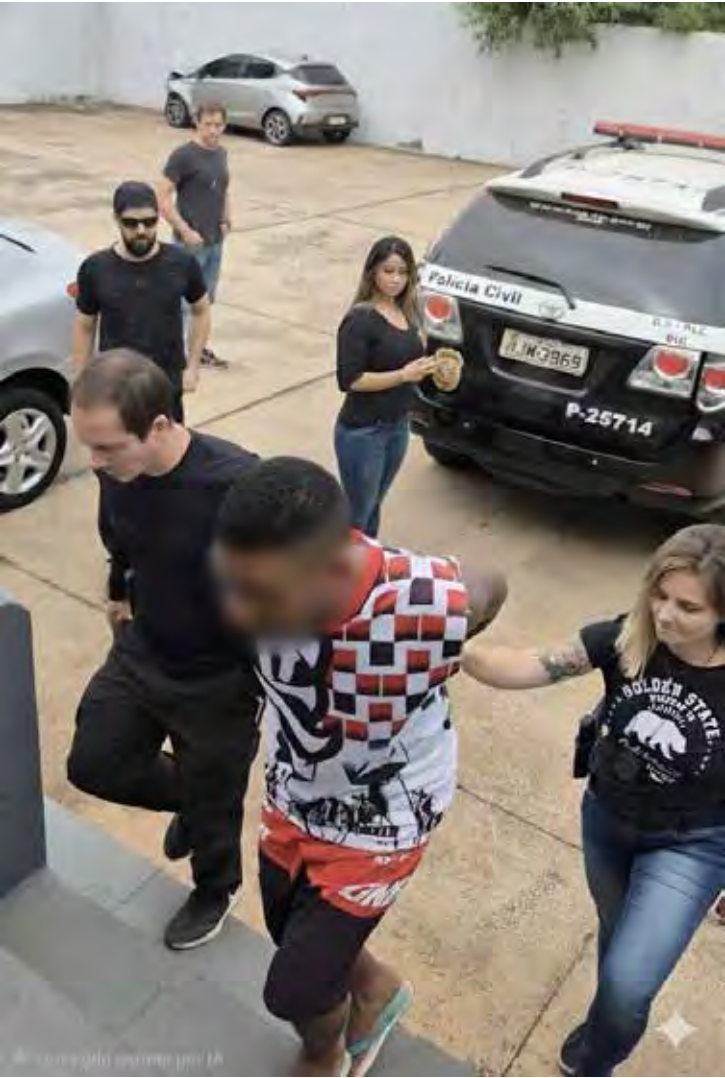
Operação conjunta da DISE de Rio Claro e DPM de Agudos prendeu foragido de alta periculosidade ligado ao PCC, condenado no Maranhão

Depois de detido, o investigado foi levado à Delegacia de Agudos para os procedimentos legais e, em seguida, encaminhado ao sistema prisional, onde permanecerá à disposição da Justiça. Para a Polícia Civil, a captura representa um “duro golpe na estrutura do tráfico e do crime organizado”, já que o homem atuava como peça-chave na distribuição de drogas e articulação criminosa na região.