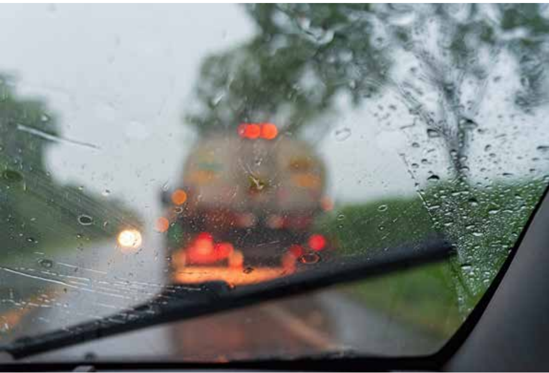
Dirigir com calma, atenção e prudência é o melhor caminho para enfrentar a estrada com segurança na estação chuvosa

fundamental dirigir com foco total na via, observando o movimento dos veículos à frente e ajustando constantemente a distância de segurança”, orienta. Entre as principais recomendações da Eixo SP estão verificar o bom estado dos pneus, freios e limpadores de para-brisa antes de pegar a estrada. Pneus carecas aumentam o risco de aquaplanagem. Também é importante manter os faróis baixos acesos durante todo o trajeto, para aumentar a visibilidade e facilitar que outros condutores identifiquem o veículo à distância. Segundo ele, a atenção é tão imprescindível