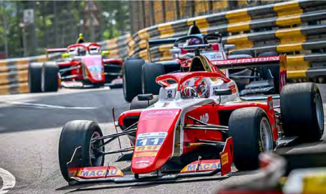
Macau brilha neste final de semana com o desafiador Circuito da Guia

cador, Estátua, Reservatório 2, Governador e Vitória. Neste sábado, o Oriente fala de novo. Motores vão uivar pela noite, e outro nome será gravado na pedra. Macau não segue tendências. Ela as cria — uma volta destemida de cada vez.