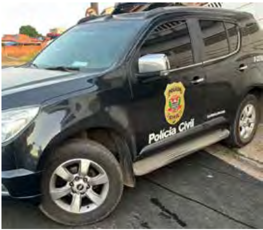
Apreensões, bloqueios milionários e prisão em flagrante em Rio Claro marcaram a Operação Golpe da Sorte, que desarticula grupo envolvido em lavagem de dinheiro e estelionato em seis cidades

gadas ao esquema. Após rastreamento financeiro, análise de criptoativos e cruzamento de dados bancários e relatórios do COAF, a Polícia Civil identificou uma rede estruturada que operava a lavagem de dinheiro por meio de casas de câmbio, transações fracionadas e conversão de valores em moedas digitais.