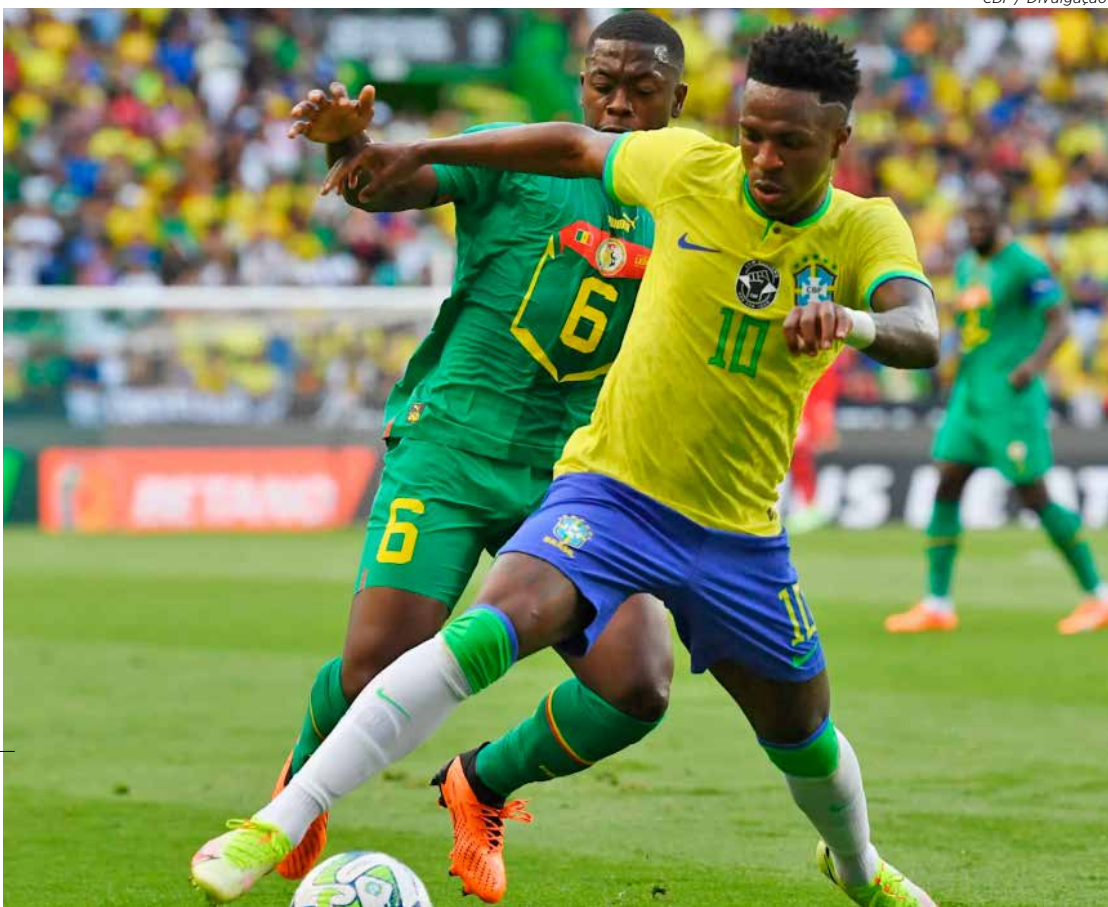
Seleção Brasileira joga hoje no Emirates Stadium em amistoso contra Senegal

O duelo em Londres abre a preparação da seleção para a próxima janela de 2026 e serve como plataforma para ajustes estruturais no modelo de jogo.