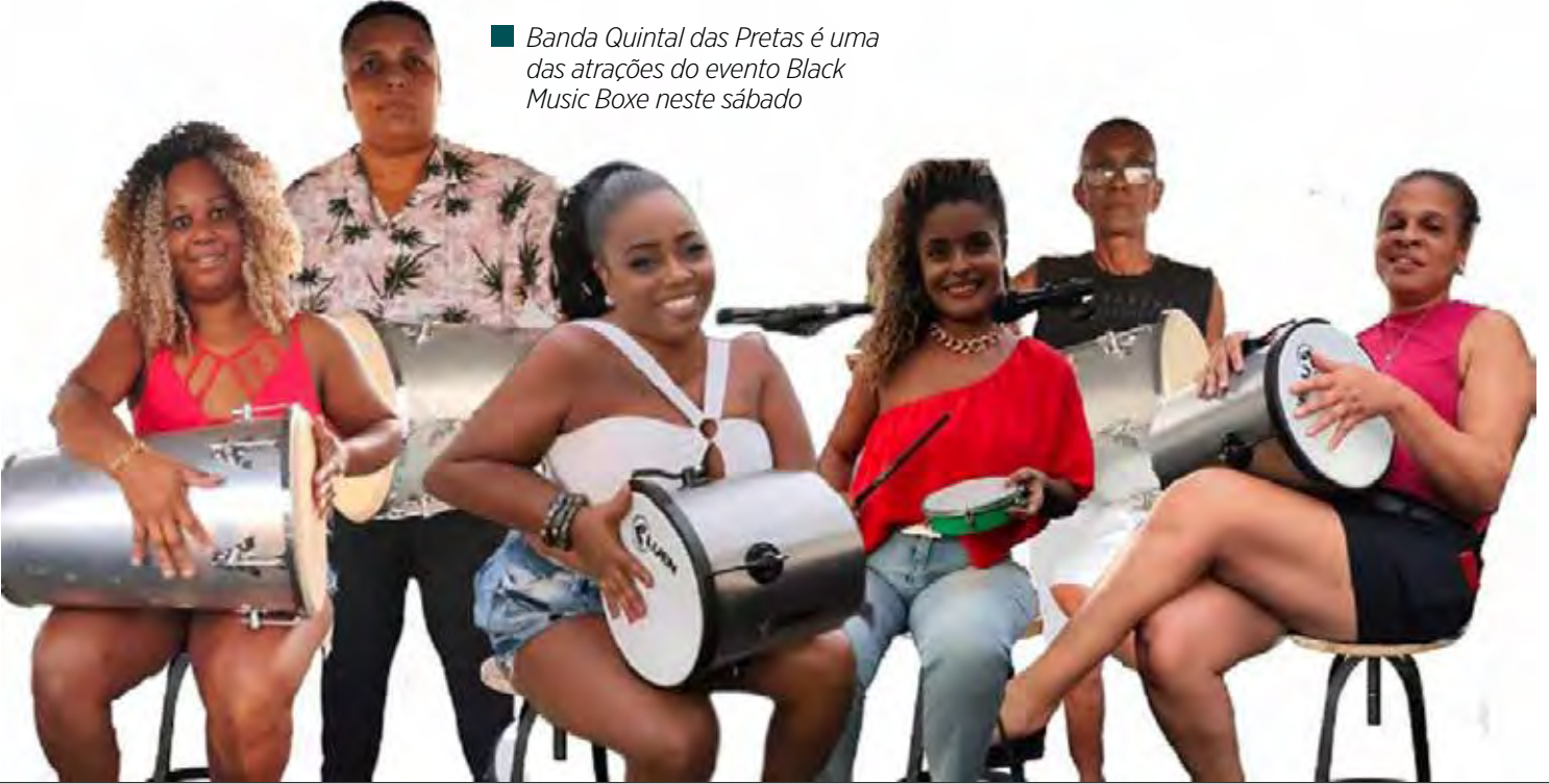
■ Banda Quintal das Pretas é uma das atrações do evento Black Music Boxe neste sábado

Também no Tamoyo, no dia 30, será realizada a festa de encerramento do Mês da Consciência Negra.