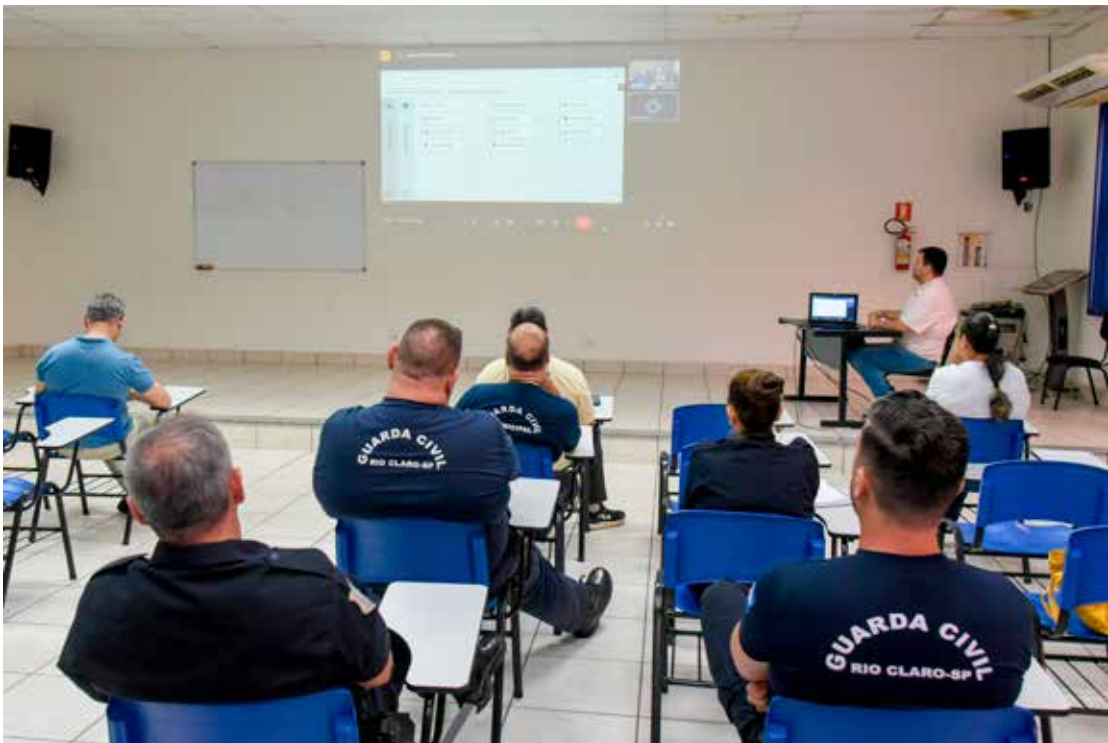
Membro da área de segurança participaram de treinamento voltado à operacionalização do Muralha Paulista

A integração foi formalizada após trabalho conjunto da Secretaria Municipal de Segurança e