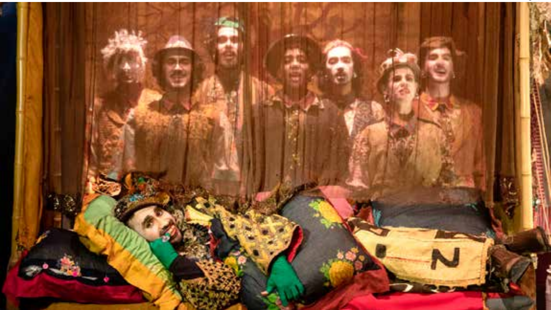
O grupo “Os Geraldos” apresenta o espetáculo “Cordel do Amor Sem Fim - ou A Flor do Chico” no Sesi Rio Claro

Às margens do Rio São Francisco, vivem três irmãs. A inércia da espera, o ciúme e a pulsação da esperança tecem o principal enre-