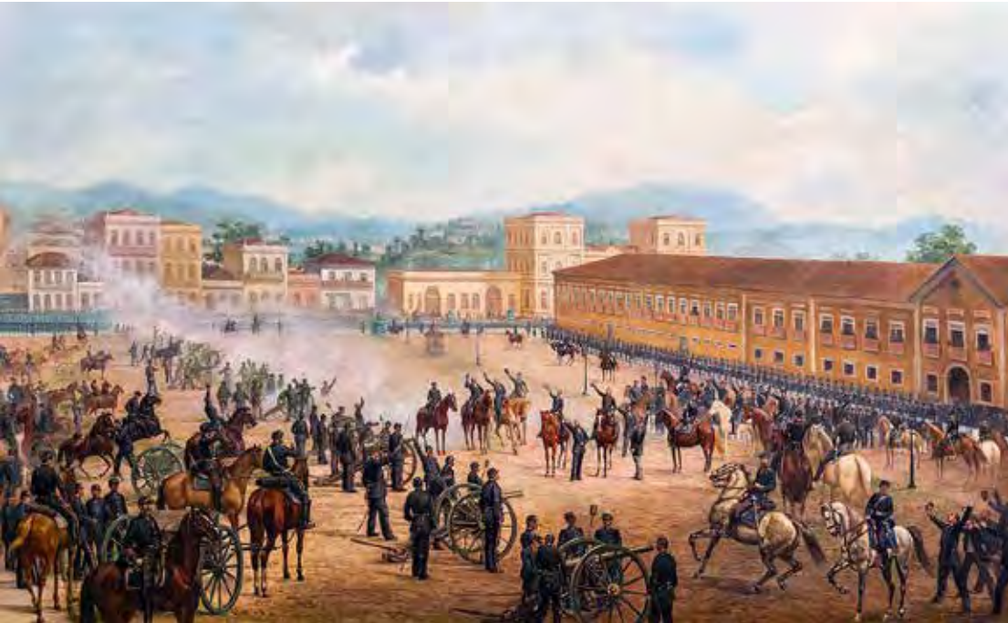
“Proclamação da República”, 1893, óleo sobre tela de Benedito Calixto (1853-1927)

governo imperial como responsável por prejuízos econômicos. A monarquia também convivia com conflitos com a Igreja e com movimentos civis republicanos que ganhavam força por meio de jornais e clubes políticos.