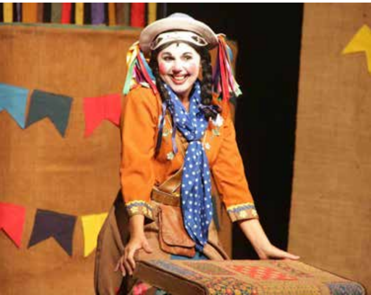
Evento será realizados com várias atividades culturais

espera e de um acontecimento fantástico, que contagia a todos e os faz viverem na expectativa de que algo mude em suas vidas.