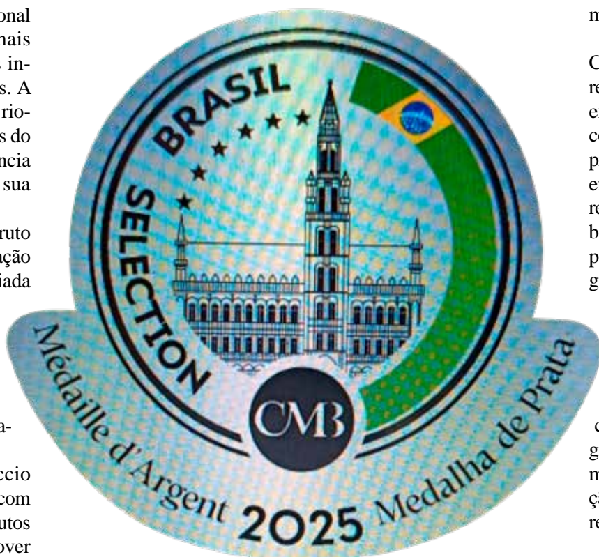
Cachaça Amburana Serra do Itaqueri , medalha de prata no Concurso Internacional de Bruxelas

Com o prêmio, a Casa Ferruccio e a Serra do Itaquê reforçam sua posição entre as empresas e marcas que elevam o nome da cachaca nacional ao patamar das grandes bebidas do mundo — mostrando que, quando tradição e ciência se encontram, o resultado é pura excelência.