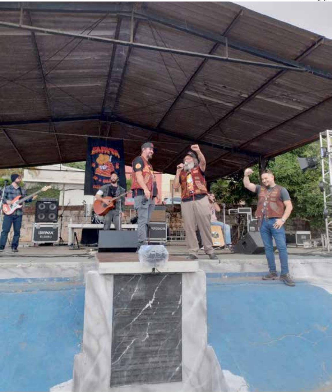
Evento realizado pelo Zapata Moto Clube (MC) no espaço livre