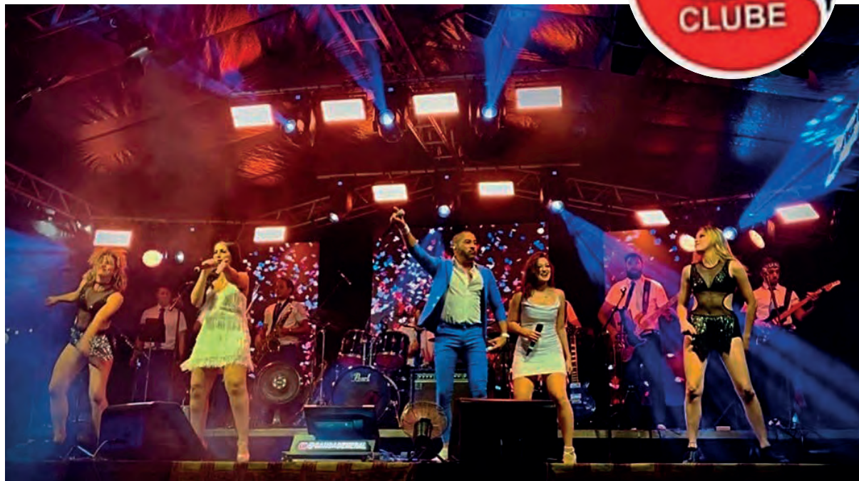
Banda General Lee da cidade de Rio Claro