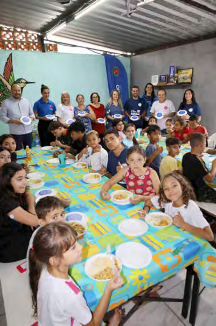
Famílias do Jardim Maria Cristina receberam marmitas preparadas por equipe do Fundo Social