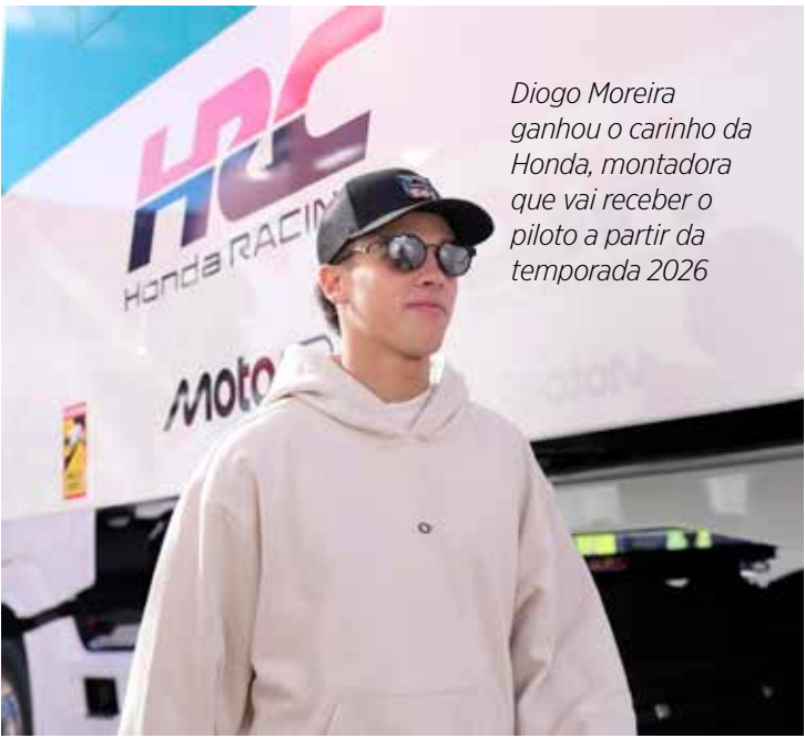
Diogo Moreira ganhou o carinho da Honda, montadora que vai receber o piloto a partir da temporada 2026

Em 2026, Moreira vai dar mais um salto na carreira. Antes mesmo de assegurar o título da Moto2, fechou contrato com a LCR, equipe satélite da Honda, para correr na MotoGP 2026, ao lado do veterano Johann Zarco. Na terça-feira (18), o brasileiro já participa do teste de pós-temporada da categoria e vai experimentar a nova moto pela primeira vez.