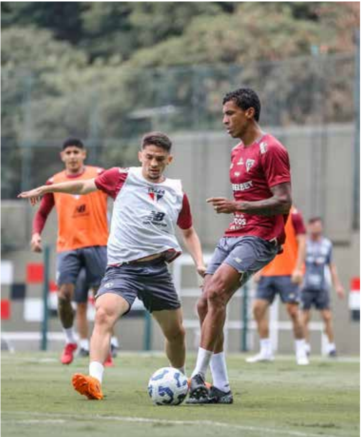
Tricolor intensifica os treinamentos visando o clássico contra o Corinthians no Brasileirão

comandou uma atividade de posse de bola em espaço reduzido, seguida por duelos individuais e confrontos em pequenos grupos. Para finalizar, três equipes se enfrentaram em uma série de jogos curtos, simulando situações de pressão e transição que devem ocorrer no clássico. Apesar da boa notícia envolvendo Pablo Maia, o Tricolor convive com problemas para o duelo diante do rival. O zagueiro Arboleda está fora de combate por causa de uma lesão muscular na coxa esquerda. Já Lucas Moura, com dores no joelho direito, será reavaliado na próxima semana por um especialista e tem chances reduzidas de entrar em campo contra o Corinthians. A comissão técnica avalia outras possibilidades para suprir as ausências, enquanto mantém o foco em ajustar o sistema defensivo e aprimorar a saída de bola, pontos considerados cruciais para enfrentar o Corinthians fora de casa. O São Paulo volta a treinar nesta quarta-feira, quando finaliza sua preparação antes de viajar para a capital paulista vizinha.