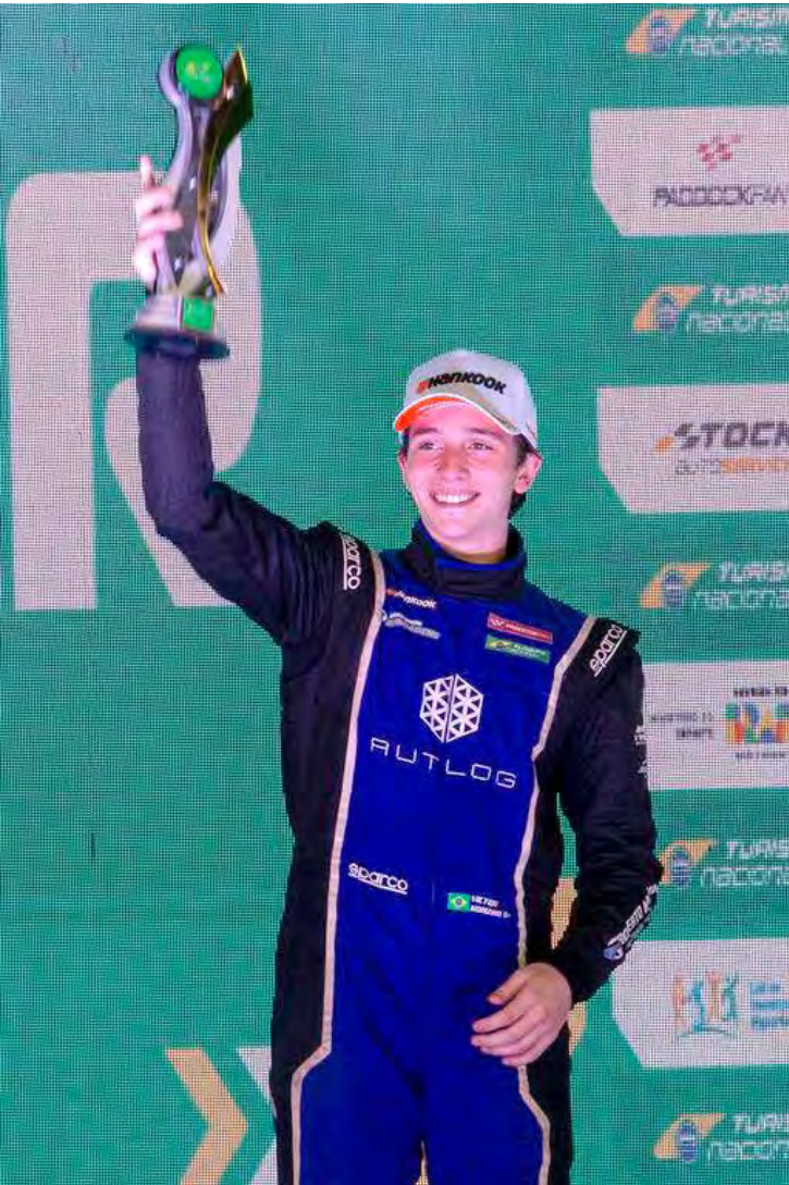
No pódio das corridas 1 e 2

A Turismo Nacional voltará à pista para a 8ª e última etapa do Campeonato Overall, com a segunda prova da Copa Endurance, para uma corrida de três horas disputada por duplas, de 12 a 14 de dezembro, no Autódromo de Interlagos, em programação conjunta com a final da Stock Car, da TCR South America, da TCR Brasil, e da Fórmula 4 Brasil, em São Paulo.