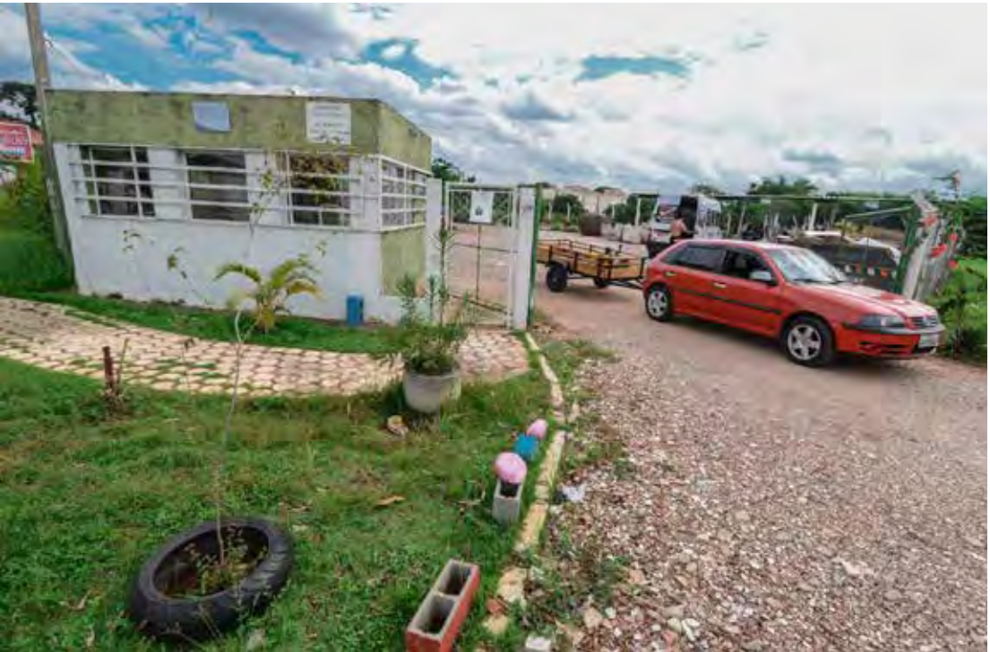
Ecopontos abrem em horário especial no feriado de quinta-feira

O serviço de cata-bagulho não será realizado no Dia da Consciência Negra, e será normal na sexta-feira. Aos sábados