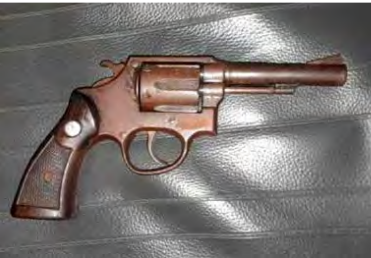
Polícia Militar do 10º BAEP apreende revólver calibre .38 em condomínio no bairro Nações II, em Rio Claro; porteiro foi preso por posse ilegal de arma de fogo

O 10º Batalhão de Ações Especiais de Polícia (BAEP) prendeu na noite deste domingo (16) um homem de 32 anos por posse ilegal de arma de fogo de uso restrito no condomínio Suíça, no bairro Nações II, em Rio Claro. A ocorrência foi registrada por volta das 18h30 durante patrulhamento tático voltado ao enfrentamento da criminalidade violenta e da guerra entre facções na cidade. Segundo a Polícia Militar, a equipe recebeu informações de um relatório de diligência indicando que o porteiro do condomínio trabalharia armado. No local, os policiais abordaram dois indivíduos, mas nada ilícito foi encontrado inicialmente. Um deles, identificado como D.B.M., apresentou informações contraditórias sobre seus dados pessoais e afirmou ser analfabeto,