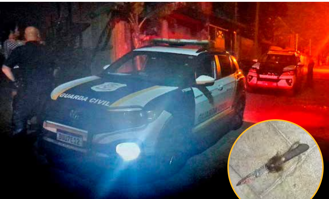
GCM deteve suspeito a poucos metros do local do crime; mãe foi socorrida com ferimentos na cabeça e no pescoço

perícia da Polícia Científica. A vítima foi levada ao hospital consciente, apresentando múltiplos ferimentos de arma branca na cabeça e no pescoço. Em depoimento, ela relatou que o filho mora com ela, faz uso de drogas e possui histórico de transtornos psiquiátricos. Segundo a vítima, a agressão ocorreu após uma discussão. Na delegacia, o acusado permaneceu em silêncio. A Polícia Civil ratificou o flagrante e representou pela prisão preventiva. Ele foi encaminhado ao setor carcerário, enquanto a mãe deverá ser ouvida novamente assim que receber alta médica.