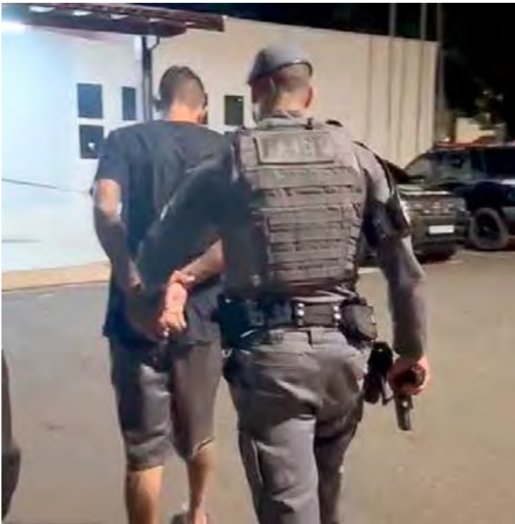
Polícia Militar durante a ocorrência que resultou na captura de um procurado no Jardim Panorama, em Rio Claro, na noite deste domingo (16)

A Polícia Militar prendeu na noite deste domingo (16) um homem procurado pela Justiça durante ação do Patrulhamento de Ações Especiais de Polícia (AEP) no Jardim Panorama, em Rio Claro. A captura ocorreu por volta das 18h25, na Avenida 62, após o suspeito demonstrar comportamento evasivo ao avistar a equipe. Segundo informações do 37º Batalhão de Polícia Militar do Interior, o indivíduo — identificado como E.T.C. — deixava uma habitação coletiva quando percebeu a aproximação da viatura e retornou rapidamente para o interior do imóvel. A atitude chamou a atenção dos policiais, que realizaram a abordagem. Na busca pessoal, nada de ilícito foi encontrado. Questionado sobre o motivo da fuga, o homem confessou estar na condição de procurado. A equipe confirmou a