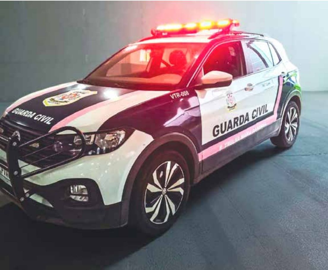
GCM resgata mulher agredida e mantém suspeito sob custódia após ameaças e violência na Rodoviária de Rio Claro

Segundo o relato, a vítima afirmou que estava sendo agredida por três homens e impedida de deixar o local. O ex-companheiro, também de 32 anos, com quem ela tem filhos, teria ido até a casa da mãe da vítima para armar uma emboscada com o objetivo de atrair o novo namorado. Ele tomou o celular da mulher e forçou a realização de uma chamada de vídeo com o atual companheiro, instruindo-o a ir até a rodoviária.