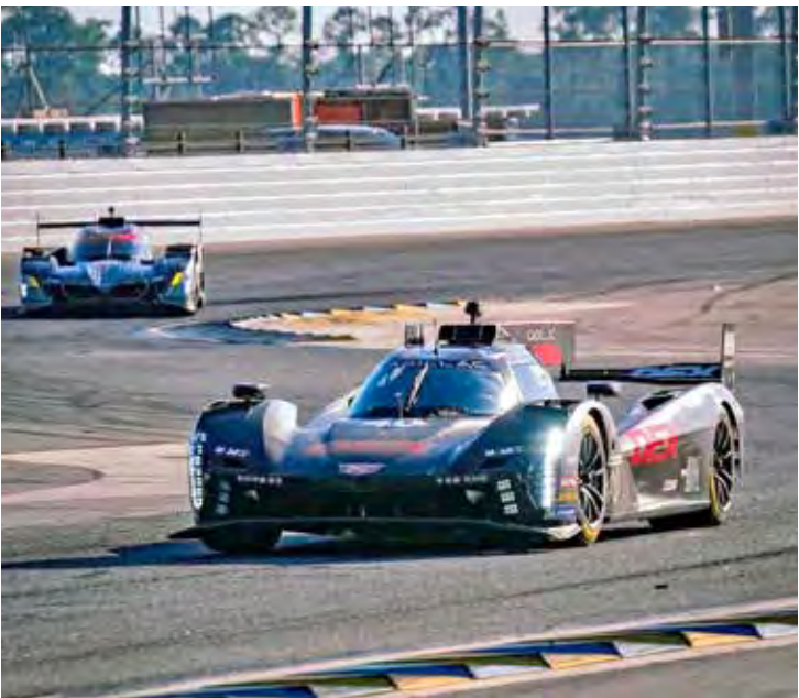
Testes de pré-temporada da IMSA foram realizados em Daytona

A temporada 2026 do IMSA SportsCar começa na Flórida, com as 24 Horas de Daytona, entre os dias 24 e 25 de janeiro.