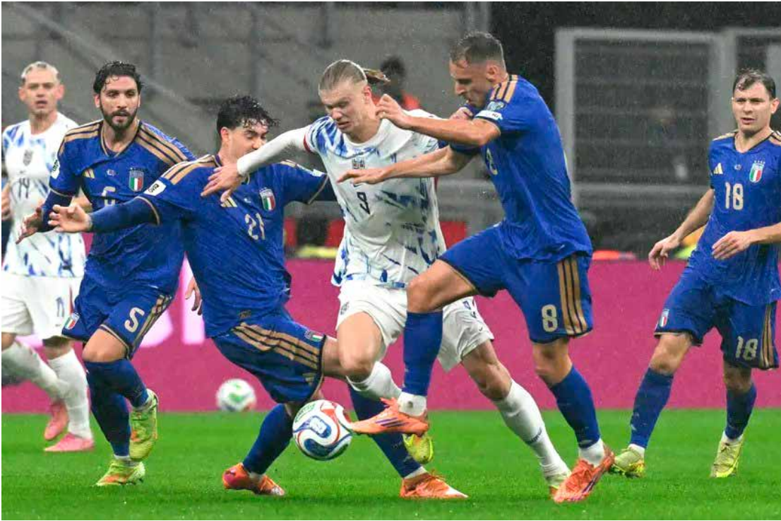
A Noruega de Haaland, goleia e joga os italianos para a Repescagem

Eslováquia e Alemanha venceram seus adversários da quinta rodada e partem para a definição do grupo na última rodada classificatória. Ambas equipes com 12 pontos definiram quem se classifica direto e quem vai para a repescagem na tarde de segunda-feira última, 17/11. A Alemanha precisava só de um empate para ir à Copa, enquanto a Eslováquia precisaria ganhar a partida pa-