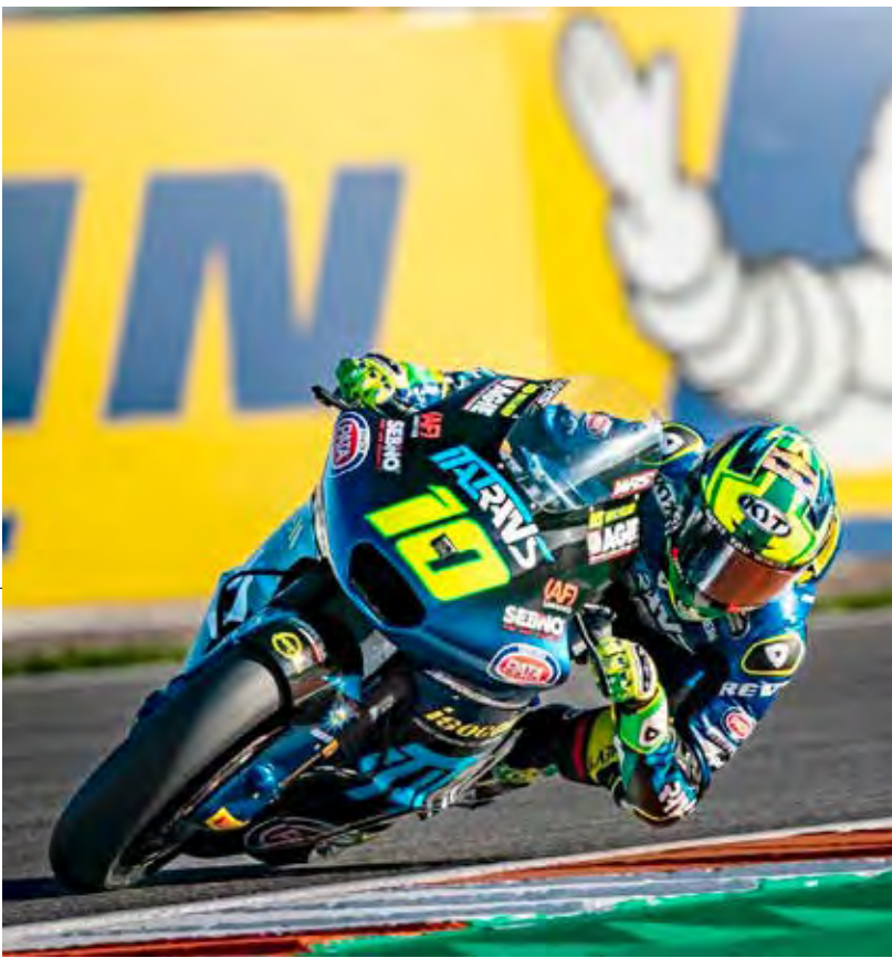
Diogo Moreira é campeão da Moto2 e dá título inédito ao Brasil