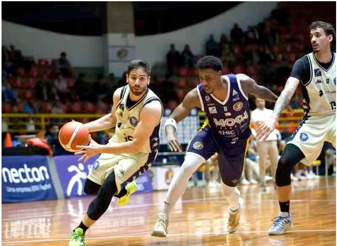
Conta Simples Rio Claro sofre nova derrota no NBB e segue pressionado na luta para deixar a parte de baixo da tabela