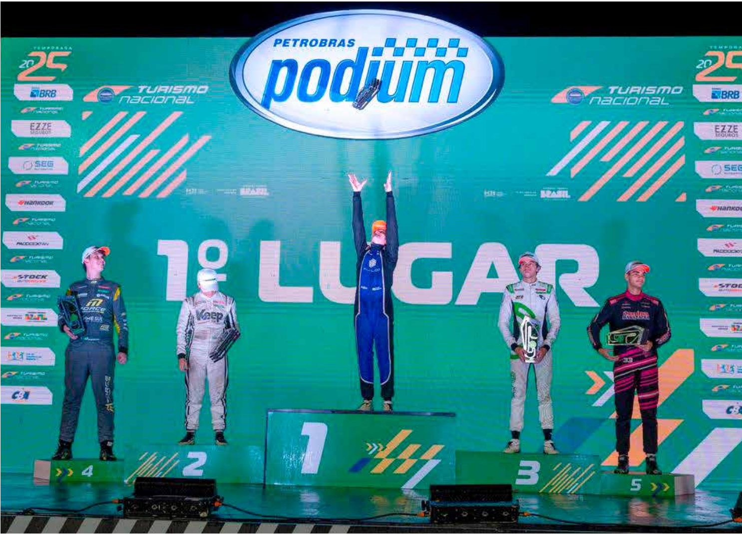
No alto do pódio da corrida 6 da 6a etapa, em Campo Grande

“A corrida 6 foi muito boa. Larguei da 2ª posição. Senti que meu motor não estava muito bom, perdendo rendimento, principalmente em final de reta. Em compensação, no miolo, nas curvas mais de baixa, eu con-