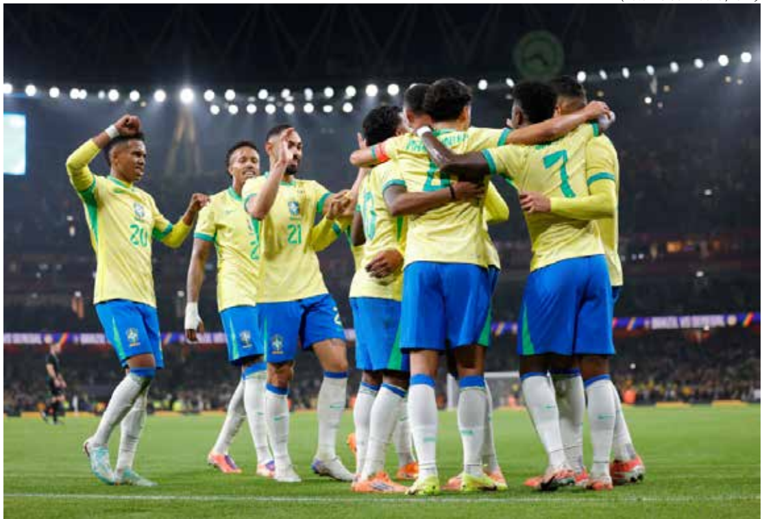
Jogadores comemoram o segundo gol do Brasil no amistoso em Londres

A Seleção Brasileira entra em campo nesta terça-feira (18) para enfrentar a Tunísia em amistoso válido pela preparação para a Copa do Mundo. A partida está marcada para as 16h30 (de Brasília), em Lille, na França. O Brasil chega ao confronto embalado após vencer o Senegal por 2 a 0 no último sábado (15), com gols de Estêvão e Casemiro. Apesar do bom momento recente, a equipe comandada por Carlo Ancelotti busca consolidar ajustes após uma campanha irregular nas Eliminatórias, nas quais garantiu vaga, mas terminou apenas na quinta colocação — o pior desempenho brasileiro na história da competição — somando oito vitórias, quatro empates e seis derrotas, totalizando 28 pontos.