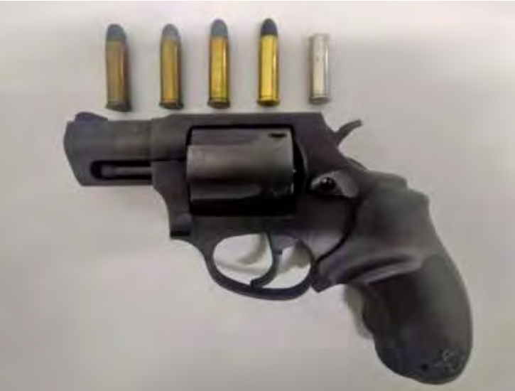
BAEP apreende revólver calibre .38 e prende homem por porte ilegal de arma no bairro Santa Maria, em Rio Claro

O 10º Batalhão de Ações Especiais de Polícia (BAEP) prendeu na noite deste domingo (16) um homem por porte ilegal de arma de fogo no bairro Santa Maria, em Rio Claro. A ocorrência foi registrada por volta das 21h, durante patrulhamento de Ações Especiais de Polícia pela Rua 15. Segundo informações da equipe, o indivíduo tentou despistar os policiais ao notar a aproximação da viatura, entrando rapidamente em um bar. A atitude levantou suspeita e motivou a abordagem. O homem foi identificado como M.A.F.J., de