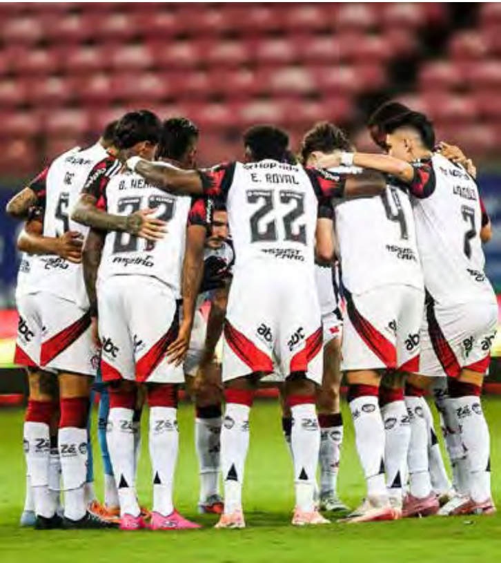
Flamengo é o novo líder do Campeonato Brasileiro após golear o Sport

Para o Santos, o triunfo teve peso duplo. O gol marcado por Rollheiser aos 45 minutos do segundo tempo garantiu três pontos fundamentais na disputa contra o rebaixamento. Com a vitória, o Peixe chegou aos 36 pontos e subiu para a 16ª colocação, respirando fora da zona da degola.