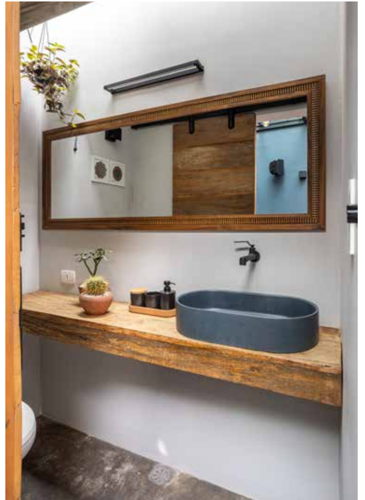
Projeto Atelier Paulo Tripoloni

Além desses cuidados, realizar uma manutenção periódica ajuda a manter a eficiência ao longo do tempo e a identificar trincas ou outros sinais de problemas que podem surgir.