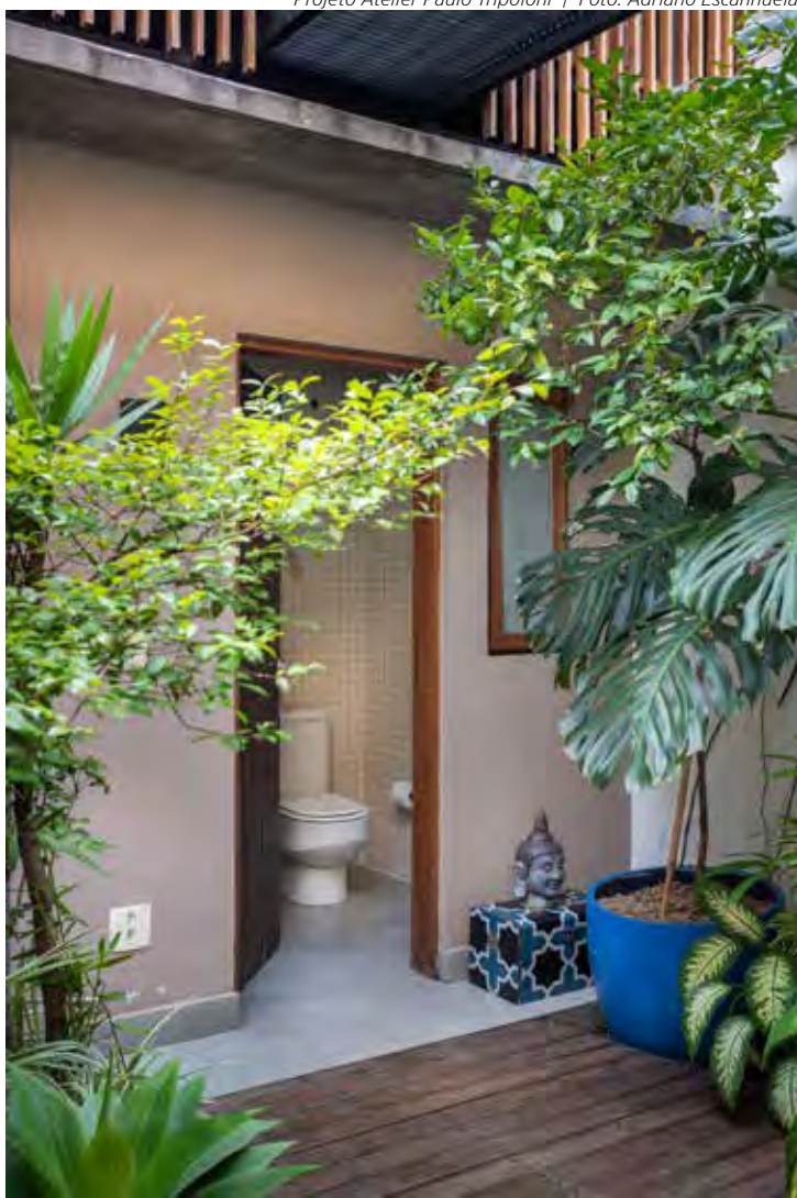
Projeto Atelier Paulo Tripoloni

Ao menor sinal de que algo pode estar errado, como o aparecimento de manchas escuras nas