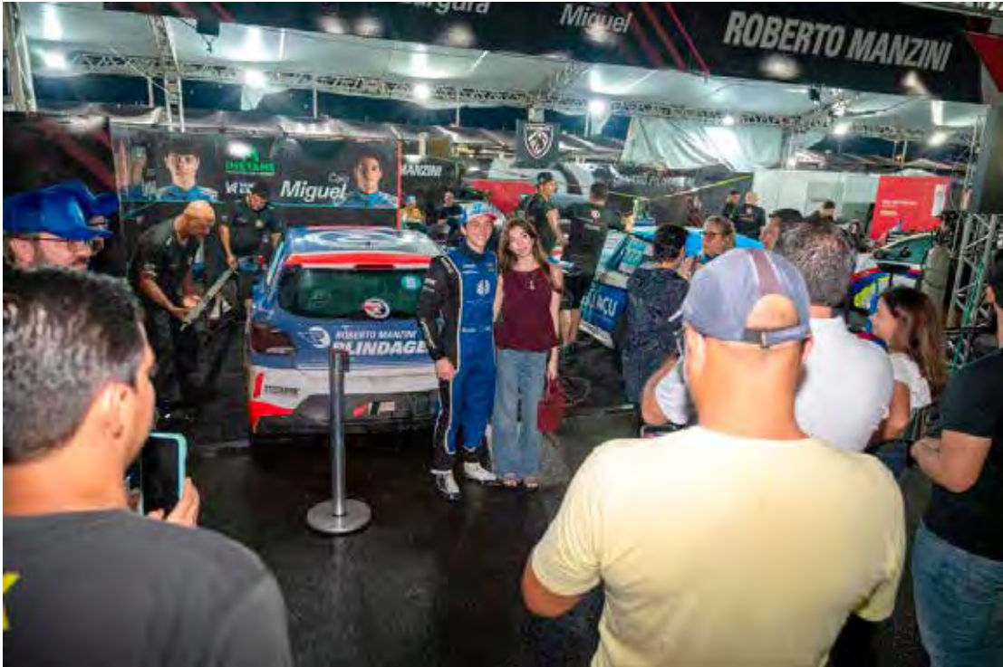
Visitação do público