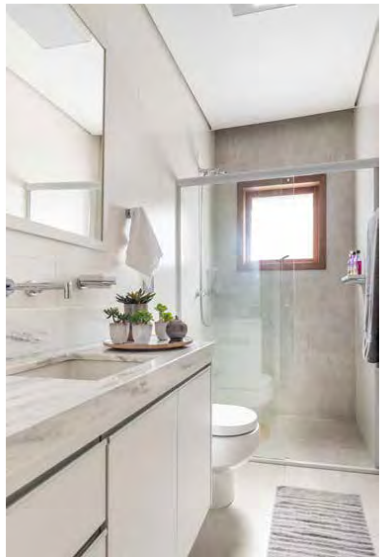
Projeto Atelier Paulo Tripoloni

Em ralos e cantos é recomendável aplicar reforço com tela estruturante ou aumentar o número de demãos