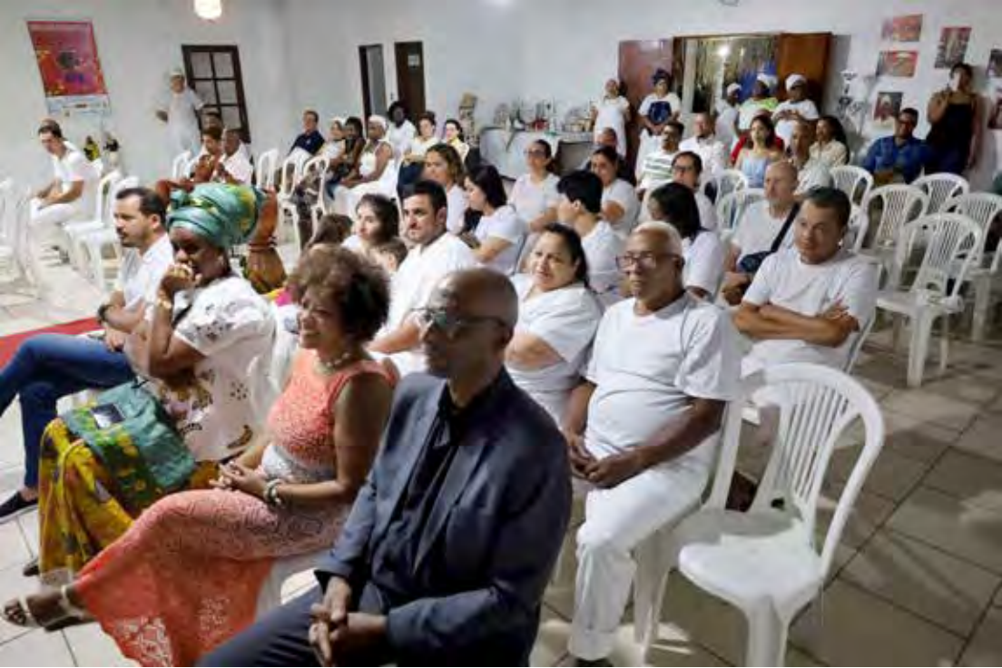
Na terça-feira (18) ocorreu o evento Ecos da Ancestralidade – vozes negras em movimento