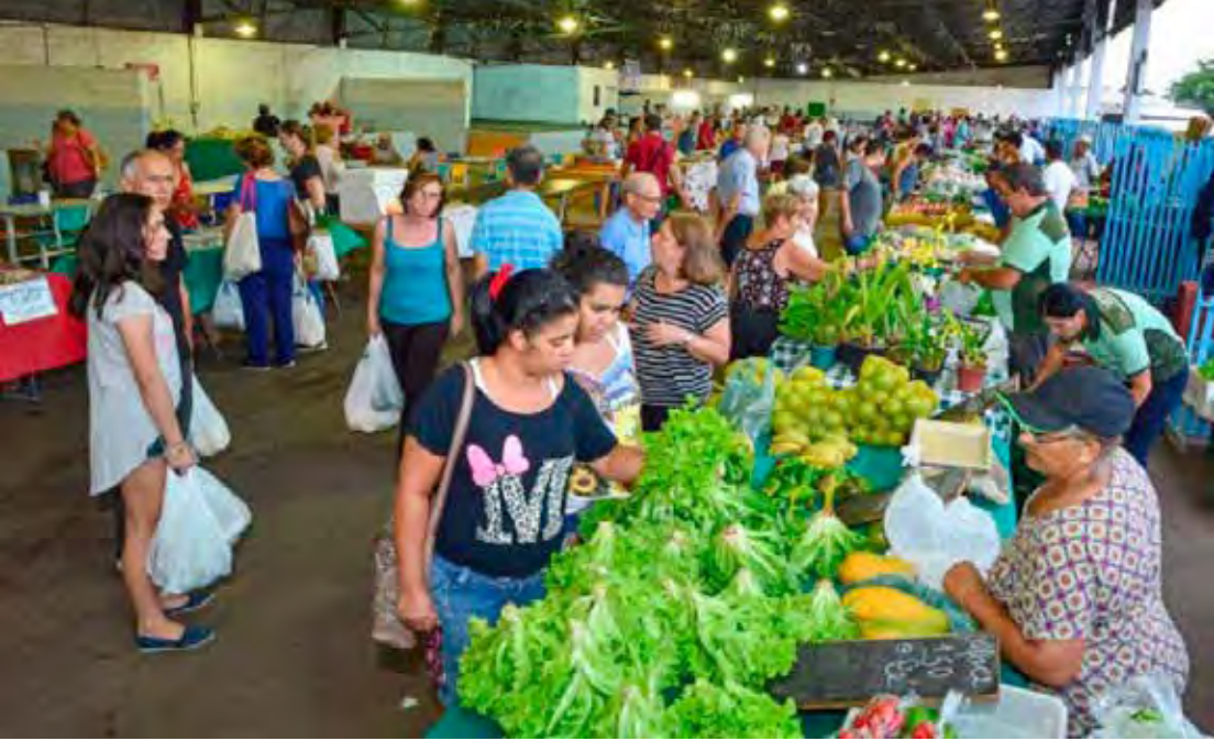
Sexta-feira (21) é dia de Festa Nordestina na Feira do Produtor Rural de Rio Claro, na Vila Martins