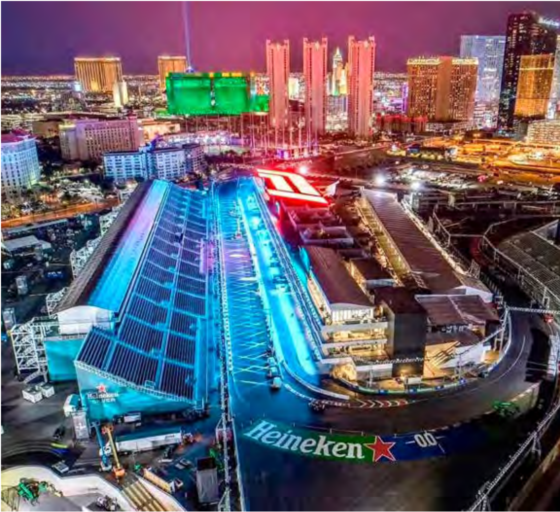
Atividades em Las Vegas começam nesta quinta-feira e corrida será na madrugada de sábado para domingo (F1)

Max Verstappen tenta permanecer na disputa e Las Vegas traz características que podem embaralhar o favoritismo — especialmente por causa das temperaturas extremamente baixas, que historicamente tiveram impacto direto no rendimento das equipes.