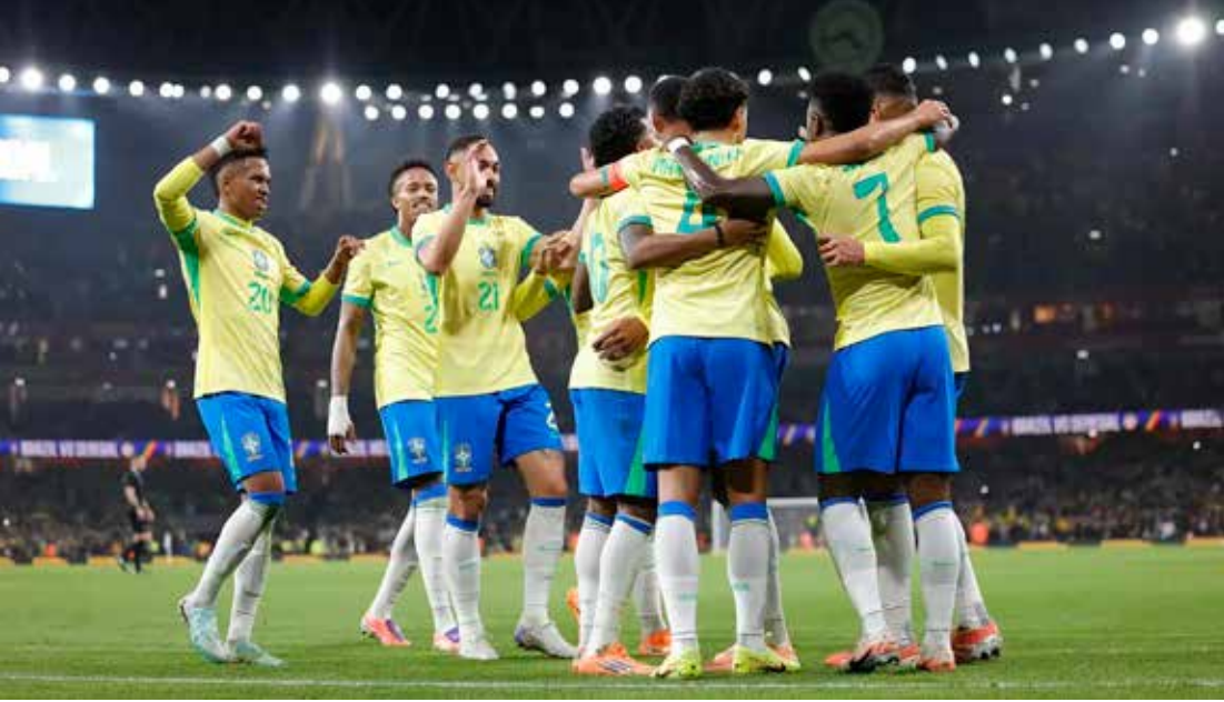
Seleção Brasileira Masculina de Futebol

● Robinho transferido. Robinho foi transferido para o Centro de Ressocialização de Limeira, a pedido da defesa. Desde março segue cumprindo a pena pela condenação italiana por estupro — decisão que o Brasil finalmente aceitou. O ex-atacante muda de unidade, mas não de realidade: a justiça tarda, mas às vezes chega. O drible, desta vez, não funcionou.