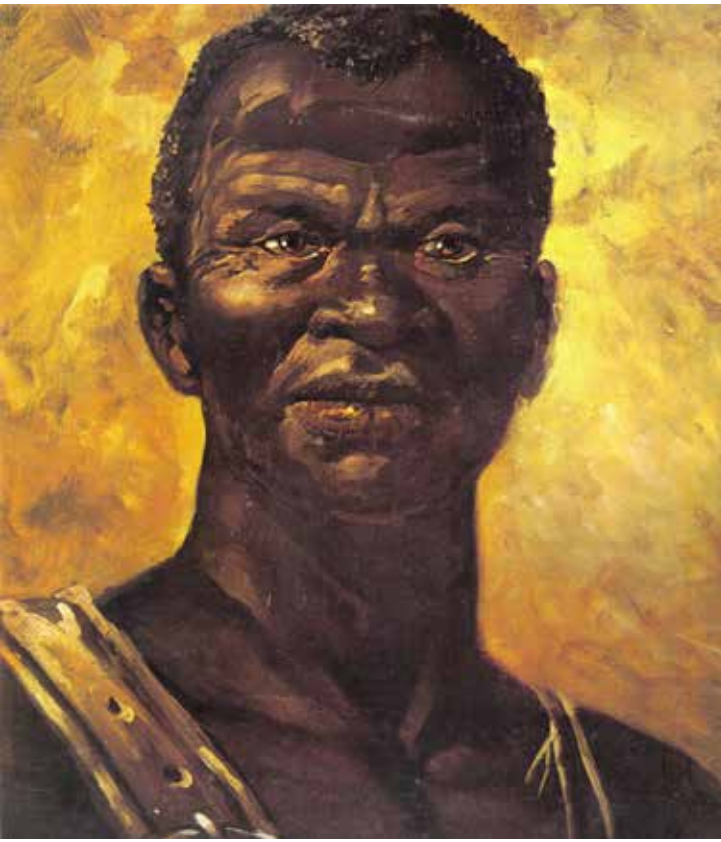
Zumbi dos Palmares

● Zumbi, símbolo que não caduca. O 20 de Novembro virou a data central da consciência negra porque, diferentemente do 13 de Maio, não celebra uma “liberdade por decreto”, mas a luta real — com sangue, estratégia e resistência. Zumbi não foi presente de princesa: foi liderança de um Brasil que insistia em existir. É curioso como o país lembra a abolição, mas esquece que largou milhões à própria sorte. Zumbi, ao menos, não deixa esquecer.