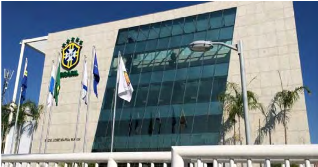
CBF confirma datas e horários das rodadas finais do Brasileirão 2025

Com a definição oficial, clubes e torcedores já podem se preparar para os momentos decisivos da temporada, que promete emoção até o último minuto.