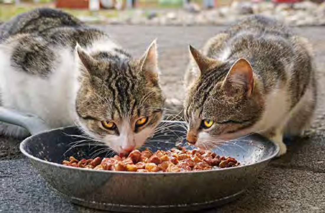
Os gatos se beneficiam de alimentos adaptados a cada fase de desenvolvimento, incluindo a castração