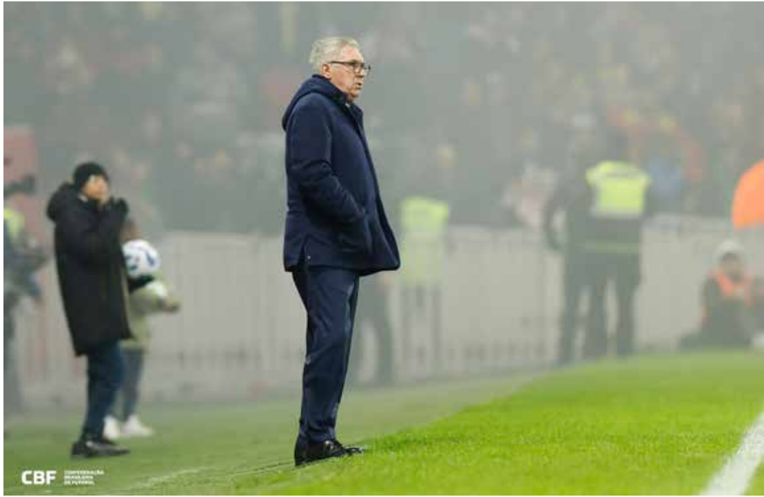
Carlo Ancelotti durante o amistoso entre Brasil e Tunísia, na Decathlon Arena, em Lille

“Desejo aos jogadores o melhor para todas as partidas que vão jogar. Estamos aqui observando, em contato com eles, e contato aberto até março e até a Copa do Mundo. Essa é a ideia que temos. O trabalho de observação vai ser muito importante”, afirmou.