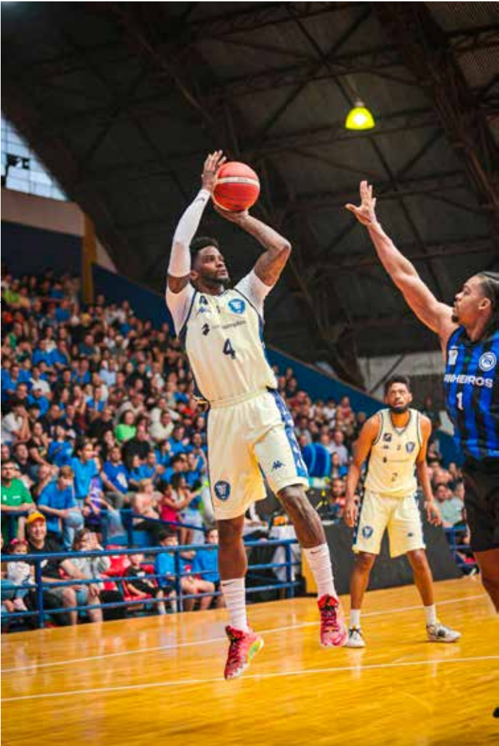
Conta Simples Rio Claro enfrenta o Botafogo nesta quinta-feira, às 20h, no Rio de Janeiro, buscando reação no NBB

A expectativa é de que o novo reforço da comissão e a preparação da semana possam impulsionar o Leão na busca por sua terceira vitória no campeonato.