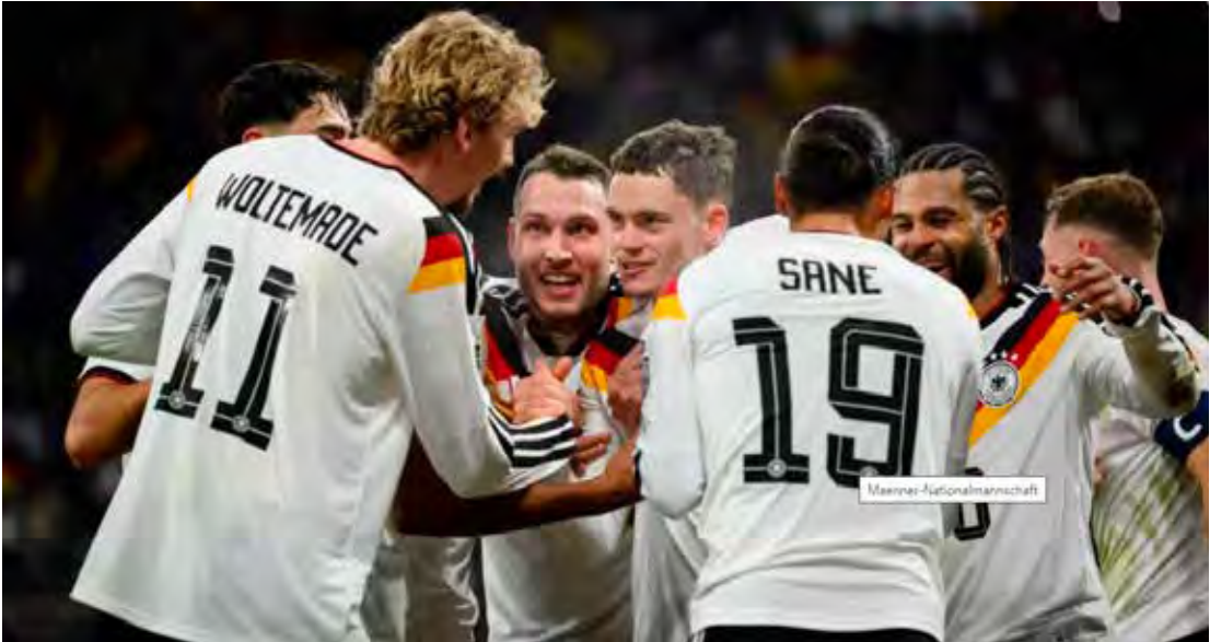
Alemanha comemorou gols seis vezes em jogo contra a Eslováquia e carimbou o passaporte para a Copa do Mundo de 2026

A vice-líder, Roma, viaja até Cremona, para enfrentar a 11ª, Cremonese. Já o quarto colocado, o Napoli, também com 22 pontos, 13ª colocada com apenas 13 pontos conquistados dos 33 possíveis.