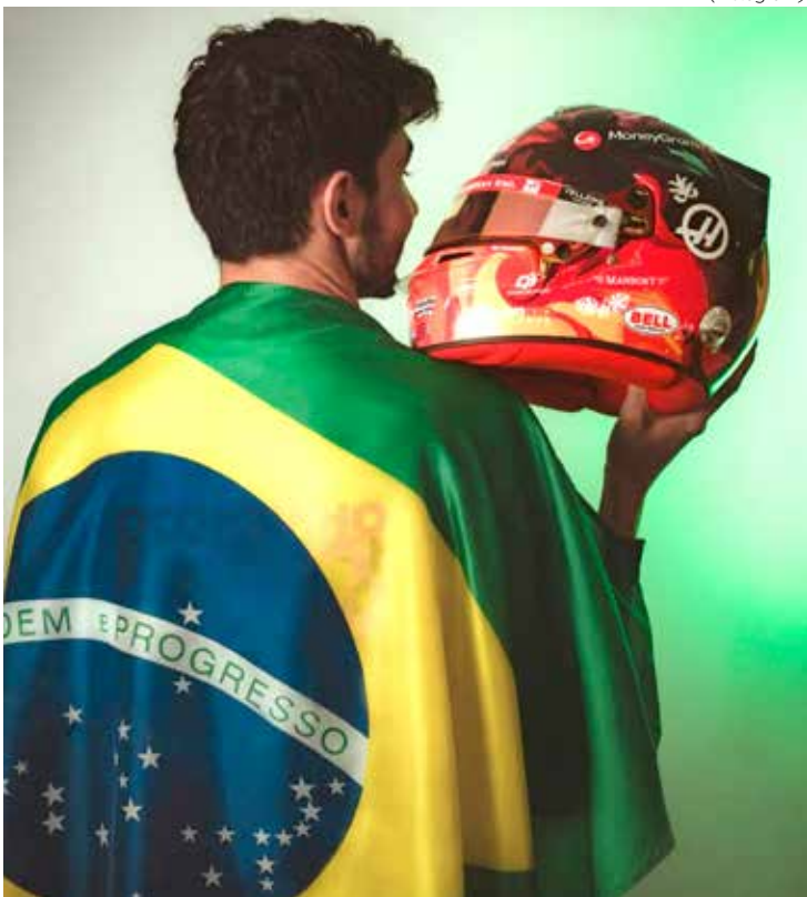
Imagens detalhadas da peça já estão disponíveis no site, onde os interessados podem se cadastrar para participar dos lances