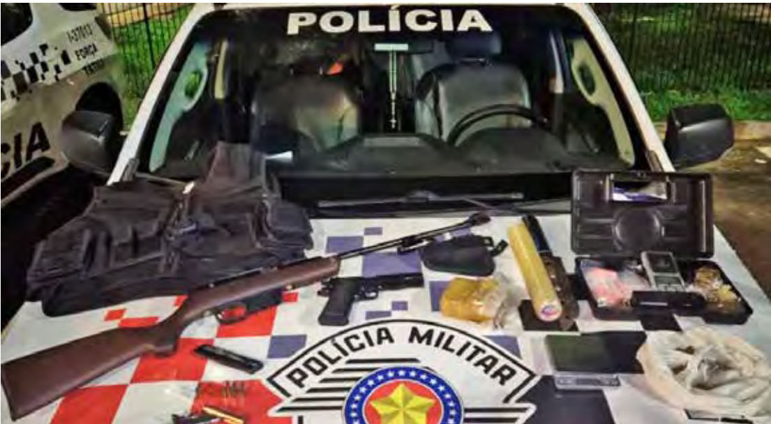
Armas, munições e drogas apreendidas durante uma ação da equipe de Força Tática de Rio Claro (SP) na noite desta terça-feira (18), em Araras (SP)

rização dos familiares, os policiais vistoriaram o imóvel e localizaram o objeto no quarto utilizado por ele. Em outro cômodo, dentro de um guarda-roupas, foram localizados porções de maconha, embalagens plásticas, papel filme, uma faca, duas balanças de precisão e uma capa tática de colete. Segundo a PM, o indivíduo admitiu ser o proprietário da droga. Após exame de corpo de delito no Hospital São Leopoldo Mandic, o homem foi encaminhado à Central de Polícia Judiciária. A autoridade plantonista confirmou sua prisão pelos crimes de porte ilegal de arma de fogo de uso permitido e tráfico de drogas. Ele foi assistido por sua advogada durante o procedimento. O caso segue à disposição da Justiça.