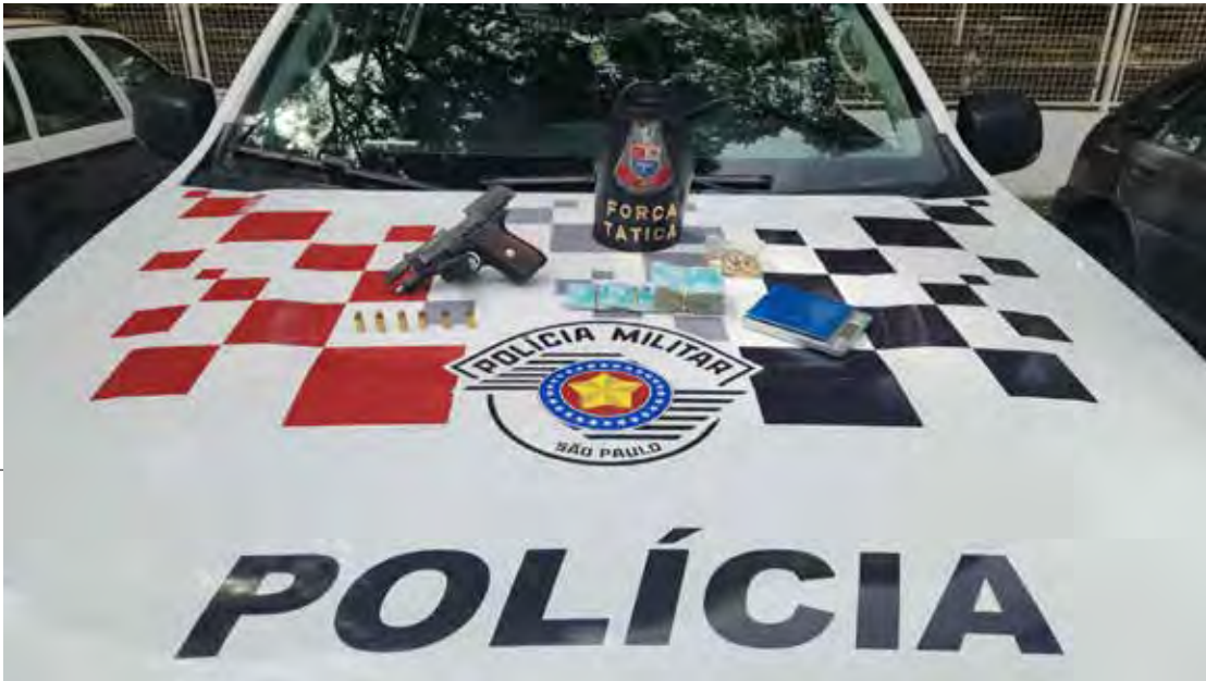
Pistola, munições, ouro e dinheiro apreendidos pela Força Tática durante abordagem no bairro Consolação, em RC

Segundo a Polícia Militar, o indivíduo possui antecedente pelo crime de porte ilegal de arma de fogo, previsto no artigo 14 do Estatuto do Desarmamento. Diante da situação, ele recebeu voz de prisão e foi conduzido ao Plantão Policial, onde permaneceu à disposição da Justiça. Todo o material apreendido foi apresentado à Polícia Civil.