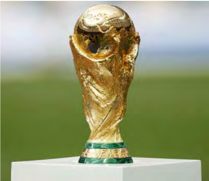
A taça da Copa do Mundo 2026; Brasil tentará mais uma vez o título

O sorteio também terá uma iniciativa inédita: torcedores das cidades-sede poderão concorrer a ingressos gratuitos para o Mundial, incluindo uma experiência VIP. Um número pré-determinado de entradas será distribuído em cada município que receberá jogos.