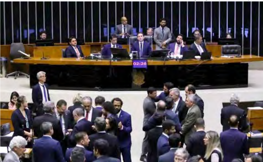
PL Antifacção na Câmara

● PL Antifacção na Câmara. A Câmara aprovou o PL Antifacção com 370 votos, e o relator Derrite já está no quinto texto — virou praticamente uma saga literária. O governo diz que o projeto desfigurou o original; Derrite jura que é “legislação de guerra”. No fim, parece guerra mesmo: cada lado atira versões, acusações e metáforas. Só quem perde é a coerência.