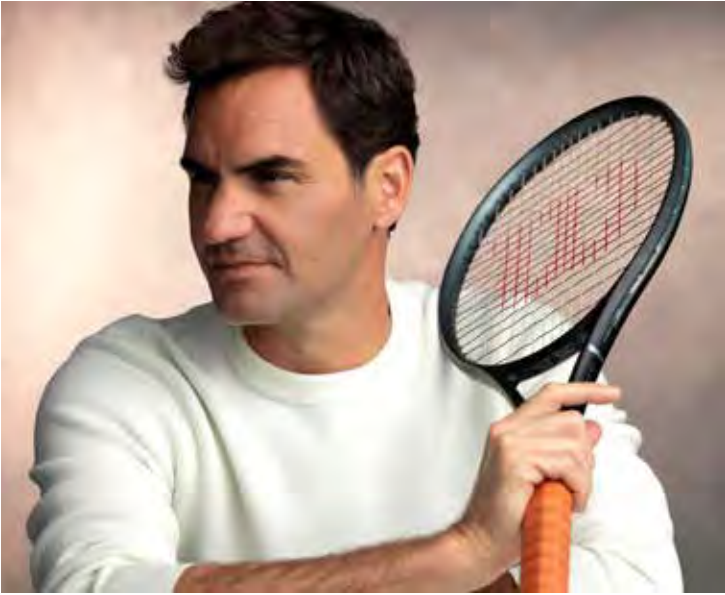
Roger Federer