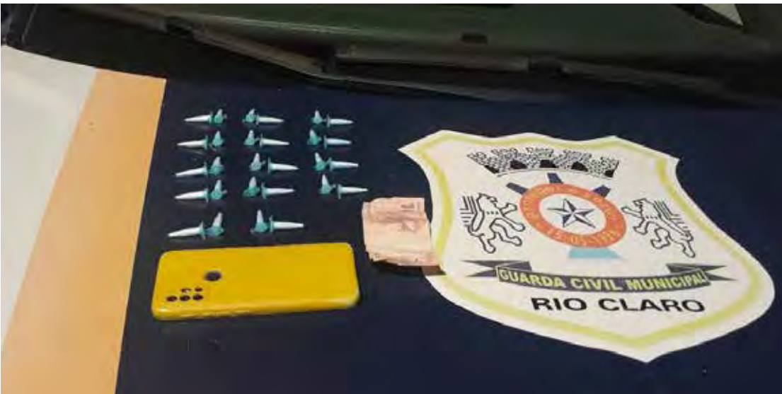
GCM apreende 28 porções de cocaína e prende homem por tráfico no Jardim Araucária

vender drogas e alegou enfrentar dificuldades financeiras. Ele recebeu voz de prisão em flagrante, teve os direitos constitucionais informados e foi algemado, medida necessária para garantir a segurança da equipe e do próprio detido. O suspeito foi conduzido ao Plantão Policial, onde a autoridade de Polícia Judiciária ratificou a prisão. Ele permaneceu encarcerado à disposição da Justiça. A Guarda Civil Municipal reforçou que permanece à disposição da população pelos telefones 153 e 0800-771-1532.