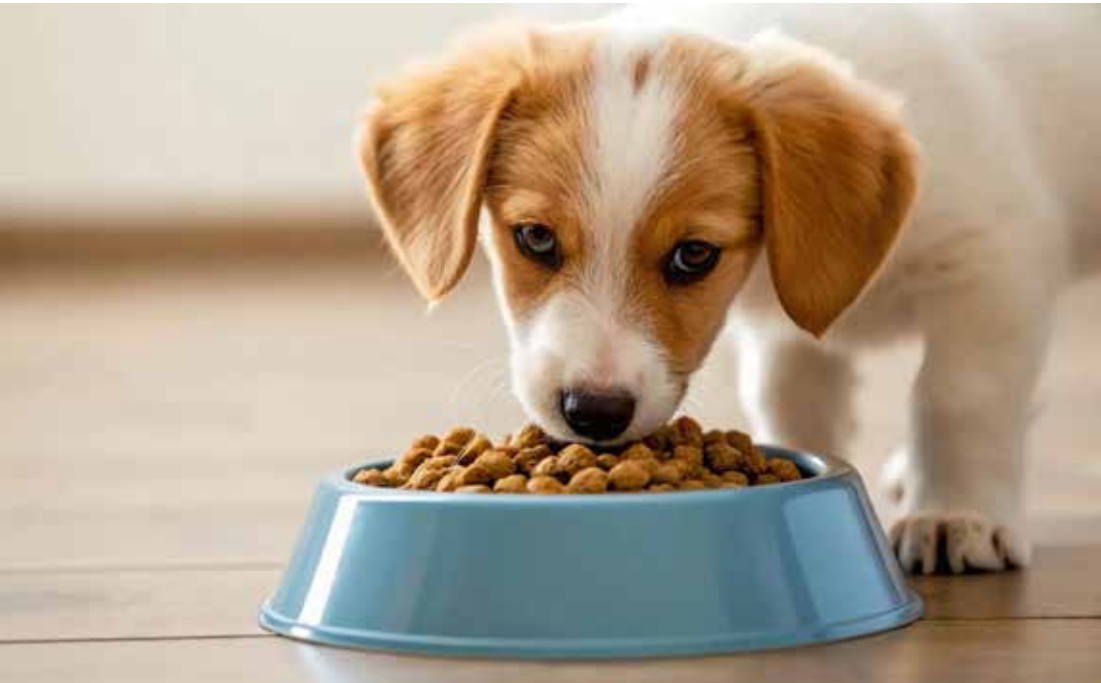
Nos cães, o porte influencia diretamente o ritmo de crescimento e as exigências nutricionais