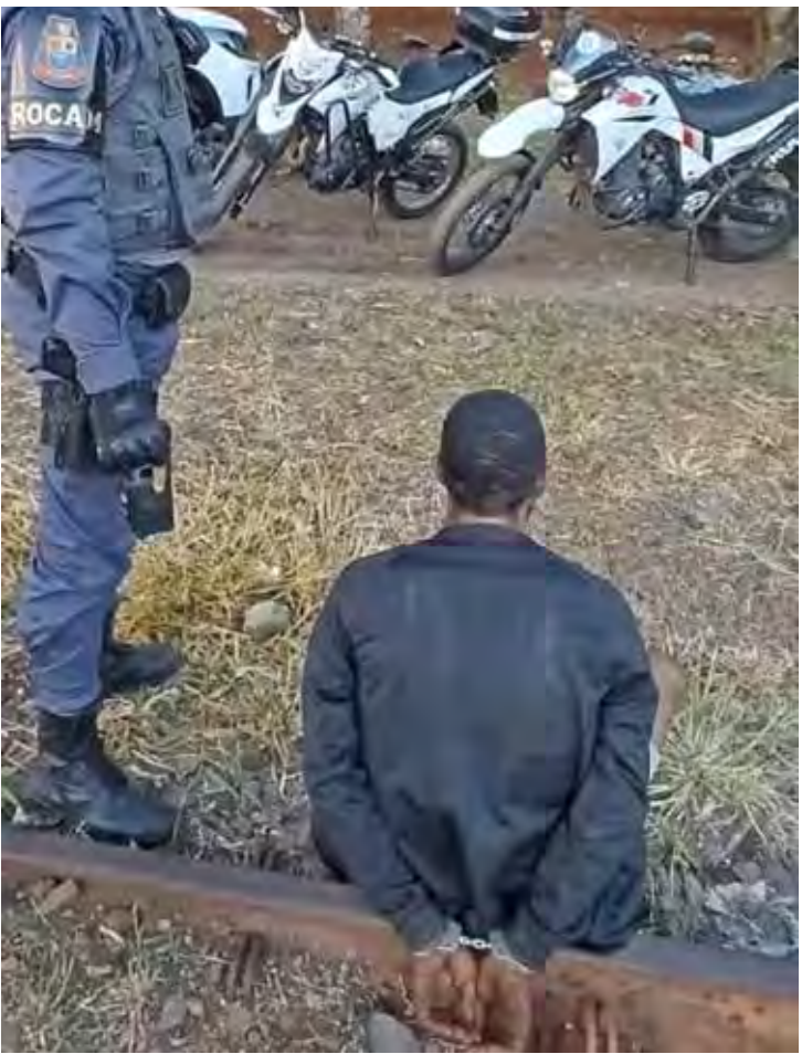
ROCAM prende procurado por tráfico após abordagem na linha férrea do Cidade Nova, em Rio Claro

A Polícia Militar prendeu na noite de terça-feira (18) um homem procurado pela Justiça durante patrulhamento da equipe de ROCAM no bairro Cidade Nova, em Rio Claro (SP). A ação ocorreu após os policiais avistarem diversos indivíduos próximos aos vagões da linha férrea, área frequentemente usada como rota de fuga e esconderijo. Com a aproximação da viatura, o grupo tentou se abrigar entre os vagões, mas acabou abordado. Durante a revista pessoal, nada de ilícito foi encontrado. No entanto, após consulta ao sistema via 190, os policiais identificaram que um dos indivíduos possuía mandado de prisão em aberto pelo crime de tráfico de drogas. De acordo com a PM, o homem é condenado a 7 anos e 9 meses de prisão, a serem cumpridos em regime fechado. Diante da ordem judicial vigente, ele recebeu voz de prisão e foi conduzido ao Plantão Policial, onde permaneceu recolhido à disposição da Justiça.