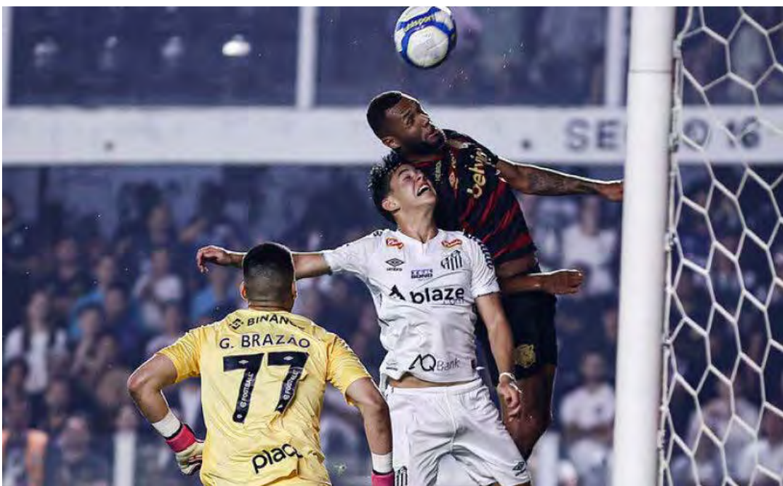
Santos joga na Vila Belmiro pressionado por vitória fundamental na corrida contra o rebaixamento