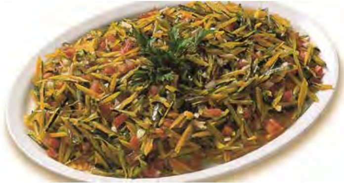
■ Salada de casca de abóbora

separe o pescoço e corte-o em fatias muito finas.