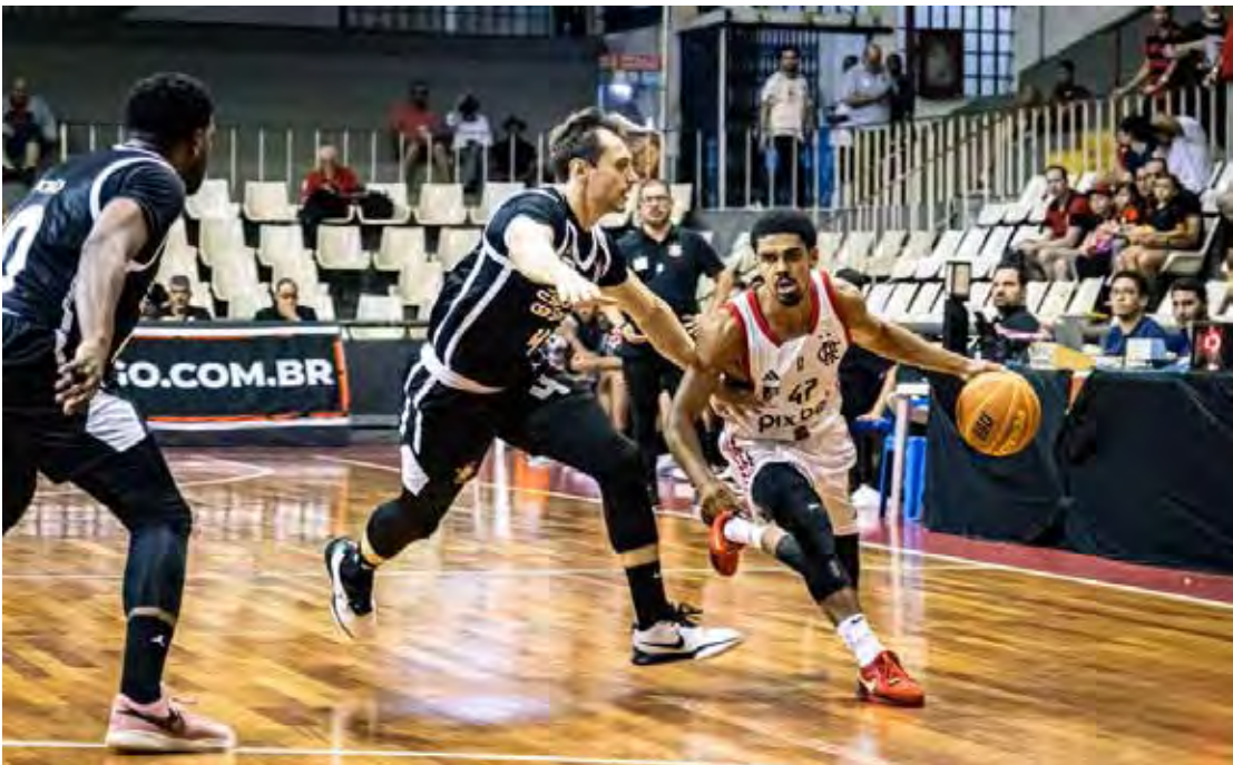
Basquete do Corinthians corre risco de ser paralisado em 2026 por falta de recursos

— Quero deixar uma coisa bem clara: o dinheiro do futebol não vem mais para o clube social, o dinheiro do futebol ficará no futebol. O futebol apenas carregará a categoria de base (futebol de campo) e a base do futsal. Fora isso, o futebol não paga mais nenhuma despesa do clube. Com isso, o Corinthians não terá mais equipes de basquete a partir do próximo ano, a menos que surjam parceiros dispostos a bancar o projeto e evitar a interrupção da modalidade no Parque São Jorge. O anúncio acontece em momento de destaque das equipes. O time feminino está na final do Campeonato Paulista, enquanto o masculino ocupa a quarta posição no NBB, com oito vitórias em dez partidas.