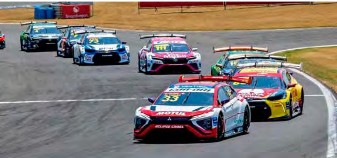
Stock Car realiza a 11ª da temporada 2025 no Autódromo Internacional de Brasília