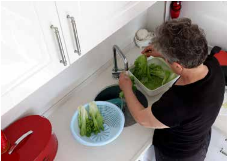
Higienize tanto para consumo imediato como para armazenar

Para higienizar adequadamente as frutas e hortaliças, as orientações abaixo ajudam a reduzir os riscos de doenças transmitidas por alimentos: