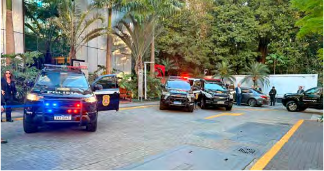
Cerca de 600 agentes em campo em São Paulo, Rio de Janeiro, Minas Gerais, Bahia, Distrito Federal e Maranhão para cumprir mandados de busca e apreensão

As investigações mostraram ainda que os mecanismos de ocultação e proteção dos verdadeiros beneficiários das fraudes foram realizados por meio de uma rede de colaboradores. Utilizando diversos expedientes como falsificações, estruturas societárias e financeiras em camadas, entre outras práticas. Essa rede assegurava a gestão e a expansão do grupo empresarial em diferentes setores da cadeia de produção e distribuição de combustíveis.