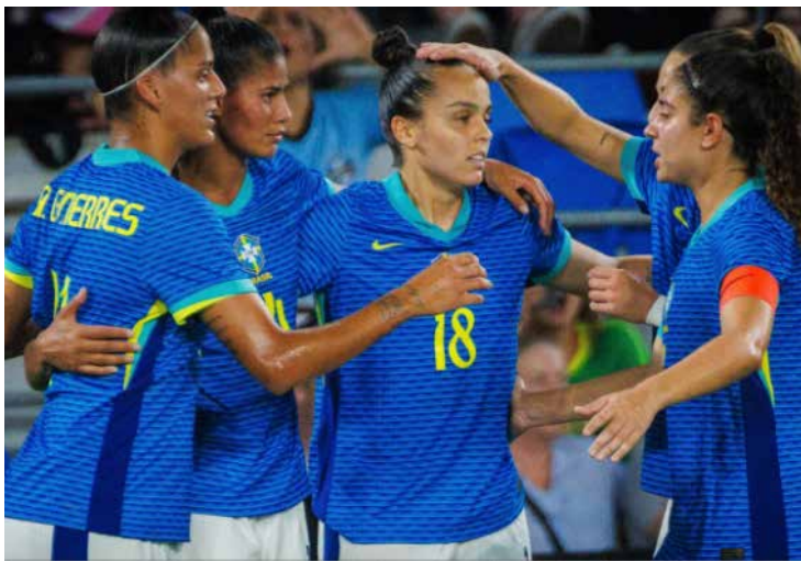
Brasil encerra o ano enfrentando a Noruega em amistoso na Espanha