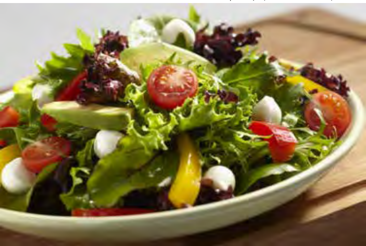
■ Salada fresca