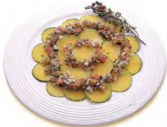
■ Carpaccio de abóbora