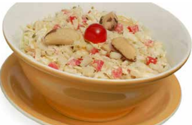
■ Salada de repolho com melão