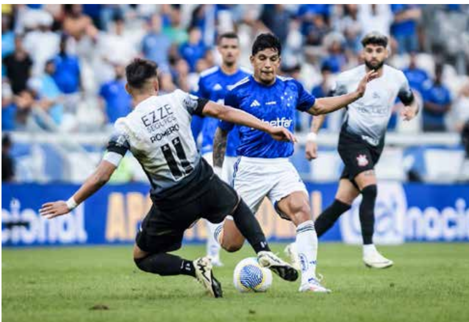
Corinthians e Cruzeiro negociam percentual de ingressos para jogos decisivos da Copa do Brasil

De acordo com as contas corinthianas, o percentual garantiria aproximadamente 3,2 mil ingressos à torcida visitante no jogo de ida, no Mineirão, no dia 10 de dezembro — já que o estádio comporta cerca de 62 mil pessoas. Para o confronto de volta, em 14 de dezembro, na Neo Química Arena, o Cruzeiro teria direito a cerca de 2,5 mil lugares. Em nota, o clube mineiro confirmou que segue tratando do tema diretamente com os paulistas: “O Cruzeiro está tratando todos os assuntos relativos à operação das partidas da semifinal da Copa do Brasil diretamente, e diariamente, com o Corinthians.” Os clubes devem anunciar nos próximos dias a definição do acordo para a comercialização dos ingressos.