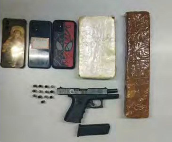
Operação do Baep e Gaeco em Araras apreendeu droga e arma, além de dois dos suspeitos mortos

Além das mortes, a operação resultou na apreensão de nove apa-