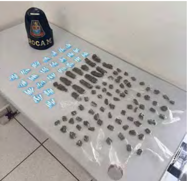
Entorpecentes apreendidos pela ROCAM durante abordagem a adolescentes no bairro Cervezão.

que parte do entorpecente seria escondida posteriormente. Os responsáveis legais foram acionados, e a ocorrência apresentada no Plantão Policial. Os adolescentes foram ouvidos e liberados aos genitores, enquanto todos os materiais apreendidos seguiram para perícia.