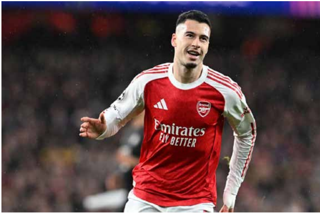
Com gol do brasileiro Gabriel Martinelli, o Arsenal venceu ao Bayern de Munique pelo placar de 3 x 1