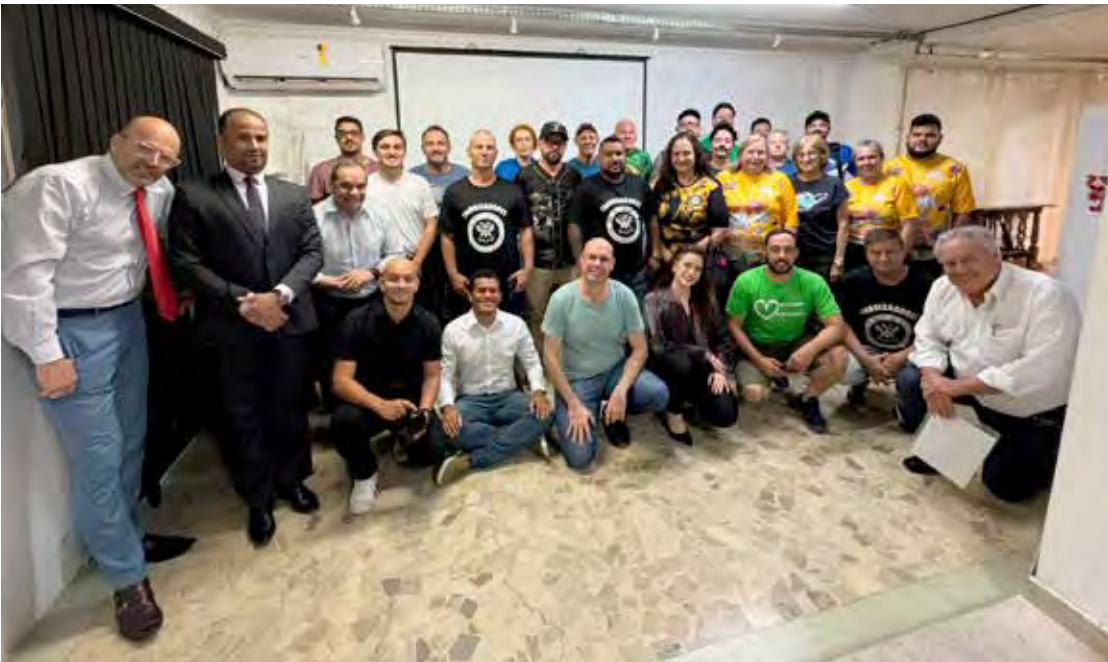
A nova gestão da Uesca foi eleita por unanimidade no dia 19 de novembro

O setor privado também será envolvido através da implementação de captação de recursos, e ativação de ações de marketing