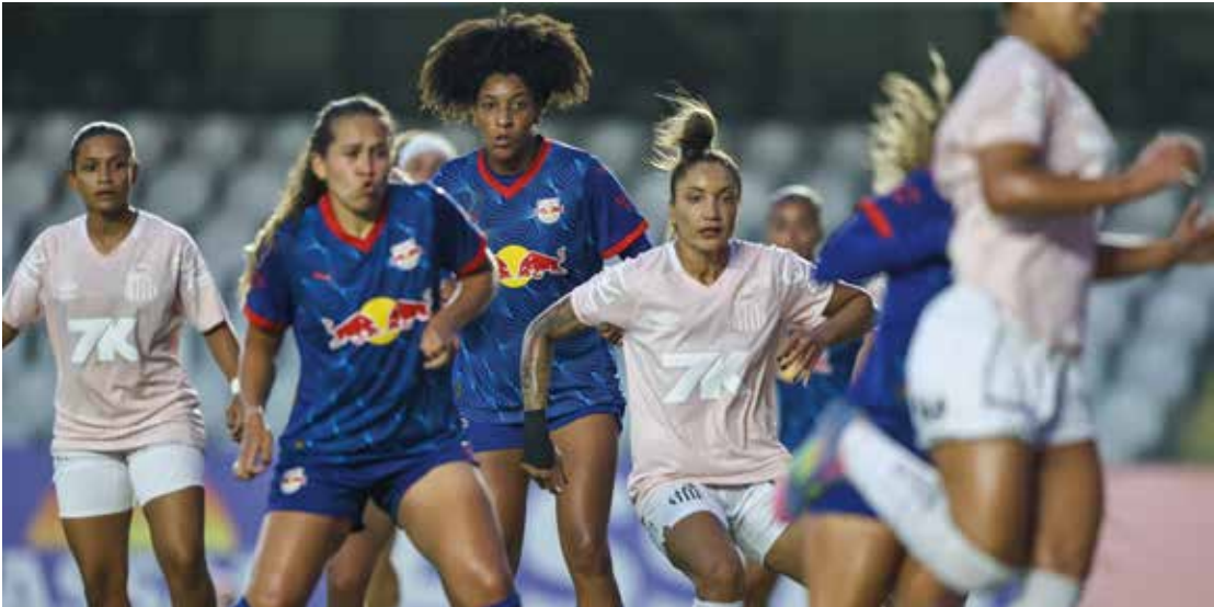
O confronto único que vale a taça da competição está marcado para este domingo, 30 de novembro, às 15h.

no Sicredi, Red Bull Bragantino e Santos foram 5º e 6º colocados da competição, respectivamente, e fizeram confrontos equilibrados, mas com vantagem da equipe de Bragança Paulista. No primeiro turno, vitória bragantina por 1 a 0 na Vila Belmiro; enquanto na última rodada da primeira fase, em Santana de Parnaíba, o já eliminado time santista foi derrotado novamente, agora por 3 a 2, pela equipe que ainda tentava uma vaga na semifinal, mas que ficou de fora com o empate de São Paulo com a Ferroviária.