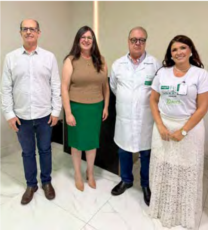
Membros do Hospital Unimed e do projeto