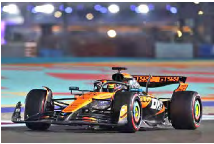
E cá está ele de volta na pole da Sprint Race neste sábado

Eles devem, nos momentos mais quietos, sentir algo parecido com gratidão. Por um carro que finalmente faz curva sem reclamar. Por engenheiros que não dormem desde Melbourne no início da Temporada. Por rivais ferozes o suficiente para fazer a vitória valer alguma coisa. Até