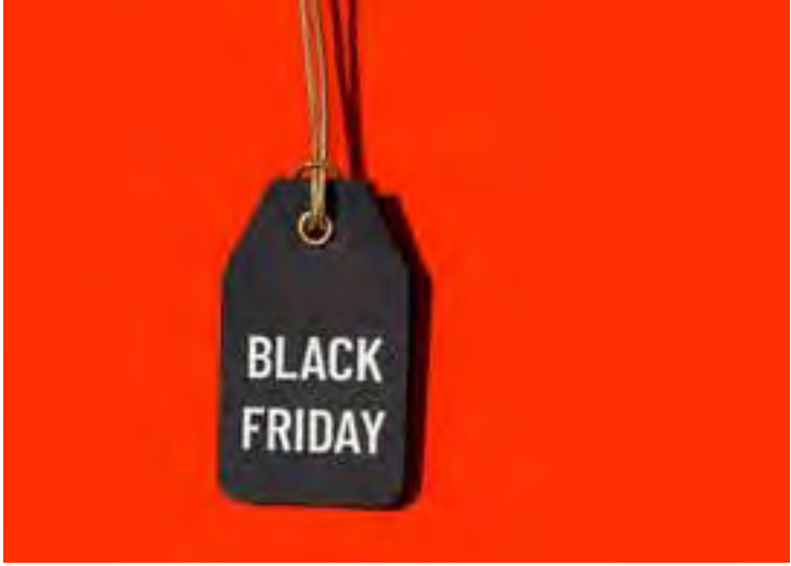
Que antecede a data do pequeno Natal fora de hora e suas promessas muitas vezes vazias