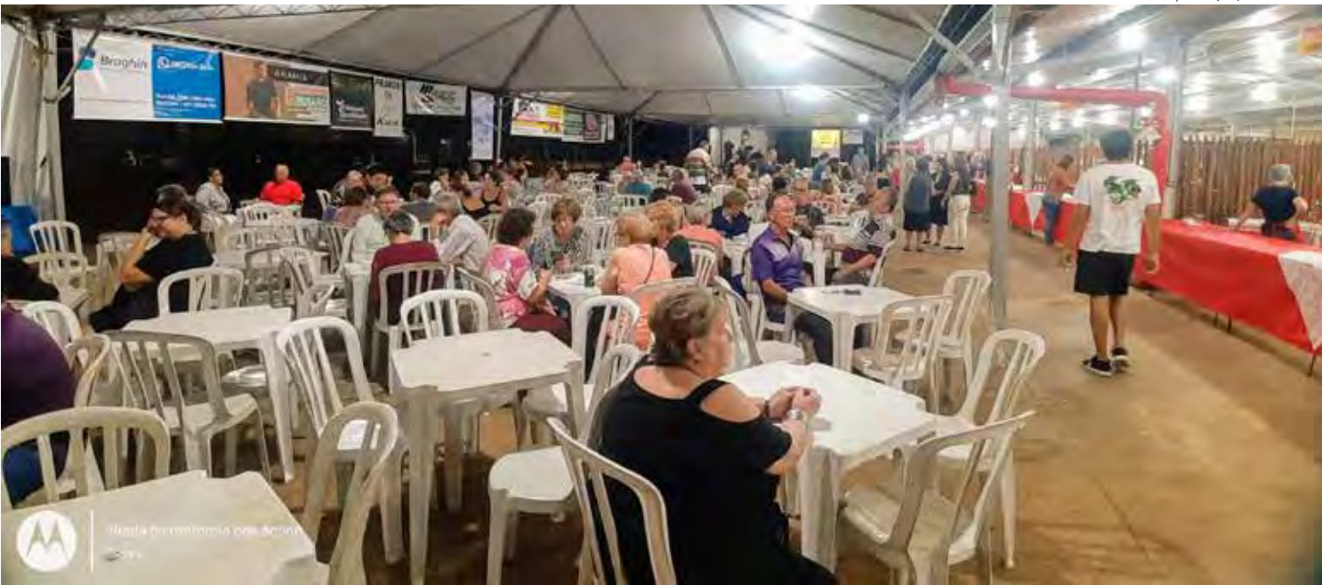
Festa de Santa Luzia costuma reunir grande público