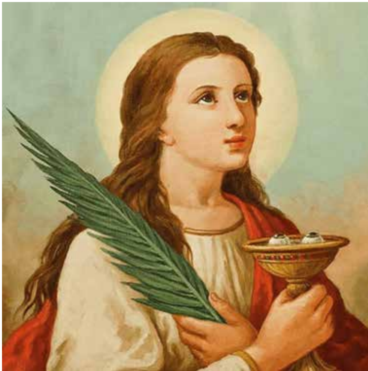
Santa Luzia é invocada como a protetora dos olhos