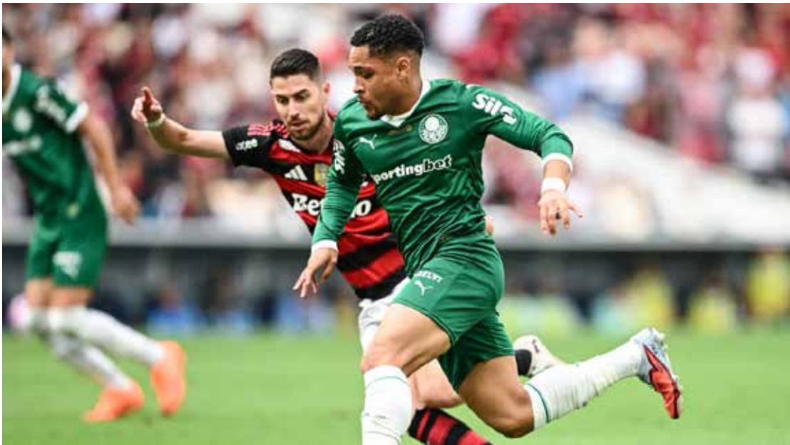
Verdão e Rubro-negro disputam a final da Libertadores na noite deste sábado em Lima no Peru

ríodo sem atuar. Provável escalação do Palmeiras: Carlos Miguel; Khellven, Murilo, Gustavo Gómez, Piquerez; Bruno Fuchs, Andreas Pereira, Raphael Veiga, Allan; Vitor Roque e Flaco López. No Flamengo, o técnico não terá o atacante Gonzalo Plata, suspenso por conta da expulsão na semifinal contra o Racing. Pedro foi relacionado após lesão muscular, mas segue sem plena condição física. Léo Ortiz é dúvida por dores no tornozelo, enquanto Luiz Araújo tende a jogar após não ter lesão detectada no meio de semana. Provável escalação do Flamengo: Rossi; Varela, Léo Ortiz (Danilo), Léo Pereira, Alex Sandro; Erick Pulgar, Jorginho, Arrascaeta; Luiz Araújo, Carrascal e Bruno Henrique.