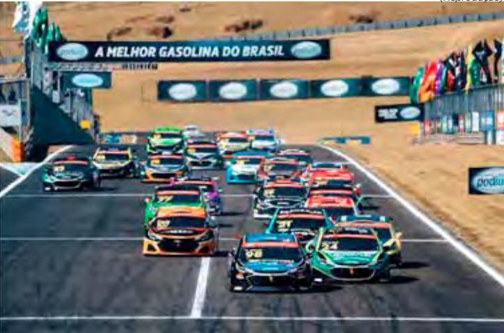
Título da Stock Light 2025 será definido em Brasília, neste final de semana

Neste sábado, a categoria de acesso realiza às 10 horas a sessão classificatória que definirá o grid de largada. Em seguida, a primeira cor-