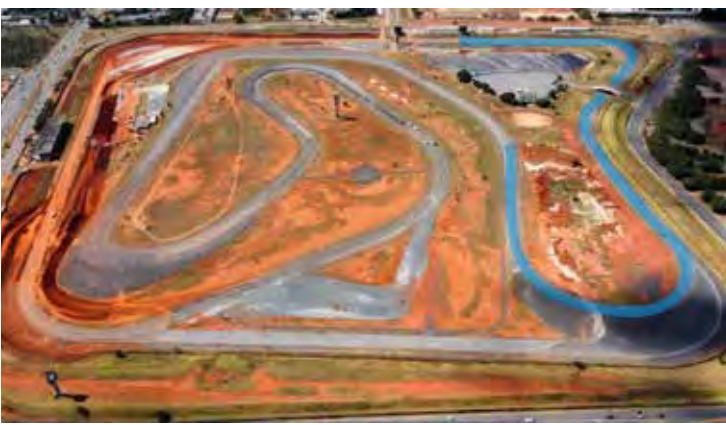
Autódromo de Brasília. Agora falta a parte cosmética, porque o espírito está de volta, intacto!

do GP do Catar, batendo no finalzinho o George Russell, com Lando Norris em terceiro.