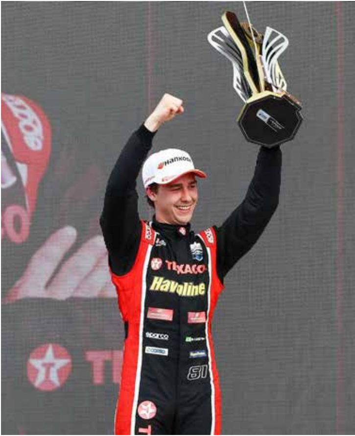
Com boa campanha, Leist figura no Top 10 do campeonato e vai em busca de mais pontos em Brasília

burgo chega à Capital Federal com objetivos claros: buscar bons resultados, pontuar o máximo possível e manter vivas as chances de brigar pelo título na grande final, em Interlagos.