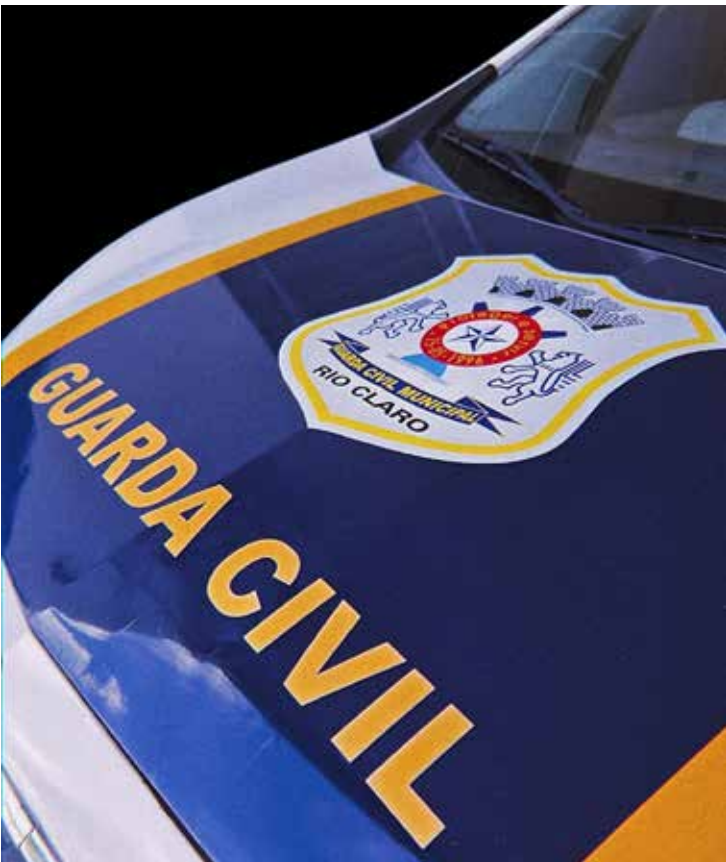
A Guarda Civil Municipal registrou o flagrante durante patrulhamento em Rio Claro

Após análise dos fatos apresentados, o delegado registrou prisão