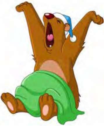
Parece que o Piastri acordou de sua longa hibernação! Bom pra ele e para todos os torcedores

Lando Norris chega a esta colheita tardia com a calma de quem sabe que a safra ainda pode dar errado. Lidera o campeonato — vinte e quatro pontos de vantagem, contam —, mas os lobos não estão só na porta; estão na mesma garagem. Seu companheiro Oscar Piastri ainda acredita, como todos nós, no presentinho do Natal pequeno (né, Black Friday?) antes do Natal grande. Ele está empatado em pontos com Max Verstappen, aquela força da natureza holandesa que ganhou mais títulos do