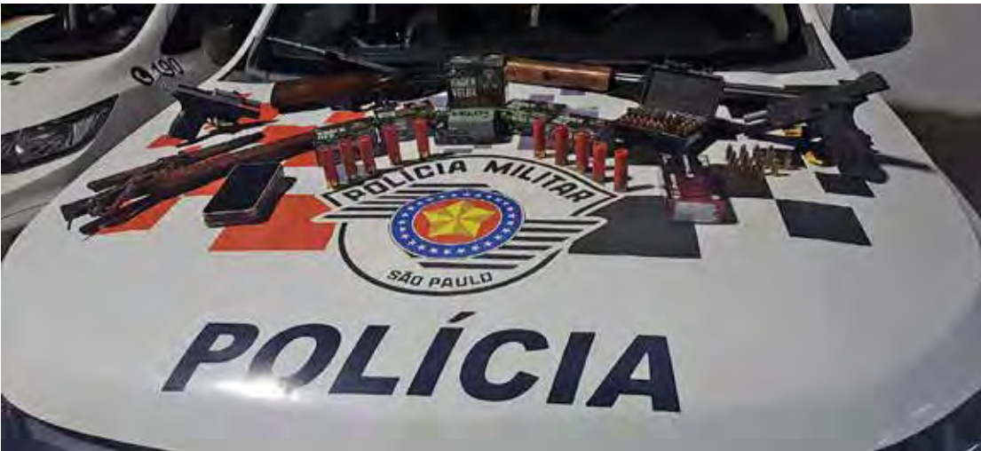
Arsenal com pistolas, espingarda e munições apreendido pela PM em Santa Gertrudes

O caso será investigado pela Polícia Civil.