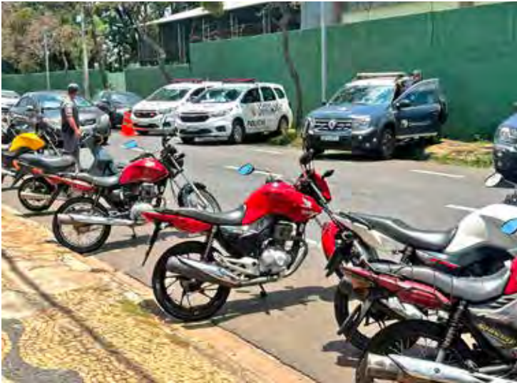
Polícia Militar e agentes do DETRAN-SP durante fiscalização em ponto estratégico de Rio Claro, na Operação Direção Segura

De acordo com o Comandante do 37º Batalhão de Polícia Militar do Interior, Tenente-Coronel PM Luciano Peixoto, ações desse tipo integram a estratégia permanente de prevenção criminal adotada pela corporação, reforçando o