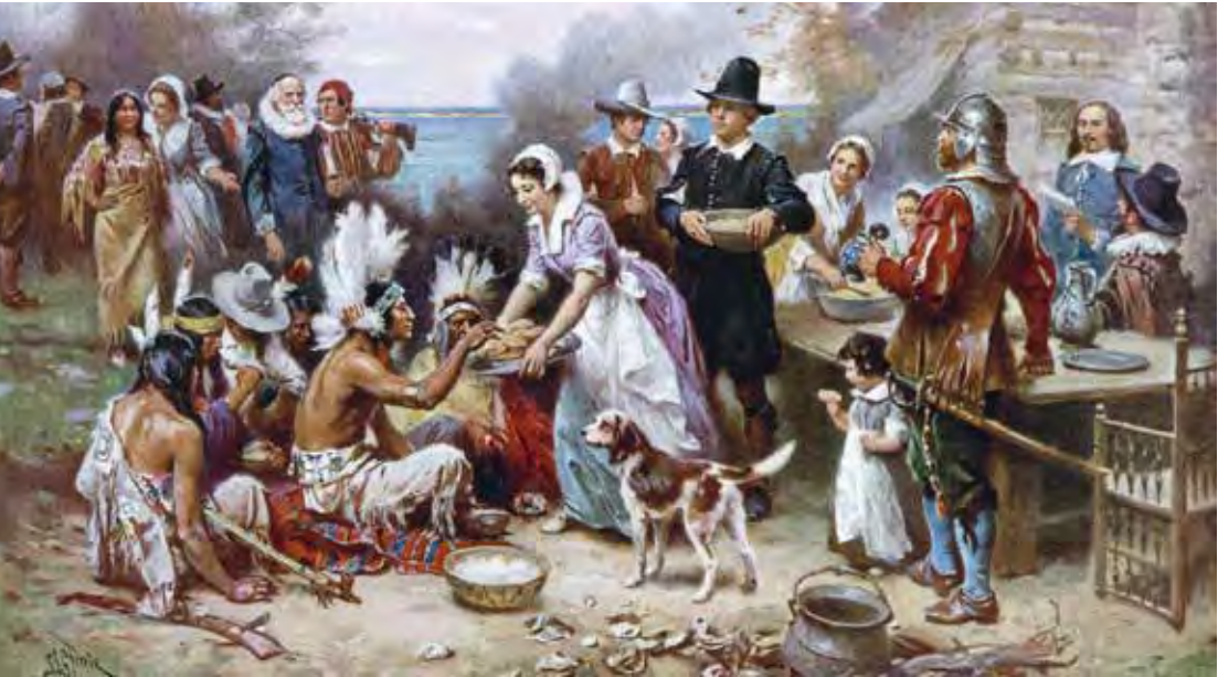
Dia de Ação de Graças, uma tradição sempre renovada e imitada no mundo todo

Um traçado lindo desses não merecia ficar fora do mapa do automobilismo brasileiro. Vida longa a ele nessa sua nova fase.