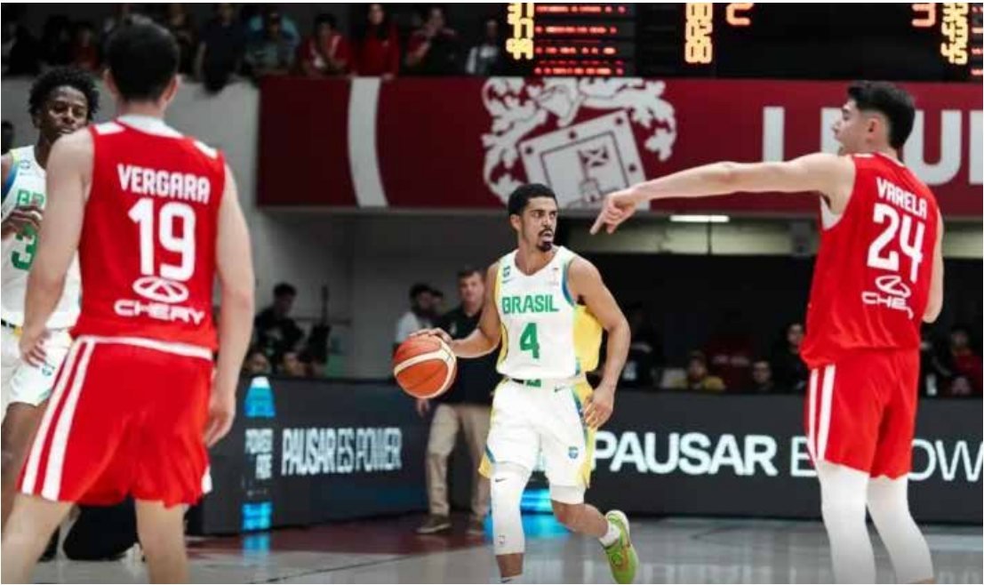
O próximo compromisso do Brasil é novamente contra o Chile, mas no Ginásio Wlamir Marques, em São Paulo, domingo (30)

tada a partir das 19h10 (horário de Brasília) do próximo domingo (30). Nas Eliminatórias da Copa, o Brasil faz parte do Grupo C, ao lado de Chile, Colômbia e Venezuela. A primeira fase da competição será disputada até julho de 2026, com confrontos de ida e volta com os rivais. Os três melhores da chave se classificam para a segunda fase.