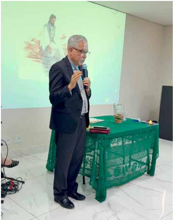
Bispo Dom Devair participou do evento em Rio Claro

Para a equipe organizadora, a data simboliza uma década de fé que transforma e acolhe. O projeto segue ativo com o apoio de voluntários que dedicam tempo e escuta a quem enfrenta enfermidades, reforçando a importância da espiritualidade no cuidado integral.