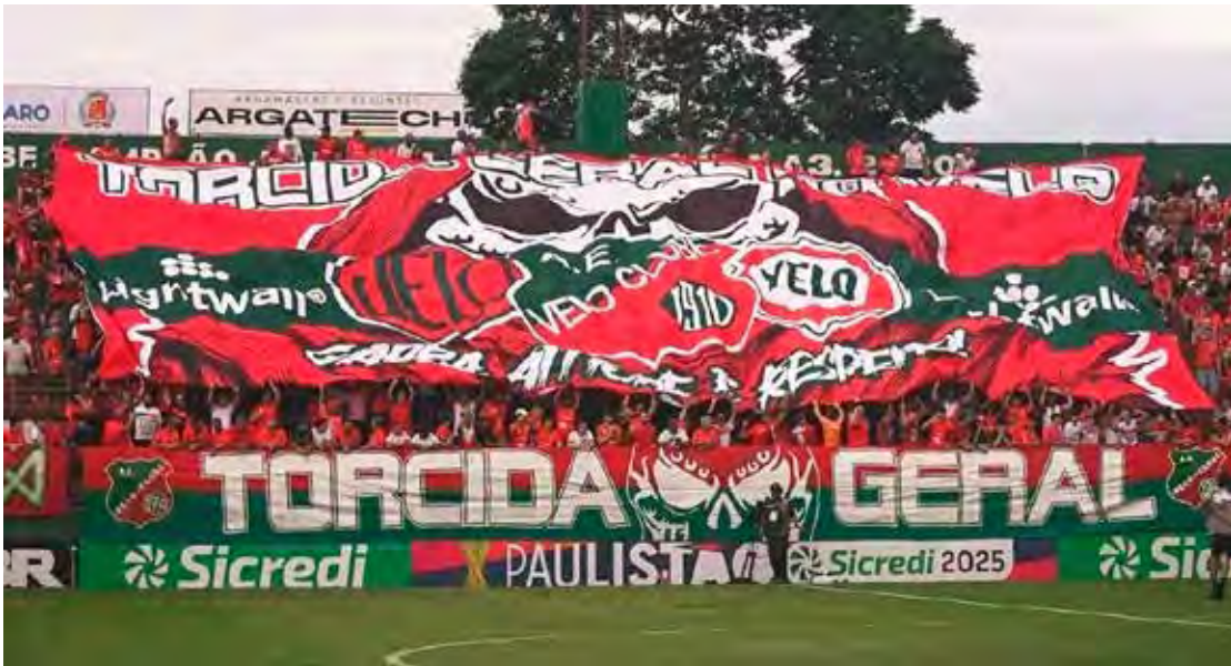
Velo estreia em casa e enfrentará Corinthians diante de sua torcida no Benitão