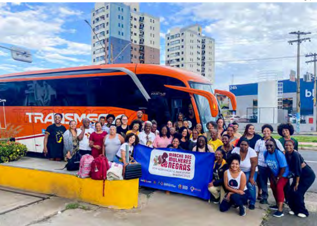
Evento reuniu centenas de caravanas de todo o Brasil, incluindo Rio Claro

Quase dez anos depois, com o tema Marcha das Mulheres Negras por Reparação e Bem Viver, foi realizada a segunda marcha nacional. Rio Claro também participou da primeira marcha.