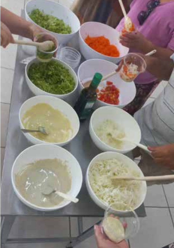
A atividade também abordou o aproveitamento integral dos alimentos