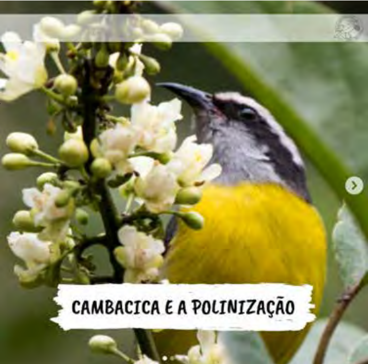
Grupo fará passeio para observação de pássaros na Feena