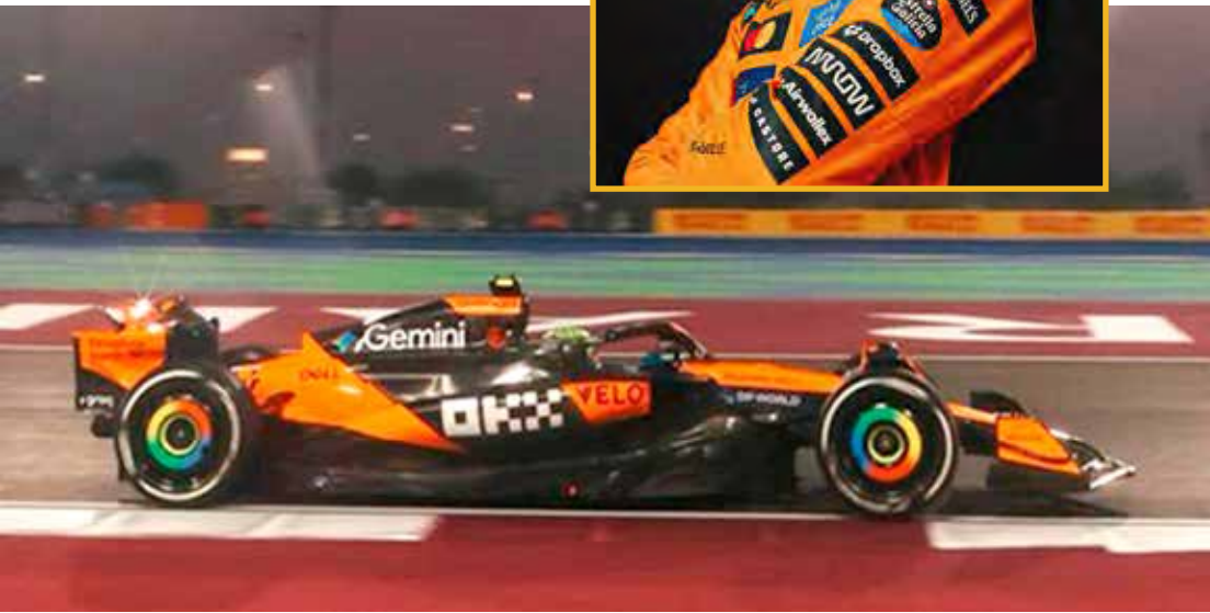
Oscar Piastrri ditou o ritmo do treino livre e da classificação para a sprint no Circuito Internacional de Lusai