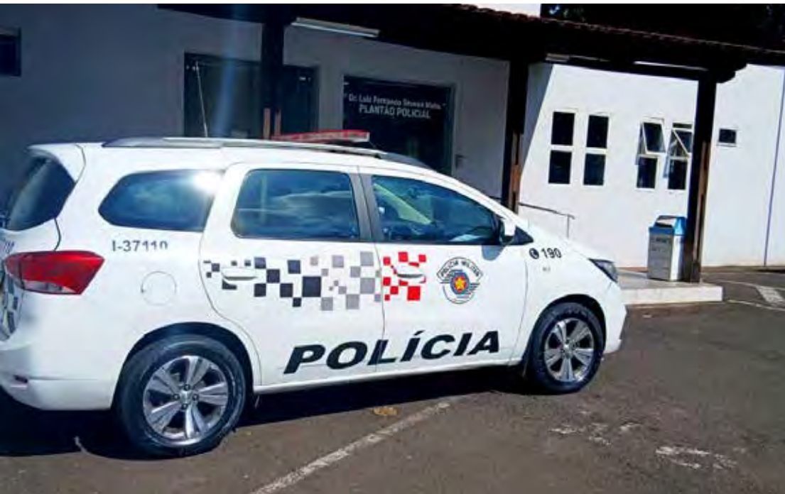
A Polícia Militar atendeu a ocorrência durante sessão no Fórum de Rio Claro

Após todos os procedimentos legais, a condenada foi encaminhada ao sistema prisional, onde permanecerá à disposição da Justiça para o início do cumprimento da pena.