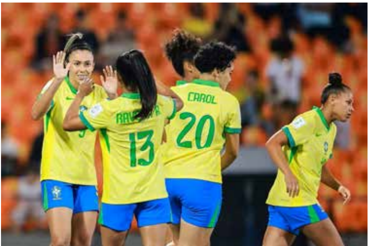
Brasil encerra o ano com amistoso diante de Portugal nesta terça-feira

Aos olhos da comissão técnica e das jogadoras brasileiras, o amistoso representa uma oportunidade de consolidar o bom momento, testar a equipe visando 2026 e brindar a torcida com uma vitória de prestígio antes do recesso.