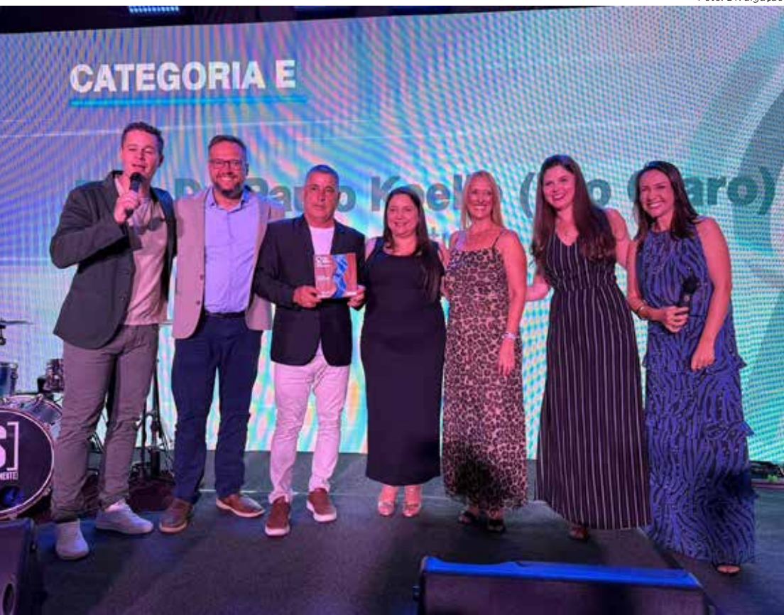
A cerimônia de premiação aconteceu na sexta-feira (28) m Nova Odessa