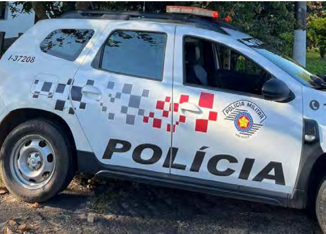
Polícia Militar realizou a apreensão do adolescente no Jardim das Nações; caso segue sob responsabilidade da Justiça

A ocorrência está registrada pelos números BOPM 6560/2025 e BOPC RM2947-1/2025.