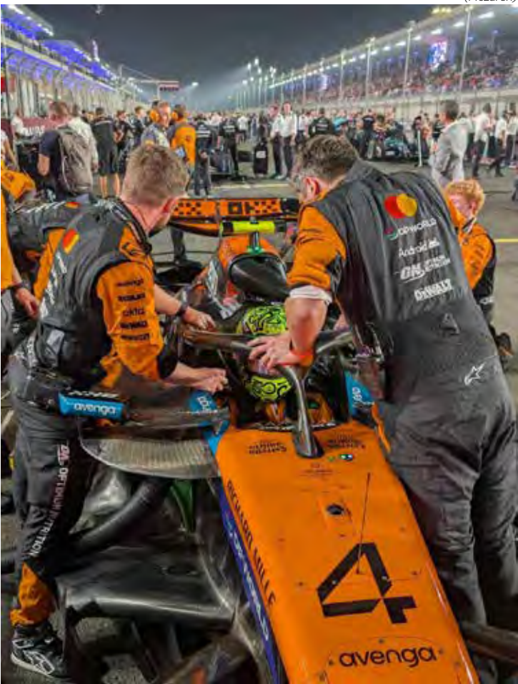
Lando Norris continua na liderança após pontuar no GP do Catar