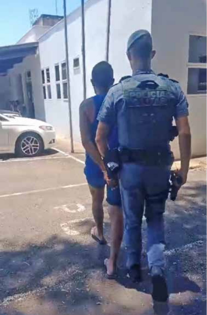
Polícia Militar durante ação no bairro Novo Wenzel, em Rio Claro — homem procurado foi localizado após atendimento de ocorrência familiar

O homem recebeu voz de prisão no local e foi conduzido ao Plantão Policial. A autoridade de plantão ratificou a detenção, e o procurado permaneceu recolhido à disposição da Justiça.