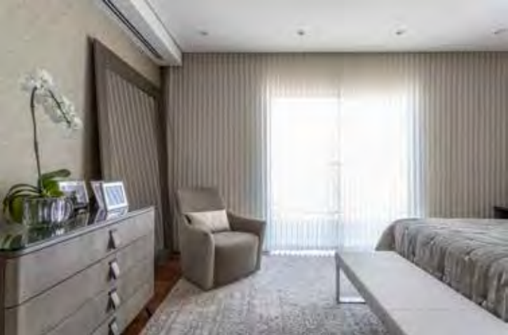
Ao combinar a cômoda com espelho e poltrona, esse setor do dormitório se tornou uma fabulosa antessala de vestir e até de relaxamento e leitura