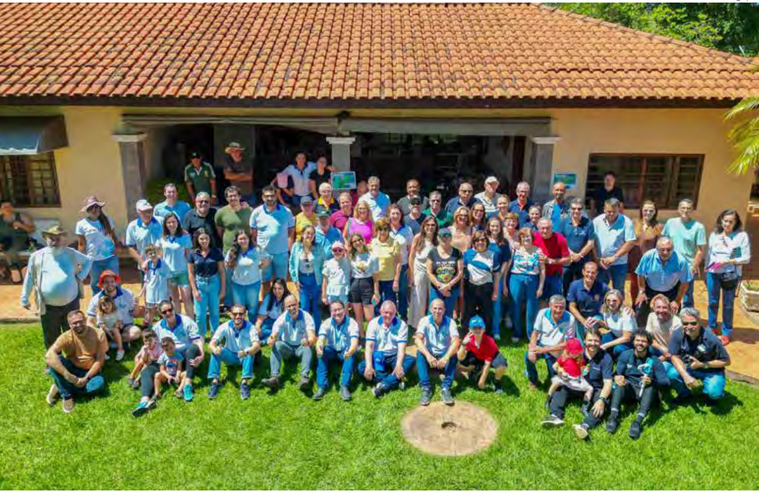
Participantes do plantio celebrativo do Projeto Nascentes Rio Claro

tiva e da Oji Papéis, empresa apoiadora do projeto que vai garantir o plantio de seis mil mudas, de um total de 140 mil previstas para a microbacia do Ribeirão Claro — o equivalente a cerca de 67 campos de futebol. O diretor-presidente da Agência das Bacias PCJ, Sergio Razera, reforçou que a restauração é parte de um esforço contínuo e de longo prazo. “O projeto Nascentes Rio Claro é mais uma etapa desse grande projeto do PCJ para proteger as nascentes e os mananciais. Começamos hoje aqui em Rio Claro com 36 propriedades de um total de 129 selecionadas. Isso significa dar a nossa contribuição para esse processo de reflorestamento, de proteção dos mananciais. Então é fundamental, é uma de cada vez. Não adianta a gente achar que vai plantar 1 milhão se a gente não plantar 20 hoje, 50 amanhã, 10 mil depois. Então, hoje faz parte de um grande processo que já está em andamento”, explicou. O secretário-executivo dos Comitês PCJ, Denis Herisson da Silva, destacou a relevância da restauração florestal dentro do conjunto de ações dos colegiados. “Ao longo de 30 anos, nosso grande enfoque esteve