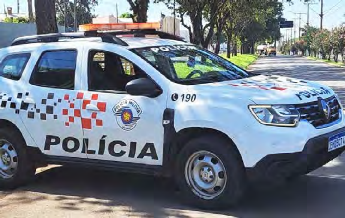
Ocorrência foi registrada pela Polícia Militar no último sábado em Rio Claro

Apreensões: 8 porções de cocaína e R$ 109,00 em dinheiro