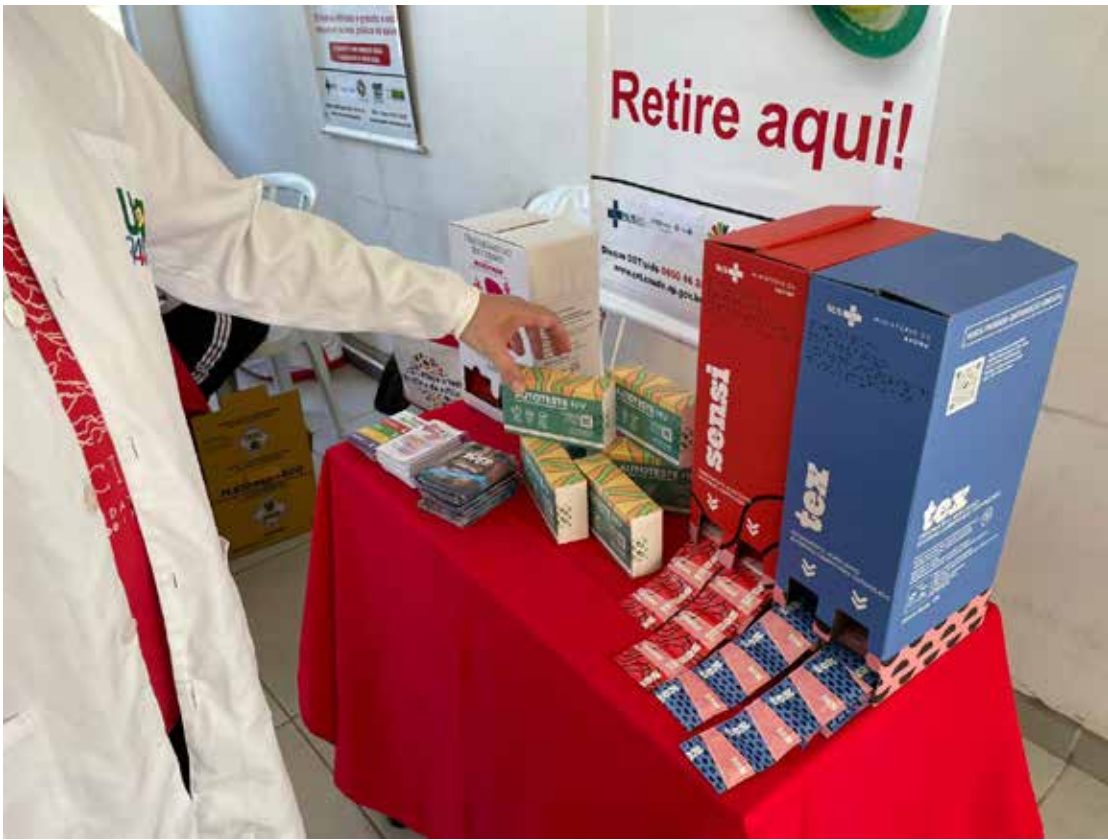
Rio Claro realizou ação preventiva contra Aids na UPA da Avenida 29

“A identificação precoce dos casos de Aids possibilita que o acompanhamento seja iniciado