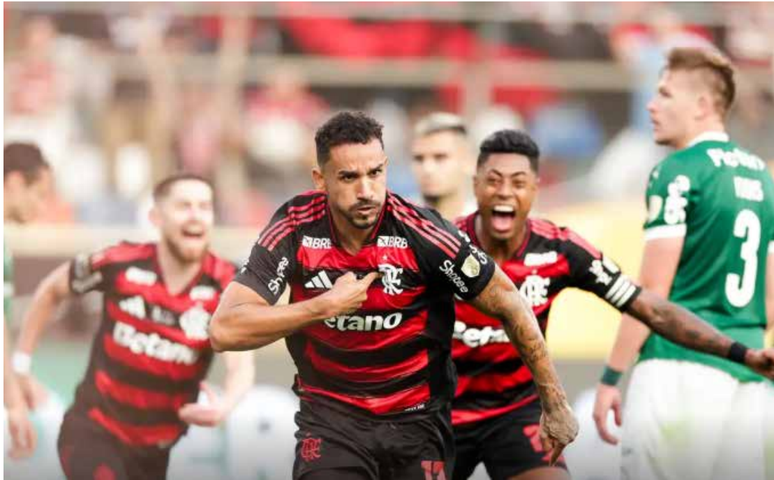
Flamengo conquistou o quarto título da Libertadores e garantiu vaga em dois Mundiais

A edição deste ano teve início em setembro, com o embate entre os ganhadores das Ligas dos Campeões da África (Pyramids, do Egito) e da Oceania (Auckland City, da Nova Zelândia). Os egípcios venceram (3 a 0) e se credenciaram à disputa da Copa