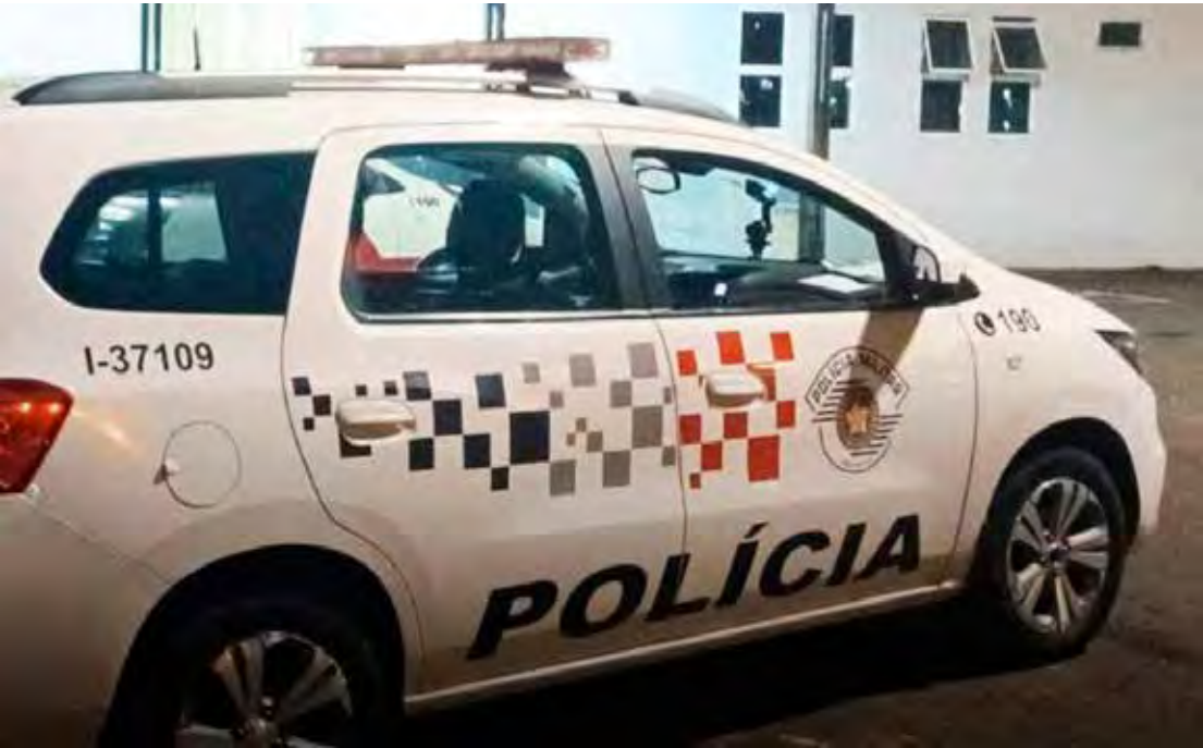
Polícia Militar registrou a ocorrência no Jardim Boa Vista e Cidade Nova em Rio Claro

Apreensões: 20 g de maconha; 3 g de crack; R$ 60,00 em dinheiro e 2 aparelhos celulares.