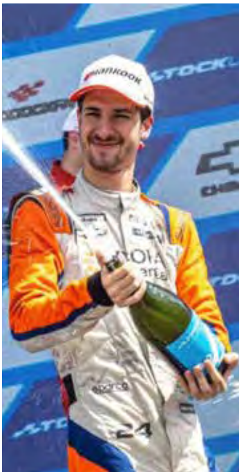
Piloto e equipe SG28 Racing garantem troféus na inauguração do circuito com bicampeonato do time

Além do troféu, o título da Stock Light oferece uma das premiações mais cobiçadas do esporte a motor brasileiro: subsídios para ingressar na Stock Car Pro Series na próxima temporada, acompanhados de uma bolsa mensal de R$ 50 mil.