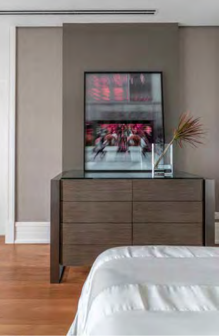
Com design elegante, a cômoda trouxe oito gavetas com textura que remete à madeira rústica. Além disso, o móvel serve de anteparo para obras de arte