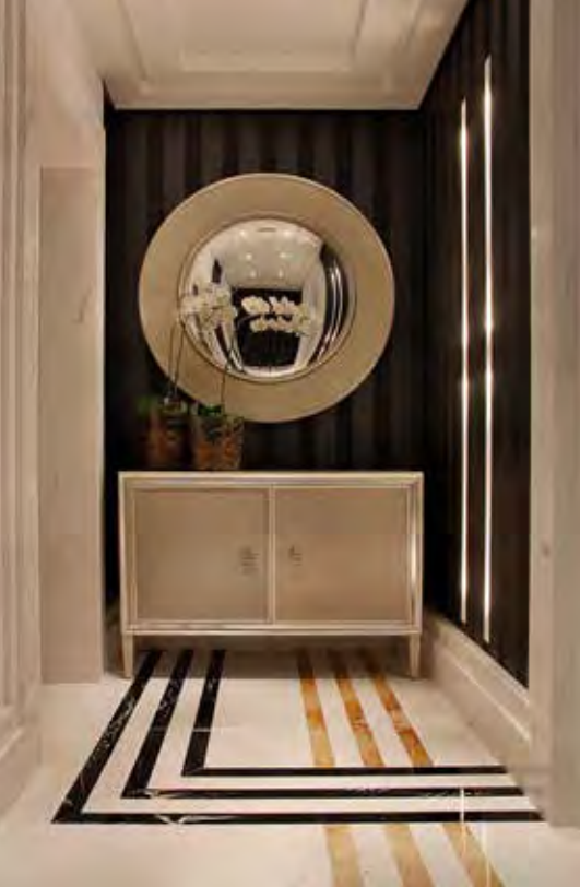
Recebendo com elegância quem chega, a cômoda de traços retos, compõe com a estética proposta para o hall de entrada