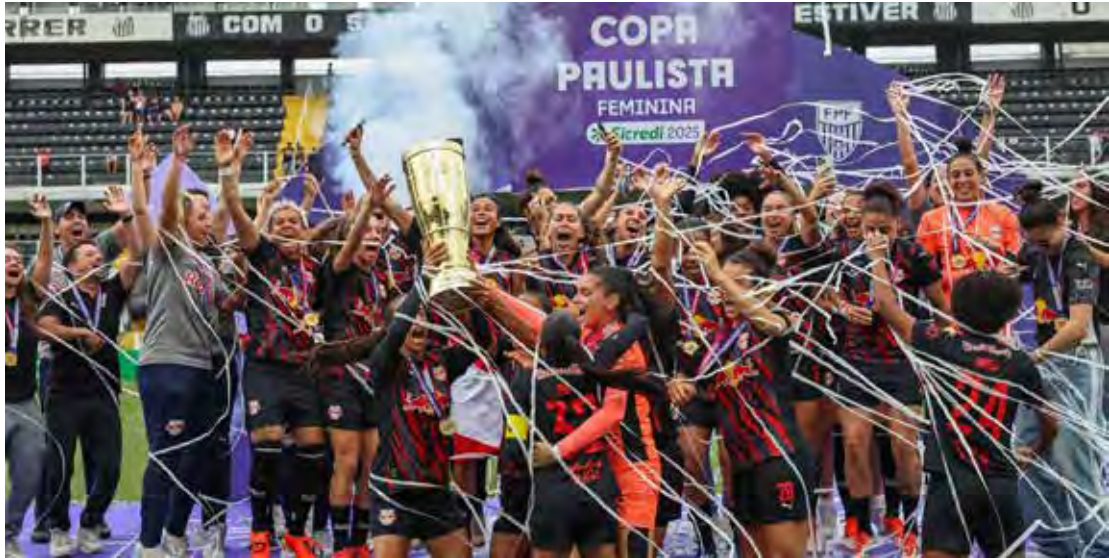
Em jogo único da final, o RB Bragantino superou o Santos por 3 a 2 na Vila Belmiro

Aos 19, o Red Bull Bragantino apertou a marcação e roubou a bola na área adversária. A sobra ficou com Pâmela, que