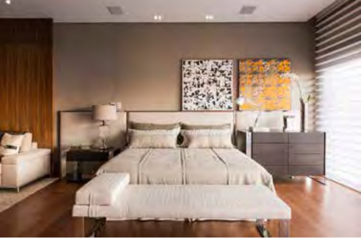
À direita da cama, uma cômoda no lugar da mesa de cabeceira. A implementação da peça trouxe uma nova interpretação para o layout, além de novas funções para o mobiliário