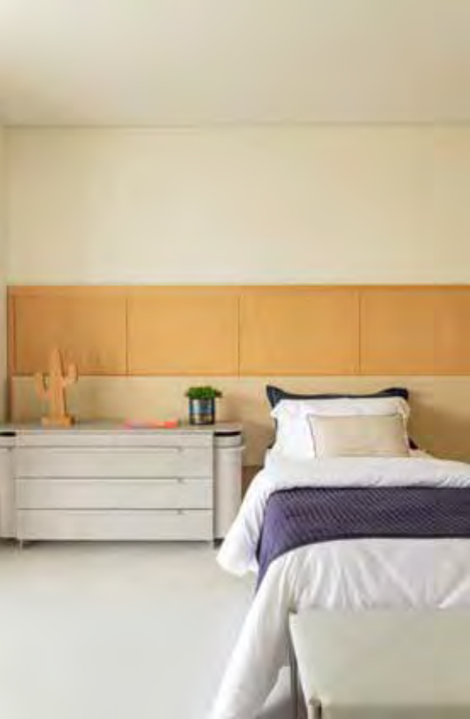
Com design orgânico e sem quinas, essa moderna cômoda exemplifica como um móvel tão tradicional pode ter sua forma renovada através do design