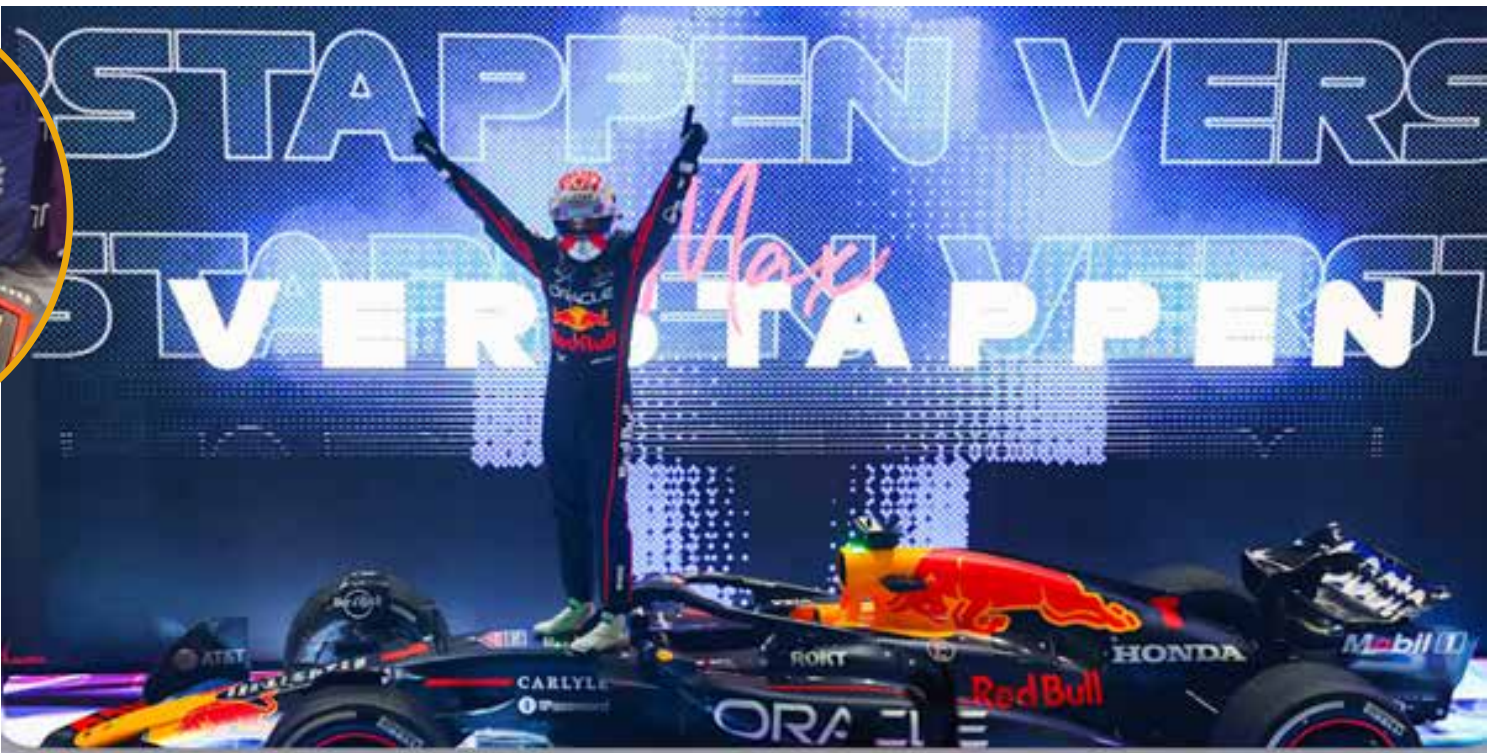
Max Verstappen tem virada histórica no campeonato e leva a disputa do título para a última etapa em Abu Dhabi

A corrida que encerra a temporada será no próximo domingo, com largada às 10 horas, prometendo um grande espetáculo para os fãs de Fórmula 1.