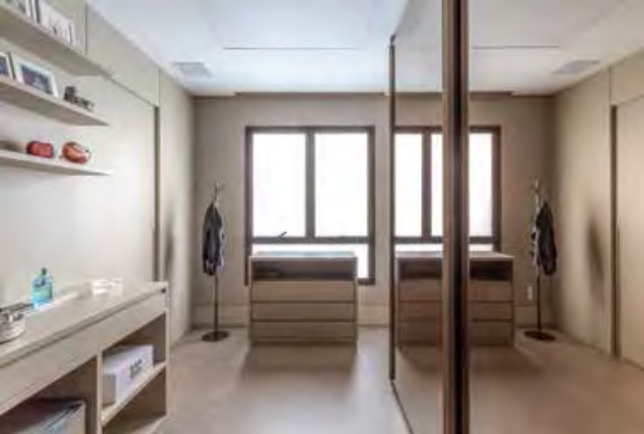
Com gavetas espaçosas, a cômoda foi inserida no closet do casal, auxiliando na organização. Um dos charmes da peça é o nicho aberto, ocupando o espaço que seria de uma gaveta

Quem adora receber visitas em casa, pode dispor uma cômoda no quarto de hóspedes para que os visitantes consigam organizar seus itens durante a estadia. O móvel ocupa menos espaço que um guarda-roupa, além de ser uma opção mais prática e confortável para que os hóspedes não precisem manusear ou procurar peças de roupa direto da bagagem.