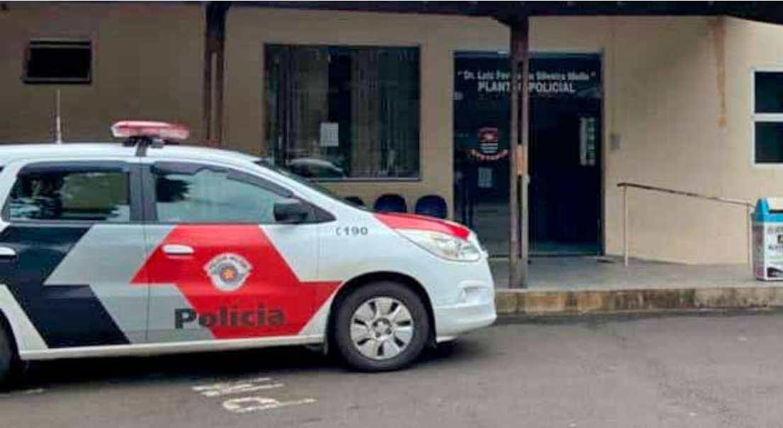
Polícia Militar atende ocorrência de violência doméstica no bairro Boa Vista, em Rio Claro

Após o registro do BOPC RN9148-1/2025 no Plantão Policial, a prisão foi ratificada. O agressor permaneceu detido à disposição da Justiça.