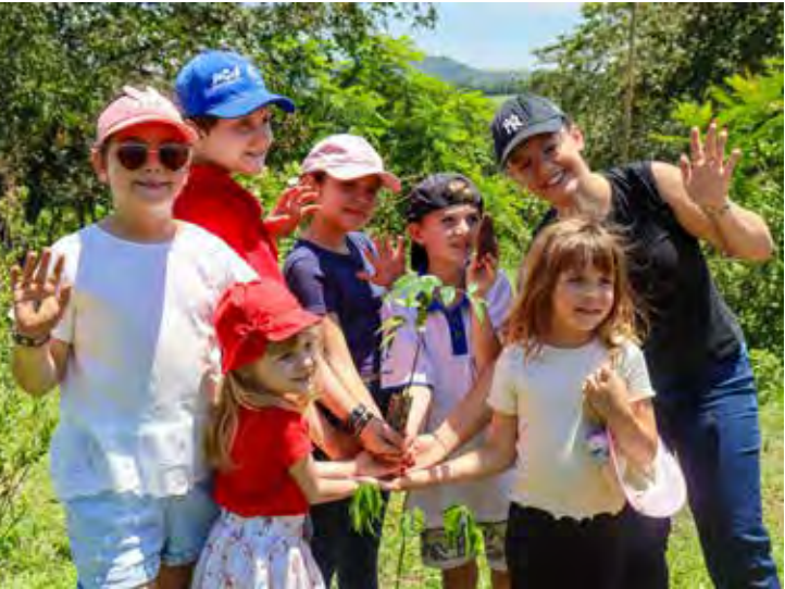
Plantio celebrativo do Projeto Nascentes Rio Claro

dos Comitês PCJ e contempla ações de restauração florestal, conservação do solo, proteção de nascentes e recuperação de matas ciliares. Além do ganho ambiental, a iniciativa fortalece a resiliência hídrica da região e contribui para a sustentabilidade da atividade rural, envolvendo diretamente produtores locais em um processo colaborativo de cuidado com o território. No total, o investimento da Agência e dos Comitês PCJ, com apoio da Oji Papéis, é superior a R$ 1,1 milhão e abrange mais de 3,1 mil hectares. Além da microbacia do Ribeirão Claro (36 propriedades rurais, com total de 1.383,26 hectares), as outras duas microbacias atendidas no projeto são a do Córrego do Batalha (45 propriedades rurais, somando 897,15 hectares) e a do Córrego do Jacutinga (48 propriedades e 872,27 hectares).