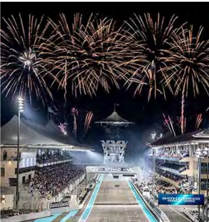
GP de Abu Dhabi fecha temporada da F1 e vai revelar piloto campeão de 2025

Treino Livre com um piloto sem experiência na categoria, irão tirar seus titulares: Ferrari: Lewis Hamilton abrirá espaço para o irmão de Charles Leclerc, Arthur Leclerc Racing Bulls: Yuki Tsunoda terá Arvid Lindblad em seu lugar. Aston Martin fica sem os dois titulares: sai Fernando Alonso e entra Cian Shields; sai Lance Stroll e entra Jak Crawford. Alpine: sai Pierre Gasly e entra Paul Aron. Haas: sai Esteban Ocon e entra Ryo Hirakawa. Racing Bulls: sai Liam Lawson e entra Ayumi Iwasa. Williams: sai Alexander Albon e entra Luke Browning.