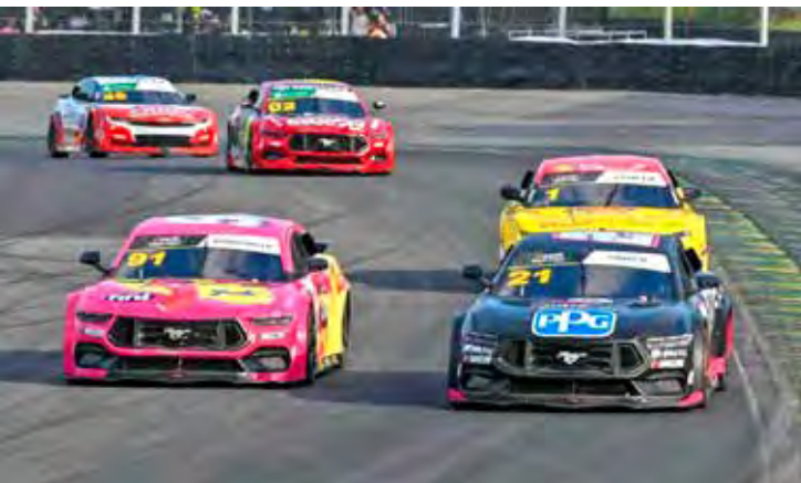
Os carros da competição entram na pista oficialmente nesta sexta-feira para os treinos oficiais da etapa em formato Special Edition. As corridas serão no sábado e domingo