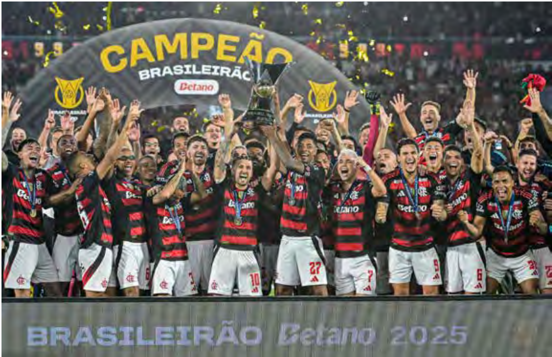
Flamengo venceu o Ceará por 1 a 0 e ficou o título do Brasileirão 2025

Na parte inferior da tabela, duas vagas no Z4 ainda não foram definidas, já que Juventude e Sport estão confirmados na Série B. Internacional, 18º colocado com 41 pontos, e Vitória, 17º, ocupam atualmente as posições de rebaixamento, mas seguem em busca da permanência. A disputa envolve ainda Fortaleza, Ceará, Santos e Atlético. Entre os ameaçados, o Atlético vive situação mais tranquila: para que o rebaixamento ocorra, o Vitória teria de tirar uma diferença de 12 gols no saldo, além de Ceará e Fortaleza precisarem vencer seus jogos e o Santos ao menos empatar, cenário considerado praticamente impossível.