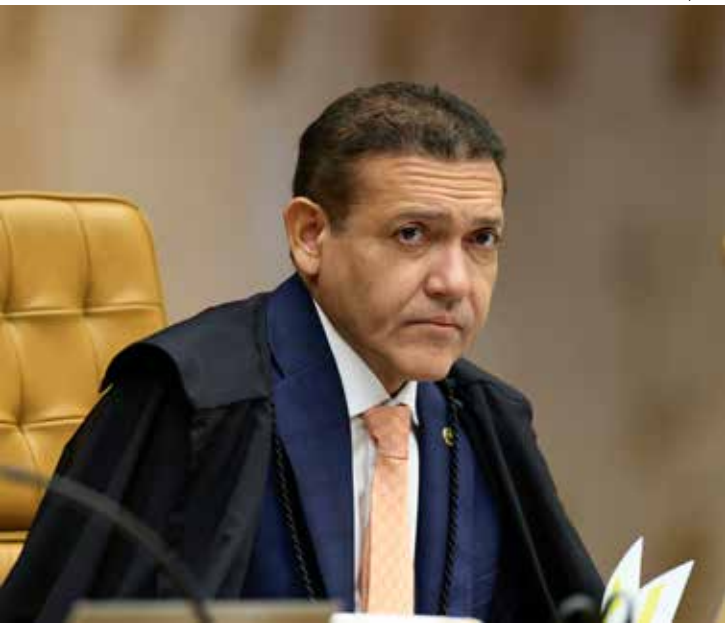
O ministro Nunes Marques, do STF, concedeu liminar que suspende leis e decretos municipais que criam loterias

A liminar será submetida a referendo em sessão plenária extraordinária do STF. A decisão estabelece multa diária de R$ 500 mil a municípios e