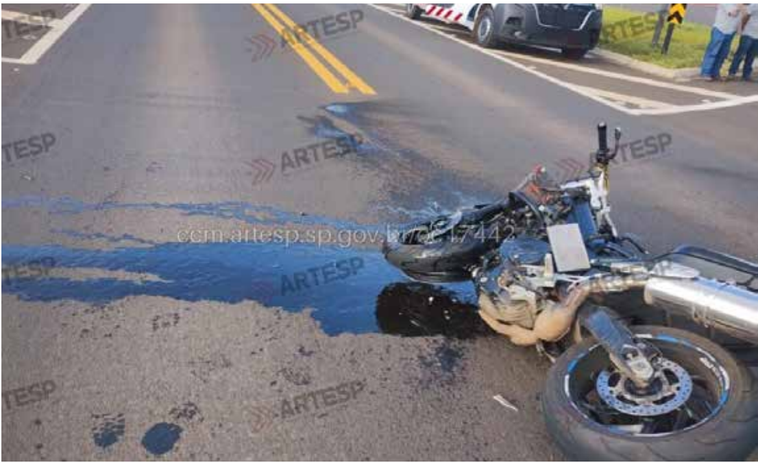
Motocicleta ficou destruída após o acidente que vitimou o homem de 52 anos

Segundo informações da Polícia Militar Rodoviária, o acidente aconteceu por volta das 6h26. A motocicleta seguia no sentido Ipeúna–Rio Claro quando uma van realizou uma manobra de cruzamento para acessar a empresa Alfagrês. Durante a manobra, a moto colidiu transversal-