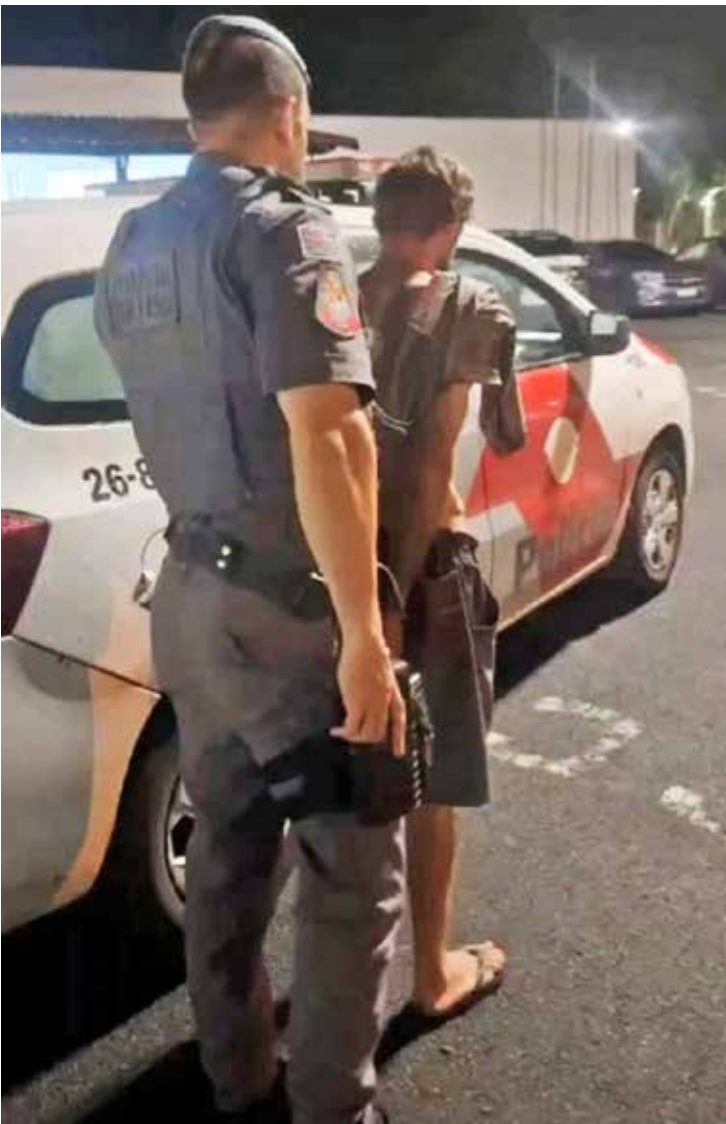
Indivíduo procurado foi detido pela PM no Jardim Novo I e encaminhado ao plantão policial

Após a captura, ele foi conduzido ao plantão policial, onde permaneceu à disposição da Justiça.