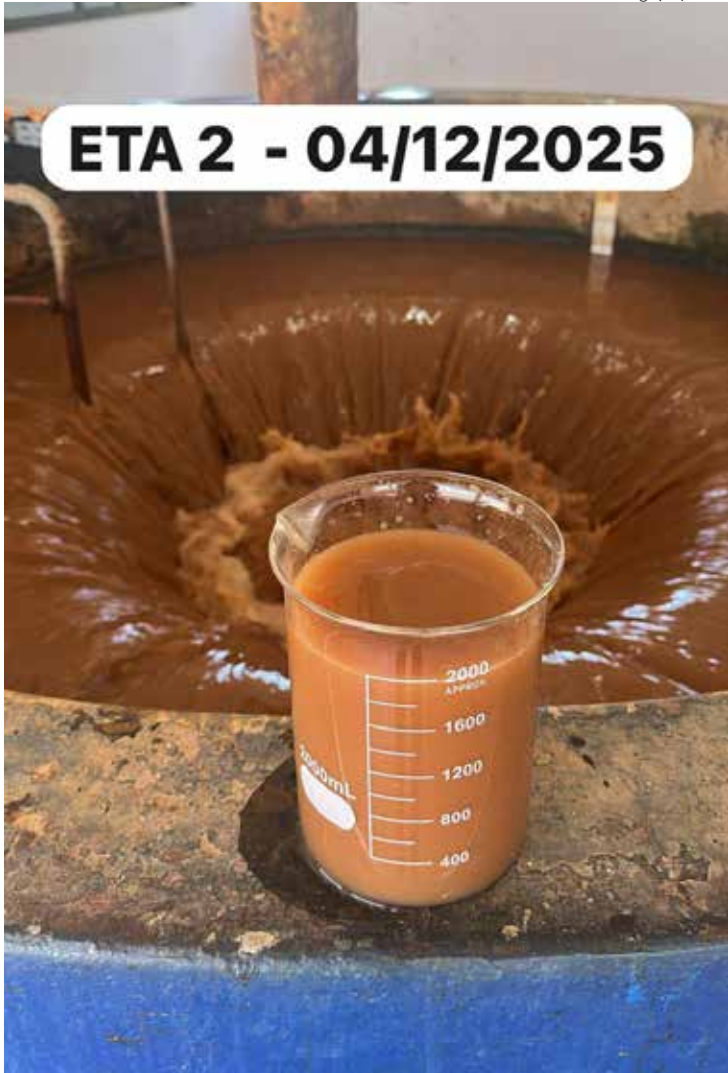
A turbidez do rio Corumbataí segue em cerca de 2.500 NTUs (Unidades Nefelométrica de Turbidez)