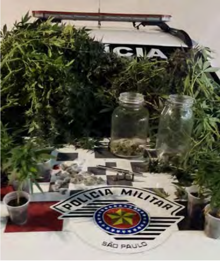
Material apreendido pela Força Tática inclui arma artesanal, munições, porções de maconha e estrutura de cultivo no bairro Cherveson

Após a captura, ele foi conduzido ao plantão policial, onde permaneceu à disposição da Justiça.