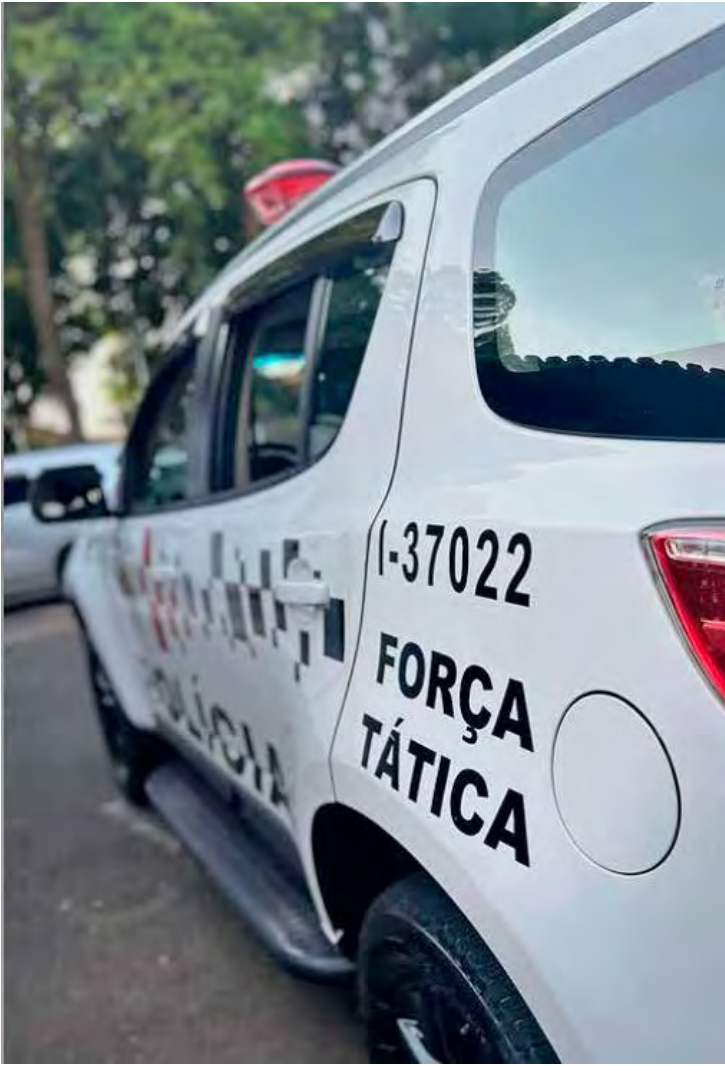
A Polícia Militar atendeu a ocorrência no bairro Santa Maria em Rio Claro