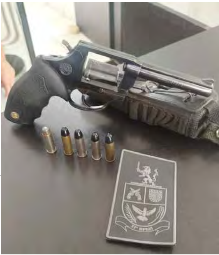
Revólver calibre .38, munições e coldre apreendidos pela PM durante ocorrência no Jardim Industrial

O homem foi conduzido ao plantão policial, onde permaneceu preso à disposição da Justiça.