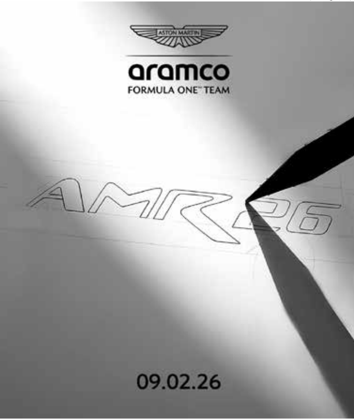
Projetado por Adrian Newey, o AMR26, modelo que vai ser guiado por Fernando Alonso e Lance Stroll na F1 em 2026, será mostrado ao mundo em fevereiro

Assim, ao lado de Red Bull e Racing Bulls, a Aston Martin é a terceira equipe a confirmar a data de lançamento do carro de 2026. O evento de apresentação da família taurina será realizado na sede da Ford, em Detroit, em 15 de janeiro.