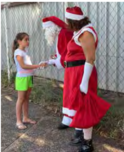
Papai e Mamãe Noel desfilaram pelas ruas e interagiu com criança no percurso e no Jardim Público