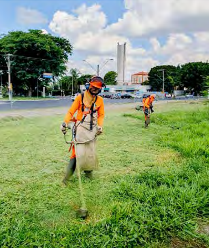
Equipes da prefeitura executaram serviços de limpeza e corte de mato

Neoenergia Elektro alerta para riscos à vida e impactos no fornecimento após série de colisões que comprometem a segurança da rede elétrica