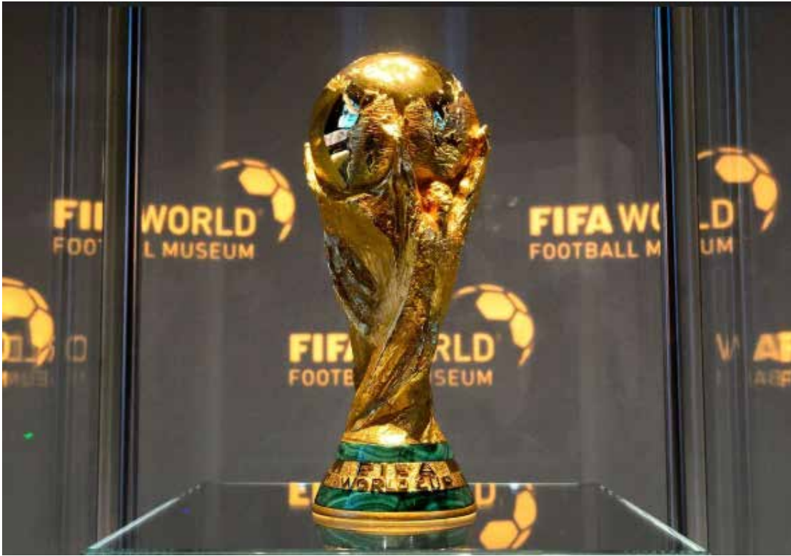
A taça da Copa do Mundo que estará em disputa novamente em 2026

Os potes do sorteio também já estão definidos. No Pote 1 estão os anfitriões Canadá, México e Estados Unidos, além de Espanha, Argentina, França, Inglaterra, Brasil, Portugal, Holanda, Bélgica e Alemanha. O Pote 2 reúne Croácia, Marrocos, Colômbia, Uruguai, Suíça, Japão, Senegal, Irã, Coreia do Sul, Equador, Áustria e Austrália. Já o Pote 3 conta com Noruega, Panamá, Egito, Argélia, Escócia, Paraguai, Tunísia, Costa do Marfim, Uzbequistão, Catar, Arábia Saudita e África do Sul. O Pote 4 fecha a distribuição com Jordânia, Cabo Verde, Gana, Curaçau, Haiti, Nova Zelândia e as vagas remanescentes: quatro repescagens europeias — A, B, C e D — e duas intercontinentais.