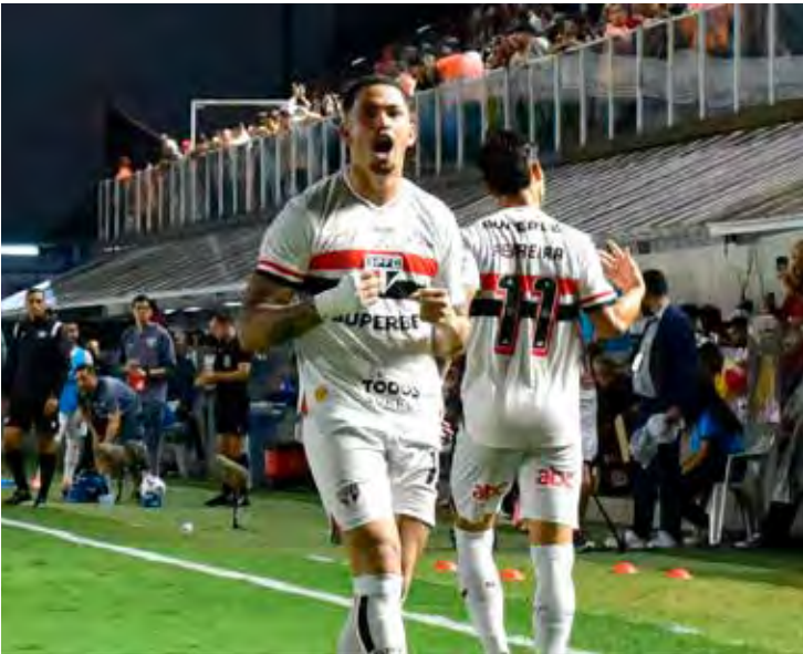
Tricolor vem embalado, após vencer o Internacional por 3 a 0

Esse risco ocorre por causa do critério de desempate. No pior cenário, os dois clubes terminariam empatados com 51 pontos, mas o Bragantino alcançaria 15 vitórias, superando o São Paulo, que permaneceria com 14 triunfos. O número de vitórias é o primeiro critério de desempate do Brasileirão.