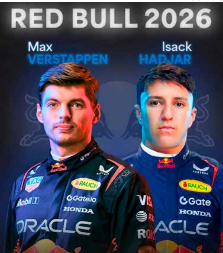
Red Bull anunciou Isack Hadjar para a vaga de Yuki Tsunoda na temporada 2026 da Fórmula 1

Lawson, e de Yuki Tsunoda, a quem irá substituir em Milton Keynes no ano que vem. Agora, Tsunoda muda de função e passará a atuar como piloto reserva e de testes em 2026.