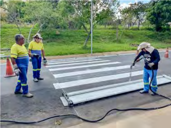
A prefeitura realizou reforço e ampliação da pintura de solo em trechos da Vila Paulista

sendo intensificada pela prefeitura. Ações similares de manutenção são realizados ininterruptamente pela prefeitura em todas as regiões são atendidas.