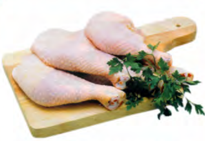
COXA COM SOBRECOXA DE FRANGO COM OSSO KG

CONFIRA TODAS AS OFERTAS NAS NOSSAS REDES SOCIAIS