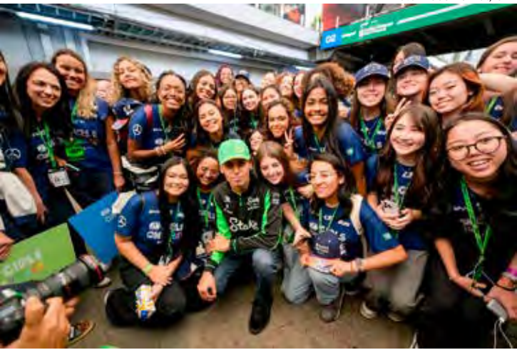
Experiência para Estudantes na Fórmula 1

“Somos muito gratas à CBA, ao FIA Grant Programmes, ao BRB e à Porto, que nos deram o suporte financeiro para tantas realizações. Também agradecemos às categorias e equipes que receberam nossos estágios e experiências para estudantes; à Mercedes-Benz por nos apoiar na ação na Fórmula 1; aos muitos fotógrafos e fotógrafas