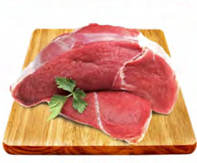
COXÃO DURO (PONTA DE ALCATRA) KG