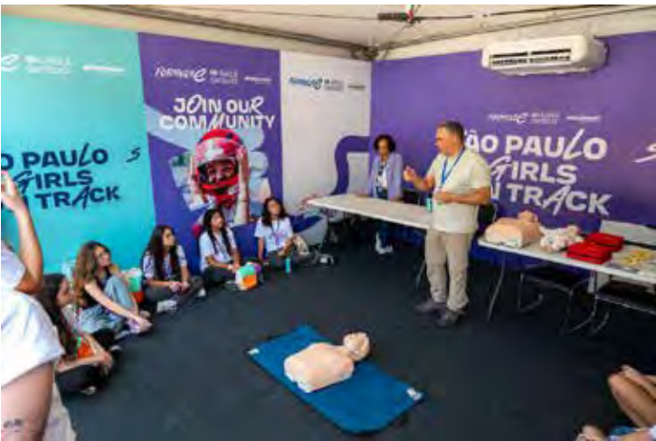
Na aula de primeiros socorros