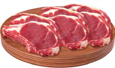
BISTECA BOVINA KG