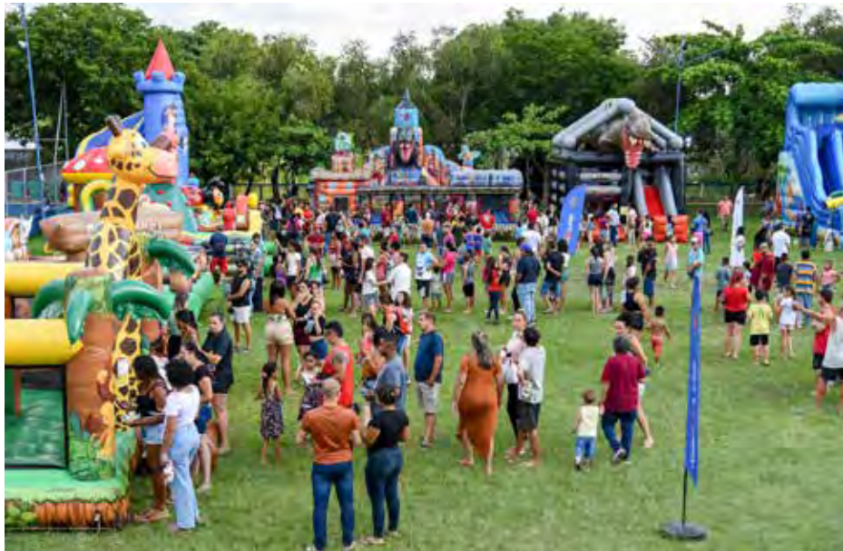
Atividades foram realizadas sábado, no Parque Municipal Lago Azul

A Festa de Natal teve também como destaque a chegada do Papai Noel e muitas brincadeiras