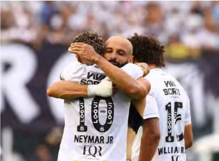
O Santos escapou do rebaixamento e garantiu uma vaga da Copa Sul-Americana de 2026

Sete equipes garantiram vaga na Copa Libertadores de 2026. Flamengo, Palmeiras, Cruzeiro, Mirassol e Fluminense asseguraram classificação direta para a fase de grupos, enquanto Botafogo e Bahia terão de disputar a fase preliminar. Ainda há possibilidade de abertura de uma oitava vaga, caso Cruzeiro ou Fluminense conquistem a Copa do Brasil, o que beneficiaria o São Paulo, que terminou na oitava colocação.