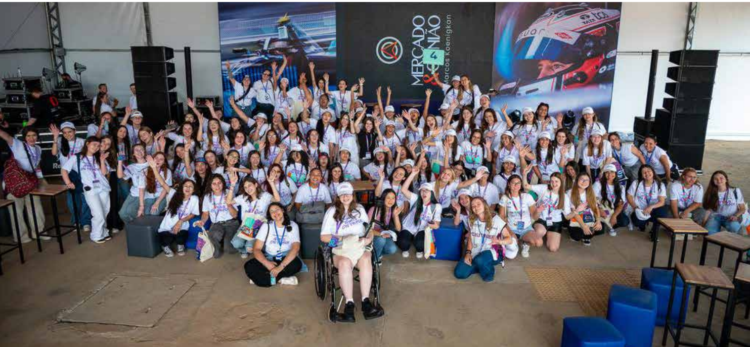
Participantes da Experiência para Estudantes na Fórmula E com voluntárias da CFA

Outra foi a participação da Equipe FIA Girls on Track Brasil no Sertões, o maior rally das Américas. E a terceira foi a realização do Campeonato de E-Sports FIA Girls on Track, primeira competição feminina de e-sports automobilístico