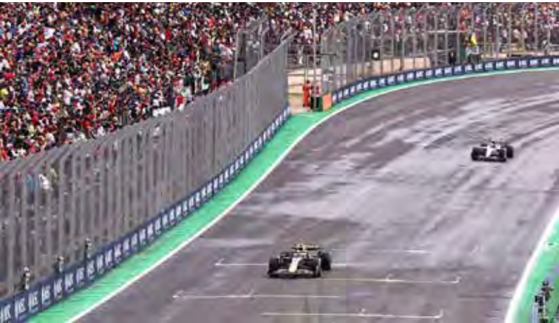
GP de São Paulo é uma das etapas da F1 que serão transmitidas em 2026

11 de outubro – GP de Singapura 8 de novembro – GP de São Paulo 21 de novembro – GP de Las Vegas 6 de dezembro – GP de Abu Dhabi