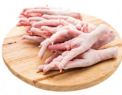
PÉ DE FRANGO A GRANEL KG