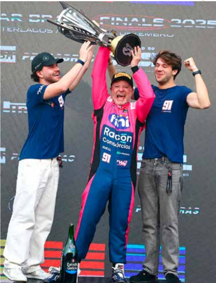
Piloto conquistou o título em Interlagos

A Copa Truck Petrobras retorna em março de 2026, em Campo Grande.