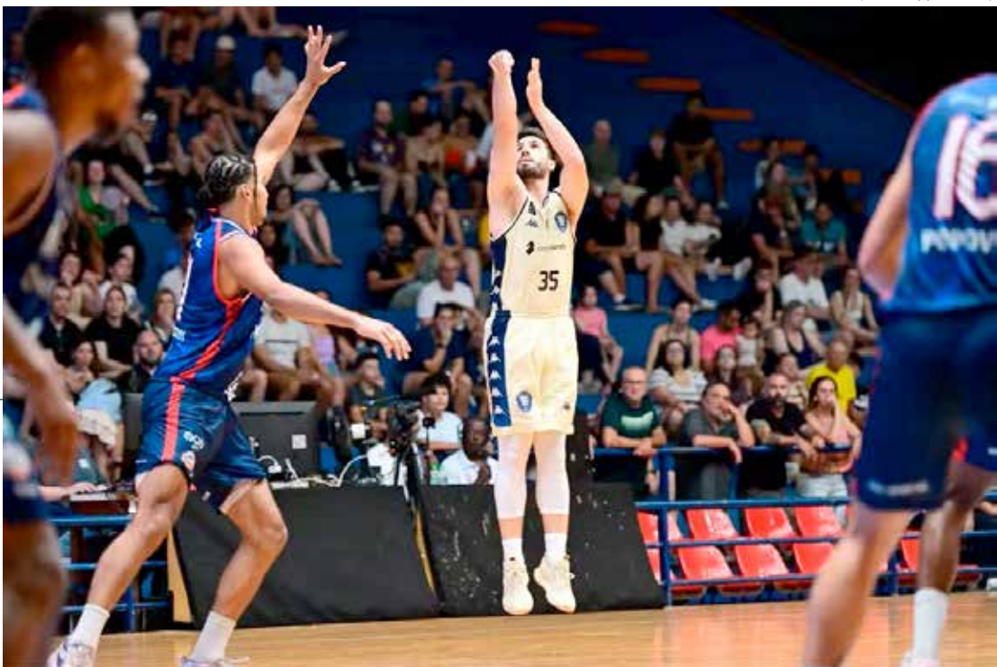
Ginásio Felipe Karam, o Felipão, volta a receber o Rio Claro nesta terça-feira, às 19h, pelo NBB, em confronto direto contra o Pato Basquete