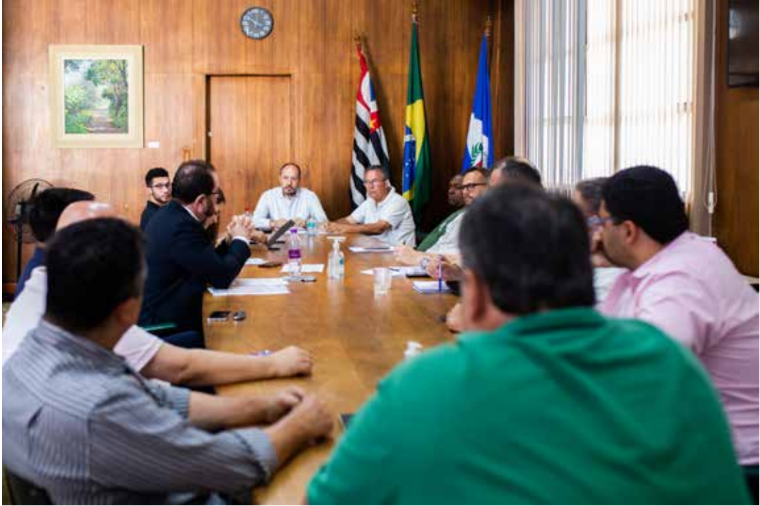
A Comissão de Controle e Contenção de Ocupantes Irregulares reuniu-se nesta segunda-feira (8) no paço municipal