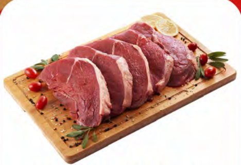
MIOLO DO ALCATRA (CORTAMOS EM BIFES) KG