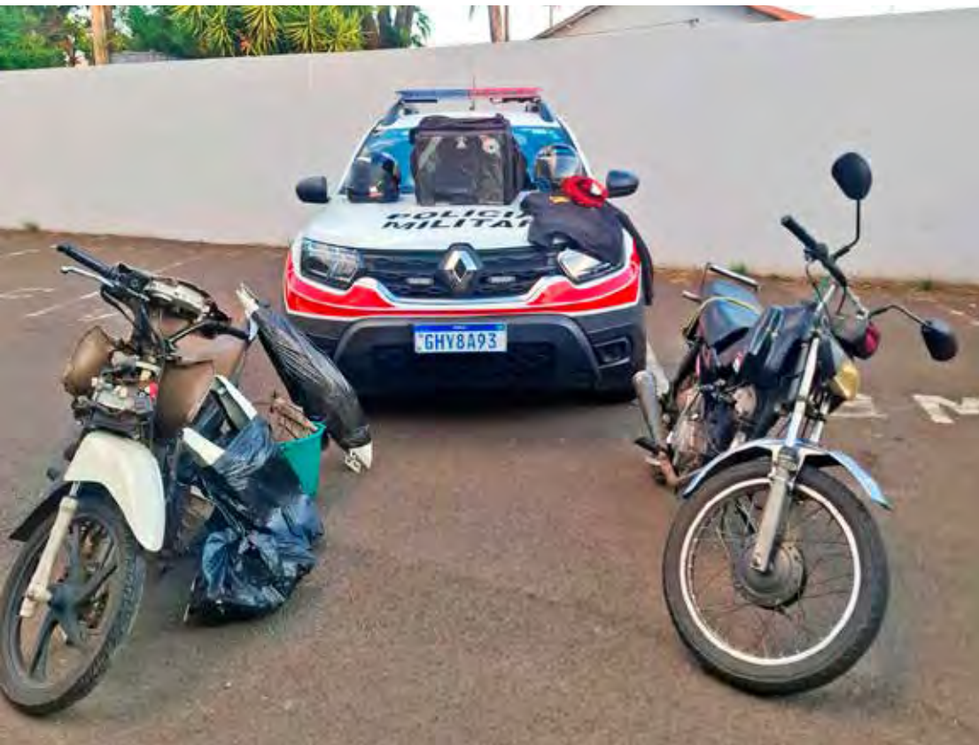
Motocicleta recuperada e materiais apreendidos foram encaminhados à Polícia Civil após a operação

Consta que ambos possuem antecedentes criminais por furto (artigo 155 do Código Penal). Um deles também já foi autuado por tráfico e associação para o tráfico de drogas (artigos 33 e 35 da Lei de Drogas) e por crime previsto na Lei Maria da Penha.