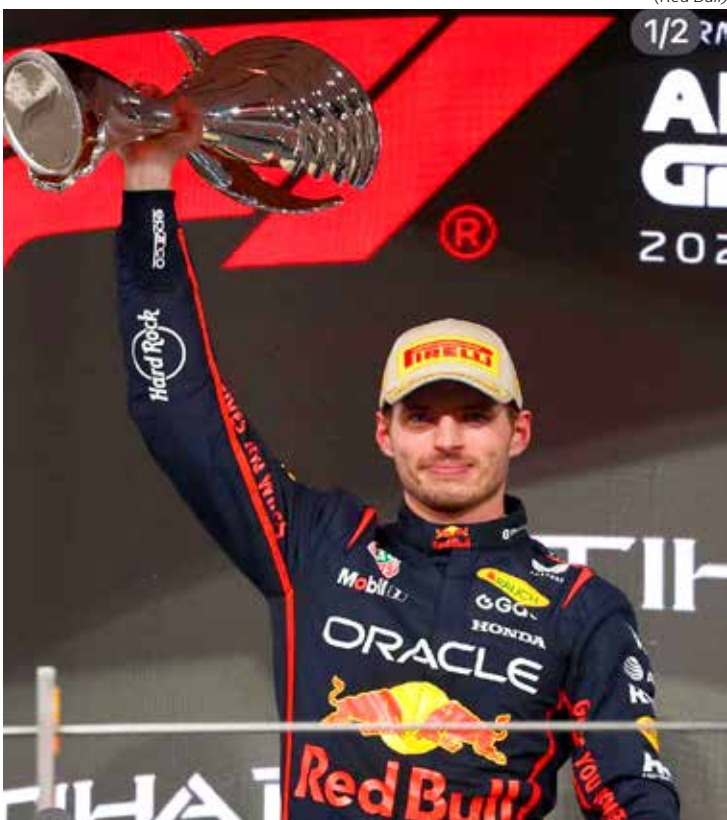
Max Verstappen venceu a última corrida, foi a 421 pontos e deixou de conquistar o pentacampeonato por apenas dois

Seu companheiro na equipe Andretti, o britânico Jake Dennis, venceu a corrida em São Paulo.