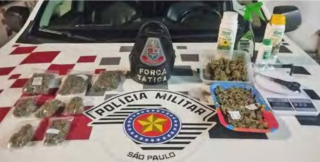
Materiais apreendidos pela Polícia Militar em apartamento utilizado para cultivo e preparo de maconha no bairro Chervezon

Todo o material foi apreendido e encaminhado à Polícia Civil, que ratificou a prisão e dará prosseguimento às investigações.