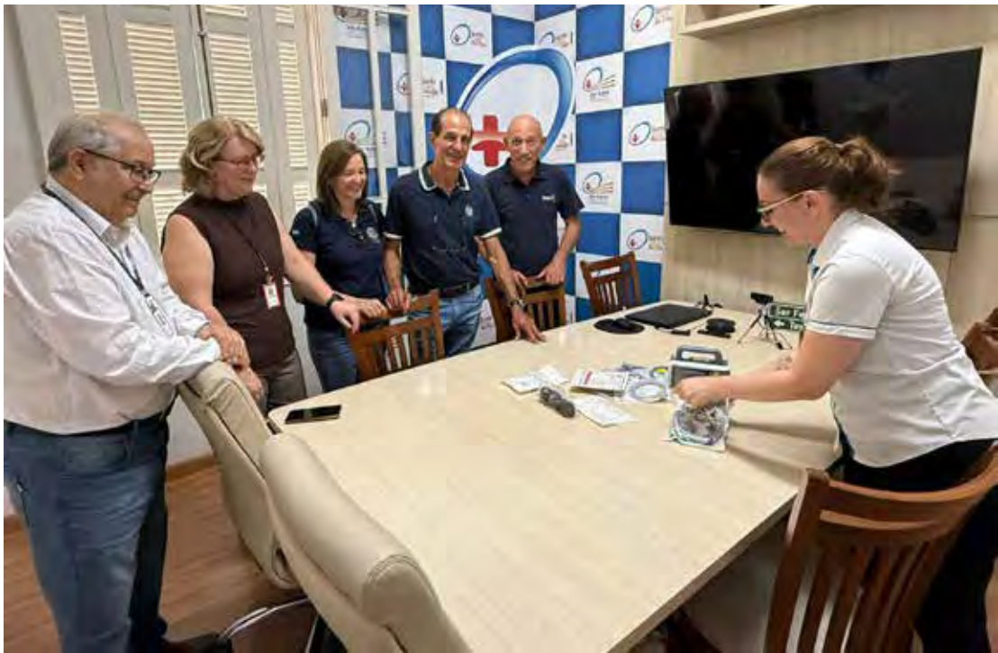
O Rotary Club de Rio Claro entregou à Santa Casa um Monitor de Transporte Multiparamétrico Neonatal