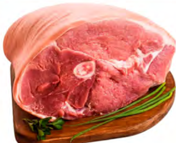
PERNIL SUINO COM OSSO KG