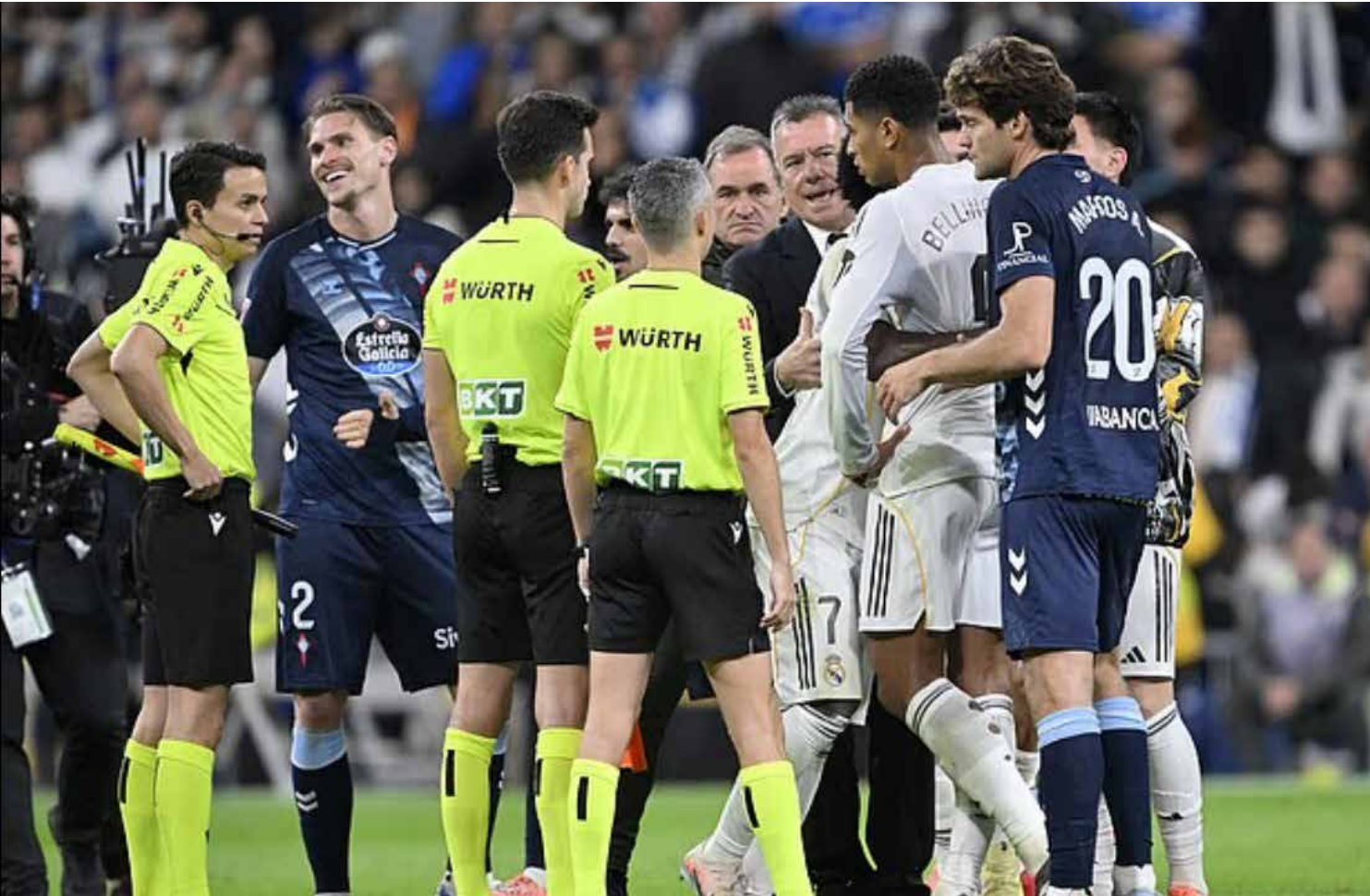
O Real Madrid colapsou total no último domingo e, como sempre, a culpa foi do juiz

Depois de mais uma derrota, desta feita para o Bilbao, jogando fora de casa, o Atlético de Madrid continua na quarta posição, mas agora a quatro pontos do terceiro colocado, Villareal. CAMPEONATO ITALIANO O Campeonato Italiano deixou para a segunda-feira, quatro jogos de sua 14ª rodada, porém até o fechamento desta matéria não tínhamos os resultados destas