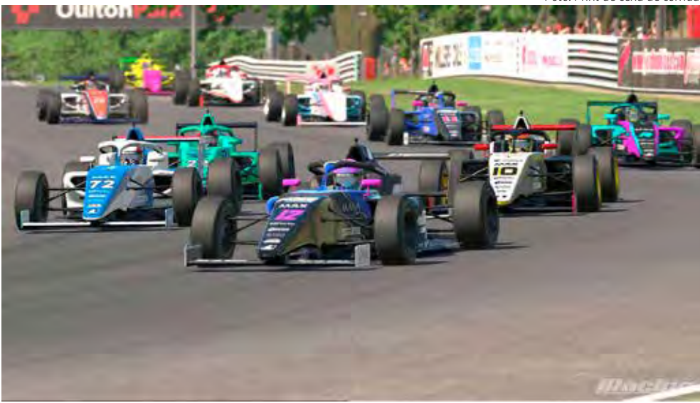
Campeonato de E-Sports FIA Girls on Track, só para mulheres de todas as idades

*Colaboraram na cobertura jornalística da FIA GOT BR Experiência para Estudantes na Fórmula E as voluntárias Pamela Faud, na reportagem; Isabela Katopodis, nas fotos; e os voluntários Gabriela Testa e Felipe Caramori, nas fotos