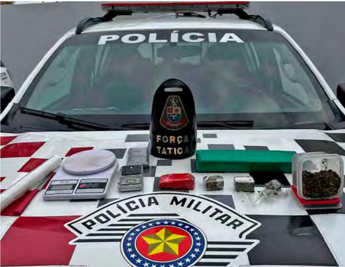
Material apreendido durante a ocorrência incluiu tijolo de maconha, porções da droga e balanças de precisão

A ação integra o trabalho contínuo das forças de segurança no combate ao tráfico de drogas e ao crime organizado no município.