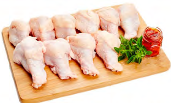
COXINHA DA ASA DE FRANGO KG