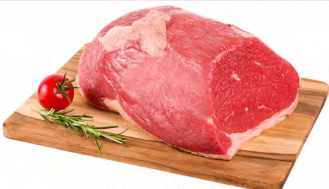
LAGARTO BOVINO KG