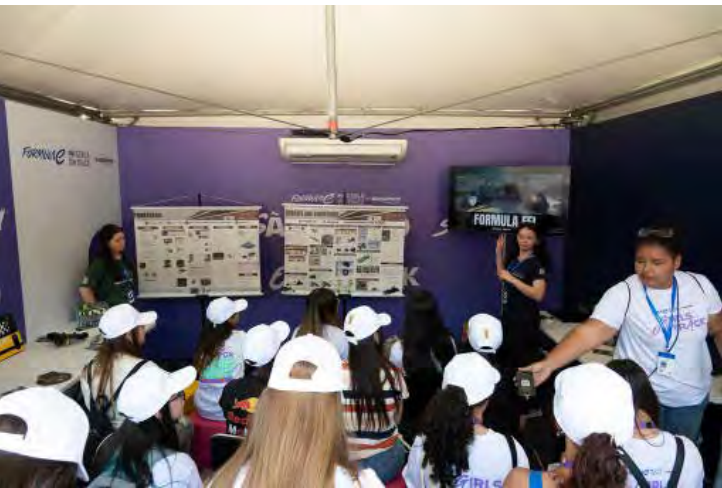
Na apresentação do projeto da FEI