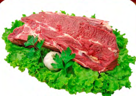
PONTA DE PEITO BOVINA SEM OSSO KG