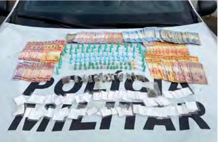
Drogas e dinheiro apreendidos pela Polícia Militar após suspeito abandonar sacola durante fuga no Jardim Nações II

Diante dos fatos, foi dada voz de prisão em flagrante. A ocorrência foi apresentada à autoridade policial, que ratificou a prisão. O homem permaneceu à disposição da Justiça.