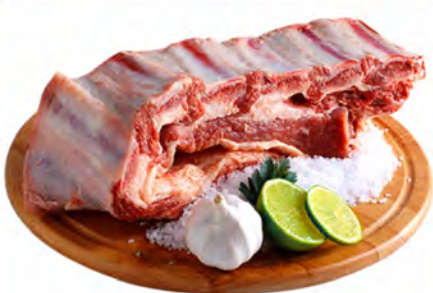
COSTELA BOVINA ESPECIAL KG