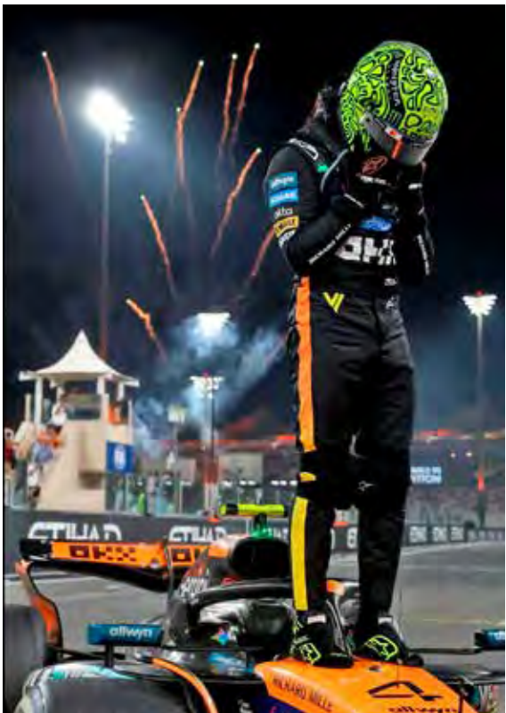
Lando Norris conquistou seu primeiro Mundial de Pilotos e quebrou invencibilidade de Max Verstappen

Membro da academia da McLaren desde 2017, Norris foi promovido à equipe na Fórmula 1 dois anos depois. O britânico fez parte do ressurgimento da escuderia papaya, que amargava campanhas de meio ou fundo de