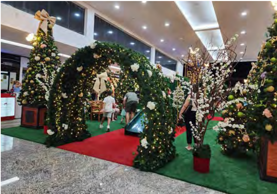
Praça de eventos do Shopping Rio Claro recebeu decoração especial