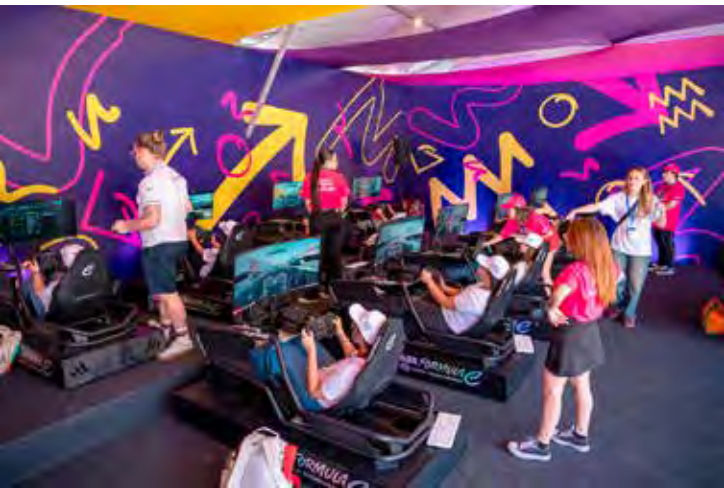
Na Gaming Arena