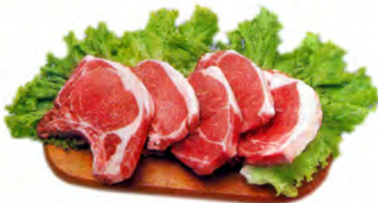
BISTECA SUINA KG