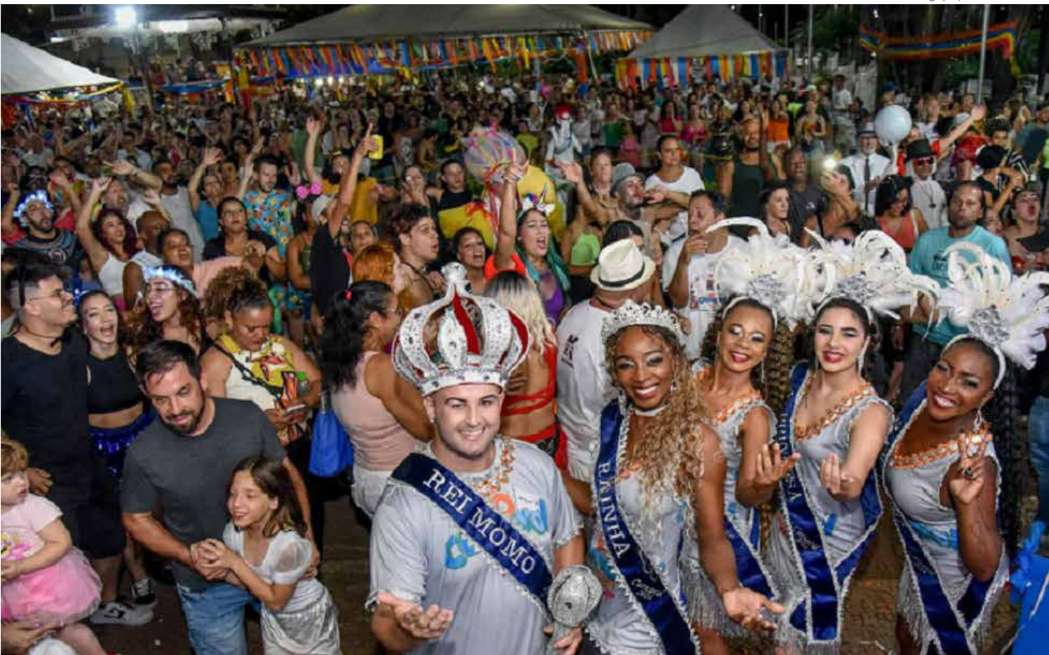
Corte Momesca do Carnaval 2025 participar de evento

A Secretaria de Turismo reforça a importância do compromisso dos eleitos com a agenda oficial. “Uma vez eleitos, os integrantes da