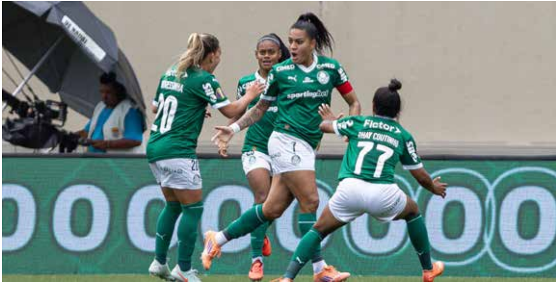
Palmeiras goleia o Corinthians e fica próximo do título estadual

A goleada deixa o Corinthians com a missão de fazer um jogo quase perfeito na volta para manter vivo o sonho do quinto título estadual. Já o Palmeiras pode conquistar o quarto troféu - o segundo seguido - e igualar o recorde histórico de títulos de Santos e Corinthians.