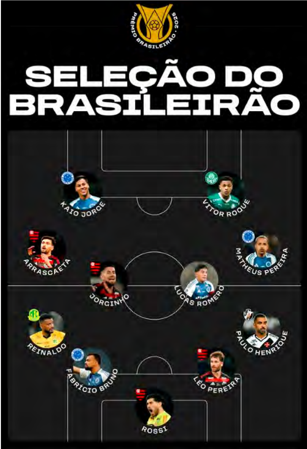
A Seleção do Brasileiro que consagrou o Flamengo como campeão