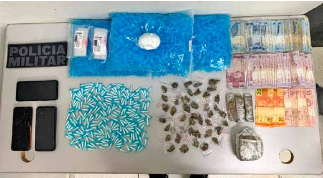
Drogas, dinheiro e materiais usados no preparo dos entorpecentes apreendidos pela Polícia Militar no Jardim São José

Segundo o registro, o suspeito já possui antecedentes criminais por delitos previstos na Lei de Drogas (Lei nº 11.343/06). Diante dos fatos, ele recebeu voz de prisão em flagrante e foi encaminhado à Polícia Civil. A autoridade de plantão ratificou a prisão, e o acusado permaneceu à disposição da Justiça.