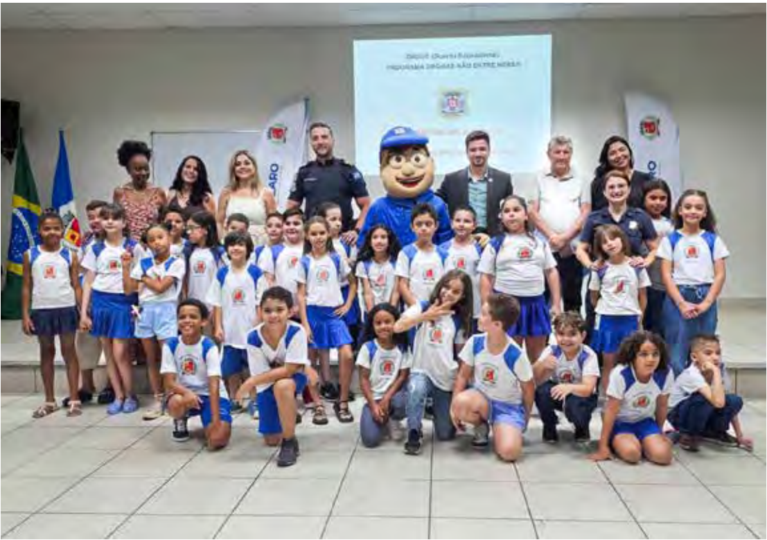
Ao todo, 34 estudantes dos 3º anos, com idades entre 9 e 10 anos, concluíram três meses de atividades do curso “Drogas: Não entre nessa”

A ação foi organizada pela Divisão de Comunicação Social da Guarda Civil Municipal.