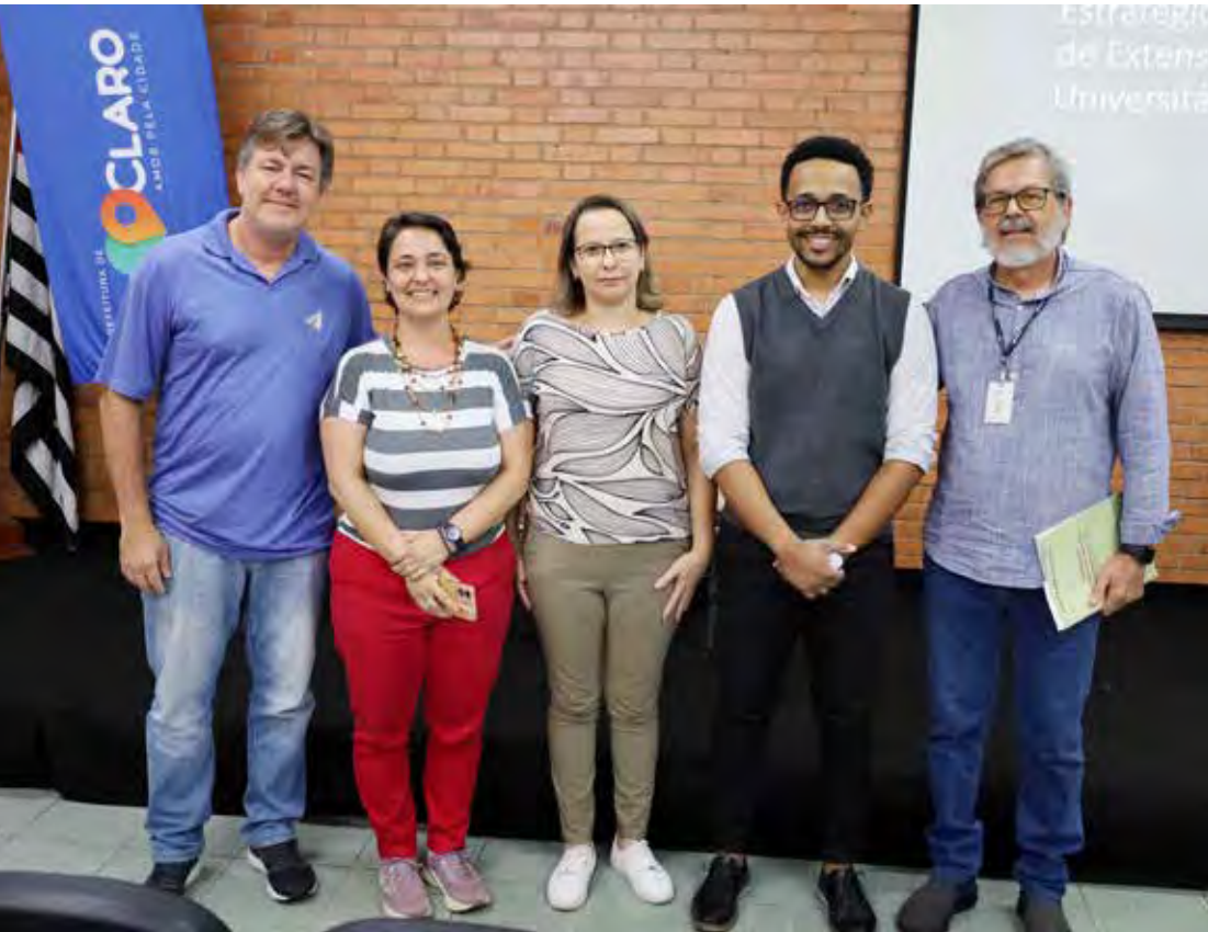
Reunião de grupo de trabalho em extensão universitária foi realizada quarta-feira

versitária, do Projeto de Pesquisa em Políticas Públicas – Apoio Matricial em Empreendedorismo Inovador (Fapesp) – foi realizada no Núcleo Administrativo Municipal e teve representantes da Unesp – Rio Claro, Claretiano – Centro Universitário, Fatec