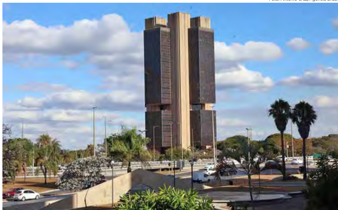
Vista do prédio que abriga o Banco Central em Brasília (DF)

As previsões do mercado estão mais otimistas. De acordo com o boletim Focus, pesquisa semanal com instituições financeiras divulgada pelo BC, a inflação oficial deverá fechar o