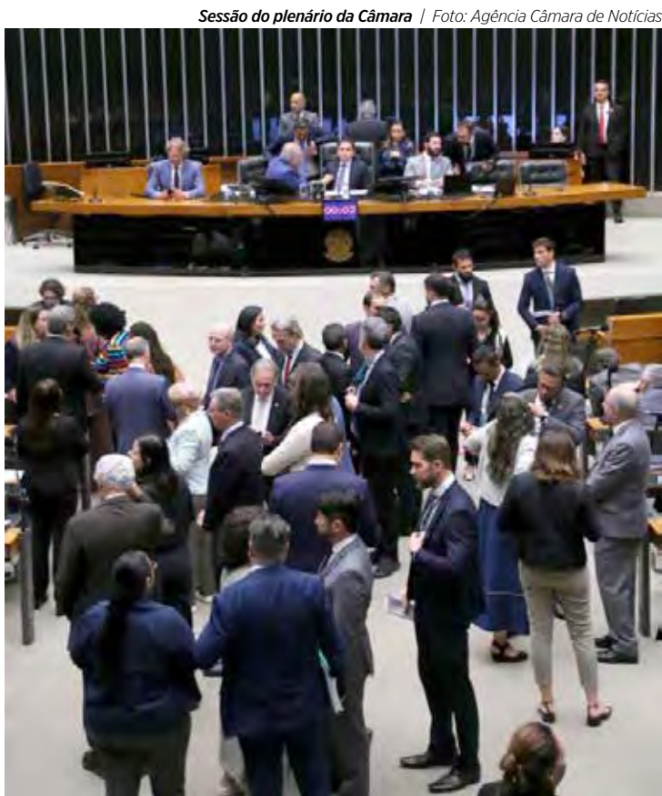
Sessão do plenário da Câmara | Foto: Agência Câmara de Notícias

barrou a enxurrada de pedidos contra ministros do STF. O Senado diz que a mudança cria “zonas de dúvida interpretativa”. Dúvida mesmo é como surgiram 81 pedidos assim, do nada. Se tivessem canalizado essa energia pra marcar exame médico, o SUS até estranhava. • Dosimetria do 8 de janeiro. A Câmara aprovou a redução de penas para condenados do 8 de janeiro. Não é anistia — é “ajuste fino”, tipo quando o chefe manda