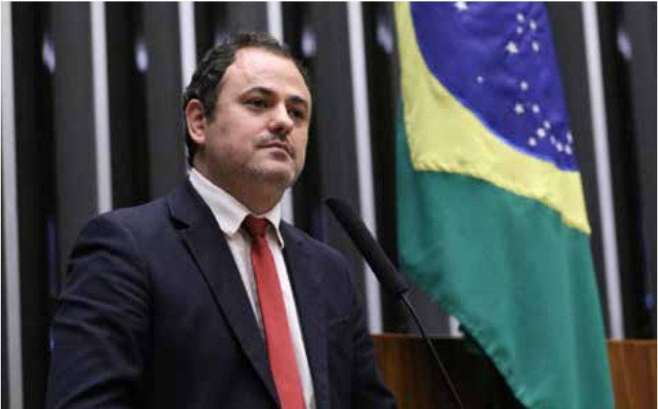
Tarcísio de Freitas