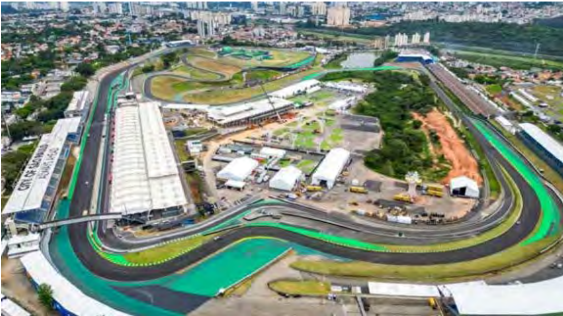
Interlagos será o palco da coroação de campeões na Superfinal da temporada 2025 de várias categorias

com uma etapa especial, formada por uma prova única de 3h de duração, para coroar os campeões Overall A, Overall B, Overall Rookie e Endurance.