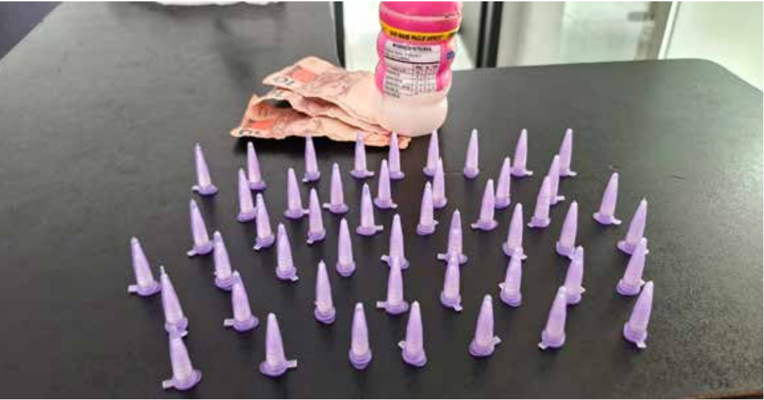
Drogas e dinheiro apreendidos com o suspeito durante a ação da Polícia Militar no bairro Estádio

A autoridade de plantão ratificou a prisão em flagrante e o acusado permaneceu à disposição da Justiça.