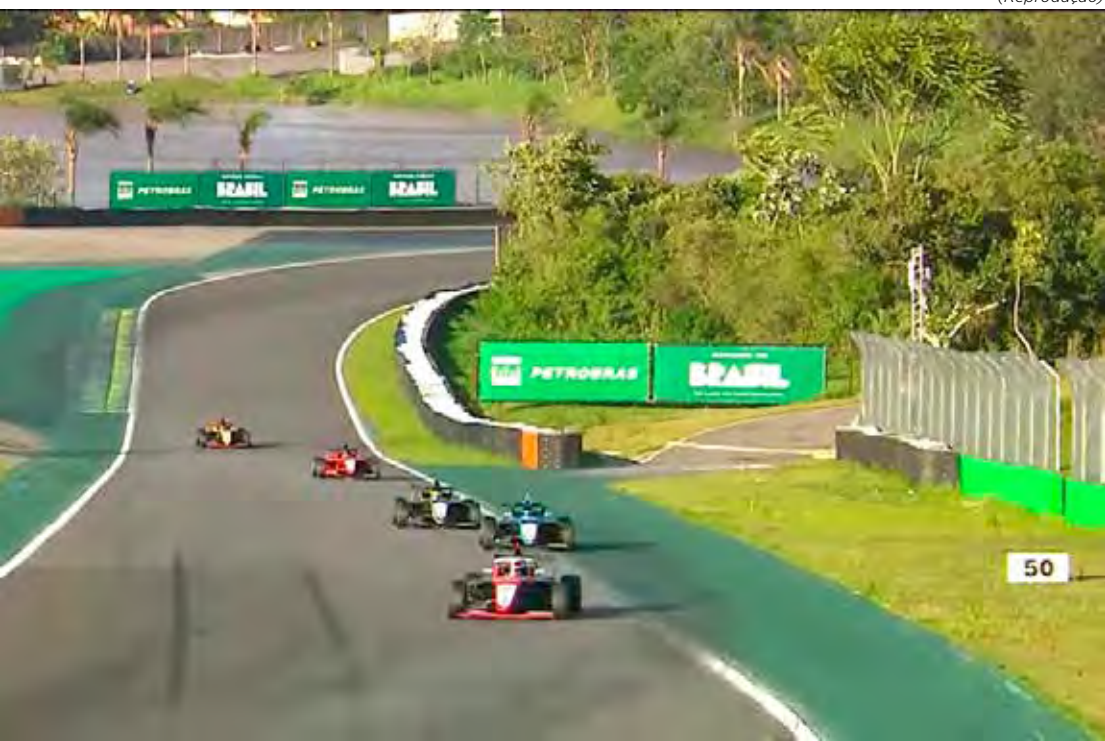
Fórmula 4 Brasil realizou a primeira de uma sequência inédita de seus largadas no traçado paulistano de Interlagos

A BRB Fórmula 4 Brasil tem transmissão ao vivo pelo canal oficial da categoria no YouTube, na TV por assinatura pela emissora BandSports e no canal Esporte na Band no YouTube.