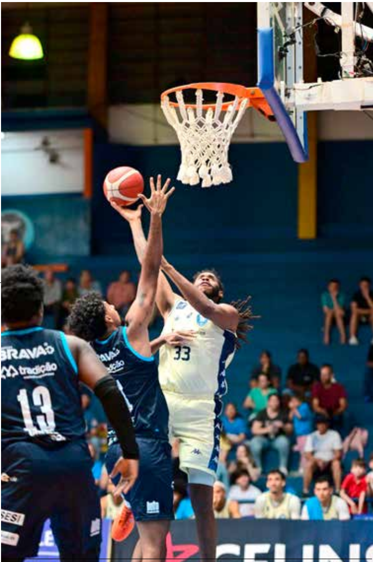
Jogadores do Rio Claro em ação no Ginásio Felipe Karam durante partida intensa pelo NBB

jogadas e fechou o duelo com um duplo-duplo, ao registrar 21 pontos e 12 assistências. Owens também teve atuação sólida, com 18 pontos e 10 rebotes, dominando o garrafão em diversos momentos. O confronto contra o São José passa a ser tratado como fundamental para a recuperação da equipe na tabela. A comissão técnica já trabalha ajustes defensivos e ofensivos visando a partida fora de casa, que será um novo teste de consistência para o elenco.