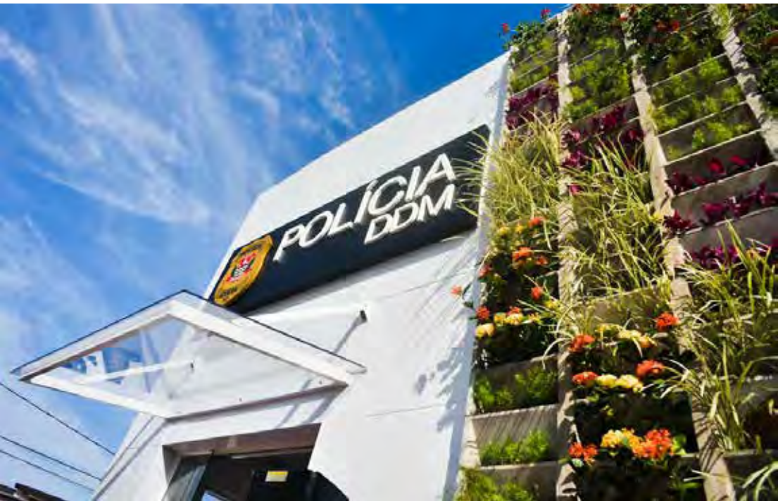
O resultado das ações, com os números dos mandados que são cumpridos, serão divulgados ainda esta semana

De acordo com a Polícia Civil, desde 20 de novembro, foram elaborados mais de 21 mil boletins de ocorrência, com 8,1 mil representações por Medidas Protetivas de Urgência. Os policiais realizaram 305 representações por prisão, com o cumprimento de quase 200 ordens judiciais. Ao todo, aconteceram 914 prisões em flagrante em todo o estado.