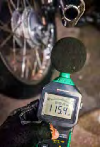
Motocicletas foram apreendidas pela ROMU após fiscalização por manobras perigosas e ruído excessivo no Jardim São Caetano

ção, a equipe realizou a abordagem de três motociclistas. Nada de ilícito foi encontrado com os condutores durante a revista pessoal. No entanto, após vistoria nos veículos, foram constatadas infrações administrativas. Duas motocicletas — uma Honda CB 1000 vermelha e uma Honda CG 150 vermelha — foram recolhidas com base na Lei Municipal nº 5.468/21, em razão de ruído excessivo provocado por escapamentos irregulares. Já uma Yamaha Lander branca foi apreendida pela prática de manobras de malabarismo em via pública sem autorização. Os condutores foram devidamente orientados e liberados no local. As motocicletas foram removidas ao pátio credenciado. O veículo que motivou a denúncia inicial foi autuado por estacionamento irregular, mas acabou liberado ao proprietário, que compareceu ao local antes da chegada do guincho.