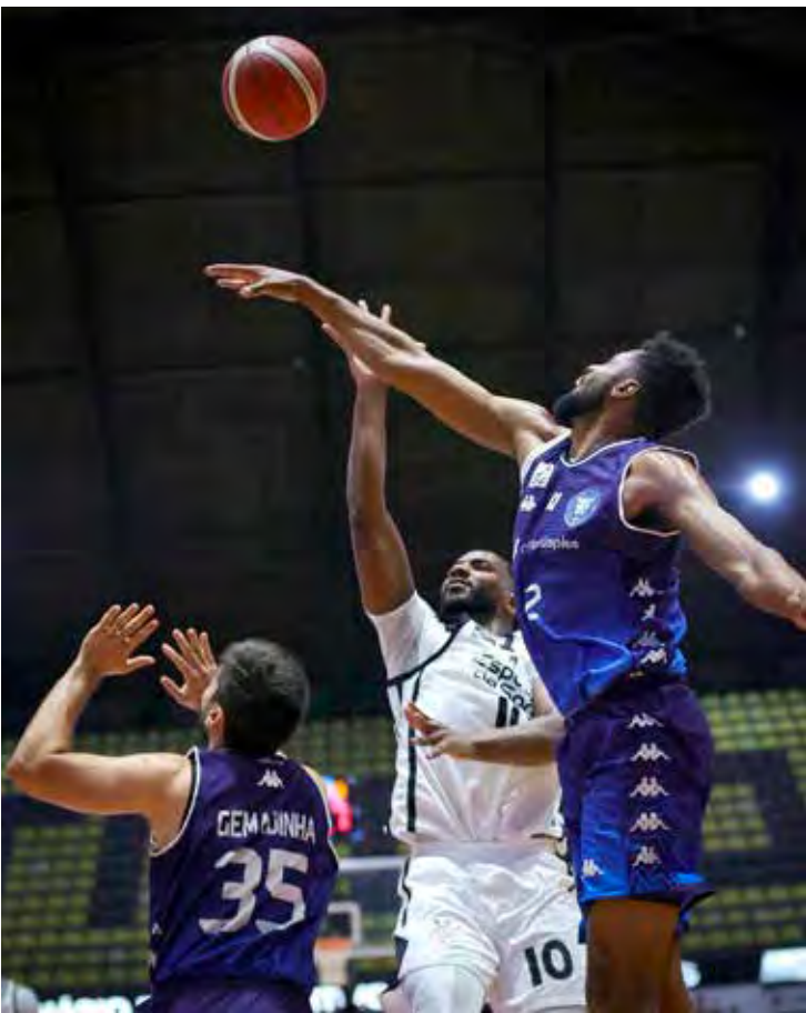
Jogadores do Conta Simples Rio Claro em ação durante a partida contra o Corinthians, no Ginásio Wlamir Marques, pelo NBB

O próximo compromisso do Conta Simples Rio Claro será no dia 22 de dezembro, fora de casa, diante do Bauru, em mais um desafio importante na caminhada pelo NBB. Já o Corinthians volta a jogar na quarta-feira, quando enfrenta o Osasco, também como visitante.