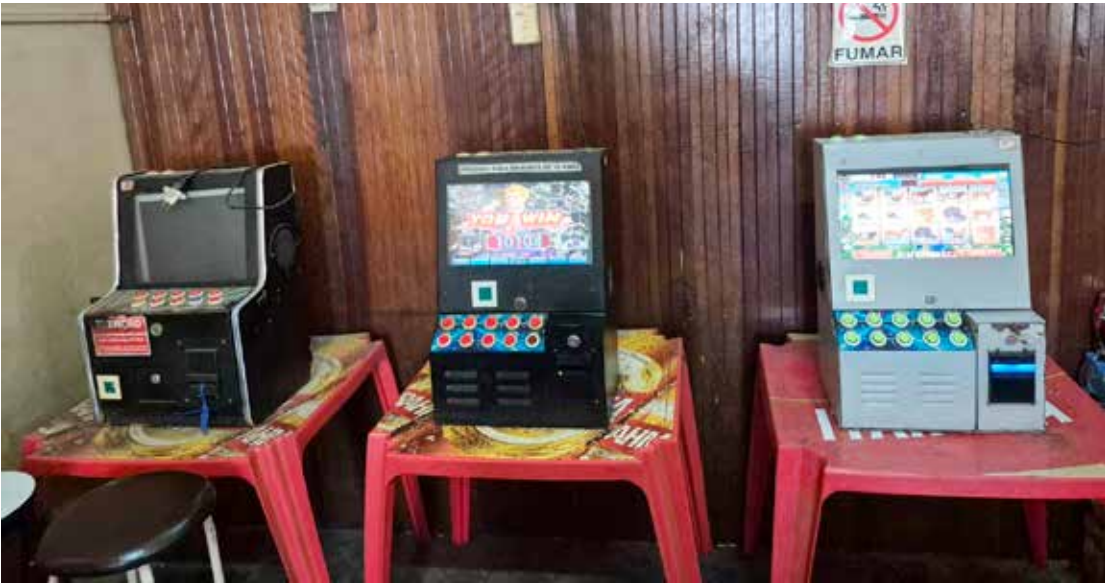
Máquinas eletrônicas e materiais utilizados em jogo de azar foram apreendidos durante ação da Polícia Militar no Centro

procedimentos necessários. Todas as máquinas foram devidamente lacradas, além da apreensão de dispositivos eletrônicos e dinheiro em espécie relacionados à prática ilegal. A ocorrência foi apresentada à Polícia Civil, que assumiu a responsabilidade pelas providências legais cabíveis. Todo o material apreendido permaneceu à disposição da Justiça para investigação e demais medidas previstas em lei.