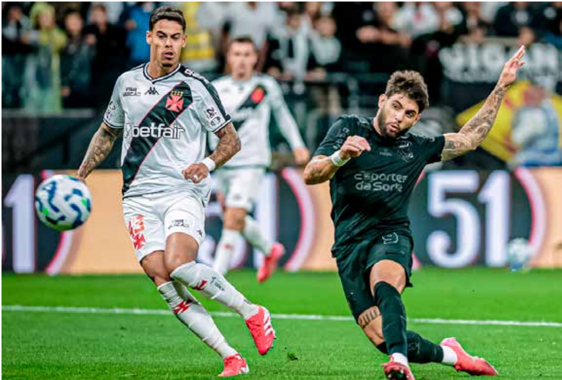
Corinthians e Vasco entram em campo na Neo Química Arena para o primeiro capítulo da final da Copa do Brasil 2025

A final da Copa do Brasil será decidida em dois jogos. Após o confronto desta quarta-feira, o campeão será conhecido no domingo (21), no Maracanã, quando Corinthians e Vasco voltam a se enfrentar em mais um capítulo de uma rivalidade histórica do futebol brasileiro.