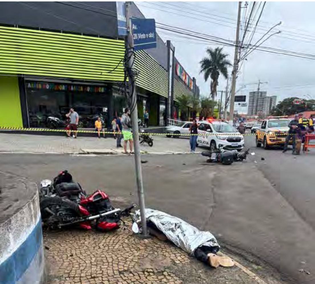
Equipes da Polícia Militar e do resgate atuam em ocorrência de acidente entre motocicletas que resultou na morte de um jovem de 18 anos na Vila Aparecida