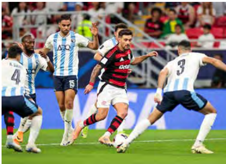
Flamengo disputa o título da Copa Intercontinental 2025, no estádio Ahmad bin Ali, no Catar

Técnicos que mais chegaram à final da Copa do Brasil (1989-2025): 5 - Dorival Júnior (2010*, 2015, 2022*, 2023* e 2025); 5 - Luiz Felipe Scolari (1991*, 1994*, 1995, 1998* e 2012*); 5 - Marcelo Oliveira (2011, 2012, 2014 e 2015* e 2016); 4 - Renato Gaúcho (2006, 2007*, 2016* e 2020); 4 - Levir Culpi (1996*, 1998, 2000 e 2014*); 4 - Mano Menezes (2008, 2009*, 2017*, 2018*; 3 - Vanderlei Luxemburgo (1996, 2001, 2003*) (* Campeão).