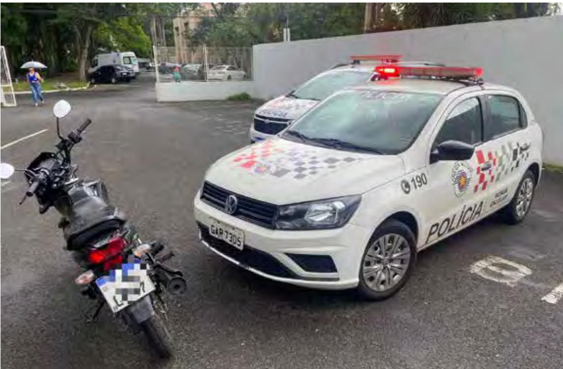
Motocicleta roubada foi recuperada pela Polícia Militar durante ação no bairro Jardim Cherveson

para sua contenção. Em seguida, ele recebeu atendimento médico. De acordo com a Polícia Militar, o indivíduo não possui antecedentes criminais. Diante dos fatos, foi dada voz de prisão em flagrante. O suspeito, juntamente com todo o material apreendido, foi encaminhado à Polícia Civil, onde permaneceu à disposição da Justiça para as providências legais. A Polícia Militar reforça que ações de patrulhamento ostensivo seguem intensificadas com o objetivo de combater crimes patrimoniais e o tráfico de drogas, garantindo mais segurança à população.