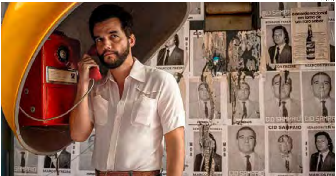
O ator Wagner Moura em cena do filme “O Agente Secreto”

mo informante e espião, costurando questões históricas e políticas com elementos de suspense. Outras produções brasileiras apareceram na lista de pré-selecionados, caso de “Apocalipse nos Trópicos”, dirigido por Petra Costa, na categoria de Melhor Documentário, e de “Amarela”, contemplado na categoria de Melhor Curta-Metragem.