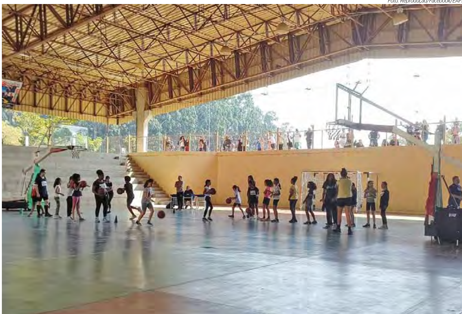
A proposta reforça o papel da escola como espaço de inclusão e iniciação esportiva

Na justificativa, Ortiz Junior destaca a experiência bem-