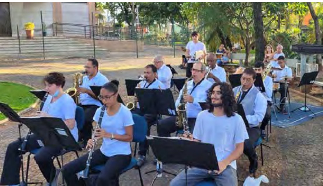
A Corporação Musical Augusto Trambaiolli se apresentará na Cantata de Natal hoje no auditório municipal

A expectativa é de casa cheia para uma noite em que a magia do Natal ilumina Santa Gertrudes — no palco, nas ruas e nas casas da cidade.