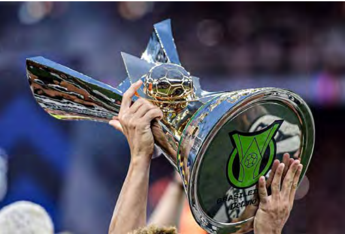
Brasileirão 2026 começa no dia 28 de janeiro com grandes clássicos

Jogos da 1ª rodada do Brasileirão 2026: Fluminense x Grêmio; Botafogo x Cruzeiro; São Paulo x Flamengo; Corinthians x Bahia; Mirassol x Vasco; Atlético-MG x Palmeiras; Internacional x Athletico-PR; Coritiba x Red Bull Bragantino; Vitória x Remo e Chapecoense x Santos.