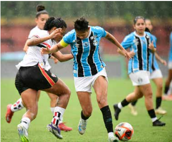
Copinha Feminina chega a sua decisão no próximo domingo no Pacaembu

No primeiro confronto do dia, às 16h, Grêmio e Santos protagonizaram um duelo equilibrado, com poucas chances claras de gol ao longo dos 90 minutos.