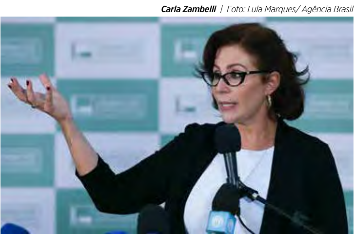
Carla Zambelli