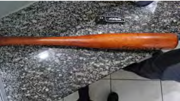
Polícia Militar atendeu ocorrência de briga entre vizinhos que deixou um homem ferido em Cordeirópolis

Uma briga entre vizinhos terminou com um homem de 50 anos ferido na noite desta terça-feira (16), no cruzamento da Avenida Presidente Vargas com a Rua Professora Aita Bentivegna, no bairro Vila Nova Brasília, em Cordeirópolis (SP). A ocorrência foi registrada por volta das 20h45. De acordo com o boletim de ocorrência, a Polícia Militar foi acionada por uma moradora que relatou uma confusão na via pública. No local, os policiais encontraram o homem de 50 anos caído no chão, com ferimentos no rosto e na região abdominal. Um homem de 37 anos relatou aos policiais que mantém desentendimentos antigos com o ferido. Segundo ele, em outras ocasiões, o homem mais velho teria riscado e danificado seu veículo, um Renault Kwid. Ainda conforme o relato, na noite dos fatos, ao passar em frente