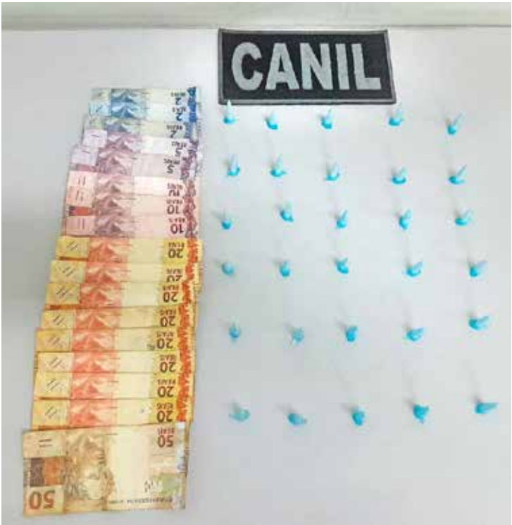
Drogas e dinheiro apreendidos pela equipe ROMU-CANIL durante patrulhamento no Jardim Progresso

A Guarda Civil Municipal, por meio da equipe ROMU-CANIL, apreendeu entorpecentes e dinheiro com uma adolescente de 16 anos na noite de segunda-feira (15), por volta das 20h20, durante policiamento preventivo pela Avenida M-55, no bairro Jardim Progresso. De acordo com a GCM, a adolescente demonstrou visível nervosismo ao perceber a presença da equipe, o que motivou a abordagem. Ela já era conhecida nos meios policiais por envolvimento anterior com o tráfico de entorpecentes na região. Questionada, a menor informou espontaneamente que portava 30 microtubos contendo substância análoga à cocaína, que estavam escondidos na região da axila, além da quantia de R$ 256,00 em dinheiro, em notas diversas. Ainda segundo o relato, a adolescente declarou que estaria comercializan-