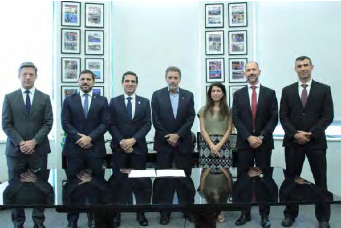
O acordo não prevê investimento financeiro entre as partes e estabelece uma série de ações integradas

as partes e estabelece uma série de ações integradas. Entre elas estão a cooperação operacional, o desenvolvimento de projetos e iniciativas voltadas à capacitação de recursos humanos, além do compartilhamento de tecnologias, sistemas, dados e informações, com o objetivo de harmonizar processos e ampliar a capacidade de análise e difusão de informações estratégicas. Além disso, no prazo de até 30 dias após a celebração do acordo, cada instituição deverá designar formalmente servidores responsáveis por gerenciar a parceria, zelar pelo cumprimento das cláusulas e coordenar, acompanhar, monitorar e supervisionar as ações previstas.