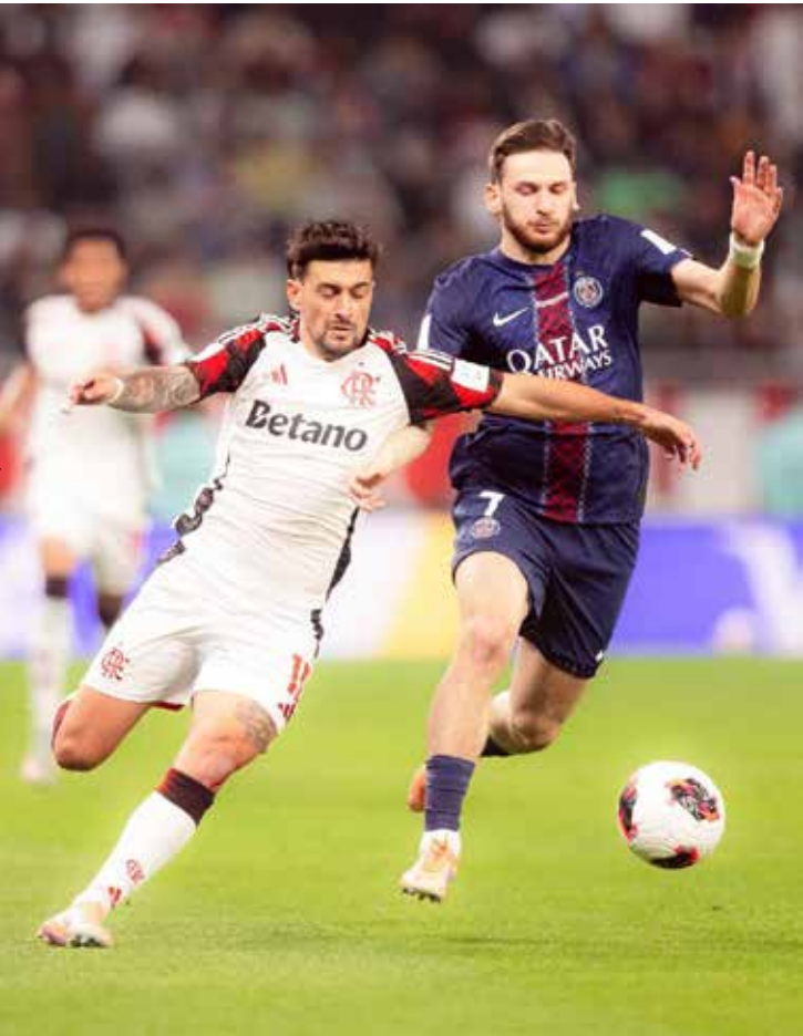
Lance do jogo entre Flamengo e PSG (França) que venceu por 2 a 1