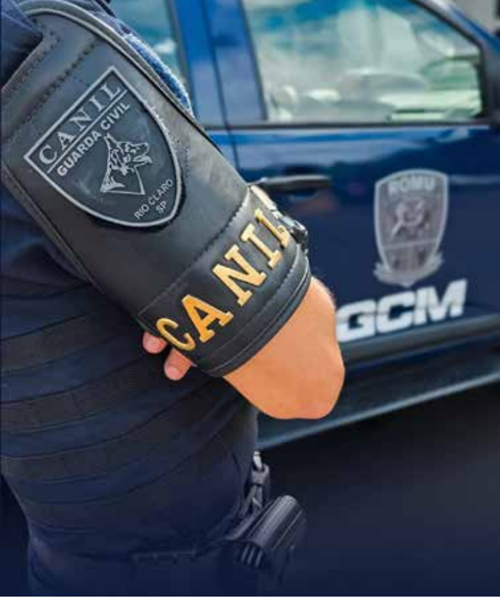
Equipe da ROMU-CANIL da GCM realizou a prisão de homem procurado pela Justiça durante patrulhamento no Bairro do Estádio

Na tarde desta segunda-feira (16), por volta das 14h30, a Guarda Civil Municipal, por meio da equipe da ROMU-CANIL, realizou a prisão de um homem de 40 anos durante policiamento preventivo no Bairro do Estádio. A abordagem ocorreu nas proximidades de um local já conhecido pela prática de tráfico de entorpecentes. Durante a revista pessoal, nada de ilícito foi localizado com o indivíduo. No entanto, ao ser realizada a consulta aos antecedentes criminais, foi constatado que havia contra ele um mandado de prisão preventiva em aberto. O mandado refere-se ao crime de furto, previsto no artigo 155 do Código Penal, com validade até 11 de fevereiro de 2037. Diante da situação, o homem foi conduzido ao plantão policial, onde a autoridade policial cumpriu a ordem judicial. Após os procedimentos legais, o indivíduo permaneceu à disposição da Justiça.