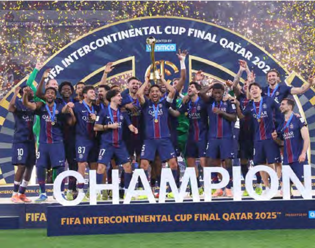
PSG - Paris Saint-Germain

• The Best sem verde-amarelo. Dembelé e Aitana Bonmatí levaram o Fifa The Best 2025 direto de Doha, confirmando o que a Bola de Ouro já tinha avisado. O francês brilhou no PSG com gols, títulos e estatísticas de videogame; a espanhola fez história ao ganhar pela terceira vez seguida. Para o Brasil, sobrou a torcida: Raphinha e Alisson concorreram, mas ficaram no “quase”. O prêmio passou longe do verde-amarelo — e o consolo foi lembrar que, no futebol, nem sempre o melhor fala português.