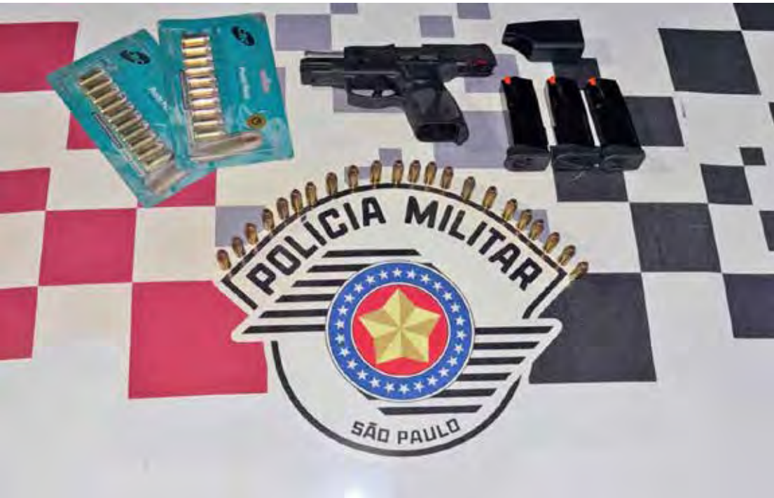
Arma de fogo, munições e carregadores apreendidos pela Polícia Militar durante ocorrência de ameaça no bairro Panorama

da. O armamento e os demais itens apreendidos permaneceram à disposição da Polícia Civil para as providências legais cabíveis. Após os procedimentos de praxe, o envolvido foi liberado pela autoridade policial. A Polícia Militar reforça a importância das denúncias da população, que contribuem diretamente para a prevenção de crimes e para a manutenção da segurança nos bairros.