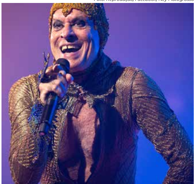
Ney Matogrosso fará show no Palco Rio no réveillon na Praia de Copacabana