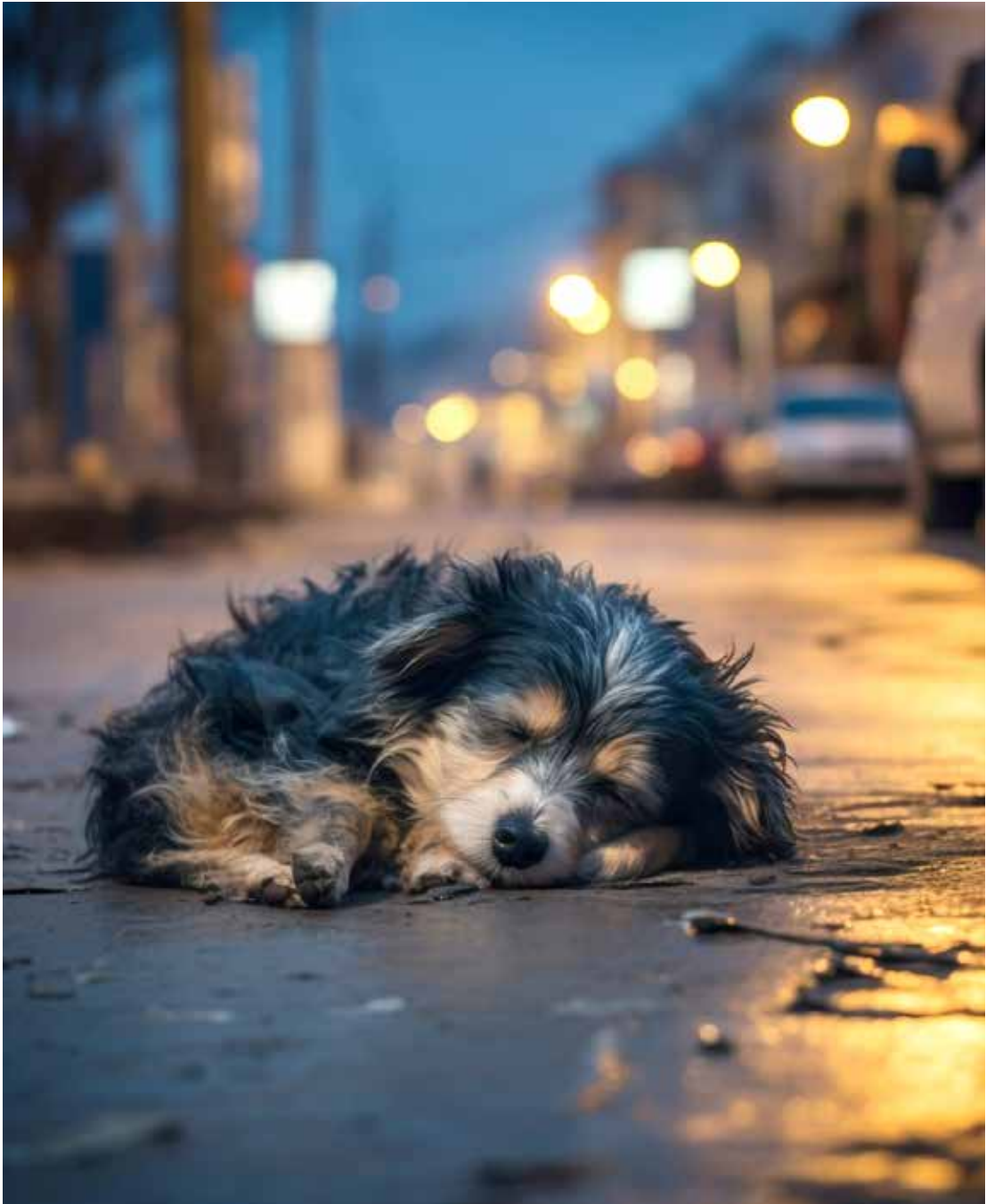
Cachorro abandonado dorme no meio da rua

Abandono é crime A Secretaria Municipal da Saúde de São Paulo lembra que o abandono de animais é considerado crime, conforme a Lei 9.605/1998, e que notificações devem ser feitas aos órgãos de segurança pública, por meio da Delegacia Eletrônica de Proteção Animal e o Disque Denúncia Animal, no 0800-600-6428. O abandono de animais pode levar a pena de até 1 ano de prisão, o que é agravado se houver indícios de maus tratos ou risco para a saúde do animal.