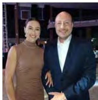
Prefeito Gustavo Perissinotto e primeira-dama Dama Bruna Perissinotto