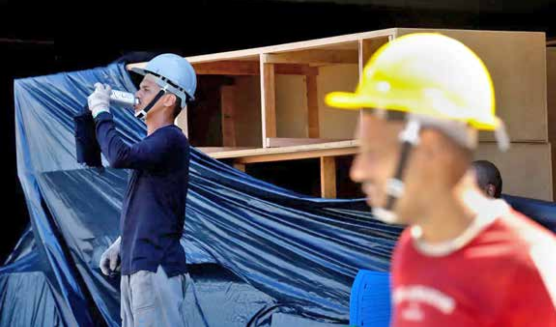
Diante do cenário de intenso calor, a população de manter a hidratação constante, além de outros cuidados

Dados do Ceapla/Unesp/Prefeitura mostram sequência de máximas acima de 33°C desde o início da estação, com pico de 36,4°C no dia de Natal e baixa umidade do ar