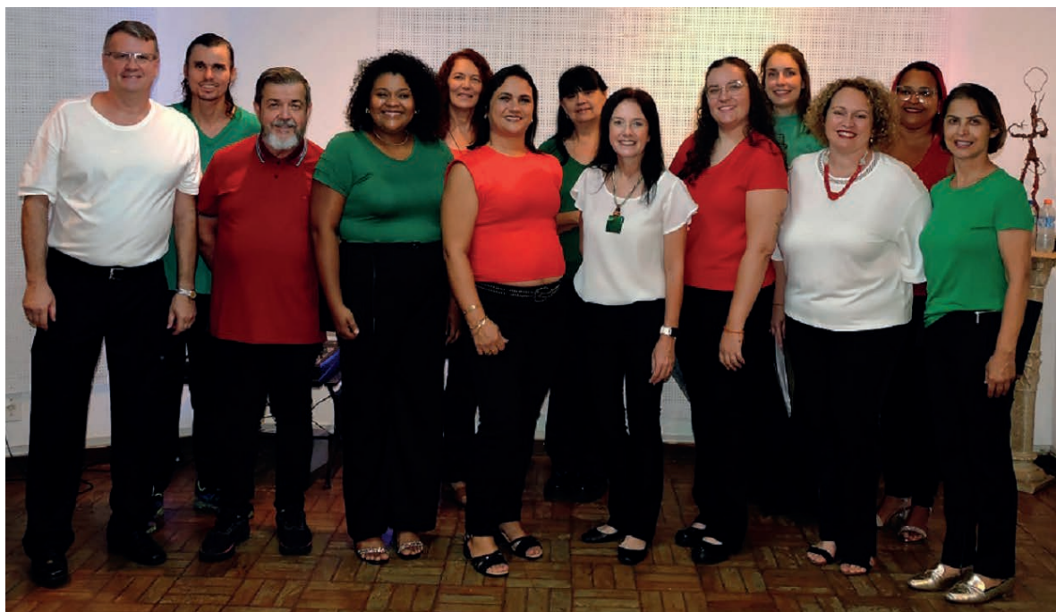
Coral Filarmônica Move Canto fez sua primeira apresentação