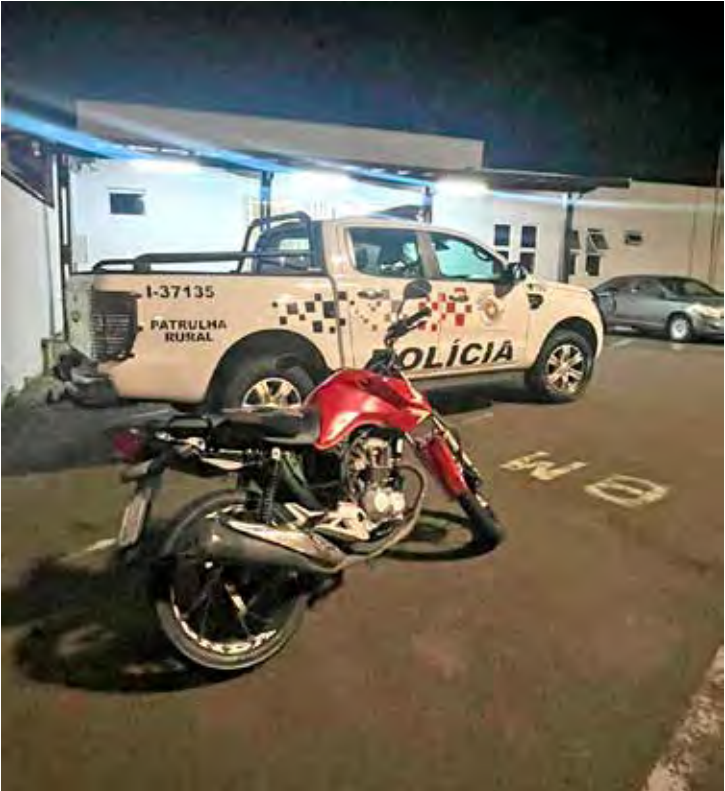
Motocicleta e entorpecentes apreendidos pela Polícia Militar após acompanhamento e prisão em flagrante em Santa Gertrudes

Em vistoria no veículo, os policiais localizaram entorpecentes ocultos em compartimento da motocicleta. Também foi constatado que o condutor não possuía habilitação e apresentava estado de embriaguez ao volante.