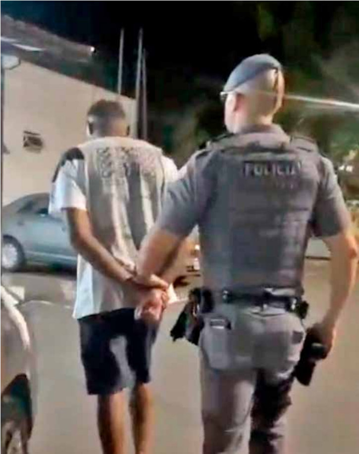
Polícia Militar intensificou o patrulhamento no Jardim das Flores e realizou a captura de indivíduo procurado pela Justiça

A ocorrência foi apresentada no Plantão Policial, onde a autoridade competente ratificou a prisão, permanecendo o indivíduo à disposição da Justiça.