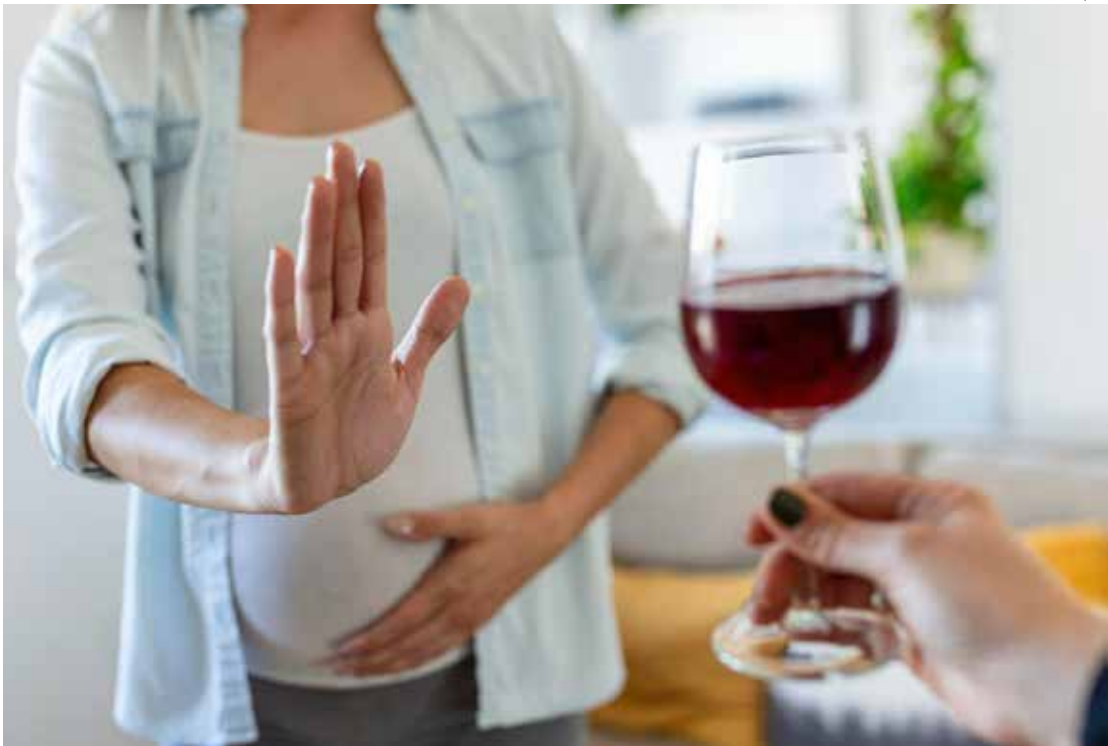
Beber durante a gestação pode elevar o risco de alterações no feto em até 65 vezes

“O diagnóstico precoce da doença e a instituição de tratamento ainda na primeira