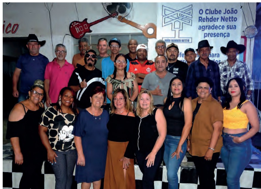
Cantores que participaram da gravação do 6º CD do Rehder Netto