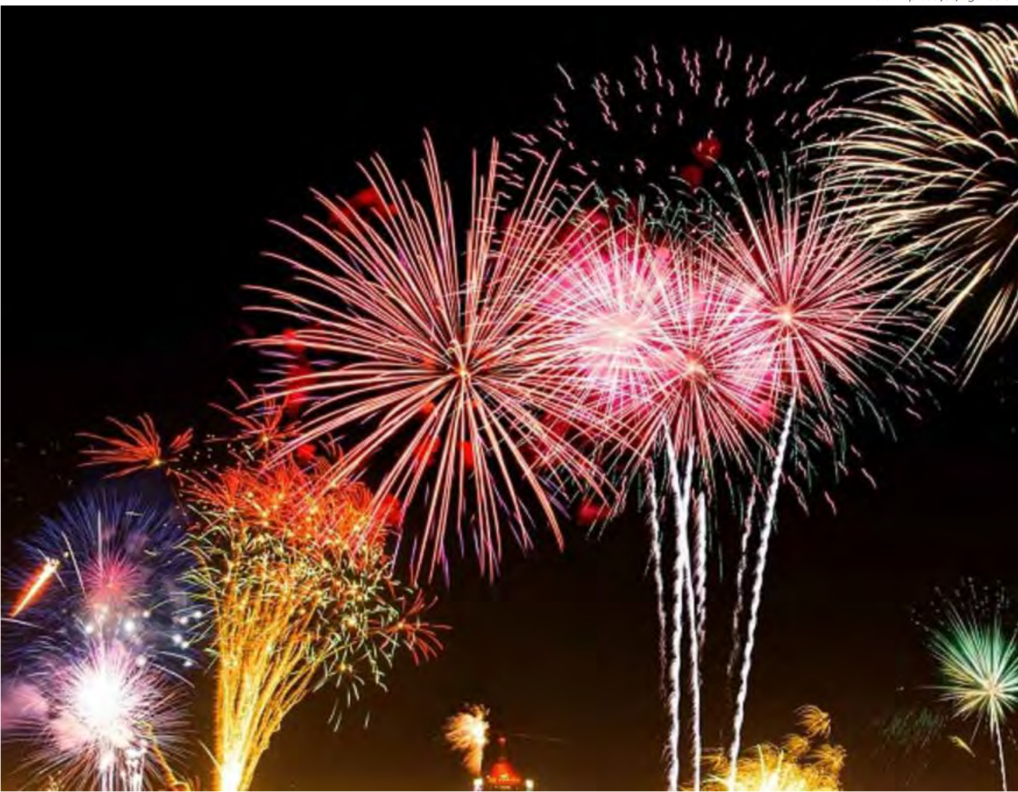
A campanha “SP Sem Fogos” visa reduzir o sofrimento causado pelo barulho excessivo dos fogos de artifício