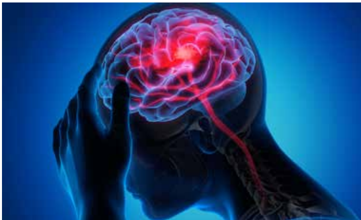
O AVC é uma das principais causas de morte e incapacidade no mundo

“Esses são os sintomas principais de uma pessoa que está tendo um AVC. Ela vai ter dificuldade de movimento, de fala, de visão ou uma perda súbita da consciência. É uma doença que acontece, na maioria das vezes, de uma hora para outra. Nessa situação, não tem que esperar nada. A pessoa tem que ser levada a um hospital porque é uma emergência médica”, finaliza o neurocirurgião.