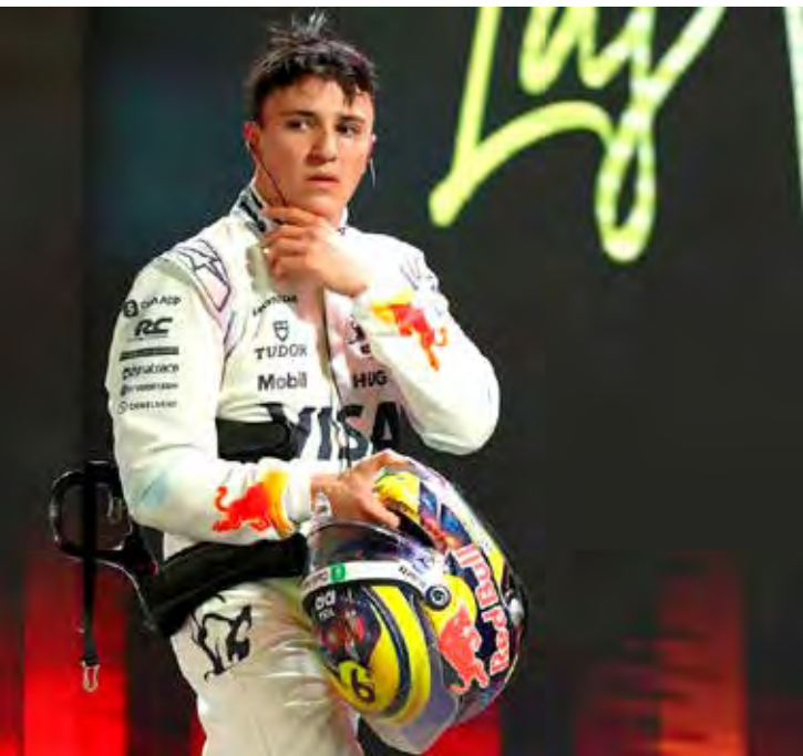
Isack Hadjar vai enfrentar o desafio de ser o piloto número 2 na RBR

ck está no começo de sua carreira e colocará tudo em risco se não se adaptar às necessidades de Verstappen.” O mexicano volta para a Fórmula 1 em 2026 na Cadillac.