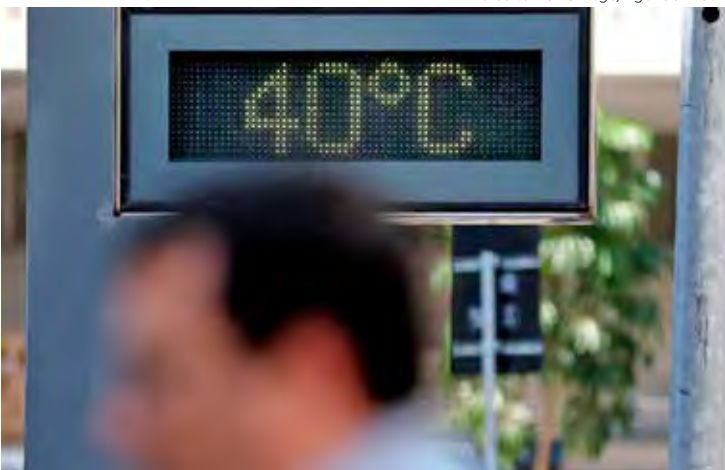
O calor que gera uma desidratação natural das células e aumenta a possibilidade de coagulação do sangue

O neurocirurgião lembrou que o tabagismo também colabora para isso. “O tabagismo hoje é uma das maiores causas externas para AVC”. O fumo contribui para a