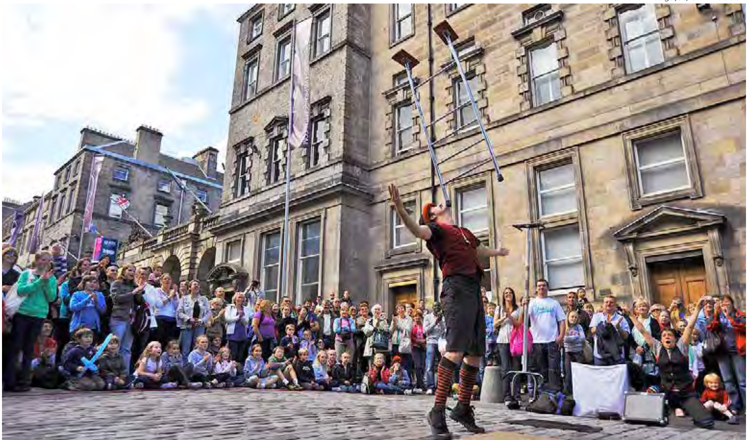
Festival Fringe de Edimburgo é um dos maiores eventos sobre arte e cultura do mundo, na Escócia

companhias, da capital e do interior, com diferentes linguagens artísticas: Cênica, com teatro musical; Cia de Dança de São José dos Campos, com dança contemporânea; Fundo Falso, com números de mágica; La Troupe, com teatro e experiência gastronômica; Parlapatões, com palhaçaria; e Teatro Cego,