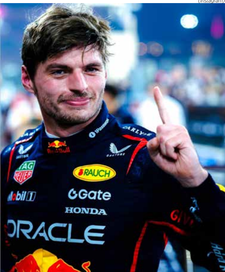
Para Verstappen, ideal é ser o piloto número um, sem a pressão de outro colega de equipe que possa disputar diretamente os mesmos objetivos

Max Verstappen afirmou que a presença de um forte companheiro de equipe na Red Bull Racing teria complicado ainda mais sua disputa pelo título na temporada 2025 da Fórmula 1. Segundo o holandês, quando está sozinho, é possível adotar uma postura mais agressiva, o que ele considera ideal para sua estratégia de corrida. “Quando você está sozinho, pode atacar mais, ser muito mais agressivo. Eu sempre preferi isso”, afirmou Verstappen em entrevista ao Viaplay. Para ele, a situação ideal é ser o piloto número um da equipe, sem a pressão de outro colega de equipe que possa disputar diretamente os mesmos objetivos. Ele ainda fez uma análise sobre a rivalidade interna na McLaren, mencionando que o fato de a equipe ter dois pilotos fortes, Lando Norris e Oscar Piastri, acabou prejudicando sua luta pelo título. De acordo com Verstappen, a estratégia da equipe britânica acabou desfavorecendo o time