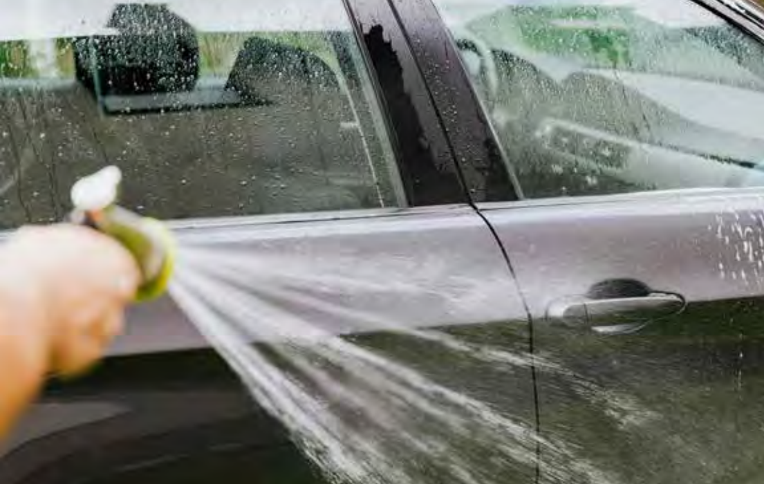
A população deve evitar lavar carros e calçadas e abastecer piscinas