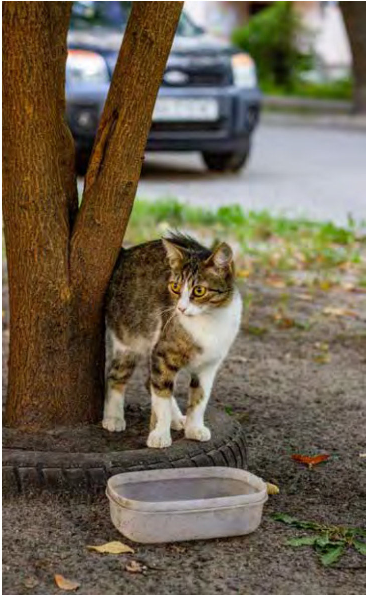
Gatos também integram a população de animais abandonados

O conselho destaca a importância da orientação de tutores e de serviços em busca de melhores condições para o bem-estar animal. Uma das questões fundamentais é a conscientização da necessidade de planejamento e adequação de rotinas. É comum os animais domésticos viverem mais de 10 anos, e seu cuidado em períodos excepcionais, como as férias, é importante para seu desenvolvimento e conforto. Além das necessidades fisiológicas, o bem estar emocional, como a sensação de ausência de cuidadores, também é destacado pelo conselho. Uma solução, aponta, é acostumar os animais com outras pessoas ou lugares de referência, para que a ausência dos tutores seja menos sentida. “Muitos casos de abandono poderiam ser evitados se, antes da adoção, as pesso-