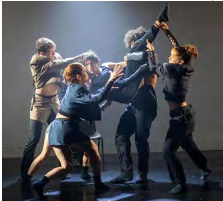
Cia de Dança de São José dos Campos apresentando a coreografia "Voyeur" no Dance Base, na edição de 2025 do Fringe

com teatro imersivo realizado totalmente no escuro.