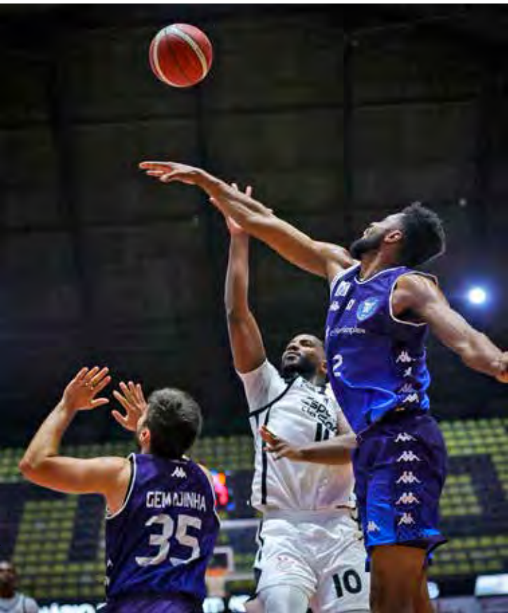
Conta Simples Rio Claro enfrenta o Sesi-Franca nesta segunda-feira, no Pedrocão, em Franca, pela fase regular do NBB

O jogo desta segunda-feira marca o último compromisso da equipe em 2025, antes da pausa no calendário, e representa mais um teste de competitividade para o elenco rio-clarense na sequência da temporada.