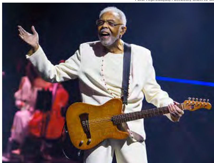
Gilberto Gil será uma das atrações do réveillon na Praia de Copacabana

Ao todo, serão mais de 70 atrações espalhadas em 13 palcos pela cidade. A queima de fogos terá 12 minutos de duração e os fogos serão lançados a partir de 19 balsas no mar de Copacabana. Nos anos anteriores, eram 10 balsas.