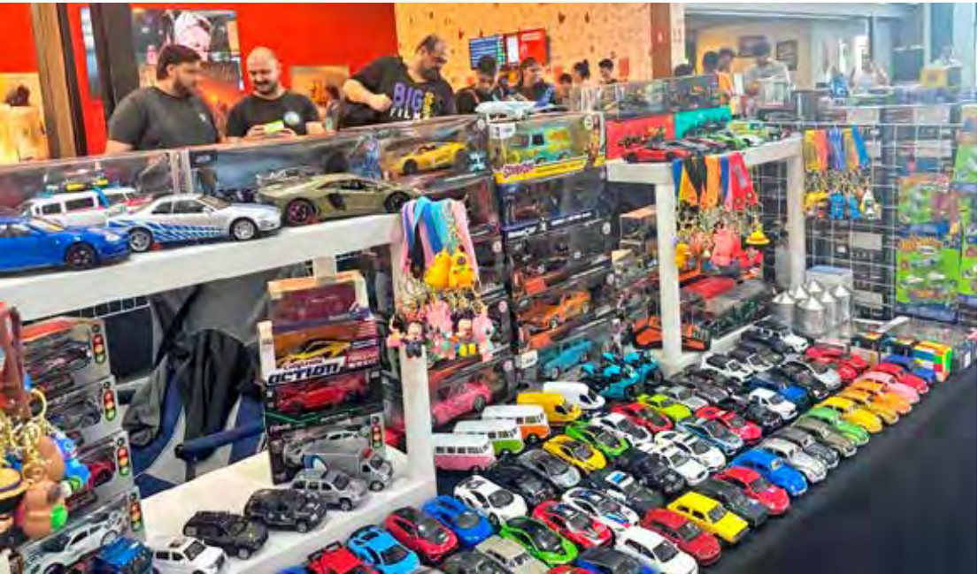
Os visitantes poderão conhecer modelos clássicos em miniatura e fazer compras

Neste domingo (28), o Shopping Rio Claro realiza, em parceria com a Hernani Conexão Diecast & Multicoleccionismo, com apoio da Multitoys, Livreet e The King of Boxes, o segundo dia do Encontro de Multicoleccionismo e Veículos em Miniaturas. O evento acontece em frente à loja Di Gaspi, das 11h às 20h. Os visitantes terão a oportunidade de conhecer modelos clássicos em miniatura, interagir com expositores e adquirir itens para suas coleções raras, veículos em miniatura, plastimodelismo, action figures, cards e muito mais. O objetivo do evento é divulgar o hobby do colecionismo de miniaturas, que há décadas marcam gerações, e comercializar peças para aumentar a coleção daqueles que já mantêm coleções. Durante o encontro, o público aprenderá mais sobre a história e as características técnicas de cada miniatura. “Colecionar é uma jornada pes-