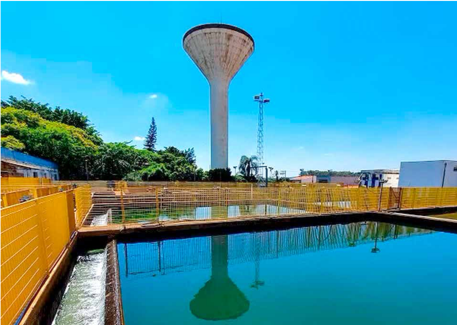
Estação de tratamento de água localizada no bairro Cidade Nova em Rio Claro

Em Rio Claro, os resultados refletem avanços importantes, mas também expõem um histórico de desafios. Desde 2007, o serviço de esgoto é operado pela iniciativa privada, por meio de uma parceria público-privada com a BRK. À época da concessão, menos de 30% do esgoto era tratado, com previsão de investimentos de R$ 140 milhões