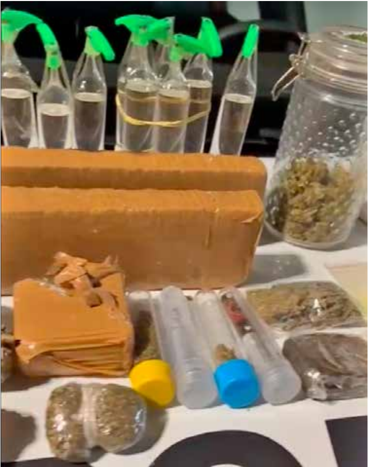
Drogas, dinheiro e materiais apreendidos pela Polícia Militar durante ação contra o tráfico no bairro Chácara Lusa