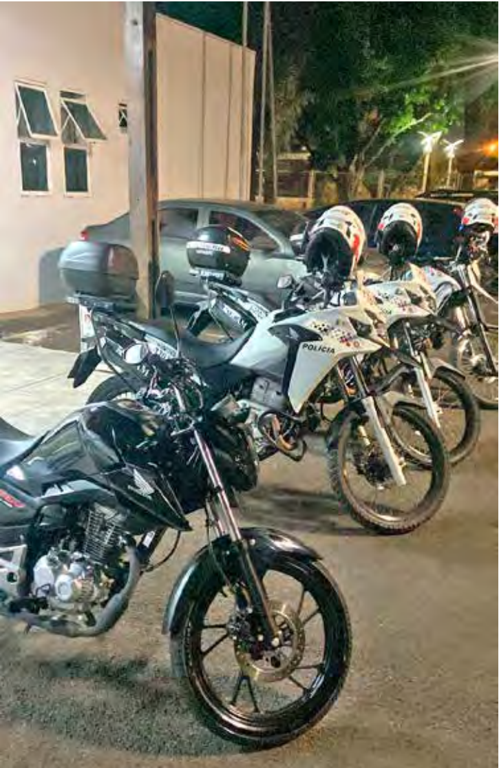
Motocicleta apreendida pela Polícia Militar durante ação da ROCAM com apoio da Força Tática no bairro Parque Universitário

A ocorrência foi apresentada à autoridade policial, que ratificou a prisão em flagrante pelo crime de adulteração de sinal identificador de veículo automotor. O envolvido permaneceu à disposição da Justiça, e a motocicleta foi apreendida e encaminhada à Polícia Civil para as providências cabíveis.