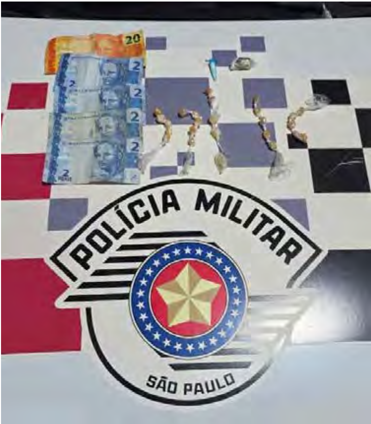
Mulheres foram presas em flagrante em ponto conhecido pelo tráfico no bairro São Miguel, em Rio Claro

As equipes policiais tiveram acesso às imagens de câmeras de monitoramento instaladas na via, que reforçaram o vínculo entre as