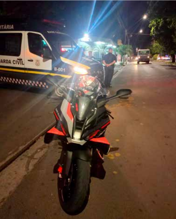
Equipes da Guarda Civil Municipal de Rio Claro intensificaram o patrulhamento e as fiscalizações durante as festas de fim de ano, garantindo mais segurança à população.

As ações também resultaram no recolhimento de 24 veículos, em operações de trânsito realizadas em pontos estratégicos da cidade, com foco na prevenção de acidentes e no combate a irregularidades. A presença visível das equipes em locais de