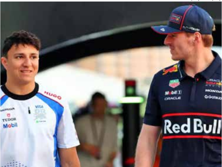
Isack Hadjar será o mais novo piloto a correr ao lado de Max Verstappen na Red Bull

“O segredo é ser incrivelmente rápido, bom fora do carro e trabalhar bem em equipe”, disse Hadjar. Questionado se está levando em consideração o histórico dos companheiros de equipe de Verstappen, Hadjar sentenciou: “Sim, estou. É por isso que adoto essa abordagem.” “Essa é a única maneira de chegar lá. Não se trata de uma abordagem puramente mental. Você precisa realizar o trabalho também na pista”, completou. Ele afirmou ainda que já considera sua relação com Verstappen saudável, tendo buscado conselhos do piloto de 28 anos em diversas ocasiões no ano passado.