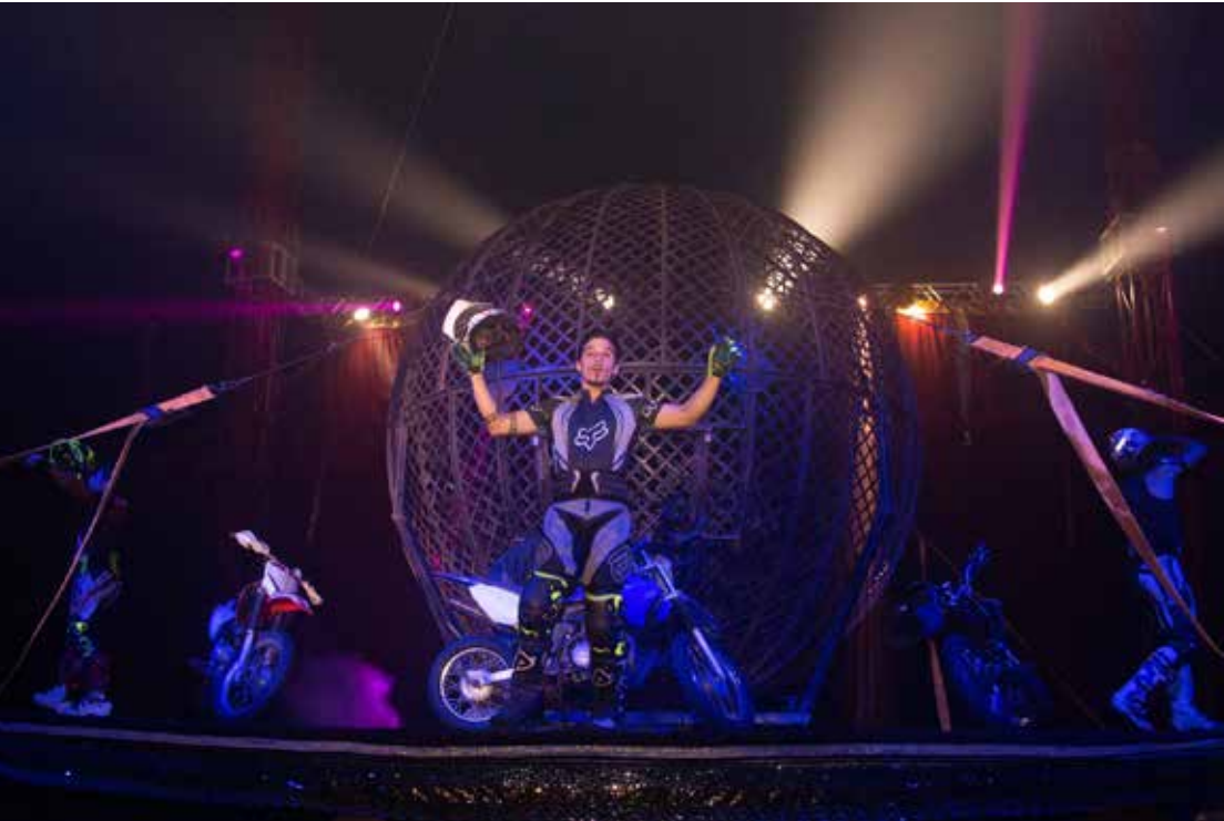
O Globo da Morte é uma das atrações imperdíveis do American Circus

Para marcar a chegada à cidade, o circo oferece ingressos promocionais antecipados por R$ 19,99 nas cadeiras laterais, válidos exclusivamente para compras online até as 17h do dia da estreia. As vendas podem ser feitas pelo site americancircus.com.br .