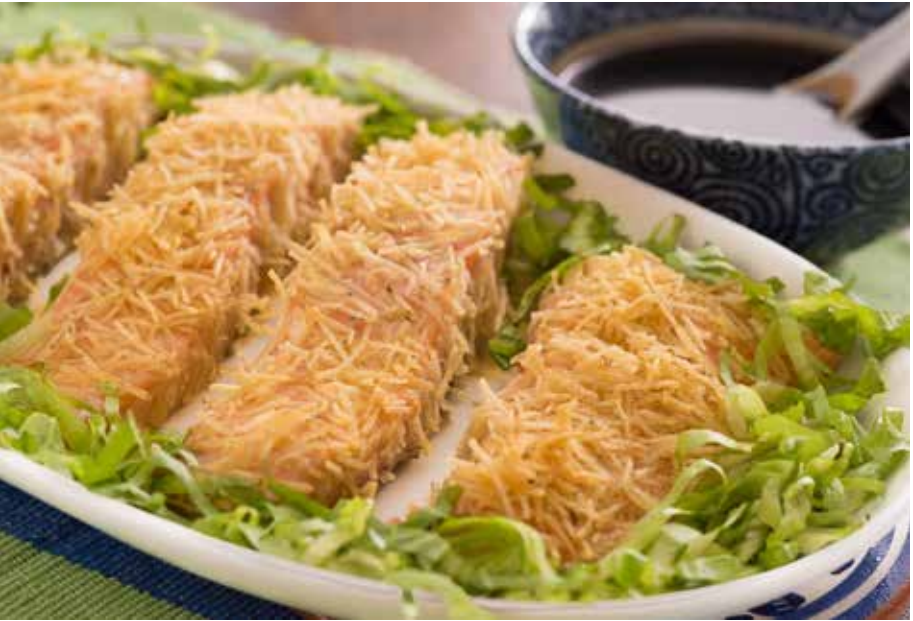
Salmão em crosta de batata palha