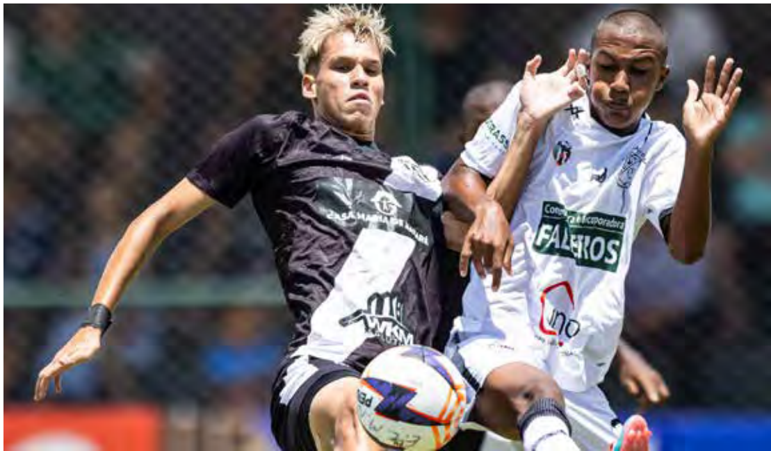
Com jogos espalhados ao longo de todo o dia, a sexta-feira promete fortes emoções e definição importante na classificação dos grupos da Copinha 2026.

No início da noite, às 18h45, acontecem dois confrontos: Oeste-SP x Maricá-RJ e Guarani-SP x Naviraiense-MS, ambos no YouTube “Paulistão”. Às 19h, o Grêmio Prudente-SP enfrenta