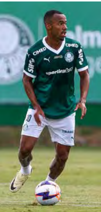
Jogadores do Palmeiras durante jogo-treino contra o Desportivo Brasil, na manhã desta quarta-feira, na Academia de Futebol.

A estreia oficial do Palmeiras em 2026 acontece já neste sábado,