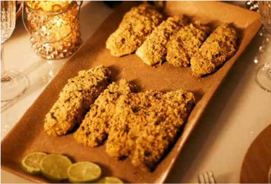
Peixe assado com crosta de farofa crocante

Para mais informações, novidades da marca e receitas, é só acompanhar o perfil @yoki.brasil no Instagram ou no próprio site da marca.