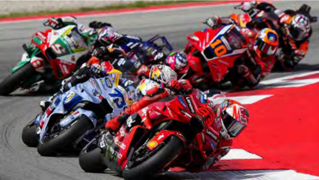
MotoGP de volta ao país e com brasileiro no grid pela primeira vez

A MotoGP anunciou nesta quinta-feira (8) um acordo com a Band para a transmissão do GP do Brasil em TV aberta em 2026. A exibição da temporada completa continua sendo feita pela ESPN. Por se tratar de um evento no Brasil, a Dorna Sports (empresa espanhola que detém os direitos comerciais e televisivos exclusivos de todas as categorias de motovelocidade) tinha direito contratual de buscar um canal em TV aberta para transmitir a prova. O contrato de exclusividade com o canal do grupo Disney, portanto, segue inalterado. A MotoGP retorna ao Brasil em 2026 pela primeira vez desde 2004. A prova vai acontecer no circuito de Goiânia, que está em obras, após atrasos resultantes de adequações solicitadas em vistorias realizadas