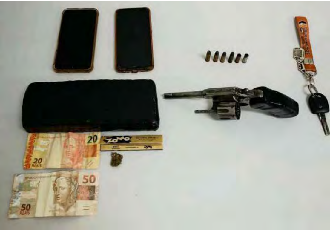
Arma de fogo, drogas e munições apreendidas durante a ação do BAEP no bairro Inocoop, em Rio Claro

identificados como condutor e passageiro. Em revista pessoal, nada de ilícito foi localizado. No entanto, durante a entrevista, eles afirmaram ser moradores de Santa Gertrudes e que haviam ido até Rio Claro para comprar drogas. A equipe também constatou que ambos possuíam antecedentes por tráfico de entorpecentes.