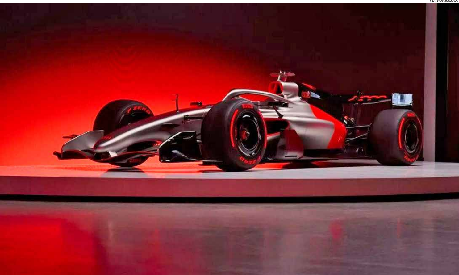
Equipe de Gabriel Bortoleto deve ser a primeira a colocar o carro novo na pista, já nesta sexta-feira

contará com os pneus especiais oferecidos pela Pirelli. A Audi fará seu lançamento global do novo carro em Berlim no dia 20, quando irá revelar a pintura oficial. Na sequência, retorna para a cidade espanhola, onde terá um teste privado de pré-temporada no Circuito de Barcelona, entre os dias 26 e 30 de janeiro, dando continuidade à preparação para sua aguardada estreia na Fórmula 1. Uniformes A equipe está exibindo cada vez mais como será seu ano de estreia na Fórmula 1. Neste sentido ela também mostrou, através das redes sociais, como será o uniforme que membros e pilotos usarão ao longo do campeonato. Com patrocínio da Adidas, trouxe algumas breves imagens do casaco, colete e camisa polo.