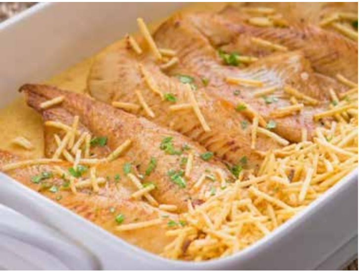
Filé de merluza ao creme de grão de bico