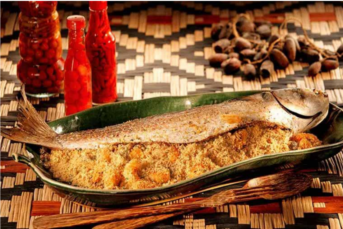
Tainha recheada com farofa de camarão

farofa tradicional Yoki e as azeitonas, tempere com o sal e cozinhe até os ingredientes ficarem bem envolvidos. Tire do fogo. Pré-aqueça o forno em temperatura média (180°C). Numa assadeira grande, coloque o peixe. Antes de rechear, distribua no seu interior, todo o tempero que ficou na assadeira. Recheie o peixe com a farofa. Feche o peixe espetando na pele palitos de dente para unir as duas extremidades. Coloque os palitos paralelos a uma distância de 2cm para que o recheio não saia. Acrescente metade da água na assadeira e leve ao forno. Asse por cerca de 50 minutos ou até o peixe ficar cozido e ainda úmido (na metade do cozimento acrescente o restante da água). Dicas: para saber se o peixe assado está no ponto, basta enfiar um garfo, se a carne se separa com facilidade da espinha, ele já pode ser retirado do forno. Aproveite o molho que fica na assadeira e prepare uma farofa. Acrescente 1 xícara (chá) de água na assadeira. Leve ao fogo e cozinhe mexendo e raspando o fundo da assadeira até obter um molhinho. Acrescente meia xícara (chá) de farofa tradicional Yoki e meia colher (sopa) de coentro picado (2,5g).