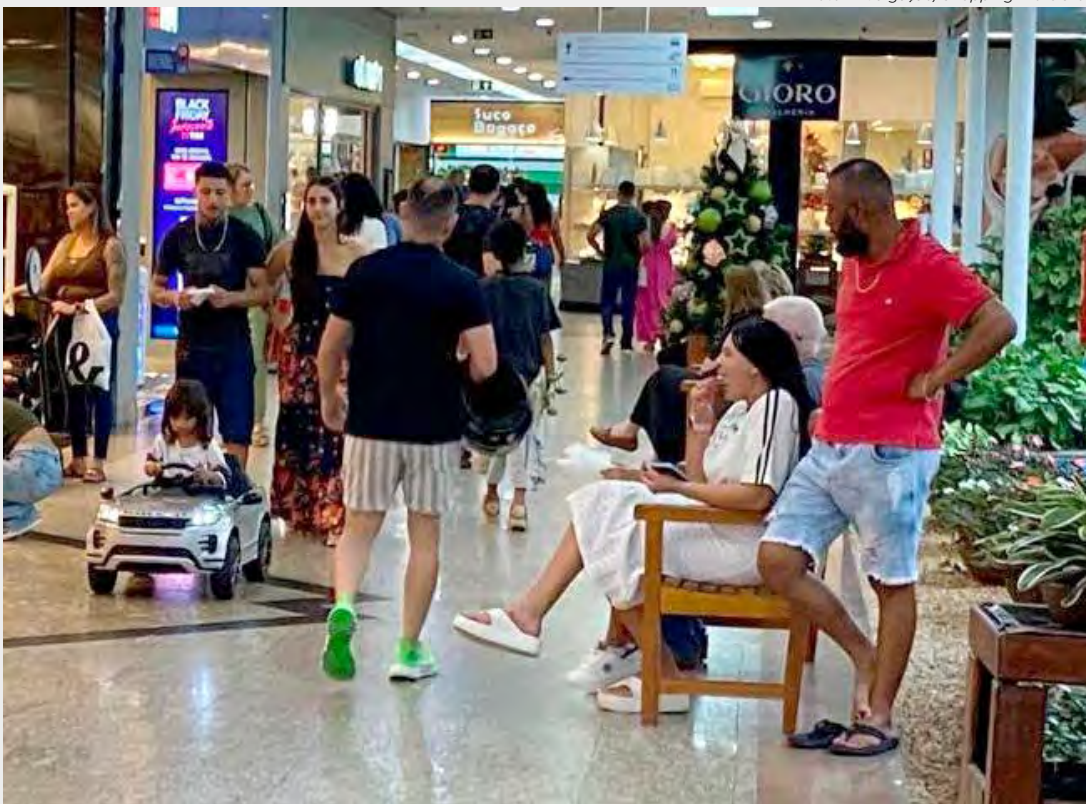
Consumidores circula pelo mal do Shopping Rio Claro que inicia hoje o saldão de Natal