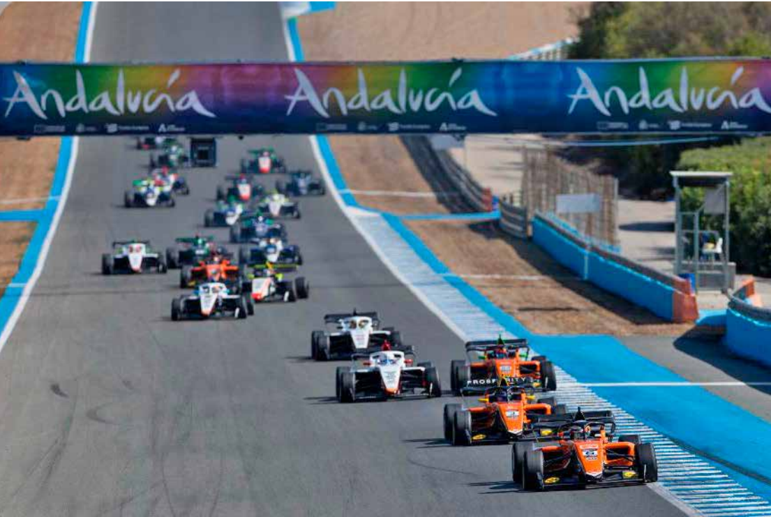
Eurocup-3 dá oportunidade para pilotos vindos da Fórmula 4 continuarem desenvolvendo suas carreiras alto nível na Europa

Campeonato principal O campeonato principal começará em maio, no circuito Paul Ricard, na França, com a estreia do novo carro (Dallara 326) e novos motores Toyota/TOM'S. O calendário inclui corridas em circuitos lendários como Spa-Francorchamps, Imola, Monza, Silverstone e Montmeló, além da realização das três rodadas iniciais em conjunto com a European Le Mans Series (ELMS).