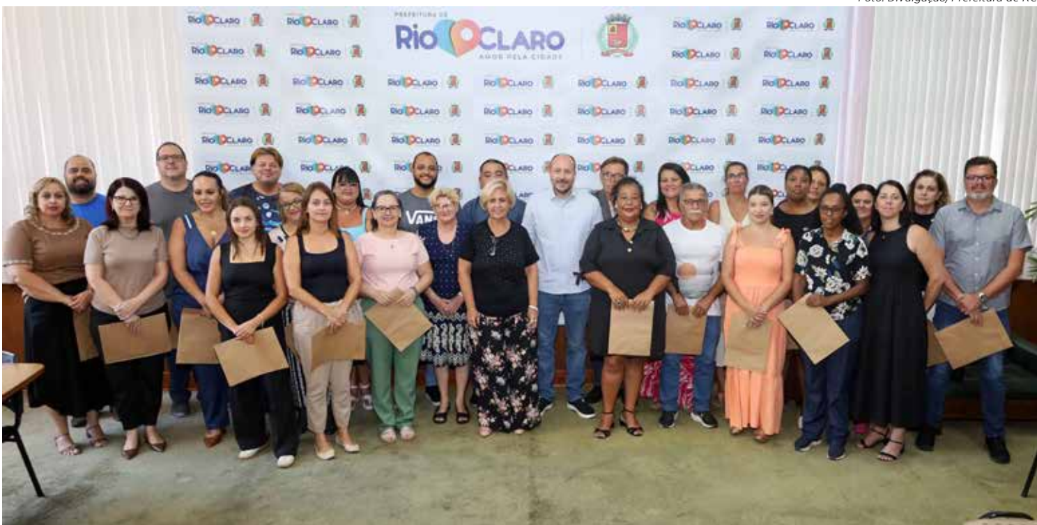
Os novos integrantes foram empossados nesta quinta-feira para o biênio 2026/2027