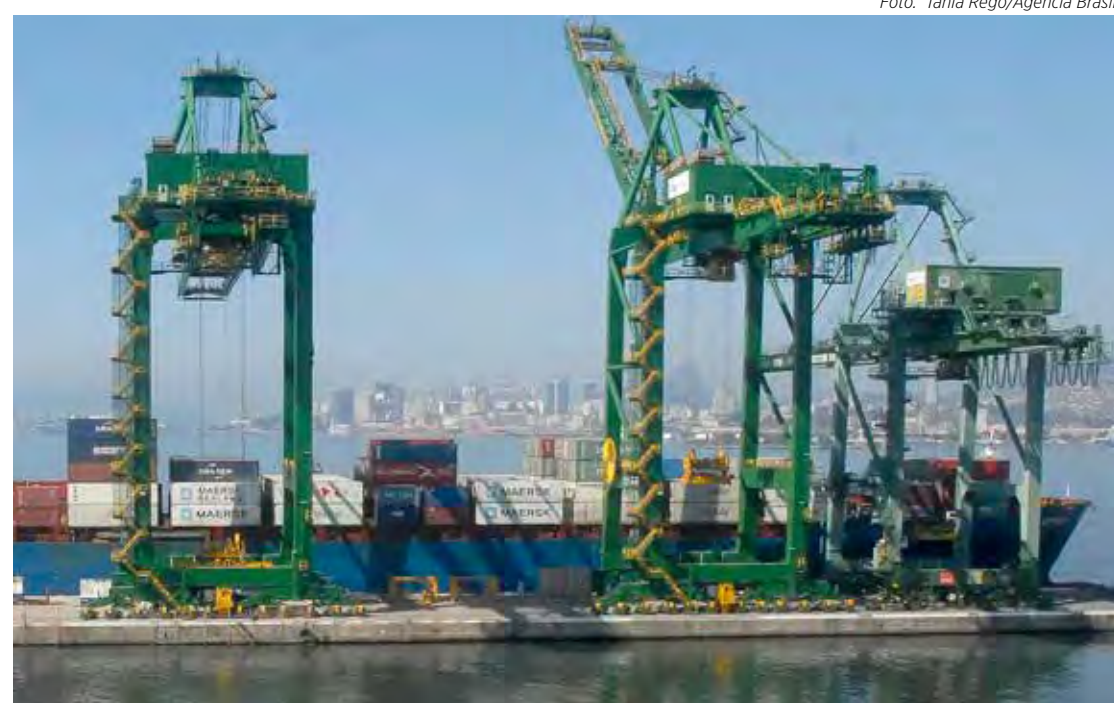
Acordo deve ampliar as exportações para países da União Europeia

“A aprovação do acordo é um passo decisivo e cria as condições políticas necessárias para avançarmos rumo à assinatura. Esperamos que esse processo seja concluído o quanto antes, para que possamos transformar esse avanço institucional em oportunidades concretas de co-