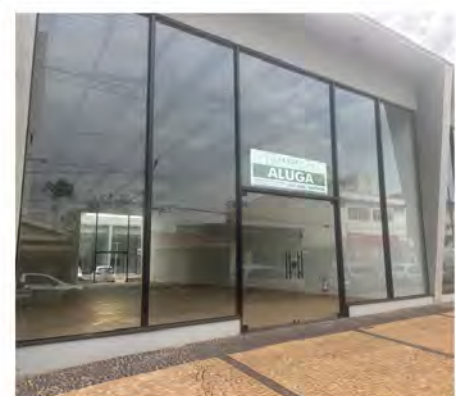
CÓDIGO: 9092 Salas comerciais com 218,00m2, 2 wc,s - Centro Rio Claro/SP Valor Locação: R$11.111,11