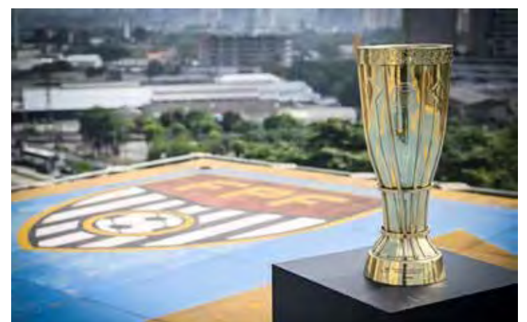
Bola rola neste fim de semana pela primeira rodada do Paulistão A2 Rivalo 2026, com jogos no sábado e domingo

Com clubes tradicionais na disputa, a expectativa é de um campeonato equilibrado, com briga intensa tanto pelo acesso quanto contra o rebaixamento.