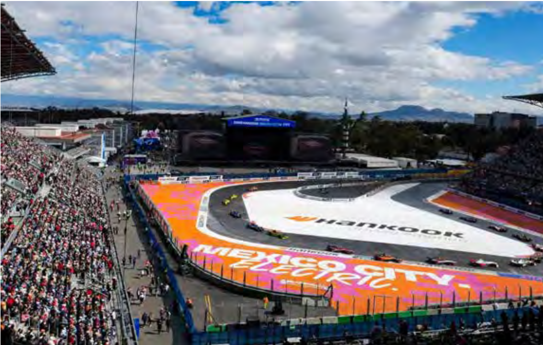
Categoria dos carros elétricos realiza segunda etapa da temporada neste sábado e comemora corrida nº 150

A temporada teve início em dezembro, com o ePrix de São