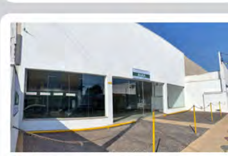
CÓDIGO: 6165 RUA 14- Salão com 600,00m², 2 wc's, cozinha, escritório e recuo para carros. Consolação- Rio Claro/SP - Valor Locação: R$17.777,77