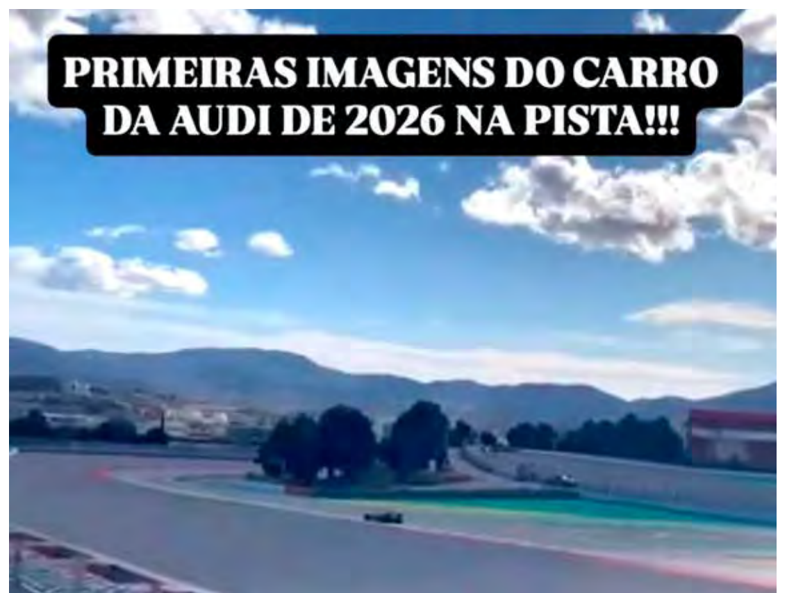
A Audi se tornou a primeira equipe de F1 a entrar na pista com seu carro de 2026