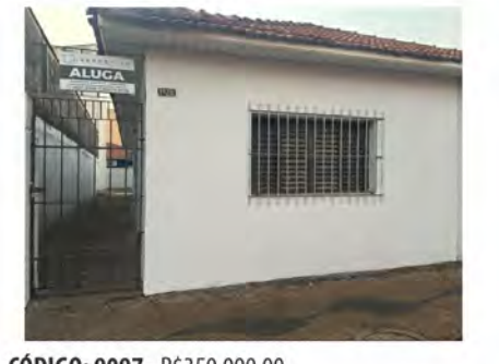
CÓDIGO: 9097 - R$350.000,00