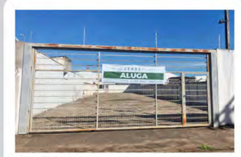
CÓDIGO 7042 Terreno com 749,00m² Consolação- Rio Claro/SP Valor Locação: R$3.111,11