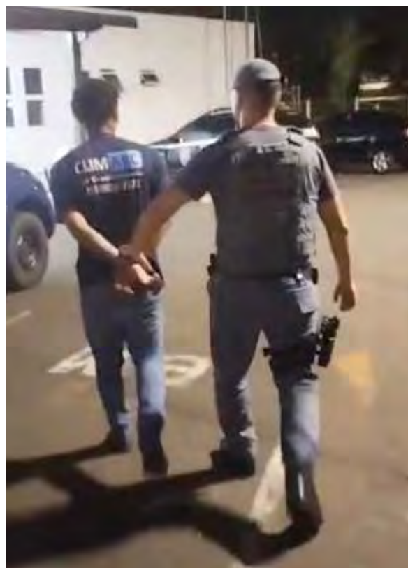
Policia Militar identifica suspeito de ação no bairro Jardim São Paulo, em Rio Claro

O suspeito foi ouvido pela autoridade policial e, após os procedimentos de praxe, acabou sendo liberado. O caso segue registrado para as providências cabíveis.