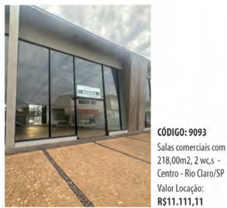
CÓDIGO: 9093 Salas comerciais com 218,00m2, 2 wc,s - Centro - Rio Claro/SP Valor Locação: R$11.111,11