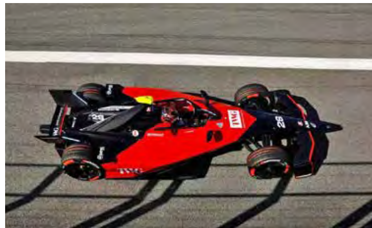
Já no México, na Formula E, Felipe Drugovich luta por outra atuação de destaque