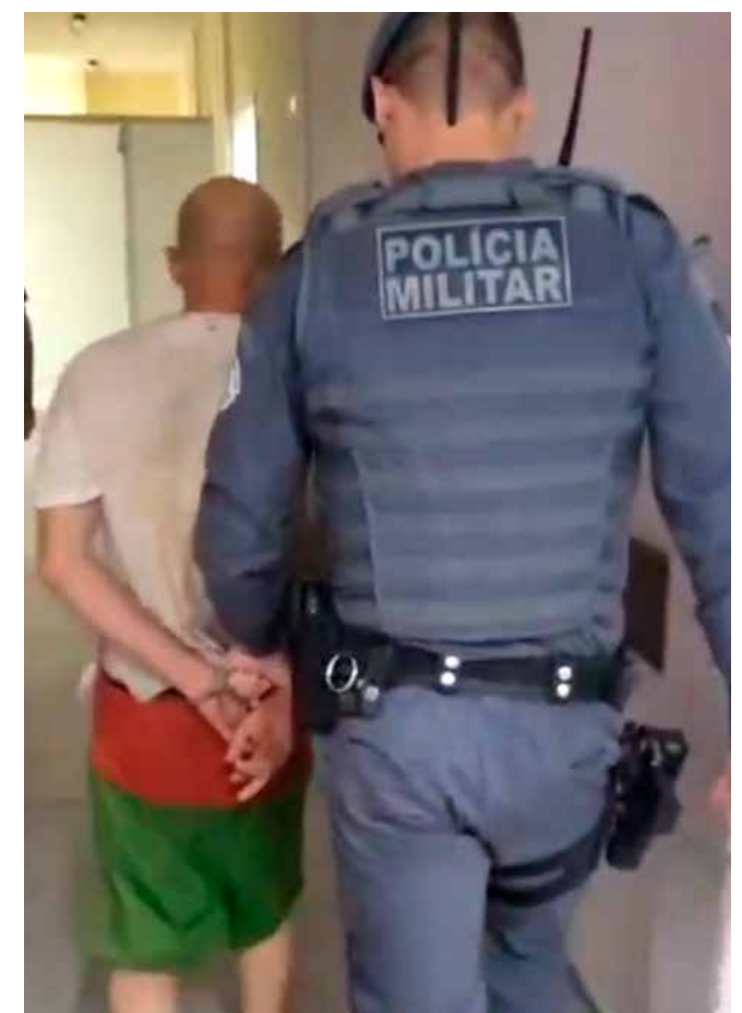
Ação integrada do 37º BPM/I e do 10º BAEP resultou na localização e detenção dos foragidos na madrugada desta quinta-feira (8)

Após as capturas, os dois indivíduos foram encaminhados para atendimento médico de praxe e, posteriormente, reconduzidos ao estabelecimento prisional de origem, onde permaneceram à disposição da Justiça. MI e do 10º BAEP recapturaram evadidos do sistema prisional na região da Rodovia Washington Luís.