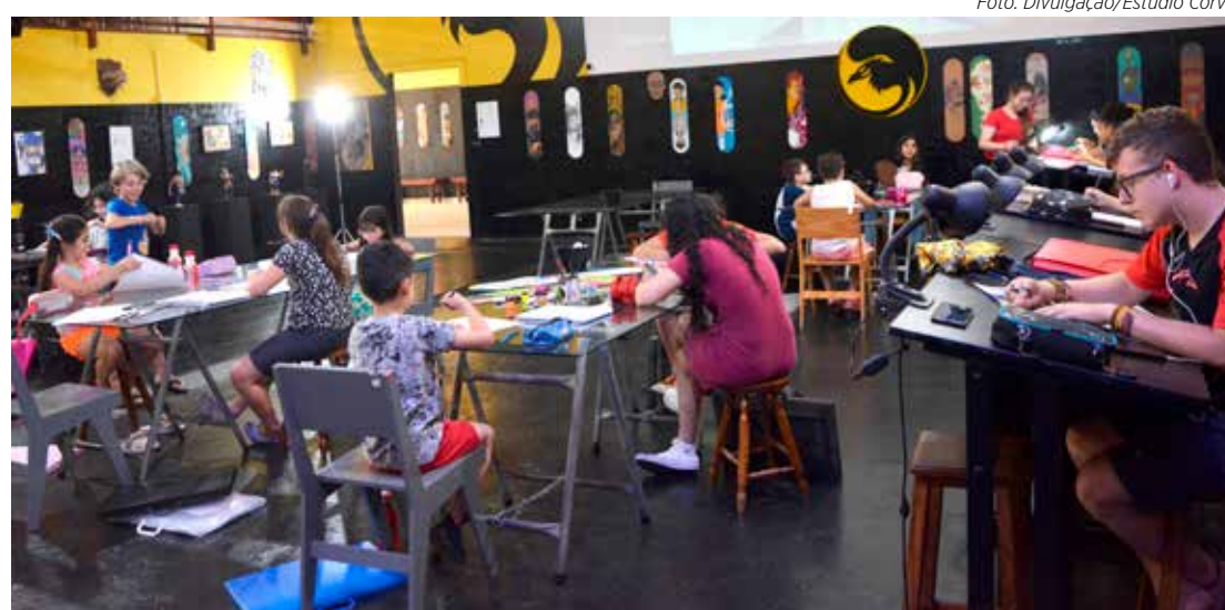
Atividades gratuitas acontecem durante todo o mês de janeiro