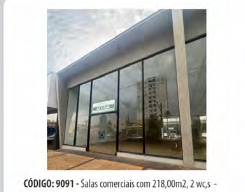
CÓDIGO: 9091 - Salas comerciais com 218,00m2, 2 wc,s - Centro - Rio Claro/SP - Valor Locação: R$11.111,11

AV. 5, 575 RIO CLARO www.verdeplanempreendimentos.com.br