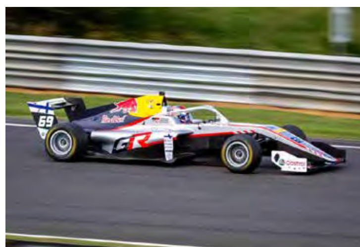
Enquanto isso na Nova Zelândia estreia Kalle Rovanpää, Campeão de Rally que mudou para os Formula Regional