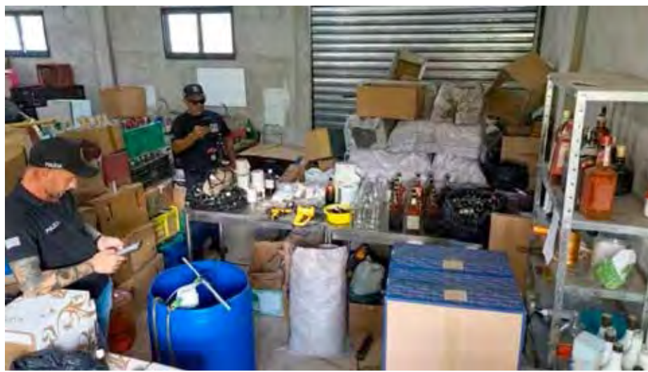
Policia Civil localizou segundo depósito clandestino com grande quantidade de bebidas adulteradas e materiais usados na falsificação, em Ajapi