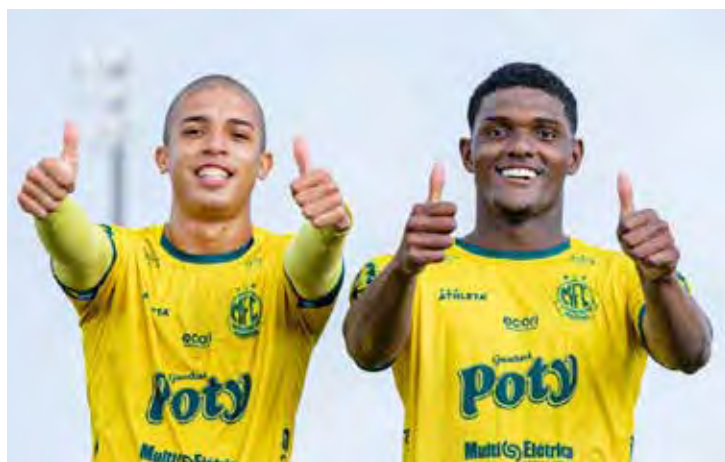
Com vagas em disputa e jogos simultâneos, a rodada final promete emoção até o último minuto, definindo os 64 clubes classificados para a fase eliminatória da Copinha 2026

A rodada decisiva começa logo cedo. Às 8h45, o Real Brasília-DF enfrenta o União Cacoalense-RO, enquanto, no mesmo horário, a Portuguesa Santista encara o CSE-AL. Mais tarde, às 11h, a São-Carlense recebe o Santos, em duelo de tradição, e o Nacional-SP enfrenta o Internacional-RS.