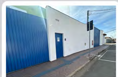
CÓDIGO Galpão com 988,00m2, banheiros, cozinha+ 748,00m2 de estacionamento Consolação - Rio Claro/SP Valor Locação : R$31.111,11