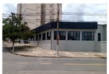
CÓDIGO: 7456 Loja com 1.318,20m² Taquaral- Campinas/ SP Valor Venda: R$5.000.000,00