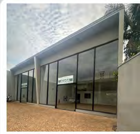
CÓDIGO: 9094 Salas comerciais com 95,00m2, copa e 2 wc,s Centro - Rio Claro/SP Valor Locação: R$6.666,66