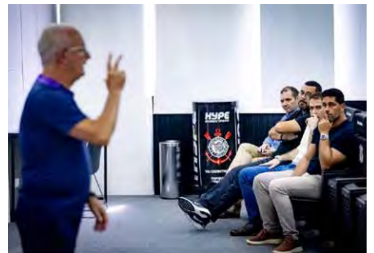
Dorival Júnior na apresentação para temporada 2026; técnico deve escalar força máxima já na estreia do Corinthians no Paulistão.

O Corinthians terá uma sequência pesada logo no início do estadual, enfrentando Red Bull Bragantino, São Paulo e Santos em apenas sete dias. Pouco depois, encara o Palmeiras, já em meio à disputa do Campeonato Brasileiro. A avaliação no clube é de que começar a temporada com um time alternativo seria um risco alto e poderia comprometer os objetivos esportivos logo nas primeiras rodadas.