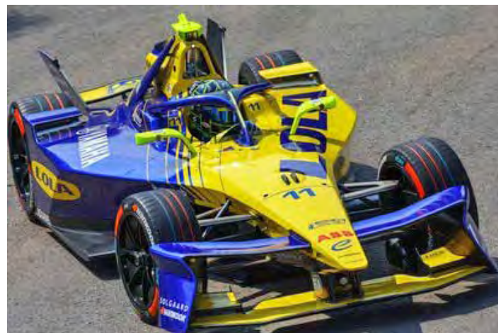
Ao lado de Lucas Di Grassi que busca melhor sorte do que teve em São Paulo