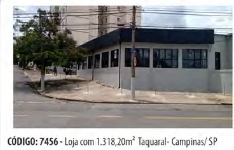
CÓDIGO: 7456 - Loja com 1.318,20m² Taquaral- Campinas/ SP Valor Locação: R$38.888,88