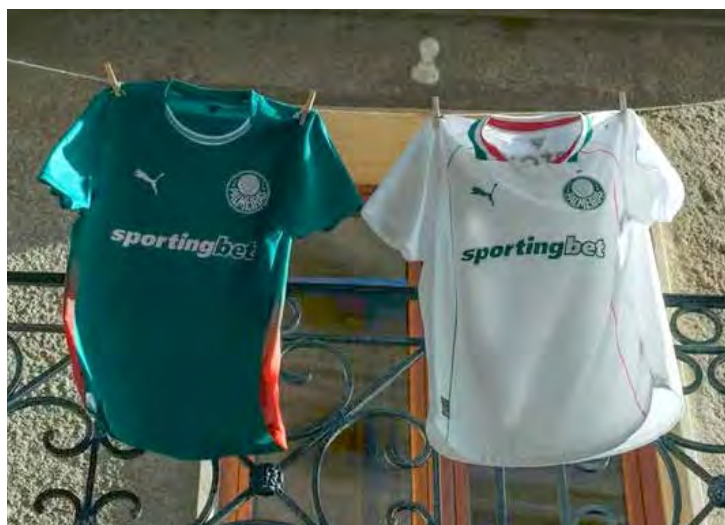
Novos uniformes do Palmeiras para a temporada 2026 foram lançados nesta sexta-feira e estreiam no duelo contra a Portuguesa, pelo Paulistão

Uma das principais novidades está na tecnologia utilizada na fabricação. Pela primeira vez desde o início da parceria com a Puma,