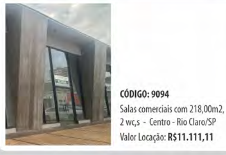
CÓDIGO: 9094 Salas comerciais com 218,00m2, 2 wc,s - Centro - Rio Claro/SP Valor Locação: R$11.111,11