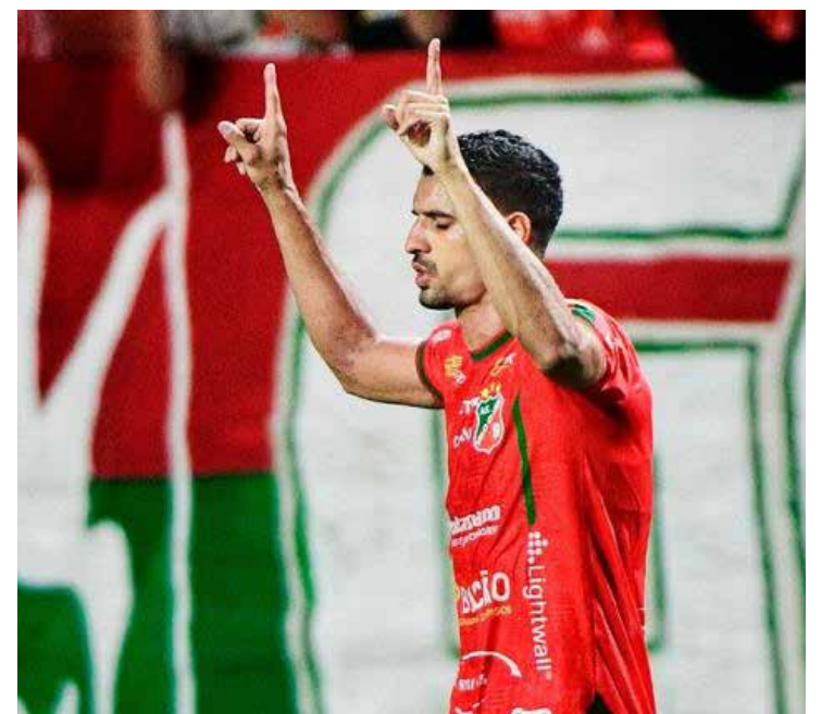
Velo Clube estreia no Paulistão 2026 neste domingo (11), diante do Botafogo-SP, no Benitão

Com calendário enxuto, jogos decisivos desde o início e clássicos preservados, o Paulistão 2026 promete ser uma das edições mais competitivas dos últimos anos.