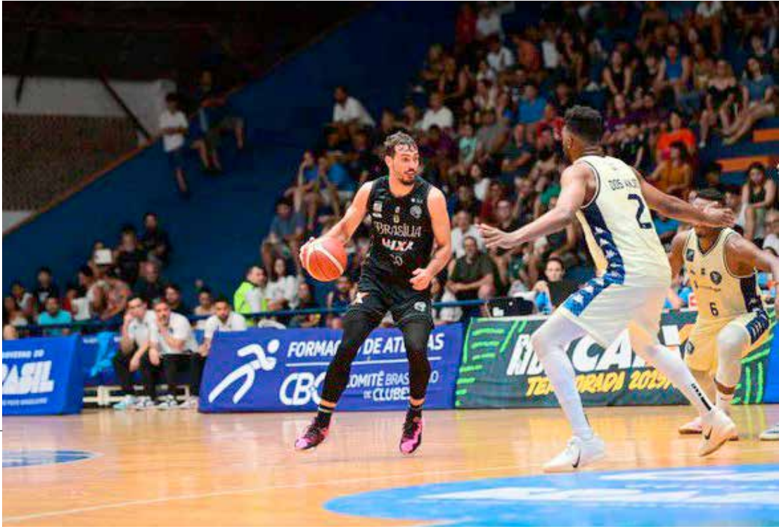
Rio Claro e Brasília se enfrentaram no Ginásio Felipe Karam, na abertura do retorno do NBB 2025/2026

Na próxima rodada, o Brasília recebe o Caxias nesta segunda-feira, às 20h15. O Rio Claro volta à quadra na terça-feira, quando enfrenta o Paulistano fora de casa, às 19h30.