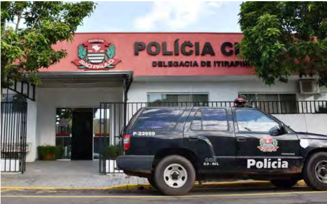
Viatura da Polícia Militar atendeu a ocorrência no bairro Campo do Imã, em Itirapina, onde homem foi preso por tentativa de feminicídio

Mesmo ferida, a vítima conseguiu apagar as chamas antes que o incêndio se alastrasse pelo imóvel, mas sofreu queimaduras,