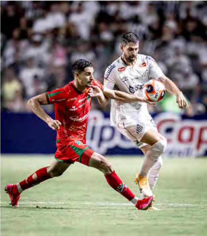
Velo Clube estreia no Campeonato Paulista neste domingo no Benitão diante do Botafogo de Ribeirão Preto