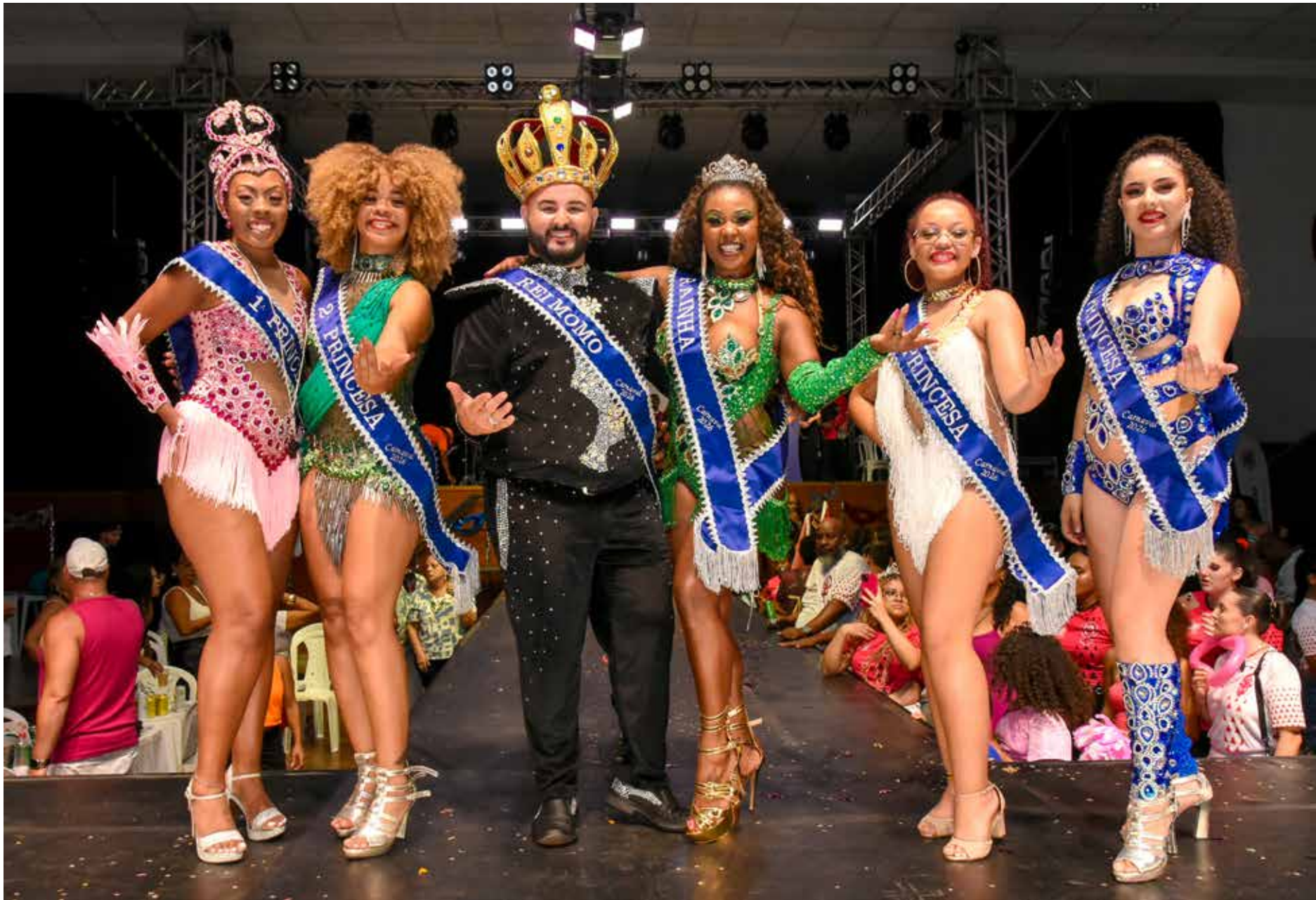
Corte momesca foi eleita na noite de sexta-feira, no Floridiana

Um grande público participou do concurso realizado no Floridiana Tênis Clube. “É uma demonstração do interesse da população pelos eventos carnavalescos”, afirma o secretário municipal de Turismo, Guilherme Pizzirani. “Certamente, as matinês no Jardim Público e os desfiles das escolas de samba também irão reunir milhares de pessoas”, ressalta Pizzirani.