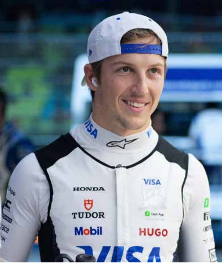
Apesar de garantirem vaga para temporada 2026, Lawson e Colapinto estarão sob intensa pressão

O risco de Colapinto ser substituído ainda está presente, mas uma mudança significativa pode ocorrer com a troca de motores da Alpine de Renault para Mercedes. Caso a montadora francesa consiga montar um