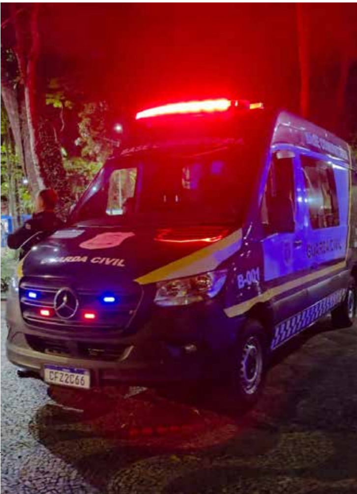
Ação da GCM ocorreu durante abordagem social na Praça da Avenida 52, no Jardim América

A Guarda Civil Municipal reforçou seu compromisso com o atendimento à população e destacou que está à disposição por meio dos canais 153 ou 0800 771 1532.