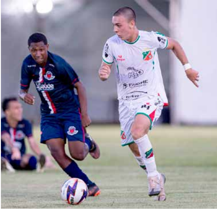
Velo Clube no empate com o Guanabara City, em Cravinhos, pela última rodada da fase de grupos da Copinha 2026.

A definição da segunda vaga do grupo ficou para o confronto