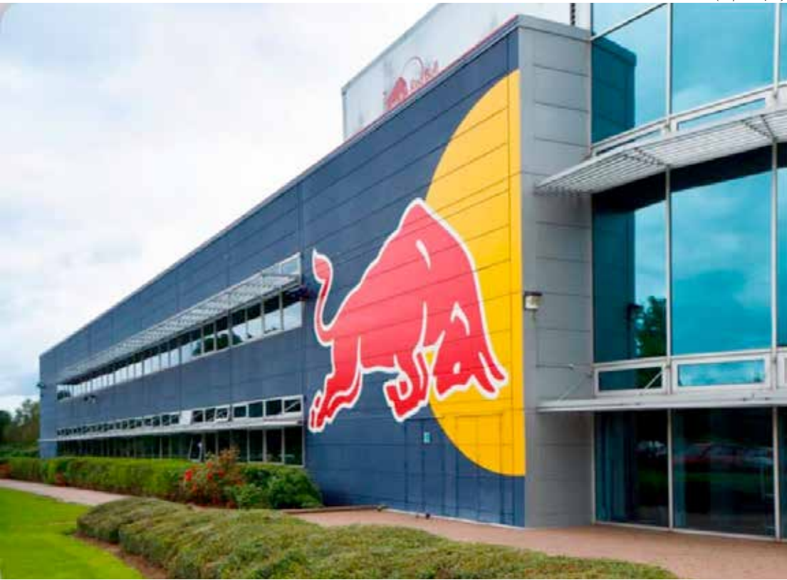
Escuderias já se preparam para realizar seus lançamento para a nova temporada, a começar pela Red Bull GmbH, proprietária das equipes Oracle Red Bull Racing e a Visa Cash App Racing Bulls

Vale lembrar que os lançamentos da Red Bull e da Racing Bulls, marcados para 15 de janeiro, fazem parte do evento de apresentação da temporada da Ford Motorsport.