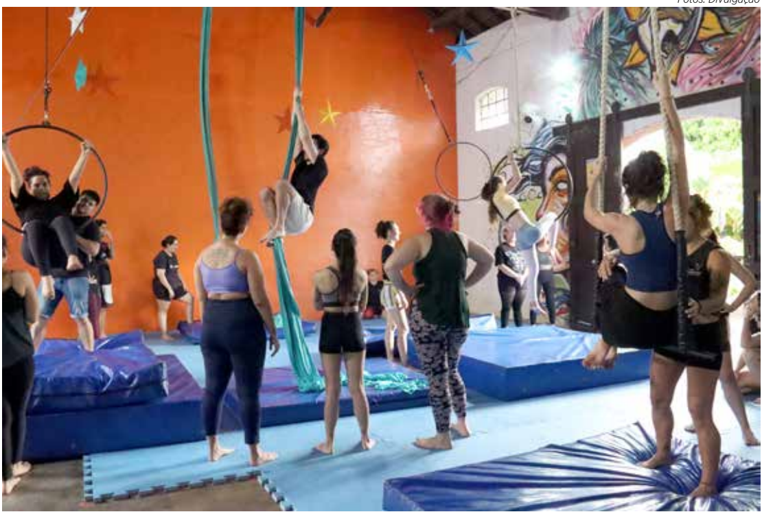
Candidatos podem concorrer a bolsas de estudo em artes circenses aéreas por meio do projeto “Circo Ancestral”

integrar os bolsistas à comunidade circense local e fortalecer a diversidade no setor.