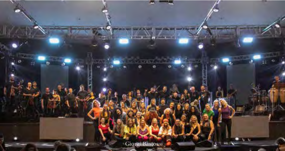
Temporada da OFRC terá o tradicional concerto “Mulheres que Cantam e Encantam”