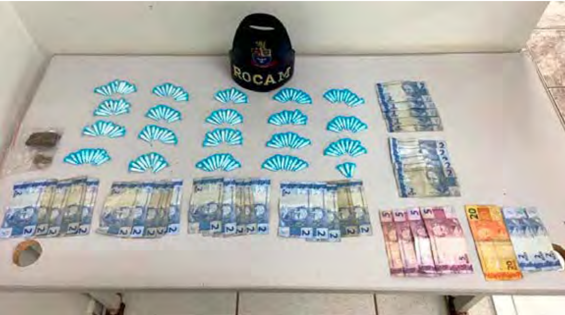
Ações da Força Tática do 37º BPM/I resultaram na captura de adolescente procurado e na apreensão de outro por tráfico em Rio Claro

Diante da constatação do ato infracional, os genitores foram acionados e, com apoio da Força Tática 013, o menor foi conduzido ao Plantão Policial juntamente com os entorpecentes e o dinheiro apreendidos. Após os procedimentos de praxe, o adolescente foi ouvido e liberado à sua genitora. As duas ocorrências foram registradas e seguem sob acompanhamento das autoridades competentes.