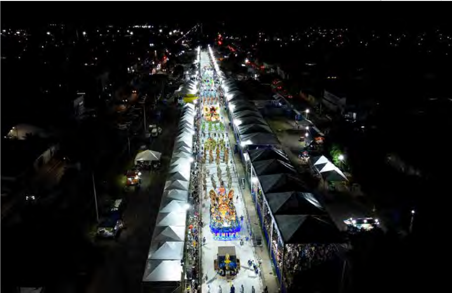
Os desfiles das escolas de samba de Rio Claro também poderão ser assistidos gratuitamente em espaço com 5.000 lugares

ba no carnaval 2026, que serão realizados dos dias 14, 15 e 17 de fevereiro, foi iniciada nesta semana. Os ingressos podem ser comprados no Mercado Municipal, na Rua 8 com a Avenida Visconde, ou na Casa Amarela, localizada na Avenida 5 com Rua 1. O pagamento deve ser feito exclusivamente em dinheiro. Os preços dos ingressos variam de acordo com os setores, podendo ser de arquibancadas, camarotes ou frisas. No Mercado, as vendas são realizadas às terças e quartas-feiras das 10h às 14h; às quintas e sextas-feiras das 10h às 14h e das 18h às 21h; e aos sábados, das 9h às 16h. Na Casa Amarela as vendas são de segunda a sexta-feira das 9h às 19h e aos sábados das 9h às 13h. “Colocamos várias opções de horários para facilitar o acesso da população aos ingressos”, afirma o secretário municipal de Turismo, Guilherme Pizzirani. Os ingressos de arquibancadas nos setores Azul,