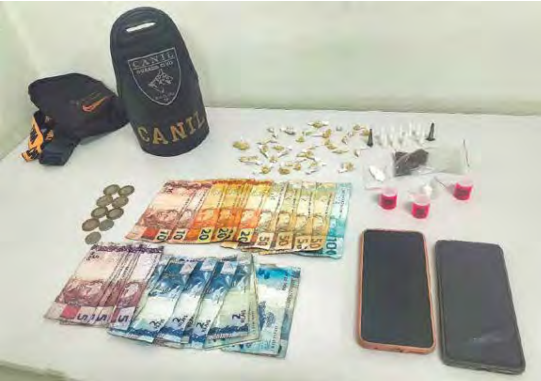
Drogas e dinheiro apreendidos pela ROMU-Canil durante a abordagem no Jardim Nova Rio Claro

A Guarda Civil Municipal reforçou seu compromisso com a segurança pública, destacando que a presença ostensiva nas ruas contribui para inibir a criminalidade e fortalecer a aproximação com a comunidade. A corporação segue disponível para atendimento pelos canais 153 ou 0800 771 1532.