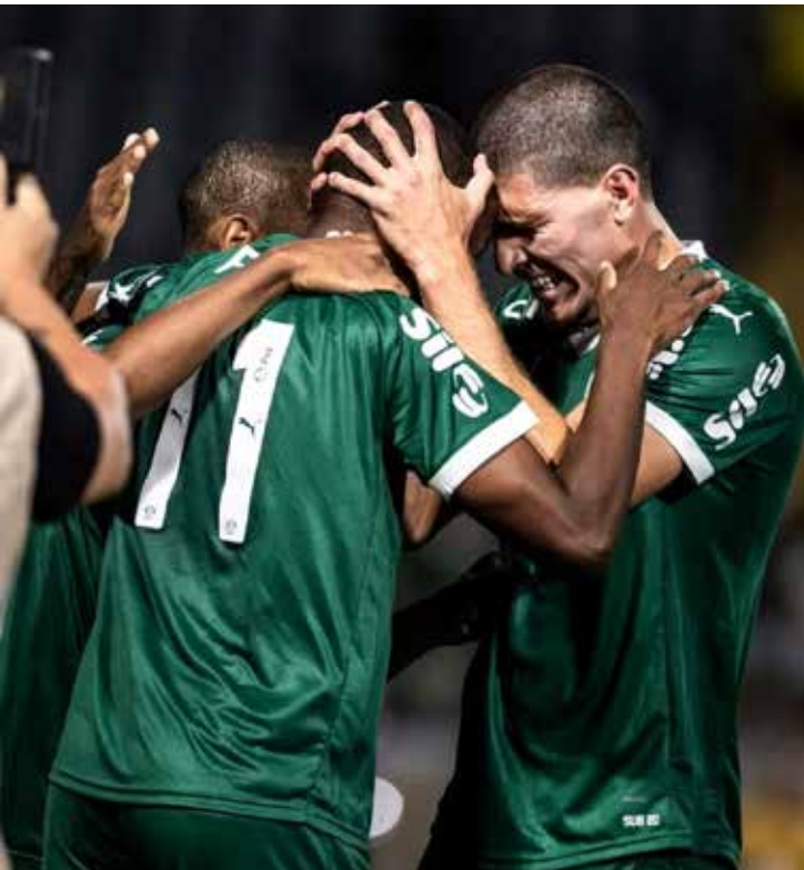
A expectativa é de confrontos equilibrados, já que a Copinha entra em seu momento mais decisivo rumo à grande final

Nesta quinta-feira (15), os jogos serão: Às 11h, em Itaquaquecetuba, Fortaleza x Itaquaquecetuba (XSports) e, em São Paulo, no estádio do Nacional, Internacional x Nacional-SP (YouTube / CazéTV). Às 14h30, em Cosmópolis, Red Bull Bragantino x Canaã-DF (XSports). Às 15h, em Barueri, Pal-