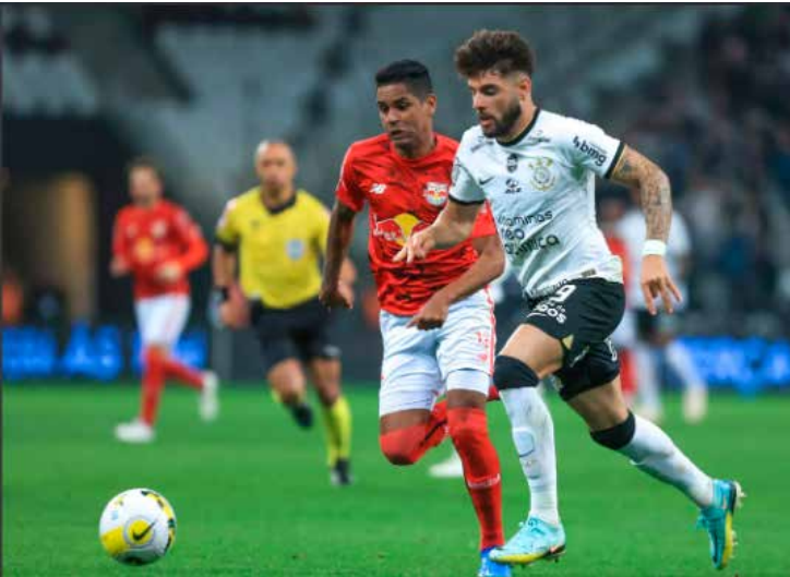
Corinthians enfrenta o RB Bragantino no Nabizão buscando manter a invencibilidade no Paulistão 2026

Hugo Souza; Matheuzinho, André Ramalho, Gustavo Henrique, Matheus Bidu; Charles, André (Raniele), Carrillo, Breno Bidon; Vitinho, Gui Negão (Yuri Alberto).