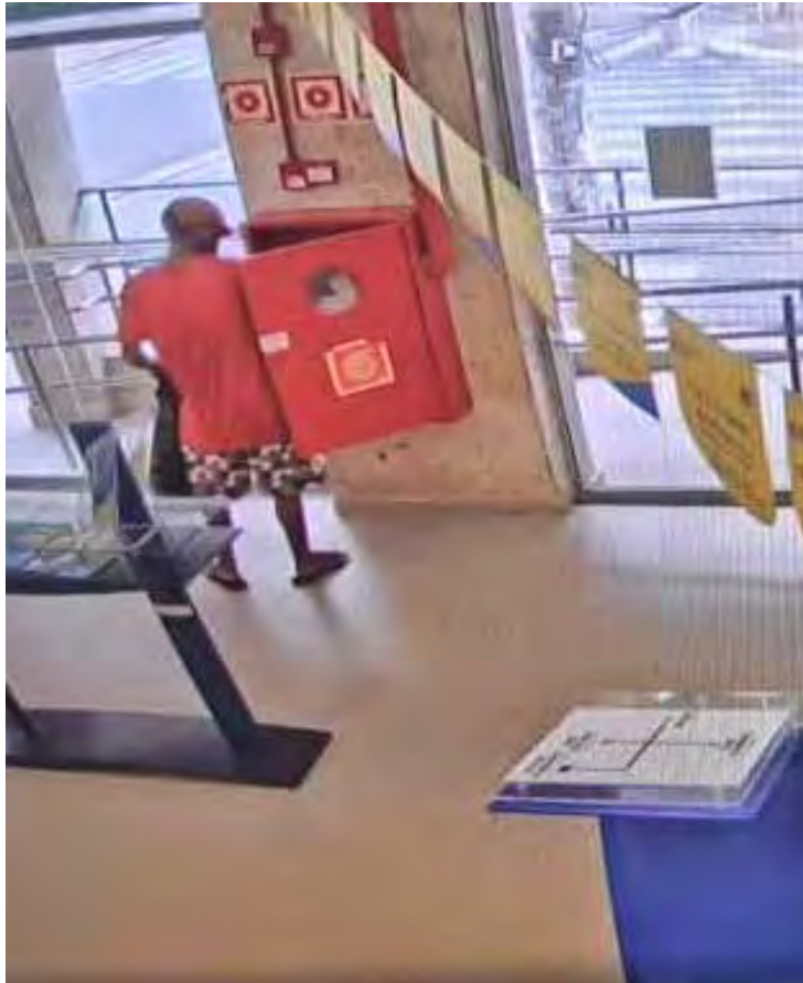
Imagens do crime de furto ocorrido na área central de Rio Claro em uma agência bancária

Com base no trabalho investigativo e na análise de informações, os policiais conseguiram identificar o autor do furto. A identidade do suspeito foi preservada por questões legais. Ao final das