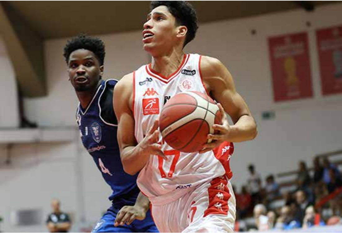
Partida entre Paulistano e Rio Claro foi paralisada em São Paulo

O próximo compromisso do Leão será no sábado (17), novamente em São Paulo, quando enfrenta o Pinheiros, às 11h, buscando reação no campeonato.