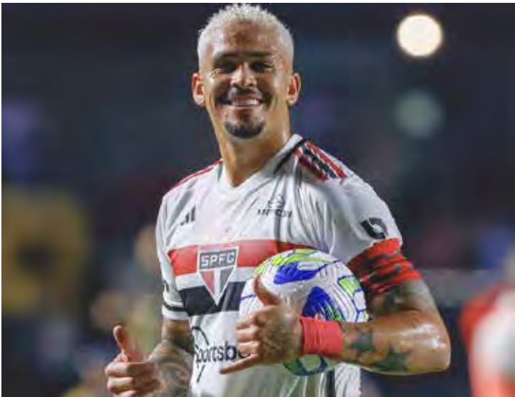
O atacante Luciano é uma das esperanças do São Paulo diante do São Bernardo, duelo que fecha a segunda rodada do Paulistão 2026

Rafael; Ferraresi, Arboleda e Alan Franco; Cédric Soares, Pablo Maia, Danielzinho, Marcos Antônio e Wendell; Ferreira (Tapia) e Luciano.