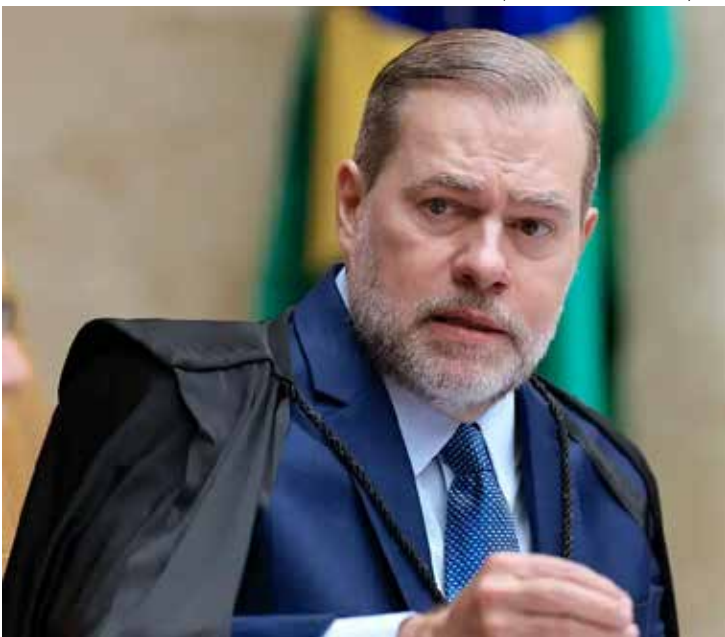
Ministro Dias Toffoli