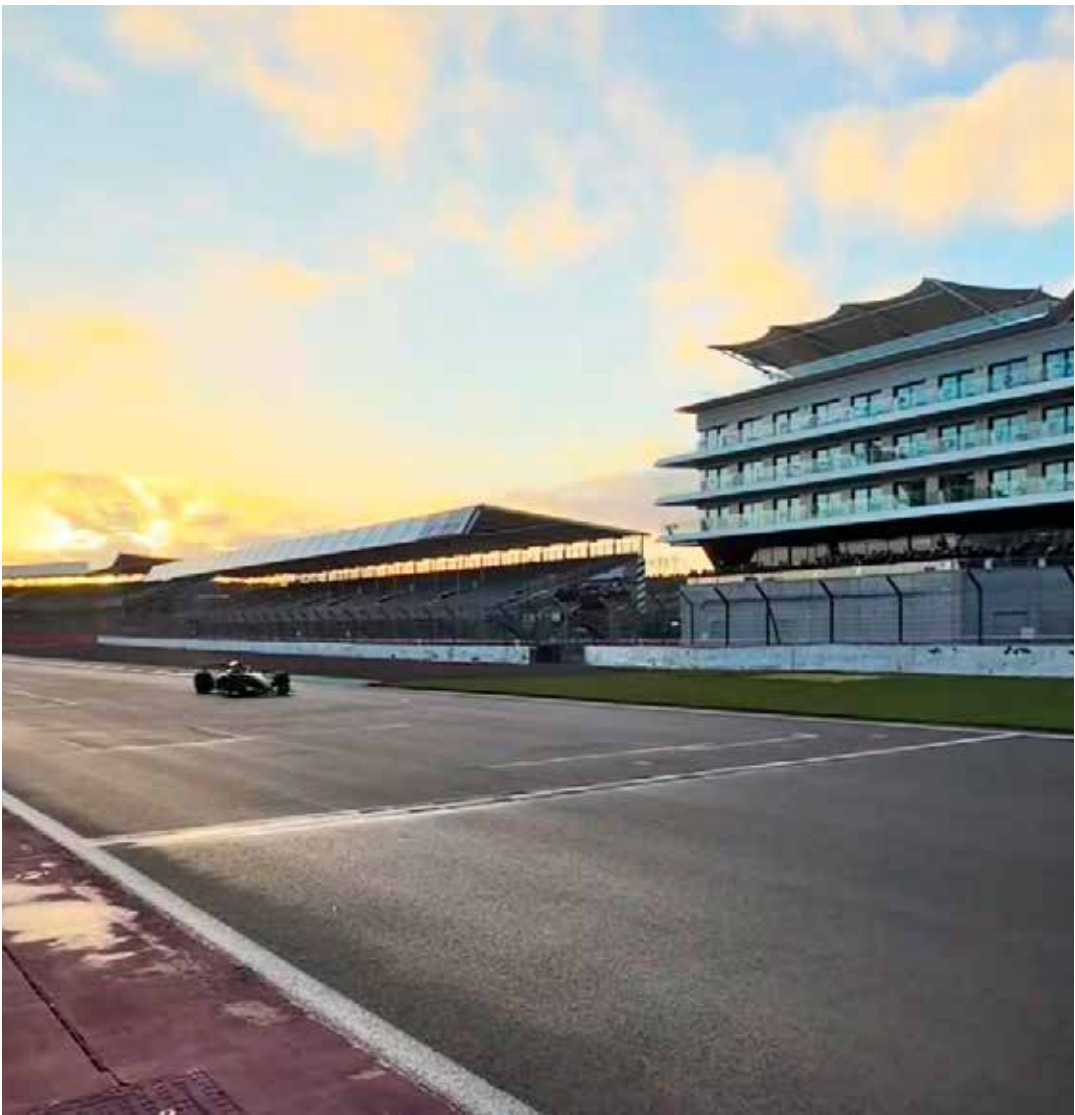
Cadillac foi para a pista de Silverstone para realizar o primeiro shakedown

Após este shakedown em Silverstone, a equipe seguirá para o teste coletivo de todas as equipes em Barcelona, agendado para o período de 26 a 30 de janeiro.