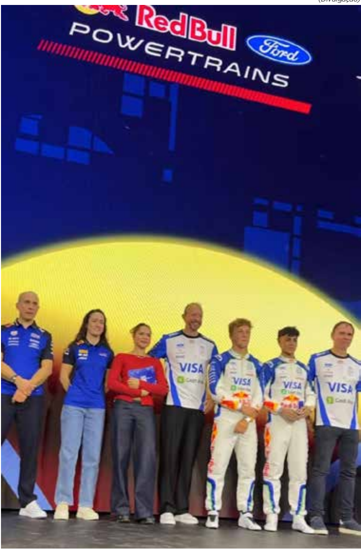
Evento em Detroit reuniu as duas equipes da Red Bull GmbH e destacou a parceria técnica com a Ford para produção dos motores