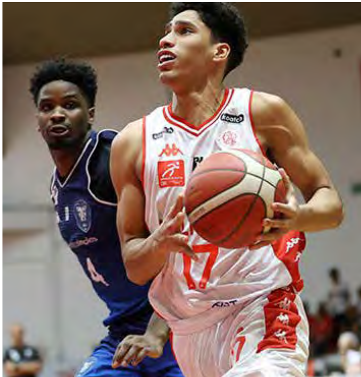
Rio Claro encara o Pinheiros neste sábado, às 11h, em São Paulo, em busca de recuperação no NBB 2025/2026

Após a partida interrompida diante do Paulistano por causa da forte chuva na capital paulista, o Conta Simples Rio Claro já virou a chave e concentra todas as atenções no próximo compromisso pelo NBB 2025/2026. O Leão enfrenta o Pinheiros neste sábado (17), às 11h, novamente em São Paulo, em duelo decisivo para tentar reagir no campeonato. O confronto contra o Paulistano, realizado no Ginásio Antônio Prado Júnior, foi suspenso ainda no segundo quarto, quando o time da casa venceu por 35 a 30, devido às goteiras que surgiram na quadra e colocaram em risco a integridade física dos atletas. A Liga Nacional de Basquete informou que divulgará nos próximos dias a nova data para a retomada do jogo. Enquanto aguarda a definição da LNB, o Rio Claro volta