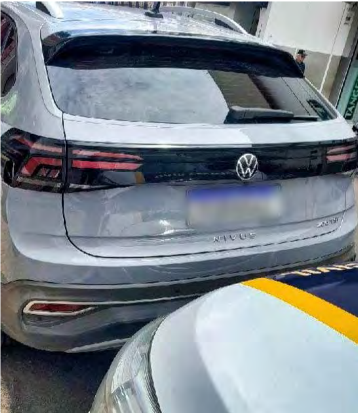
Veículo suspeito de clonagem foi localizado pela GCM na região central de Rio Claro e encaminhado para perícia

mático, evitando danos durante o procedimento de remoção. O automóvel foi encaminhado ao Plantão Policial, onde a autoridade determinou o registro da ocorrência por adulteração de veículo e a realização de perícia técnica. A Guarda Civil Municipal reforçou, por meio de nota, o compromisso com a segurança da população e o atendimento ao cidadão, colocando à disposição os canais 153 e 0800 771 1532 para denúncias e solicitações.