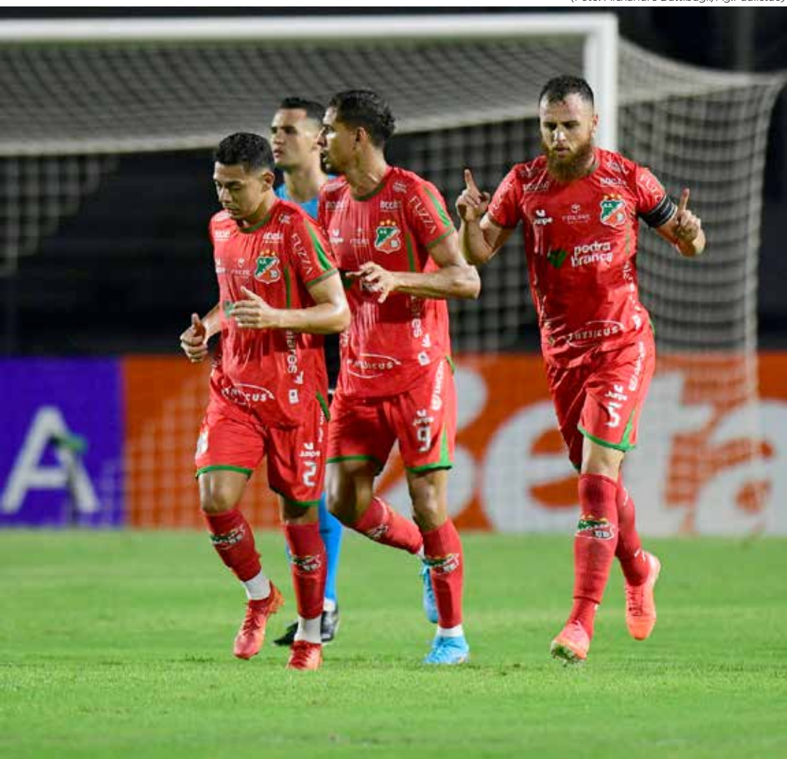
Velo Clube enfrenta a Portuguesa no Canindé em busca de manter a invencibilidade no Campeonato Paulista

Mesmo com o desgaste, o Velo Clube tenta manter o bom momento e consolidar sua posição entre os líderes do campeonato. Já a Portuguesa aposta no fator casa para buscar a reação e conquistar seus primeiros pontos no Paulistão.