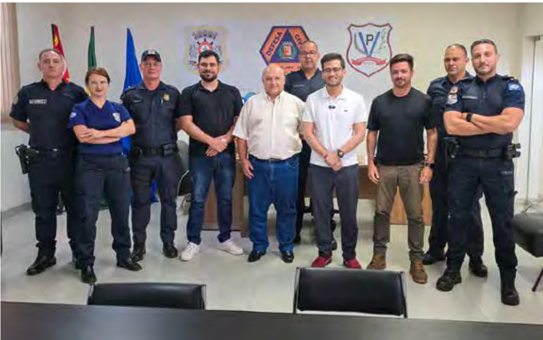
Deputado federal Kim Kataguiri durante visita à Base da Guarda Civil Municipal de Rio Claro, onde formalizou o repasse de recursos para aquisição de novas viaturas

lhamento preventivo em diferentes regiões da cidade. A Secretaria de Segurança destacou a importância da parceria com o Legislativo Federal para viabilizar investimentos estruturais, ressaltando que a renovação da frota é fundamental para garantir eficiência nas ações de proteção ao cidadão.