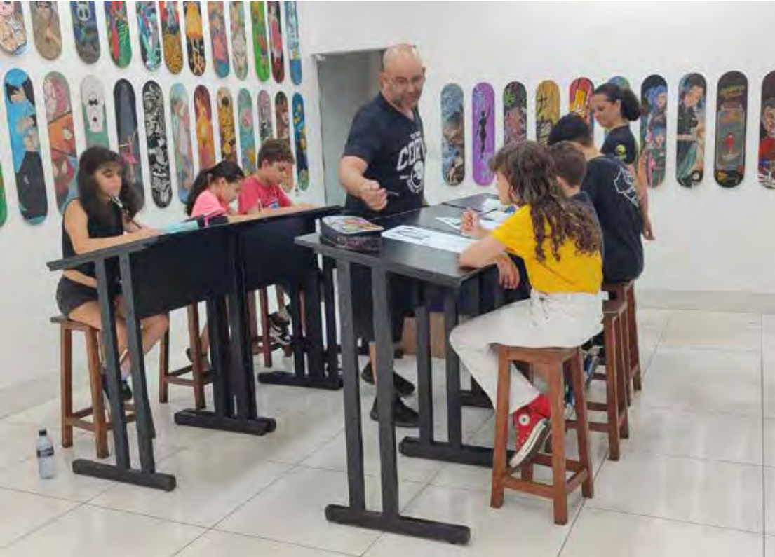
Oficina de desenho com o artista Corvo

Nacional do Fusca. Organizado pelo grupo Família Diferenciada, o evento reúne apaixonados por veículos clássicos, uma atração especial para toda a família.