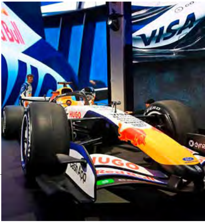
Imagens da nova pintura da Racing Bulls 2026 destacam as faixas azuis na lateral do carro em referência à parceria com a Ford

O bico amarelo e o logotipo da marca de bebidas energéticas no topo da capa do motor são idênticos aos da equipe principal. A Racing Bulls terá como pilotos o neozelandês Liam Lawson e o novato britânico Arvid Lindblad.