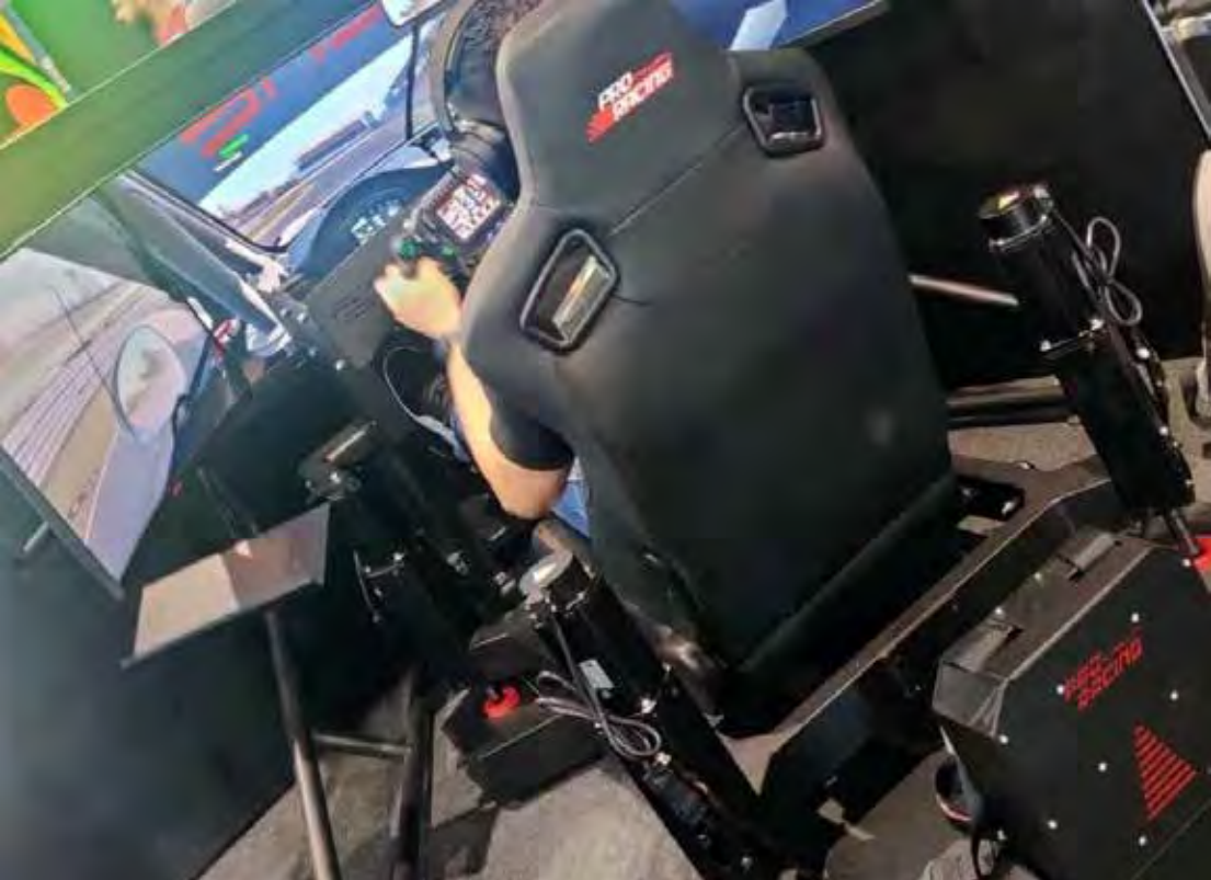
Simulador reproduz condições de corrida real, como se o piloto estivesse dentro do carro