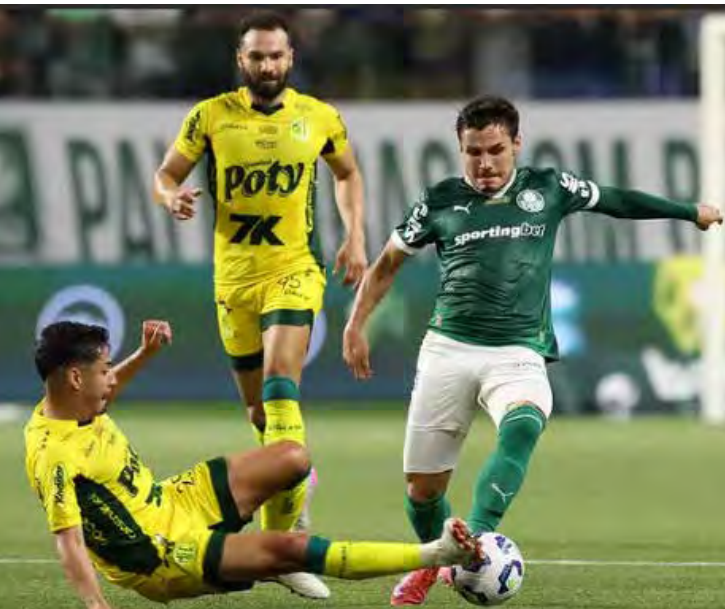
Palmeiras encara o Mirassol neste sábado, na Arena Barueri, defendendo 100% de aproveitamento no Paulistão 2026

Para o confronto, Abel Ferreira deve promover mudanças na equi-