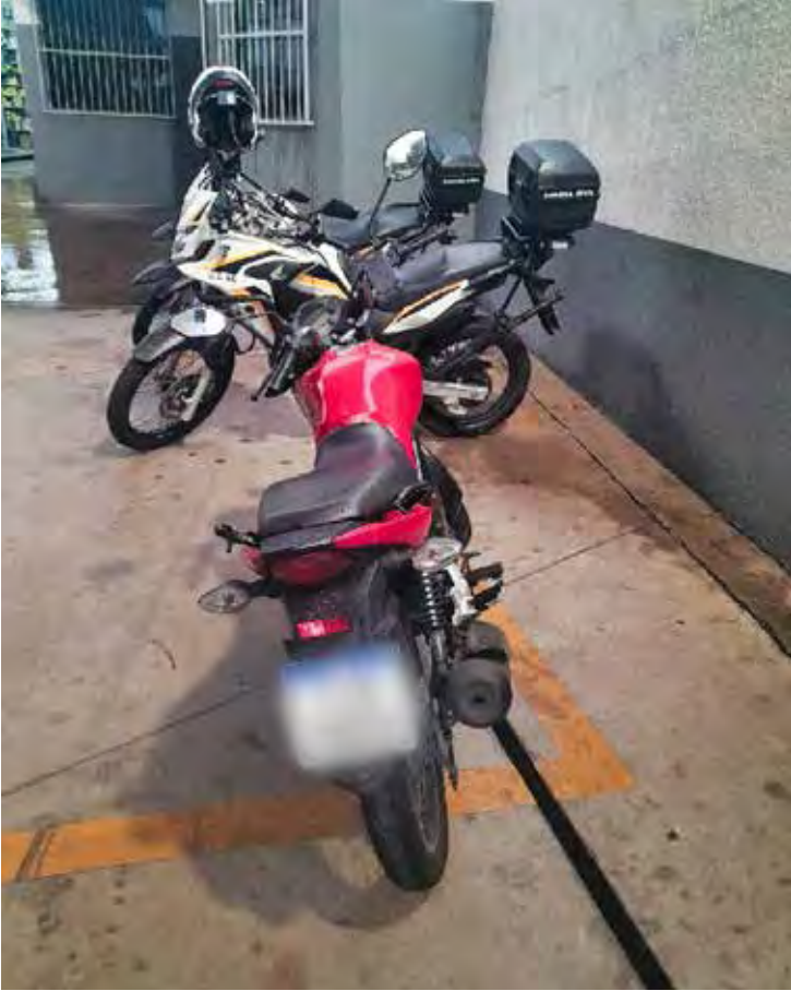
Motocicleta roubada em Limeira foi recuperada pela GCM durante patrulhamento na Vila Industrial, em Rio Claro

Na tarde do dia 16 de janeiro de 2026, por volta das 17h44, a equipe GAM da Guarda Civil Municipal recuperou uma motocicleta produto de roubo durante patrulhamento pelo bairro Vila Industrial, em Rio Claro. Segundo a corporação, a ação teve início após informações repassadas pelo sistema Muralha Paulista, que indicavam a passagem de uma motocicleta vermelha, roubada no município de Limeira, pela Avenida dos Estudantes, no cruzamento com a Rua 7, por volta das 17h25. O veículo estaria sendo conduzido por uma mulher. Em diligências pela região, a equipe localizou e abordou a motocicleta nas proximidades do Auto Posto Águas Claras. Após nova consulta no sistema, foi confirmado que o veículo ainda constava como produto de roubo. A condutora, de 28 anos, não possuía pendências com a Justiça. Questionada, ela informou ter adquirido a motocicleta por meio do Facebook, pagando o valor de R$ 4.500 via PIX. Segundo seu relato, o vendedor afirmou que o veículo