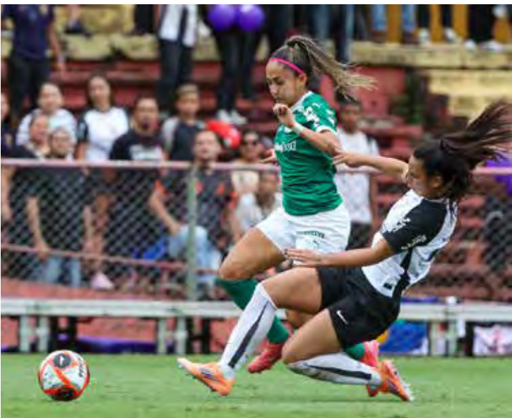
O jogo será na Arena Barueri, às 16 horas, com transmissão da TV Globo, Sportv e GETV, conforme tabela detalhada divulgada pela CBF