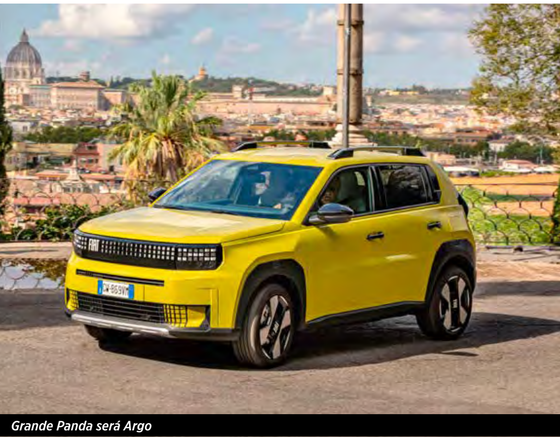
Grande Panda será Argo

Nada de Panda ou Grande Panda. A próxima geração do compacto da Fiat vai ser chamada simplesmente de novo Argo. O CEO global da Fiat, Olivier François, anunciou que o novo hatch compacto produzido em Betim (MG) será chamado Argo, baseado no modelo europeu Grande Panda. A nova geração da Strada, sucessora do veículo mais vendido no Brasil em 2025, também será comercializada na Europa.