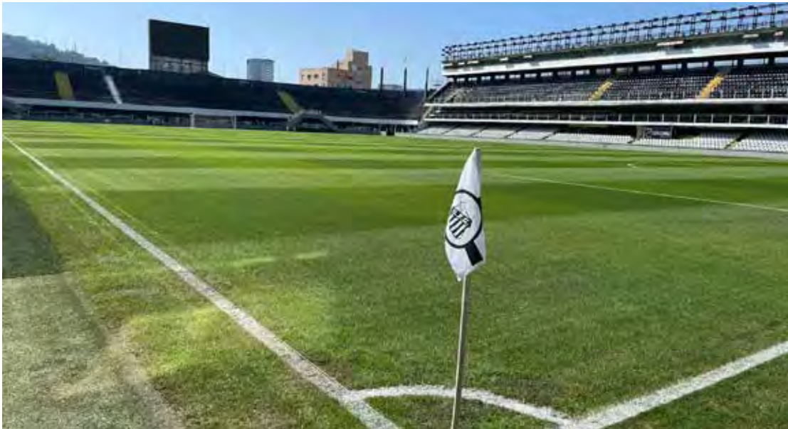
Rodada do Paulistão tem clássico, confrontos diretos e jogo decisivo do Velo Clube no Benitão

Ao final desta etapa, os oito melhores colocados avançam para o mata-mata, disputado em jogos únicos. Já os dois últimos na classificação geral serão rebaixados para a Série A-2 do Campeonato Paulista.