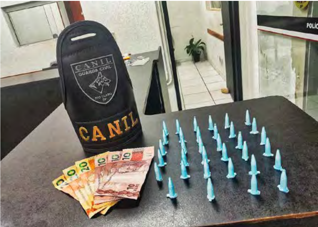
Equipe da ROMU apreendeu 34 microtubos de droga e prendeu suspeito durante patrulhamento no Jardim Santa Maria

Diante dos fatos, foi dada voz de prisão ao suspeito, que foi conduzido à Delegacia de Polícia. A autoridade policial ratificou a prisão em flagrante por tráfico de entorpecentes, mantendo o indivíduo à disposição da Justiça. A Guarda Civil Municipal reforça seu compromisso com a segurança da população e o combate ao tráfico de drogas, permanecendo disponível 24 horas por meio dos canais 153 ou 0800 771 1532.