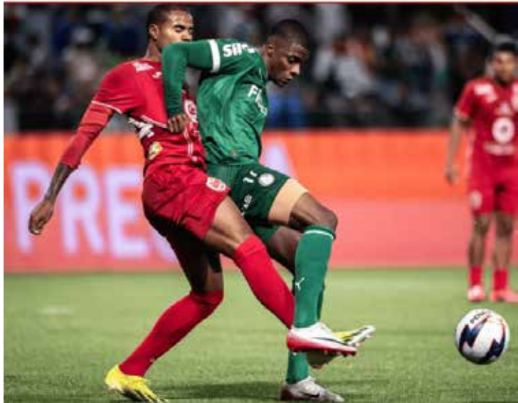
Ibrachina faz campanha histórica e enfrenta o São Paulo por vaga na final da Copinha

Do outro lado, o São Paulo foi o último classificado para as semifinais. Atual campeão da Copinha, o Tricolor garantiu a vaga ao vencer o Botafogo em um duelo marcado por belos gols