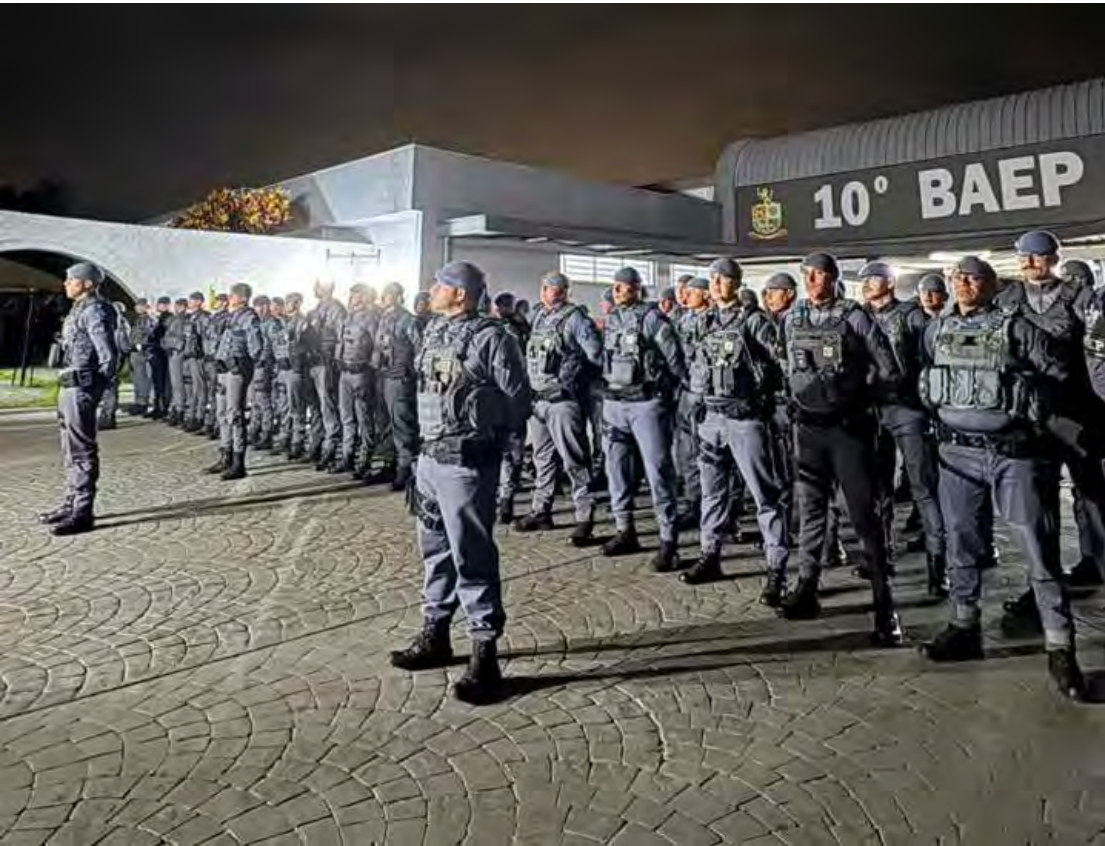
Operação Expurgo mobiliza Polícia Militar e Polícia Federal em cidades de São Paulo e Mato Grosso do Sul para combater esquema internacional de tráfico de drogas

levar a outros países”, explicou. As investigações também apontaram que parte dos integrantes do grupo possui ligação com uma facção criminosa paulista que atua dentro e fora dos presídios. Alguns dos envolvidos já estão presos por mandados de prisão preventiva e condenações anteriores por tráfico. Até o momento, três alvos foram localizados e presos. Durante as diligências, com apoio de cães farejadores, as equipes encontraram quatro armas — duas pistolas, um fuzil e um revólver — além de R$ 75 mil em dinheiro e três celulares. O material estava escondido em fundos falsos de móveis na casa do principal alvo da operação, em Santa Bárbara d’Oeste. O secretário de Segurança Pública, Osvaldo Nico Gonçalves, destacou a importância da ação integrada. “O tráfico de drogas fomenta