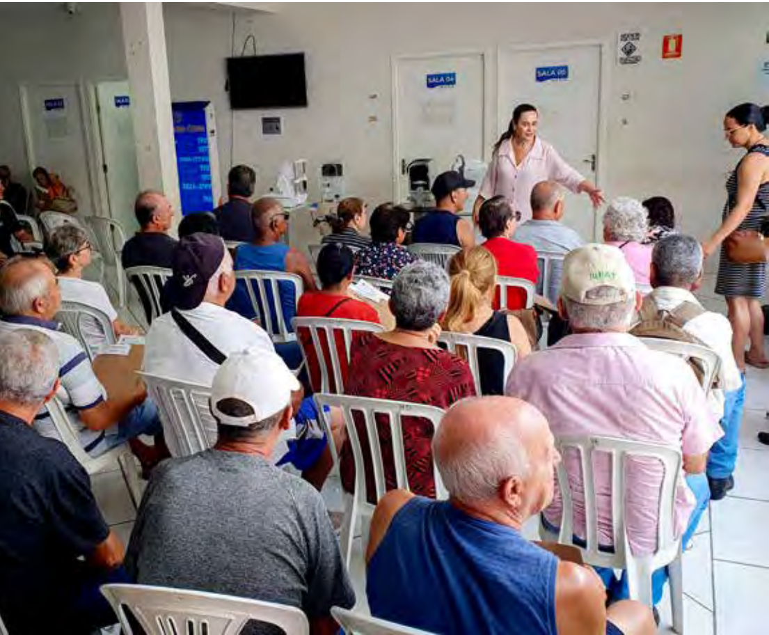
Mais de 400 pessoas passaram por avaliação pré-cirúrgica no sábado