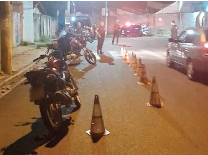
Equipes da Guarda Civil Municipal realizam bloqueio e fiscalização de veículos durante operação no Jardim Hipódromo, em Rio Claro

A Guarda Civil Municipal promoveu, na terça-feira (20), uma operação integrada de fiscalização no cruzamento da Rua M-5 com a Avenida M-31, no bairro Jardim Hipódromo. A ação teve como principal objetivo reforçar a segurança pública, coibir irregularidades no trânsito e ampliar a sensação de segurança para moradores e comerciantes da região. A ofensiva contou com atuação conjunta do Grupamento de Apoio com Motocicletas (GAM), da Base Móvel e do Pelotão Rural, reunindo equipes especializadas em um bloqueio estratégico montado em um dos pontos de maior fluxo do bairro. Durante a operação, os agentes fiscalizaram 35 veículos, sendo 30 motocicletas e cinco automóveis, além de realizarem a abordagem e a checagem de 20 pessoas por meio dos sistemas de segurança. Como resultado, foram lavrados 24 Autos de Infração de Trânsito (AITs) e cinco motocicletas foram recolhidas ao pátio, em razão de irregularidades administrativas e falhas relacionadas