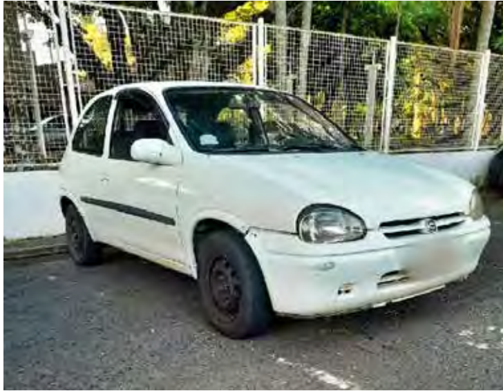
Ação da GCM com apoio do sistema Muralha Paulista permitiu identificar o veículo e efetuar a prisão do procurado pela Justiça

A combinação entre tecnologia de monitoramento avançado e o trabalho tático da Guarda Civil Municipal (GCM) resultou na captura de um criminoso procurado pela Justiça na tarde de terça-feira (20), no bairro Vila Cristina, em Rio Claro. A ação foi conduzida pelo Grupamento de Apoio Motorizado (GAM), com base em informações estratégicas fornecidas pelo sistema Muralha Paulista. De acordo com a corporação, o Gabinete de Gestão Integrada Municipal (GGIM) recebeu dados apontando que um veículo GM Chevrolet Corsa Wind, de cor branca, estaria sendo utilizado pelo suspeito. A partir do cerco digital, foi identificado um padrão de deslocamento: o automóvel passava diariamente, em horários semelhantes, pelo radar instalado na Avenida José Felício Castelvano.