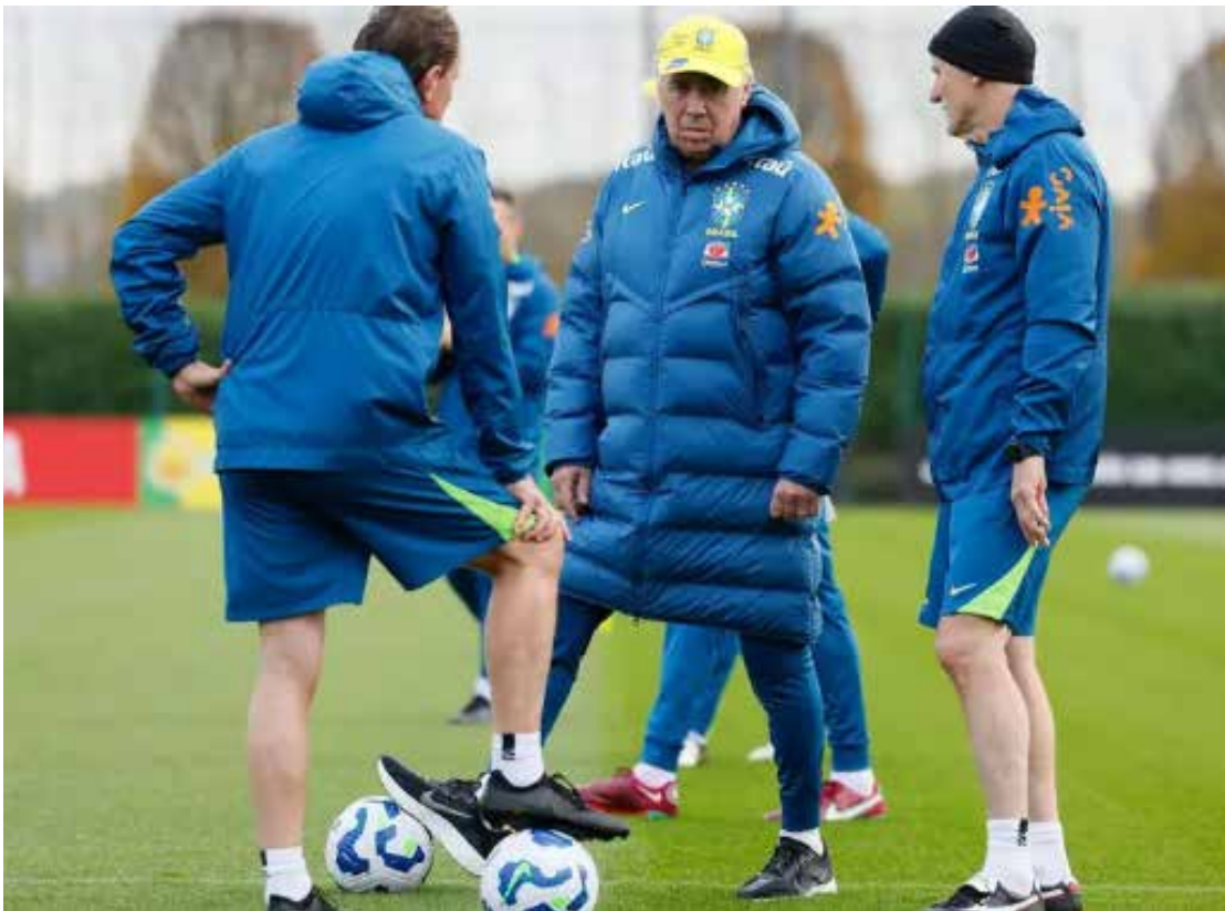
O período de monitoramento é compreendido entre 17 de janeiro e 2 de fevereiro

Em fevereiro, a agenda de visitas está programada para o acompanhamento das primeiras rodadas do Campeonato Brasileiro e a Supercopa Rei Superbet 2026, com a presença do técnico Carlo Ancelotti e demais integrantes do departamento de seleções.