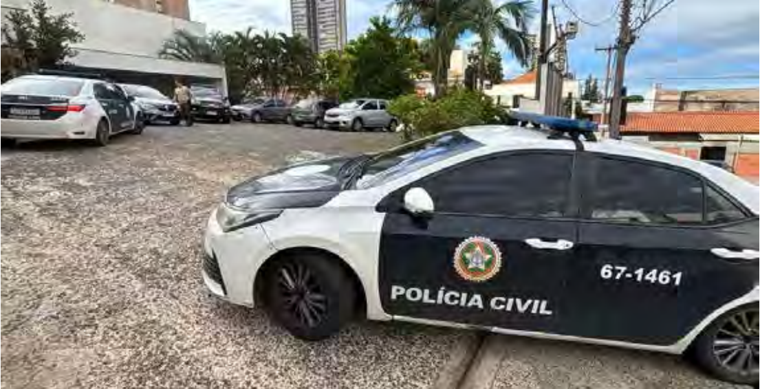
Viaturas do Deic e da Polícia Civil participaram da Operação Haras do Crime, que apura furto de petróleo e já resultou em prisões em São Paulo e outros estados

motores do Grupo de Atuação Especializada de Combate ao Crime Organizado (Gaeco), do Ministério Público do Rio de Janeiro. Ao todo, estão sendo cumpridos 13 mandados de prisão e 16 mandados de busca e apreensão nos estados do Rio de Janeiro, São Paulo, Minas Gerais, Espírito Santo, Paraná e Santa Catarina. As investigações seguem em andamento e novas prisões não estão descartadas. As forças de segurança destacam que a ação integrada entre os estados é fundamental para desarticular organizações criminosas que atuam de forma estruturada e com ramificações em diferentes regiões do país.