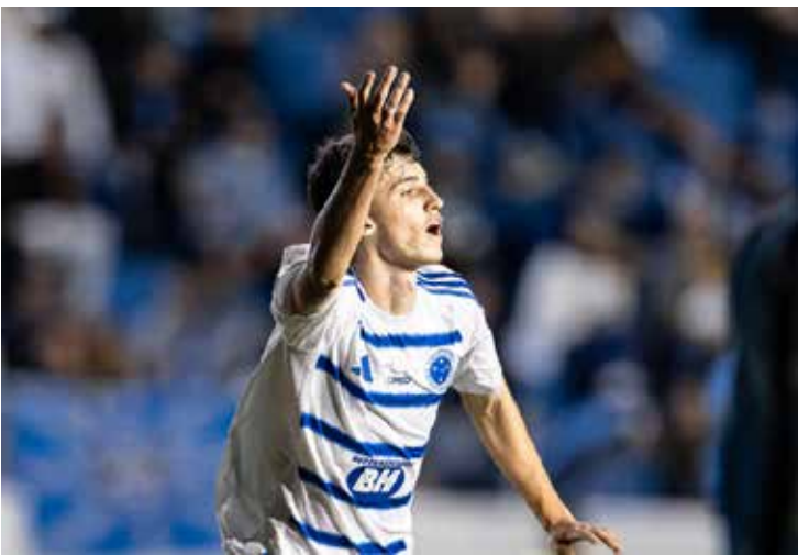
Garantido na decisão, o time mineiro agora aguarda para conhecer seu próximo adversário, que sairá do duelo entre São Paulo e Ibrachina. A final será disputada neste domingo (25), em São Paulo.