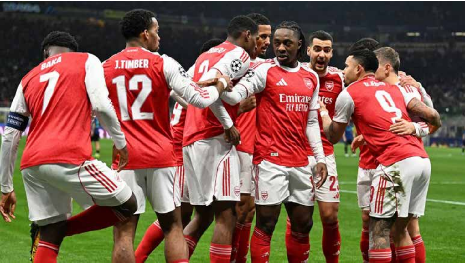
Gabriel Jesus faz dois, Arsenal chega à 7ª vitória consecutiva e de quebra se classifica para as Oitavas da Champions

pital enfrentar a quarta colocada, a Roma. O terceiro colocado, Napoli, vai a Turim enfrentar a Juventus, quinta colocada na tabela de classificação. Esta é uma rodada que poderá mexer bastante na tabela de classificação.