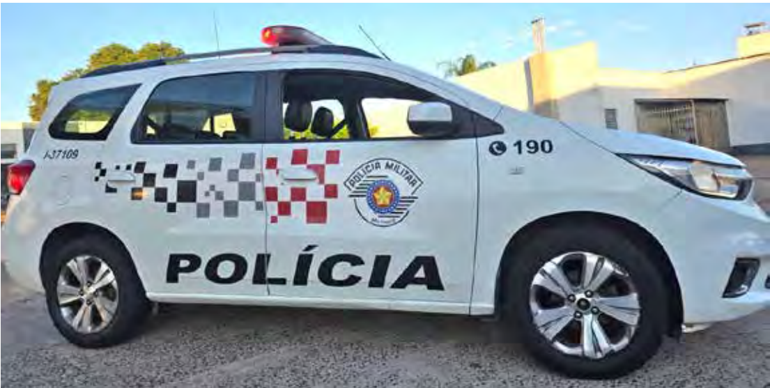
Viatura da Polícia Militar durante atendimento da ocorrência em Santa Gertrudes; caso foi registrado pela Polícia Civil

mentos. Durante o atendimento da ocorrência, a Polícia Militar acompanhou a situação da vítima junto às unidades de saúde e foi informada, inicialmente, sobre o estado grave da criança e, posteriormente, sobre a necessidade de um procedimento cirúrgico especializado. Após a cirurgia, a vítima permaneceu internada, sob observação médica. O caso foi apresentado à Polícia Civil, que registrou a ocorrência por omissão de cautela na guarda de animais e lesão corporal culposa. Após os trâmites legais, a responsável pelos cães foi ouvida e liberada.