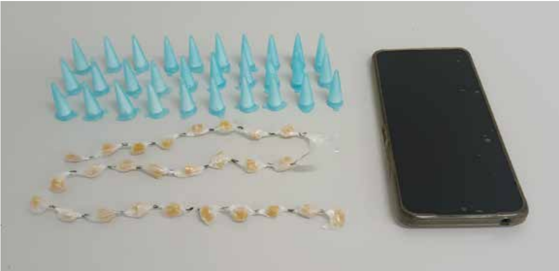
Material entorpecente e celular apreendidos pela Polícia Militar durante a ocorrência no bairro Vila Nova

mercialização, além de um aparelho celular. Questionado, um dos envolvidos assumiu ser o responsável por guardar a droga no local. Diante da constatação, o autor foi encaminhado ao plantão policial, onde a autoridade de polícia judiciária foi informada dos fatos. O material ilícito foi apreendido e, após os procedimentos legais, o indivíduo foi ouvido e liberado. A Polícia Militar reforça que ações baseadas em denúncias da população são fundamentais para o enfrentamento ao tráfico de drogas e para a manutenção da segurança nos bairros.