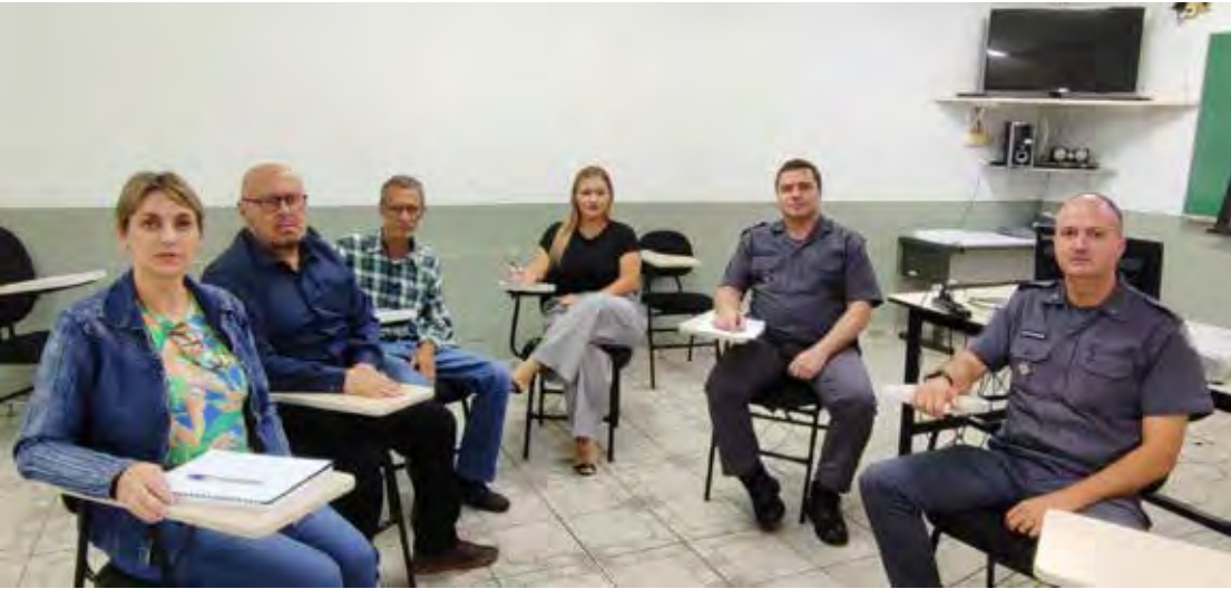
Reunião foi realizada nesta quinta-feira (22) para definir ação integrada