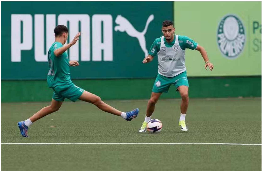
Elenco do Palmeiras se reapresenta na Academia de Futebol após goleada no Paulistão, já focado no clássico contra o São Paulo

Com o elenco em processo de reconstrução após o duro golpe, o Palmeiras tenta virar a página rapidamente e chegar mais fortalecido para o clássico de sábado, em um duelo que promete testar o poder de reação da equipe alviverde.