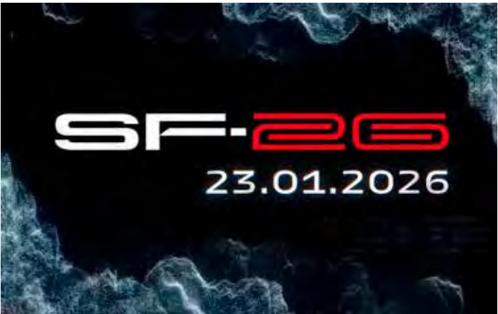
SF-26 será lançado nesta sexta-feira e reacende as expectativas da torcida