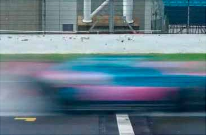
Vídeo mostra carro passando rapidamente na pista; lançamento visual é nesta sexta-feira