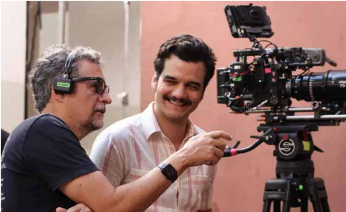
O diretor Kleber Mendonça Filho e o ator Wagner Moura durante as gravações do filme O Agente Secreto