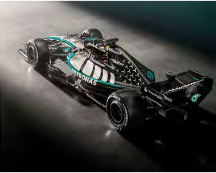
Mercedes mostrou imagens do novo carro e confirmou shakedown no mesmo dia