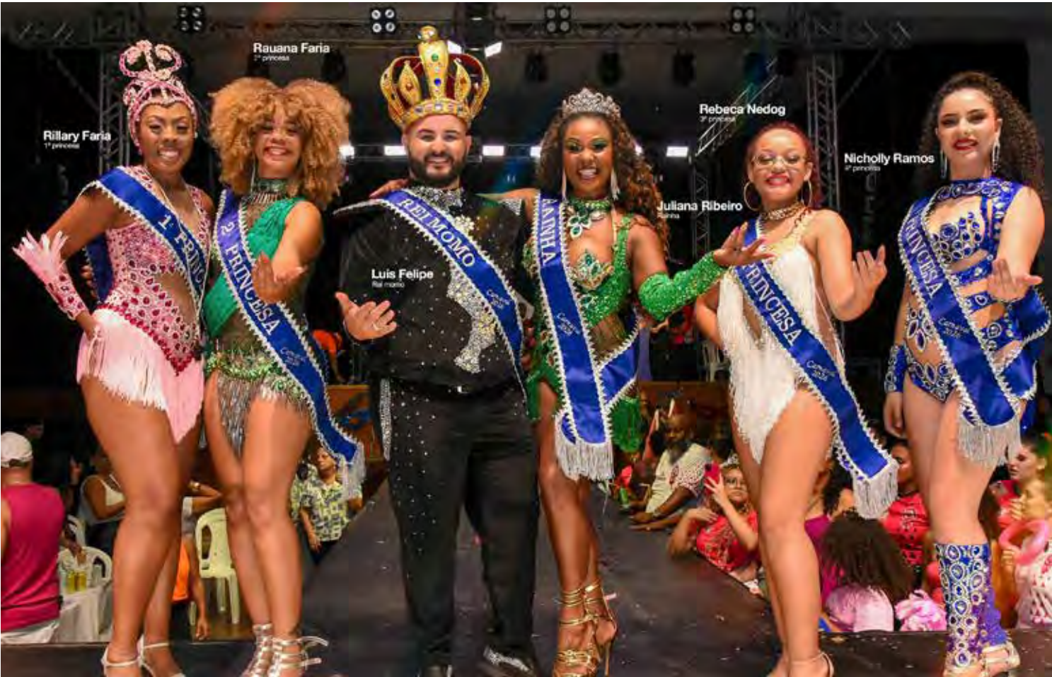
Corte momesca abrirá a programação na avenida nos dois dias de desfile

pelas apresentações das escolas Ritmo Alvinegro às 20h30, A Casamba às 22h05 e Voz do Morro às 23h40. Já no domingo (15), novamente a corte abre a noite, seguida pelos desfiles de Embaixadores do Samba às 20h30, Samuca às 22h05 e UVA às 23h40, cada uma levando à avenida enredos que exaltam a cultura, a ancestralidade e a força do samba. A prefeitura iniciou a venda de ingressos para o carnaval de Rio Claro no último dia 12. Os ingressos podem ser comprados no Mercadão Municipal, na Rua 8 com a Avenida Visconde, ou na Casa Amarela, localizada na Avenida 5 com Rua 1. O pagamento deve ser feito exclusivamente em dinheiro. Os ingressos custam a partir de R$ 10 por noite nas arquibancadas e a partir de R$ 50 nos camarotes. Os desfiles das escolas de samba de Rio Claro também