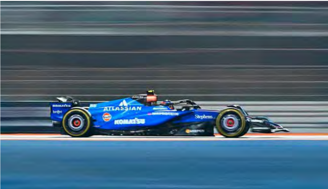
Williams anunciou que não participará dos primeiros testes coletivos de 2026, em Barcelona, na semana que vem