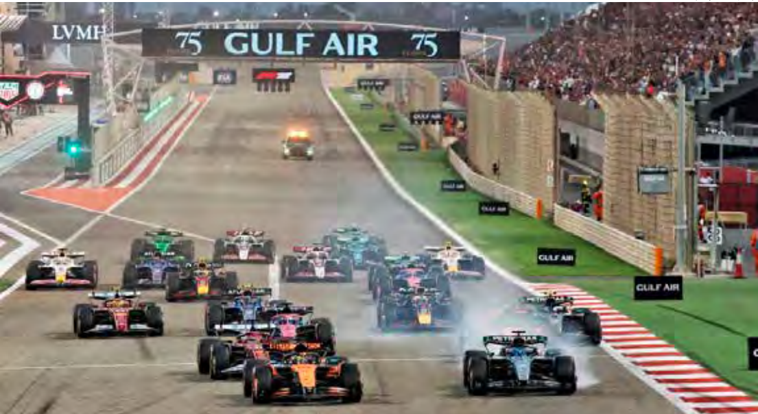
Mudança na cobertura gerou surpresa entre os fãs, que aguardavam a possibilidade de acompanhar as atividades nos dois testes de forma mais abrangente