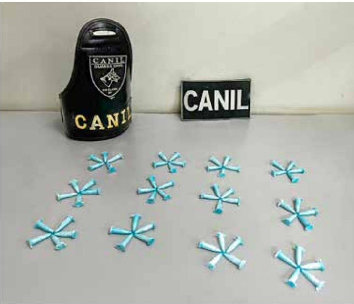
Equipe da ROMU–Canil da Guarda Civil Municipal apreenderam 60 microtubos contendo substância análoga à cocaína