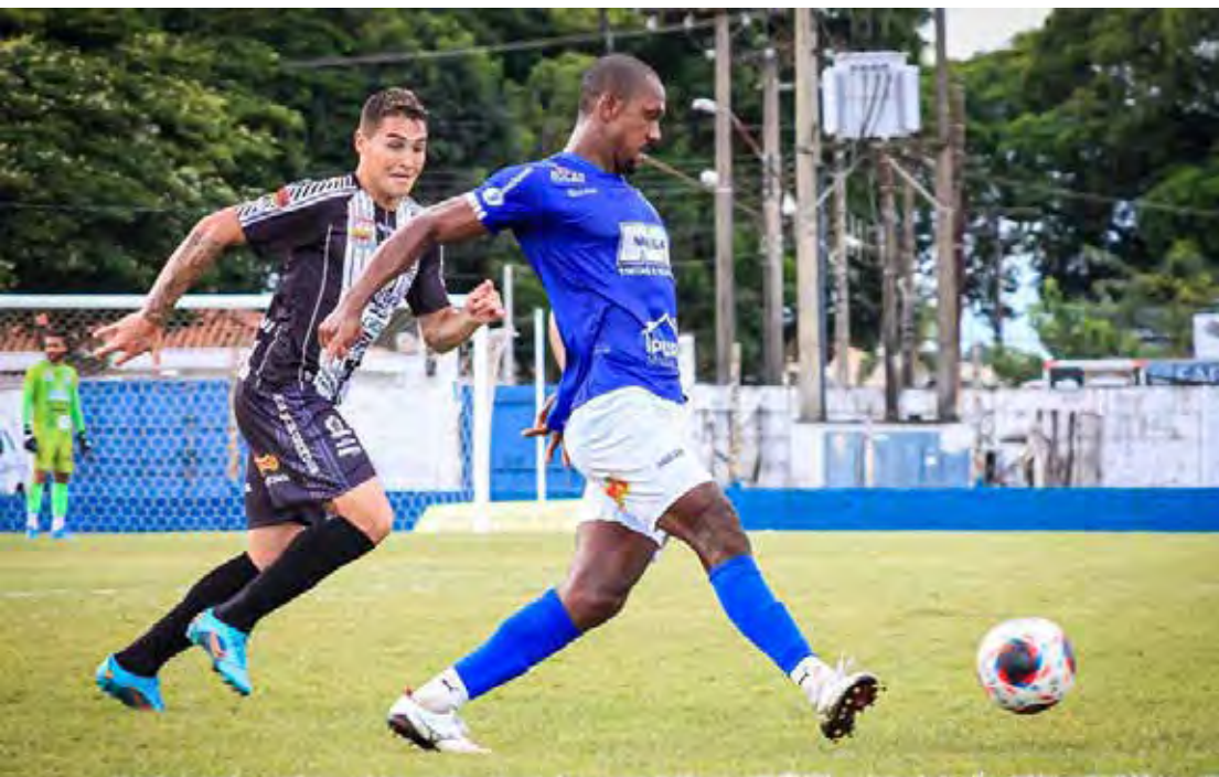
Elenco do Rio Claro FC inicia a Série A-3 neste sábado, fora de casa, apostando em renovação e novo comando técnico para a temporada 2026