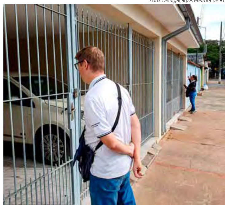
Equipes da prefeitura fazem vistorias nos imóveis e orientam a comunidade

Como o Aedes se reproduz em água parada, períodos como este, de chuvas mais intensas, são especialmente perigosos. A Vigilância Epidemiológica reforça a orientação para que todos fiquem atentos e eliminem os potenciais criadouros. Qualquer coisa que possa acumular água deve ser removida e quintais e terrenos devem ser mantidos limpos e em ordem o tempo todo.