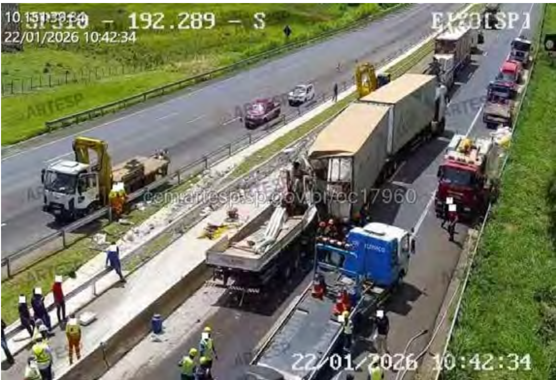
Equipes de resgate e da concessionária atuam no atendimento à ocorrência e na liberação da Rodovia Washington Luís após engavetamento em Corumbataí.

às vítimas, no controle do tráfego e na liberação da via. Em razão da gravidade da ocorrência, a pista no sentido capital precisou ser totalmente interditada por aproximadamente três horas. Durante o bloqueio, o congestionamento chegou a cerca de 10 quilômetros, causando reflexos significativos no tráfego da região. Segundo a concessionária, por volta das 11h40, o fluxo de veículos passou a ser liberado de forma parcial pelo acostamento. A Polícia Rodoviária segue acompanhando o caso, que será investigado para esclarecer as circunstâncias do acidente.