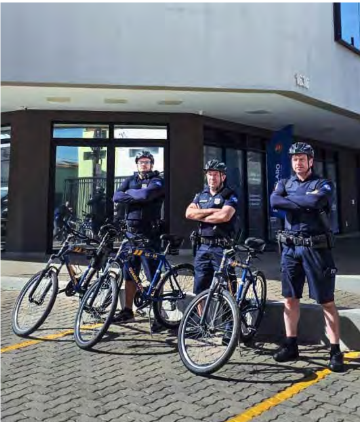
Agentes do Grupamento Ciclístico da GCM durante patrulhamento em área de grande circulação de pedestres em Rio Claro.

paços de convivência familiar; a região da Estação Saúde (Aeroclube), frequentada por praticantes de atividades físicas; e o Lago Azul, um dos principais cartões-postais do município. Mais do que vigilância, o projeto aposta no contato direto com o cidadão. A proximidade proporcionada pelas bicicletas facilita o diálogo, fortalece o vínculo de confiança e estimula a colaboração da comunidade com as forças de segurança, seja por meio de informações, orientações ou pedidos de apoio. “A nossa missão é estar onde o cidadão está, garantindo que o direito de ir e vir seja exercido com paz e liberdade em cada canto da cidade”, destaca a filosofia que norteia a atuação do grupamento. O resultado positivo observado desde a implantação reflete o compromisso da Guarda Civil Municipal com uma segurança pública moderna, humanizada e integrada ao cotidiano da população. O patrulhamento ciclístico se firma, assim, como exemplo de inovação aliada ao cuidado com as pessoas.