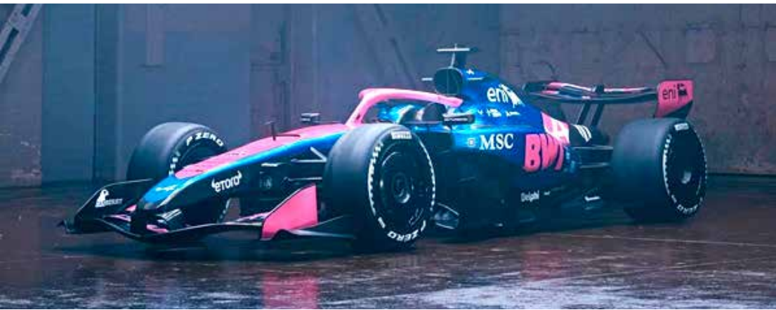
A526 vai estrear motores Mercedes na nova temporada