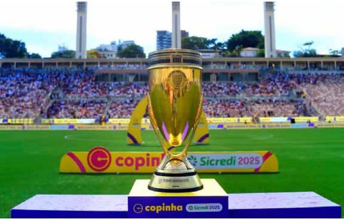
Paulistas e Mineiros lutam pelo título da Copinha 2026

Os mineiros vão em busca do bicampeonato - a primeira conquista foi em 2007, justamente contra o São Paulo. Já o Tricolor, atual campeão, jogará pelo sexto título. Das 128 equipes que iniciaram a competição, restaram as duas últimas para disputar o troféu. Desde a segunda fase, o mata-mata da Copinha é disputado em jogo único. Em caso de empate no tempo normal, a definição vai para os pênaltis.