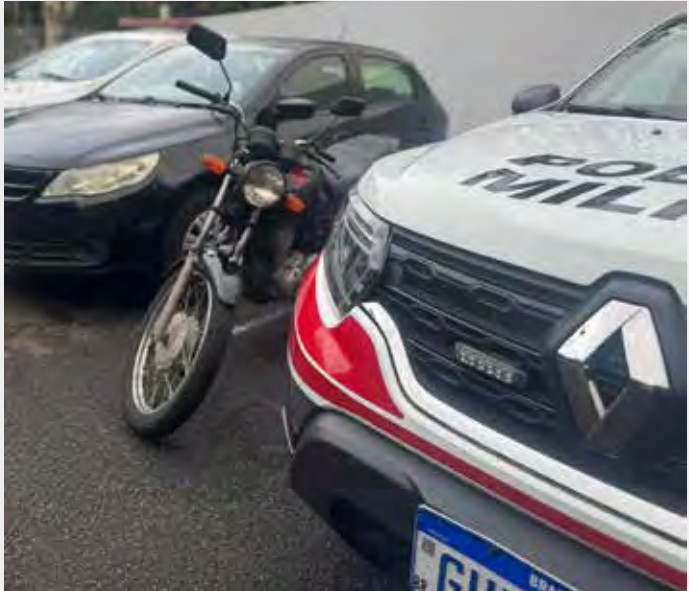
Motocicleta recuperada e materiais apreendidos durante a ação da Polícia Militar no bairro Parque Universitário

detido no local. Com o apoio de outras viaturas, as diligências tiveram sequência até um imóvel apontado durante a apuração. No endereço, os policiais obtiveram autorização para entrada. Um indivíduo conseguiu fugir do local, mas, durante a vistoria, foi localizada a motocicleta produto de roubo, além de outros objetos relacionados ao crime. Segundo a Polícia Militar, o suspeito detido possui antecedentes criminais por roubo, conforme o artigo 157 do Código Penal. A vítima compareceu ao plantão policial, onde realizou o reconhecimento, e a prisão foi ratificada em flagrante pela autoridade de polícia judiciária. A motocicleta foi devolvida ao proprietário, enquanto os demais materiais foram apreendidos e encaminhados à Polícia Civil para investigação.