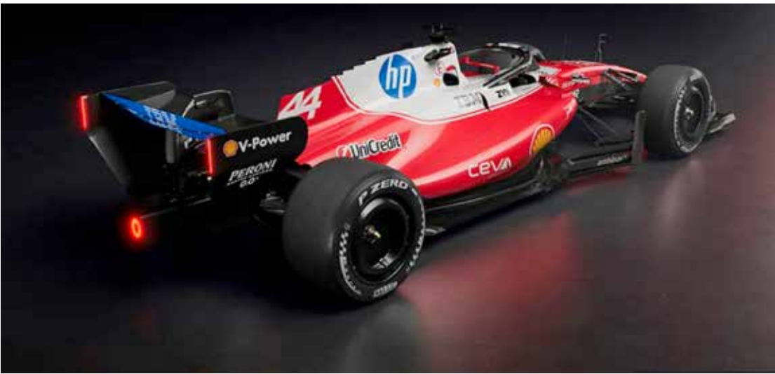
O novíssimo Ferrari SF-26 de Fórmula 1 para 2026 foi revelado ao público