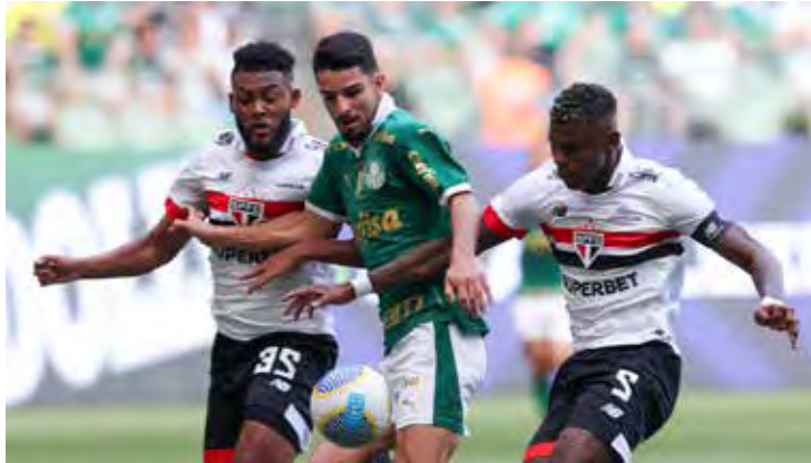
Palmeiras e São Paulo voltam a se enfrentar neste sábado, na Arena Crefisa Barueri, em mais um Choque-Rei pelo Campeonato Paulista de 2026

A Arena Crefisa Barueri será palco de mais um capítulo do tradicional Choque-Rei neste sábado (24). Palmeiras e São Paulo se enfrentam às 18h30 (de Brasília), em Barueri, na região metropolitana da capital paulista, em partida válida pela sequência do Campeonato Paulista de 2026. Do lado alviverde, o técnico Abel Ferreira recebeu boas notícias ao longo da semana. Recuperado de um trauma no ombro esquerdo, o meio-campista Andreas Pereira voltou a treinar normalmente com o elenco e deve retornar ao time titular. Outro que está novamente à disposição é Felipe Anderson, que também participou das atividades e aparece como opção importante para o setor ofensivo. A principal dúvida do Palmeiras gira em torno de Vitor Roque. O atacante realizou trabalhos espe-